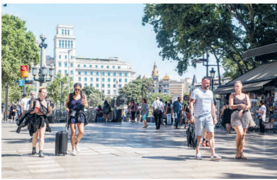
Вот и Барселона дождалась снятия ограничений.

СЕРГЕЙ ПАНКРАТОВ СПЕЦКОР «ТРУДА» ВАЛЕНСИЯ