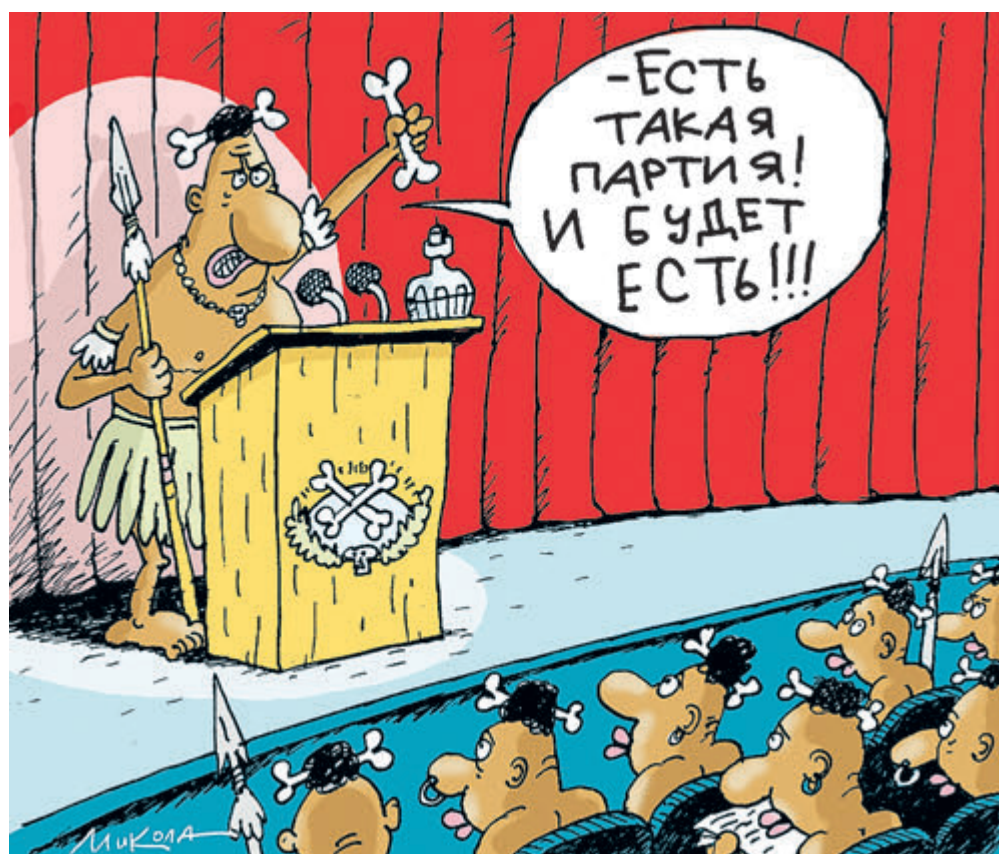
Иллюстрация: НИКОЛАЙ ВОРОБЬЕВ / САТ ГОУБВАЙК.РУ

На недавнем съезде партии «Единая Россия» под аплодисменты было принято решение выделить российским регионам дополнительные 30 млрд рублей на ремонт дорог. Как заявлено на сайте «ЕР», средства поступят в Росавтодор, а далее деньги получат Крым, Приморский край, Сахалинская, Московская, Свердловская области и другие регионы.