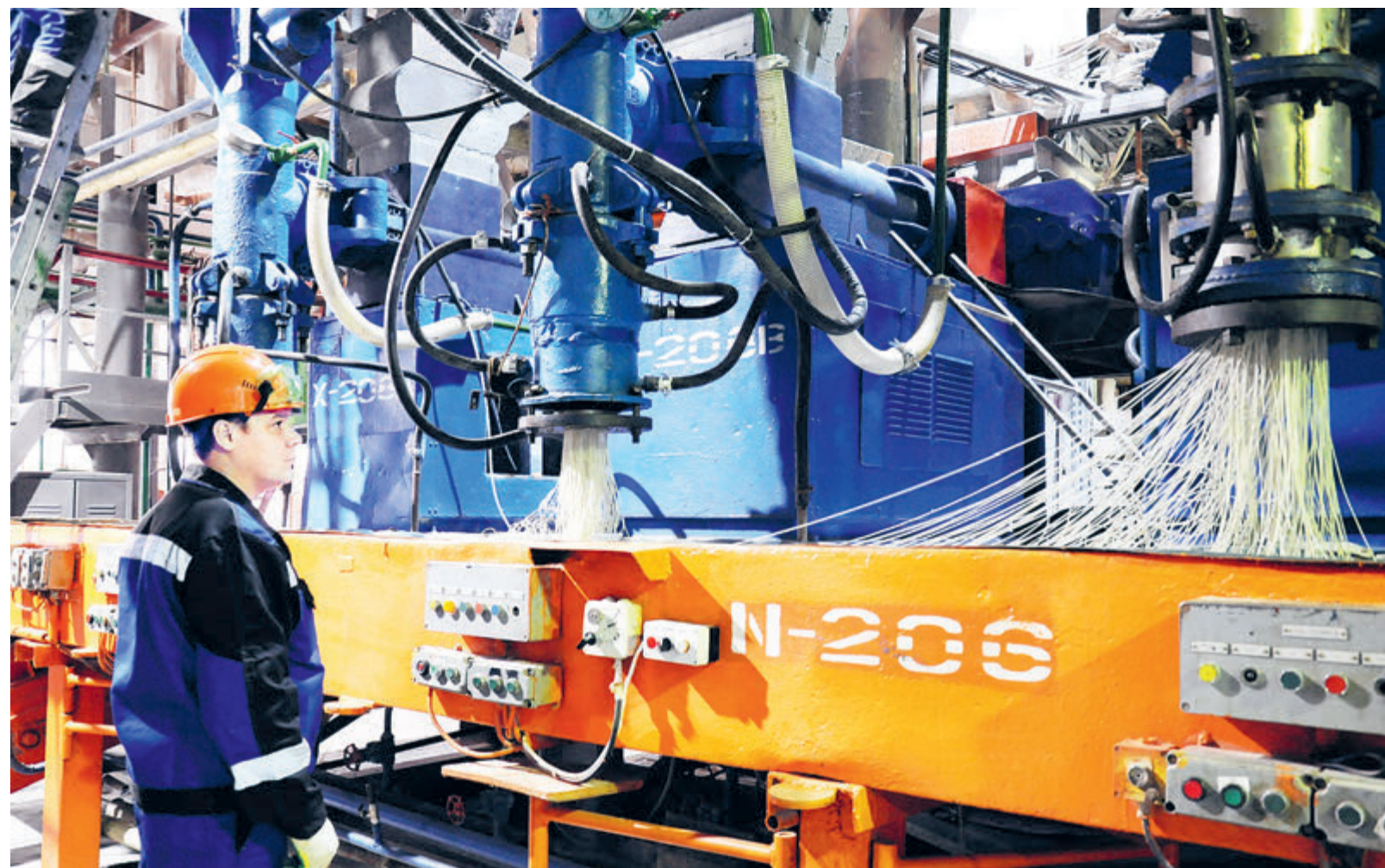
Специалисты ООО «РН-Кат» (входит в «Роснефть») разработали технологию производства катализатора гидрокрекинга, которая увеличит выпуск высококачественных моторных топлив Евро-5 из вакуумного газойля.

Крупнейшая нефтяная компания страны «Роснефть» уде-