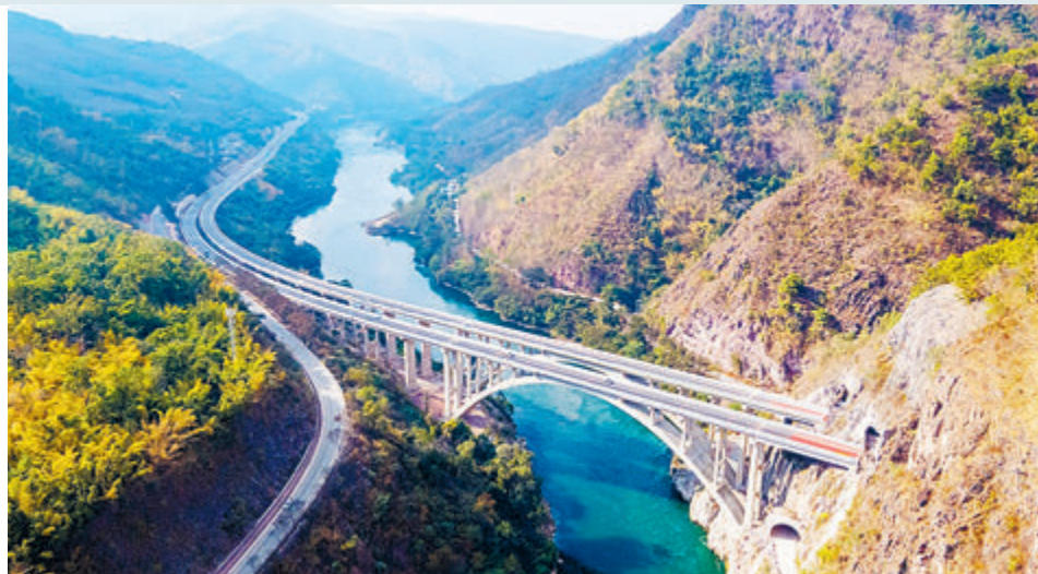
Скоростная магистраль Сылань в провинции Юньнань проходит через реку Ланьцанцзян.

«Большие коммерческие банки увеличили объем ссуд микропредприятиям на более 30%», продолжая поддерживать мелкие и средние предприятия. Вместе с этим «улучшаются условия жизни людей, продолжается увеличение доходов жителей с помощью разных методов». «Финансовые субсидии на душу населения для базового