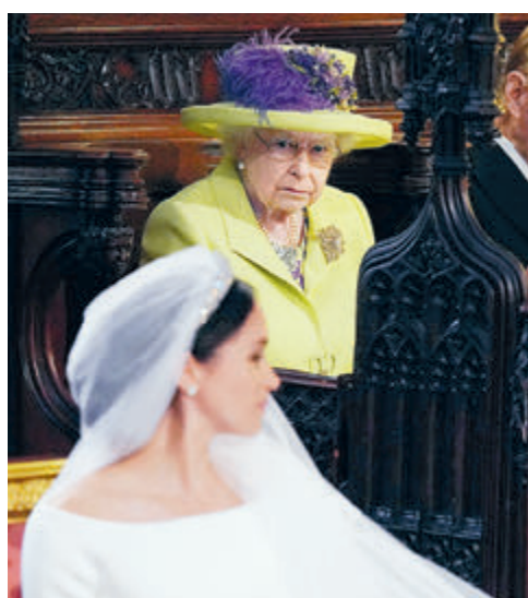
Не сошлись характерами...

Скандальное телеинтервью было записано на вилле Меган и Гарри на берегу Тихого океана, кулленной за 14 млн маминых денег. Двухчасовой разговор был посвящен нелегкой судьбе эмансипированной принцессы-феминистки с афроамериканскими корнями в консервативной семейке, которая не приняла ее вольного нрава и пыталась навязать паре ужасные английские правила поведения, да еще наказав лишением их новорожденного сына Арчи наследного титула.