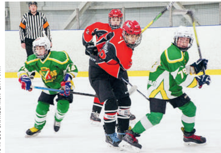
Игроки-чемпионы «Светона» бьются за победу.