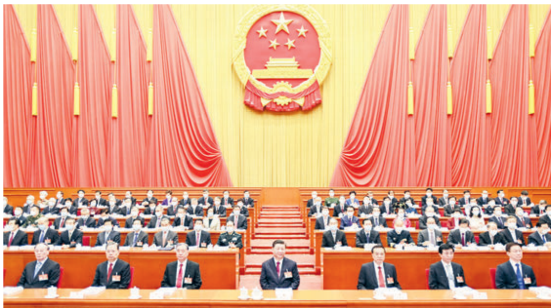
В Пекине проходит 4-я сессия ВСНП 13-го созыва.

Каким будет Китай в период осуществления программы 14-й пятилетки?