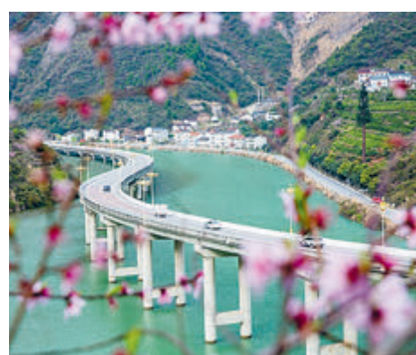
При строительстве автомагистрали Гуфу в уезде Синшань провинции Хубэй особое внимание уделялось защите окружающей среды: не уничтожалась лес, не разрушались горы. Построена водная экологическая магистраль протяженностью 4,2 км.

медицинского страхования и основных услуг общественного здравоохранения будут увеличены на 30 юаней и 5 юаней соответственно», чтобы продолжать улучшать жизнь людей и повышать их благосостояние. Рост в «более 6%» обеспечивает более устойчивую основу для внутреннего спроса. Генеральный секретарь ЦК КПК Си Цзиньпин подчеркнул, что необходимо использовать метод рубежного мышления, готовиться к худшему, но стремиться к лучшему. Рост в «более 6%» выявляет такое рубежное мышление, подготовившись к худшему результату, будет легче достичь более высокого показателя.