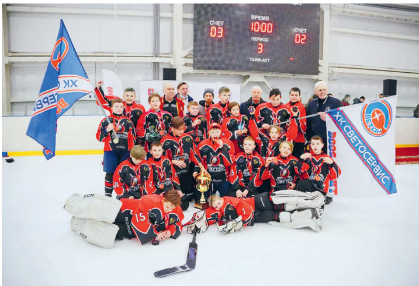
Команда «Светон» в возрастной группе 2008–2009 г. р. выиграла региональный этап всероссийского турнира «Золотая шайба».

– Наша команда буквально вырвала победу по буллитам и получила заветный кубок. Это была очень напряженная игра, эмоции били через край, но парни понимали, что нет