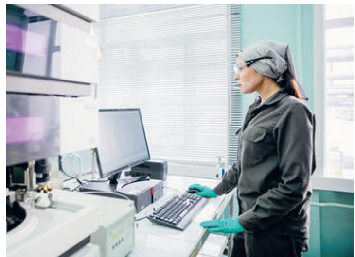
Ангарский завод полимеров НК «Роснефть» производит инновационную продукцию.