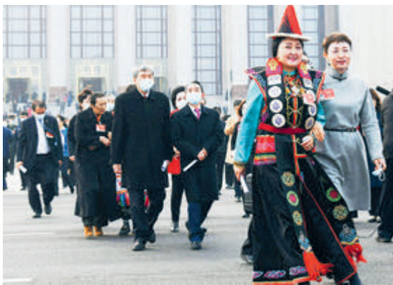
Депутаты НПКС выходят из Дома народных собраний.

11 марта закрылась 4-я сессия ВСНП 13-го созыва, были приняты программа 14-й пятилетки и стратегия развития на период до 2035 года. Таким образом, Китай утвердил дорожную карту развития страны на последующие 5–15 лет. Это план нового пути Китая, а также программа совместных действий китайского народа.