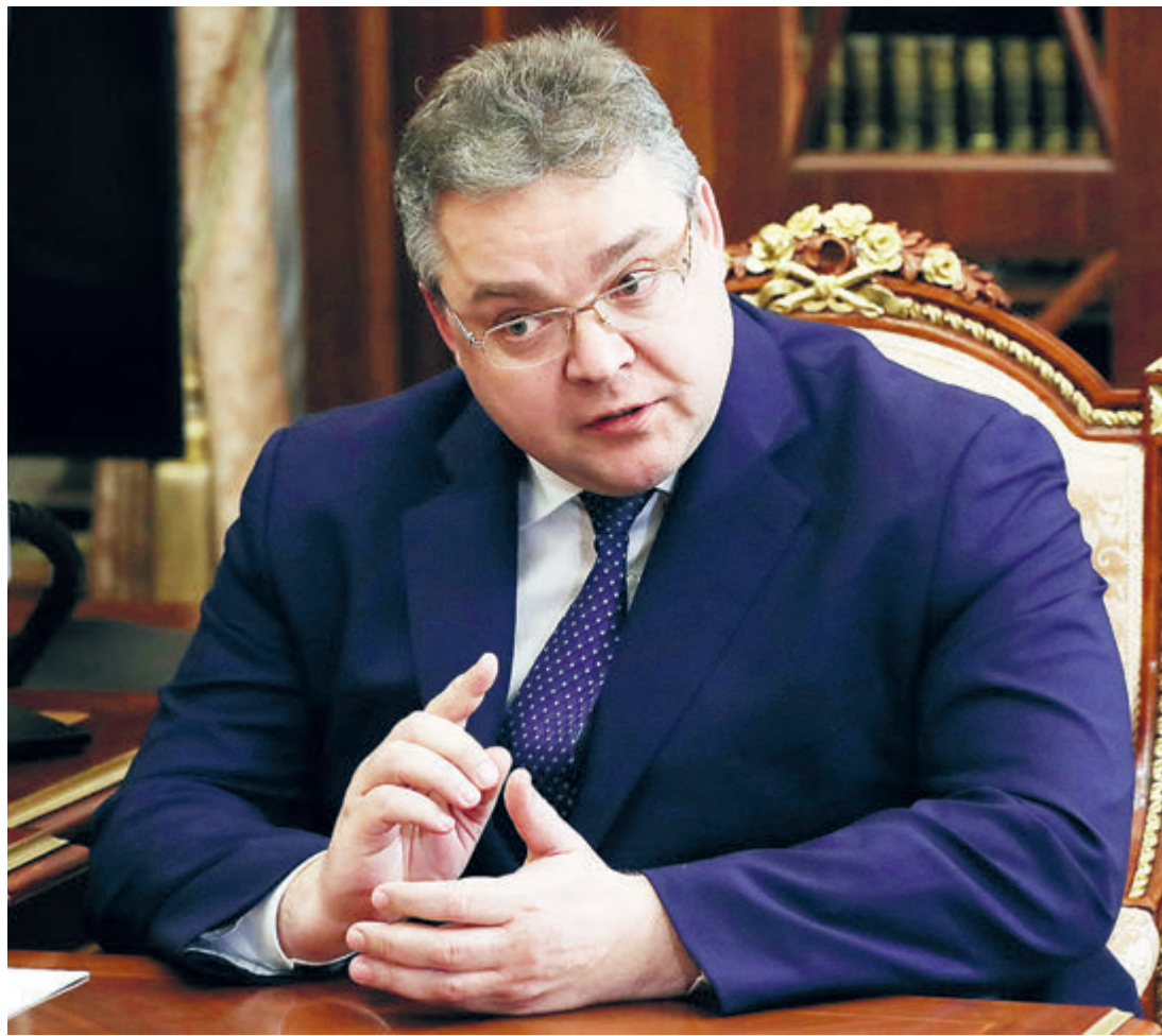
Ставропольский губернатор Владимир Владимиров совершил нерядовой поступок — разом уволил всех своих министров.

Увы, на власти других российских регионов это тоже не распространяется: тестирование на «детекторе лжи» за последние 10 лет не только не стало привычным, но и сворачивается даже в столице. Ана федеральном уровне, в Госдуме, идет проталкивание законопроекта, который освобождает чиновников, судей, прокуроров, военнослужащих и другие категории граждан от