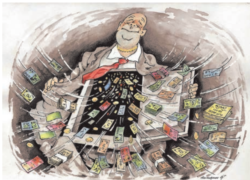
ИЛЛУСТРАЦИЯ САРТОНБАКИ УСТАИНСОЛОВА АШМАРИН