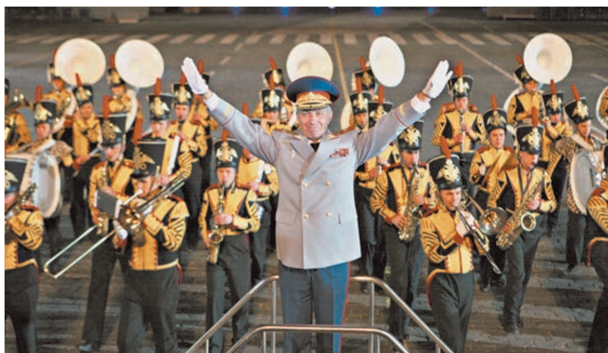
ФОТО ЦЕНТРАЛЬНОГО ВОЕННОГО ОРКЕСТРА МИНОБОРОНЫ