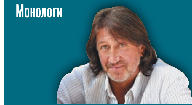
ОЛЕГ МИТЯЕВ БАРД

Талантливая, непредсказуемая, сложная... Но куда теперь мы без нее? С днем рождения, Земфира! ▣