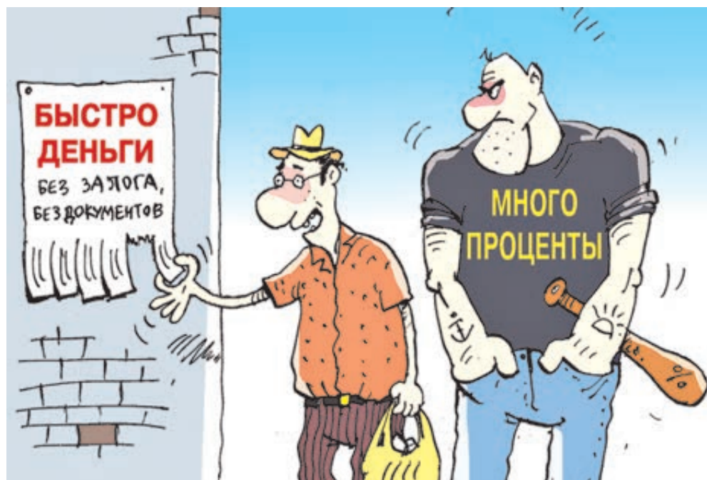
ИЛЛЮСТРАЦИЯ СЕРГЕЯ КОКАРЕВА/CARTOONBANK.RU

То есть в данном конкретном случае разбоя как бы и не было: сотрудники коллекторского агент-