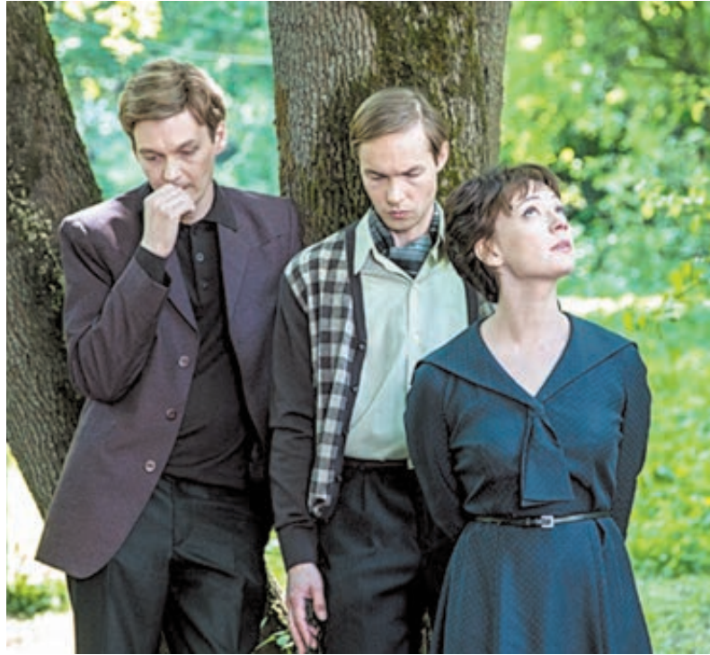
Кадр из сериала «Таинственная страсть».

– Не поступаю таких предложений, которые бы выдержали сравнение с фильмами Абрашитова, Тодоровского, Худойназарова, Александра Прошкина, у которых я в свое время начала сниматься. Сейчас в кино все делается быстро, ушла в прошлое скрупулезная разработка образов, сюжетов. Какое-то время мне по инерции продолжали