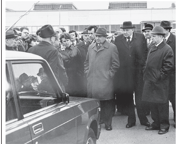
Михаил Горбачев на ВАЗе. Апрель, 1986 год.

Итак, в начале было слово. Точнее, много новых, энергично бречащих слов: ускорение, гласность, демократизация, социалистическое самоуправление, новое мышление, интенсификация, повышение эффективности и качества, техническое перевооружение... Извлеченные из пыльных газетных подшивков,