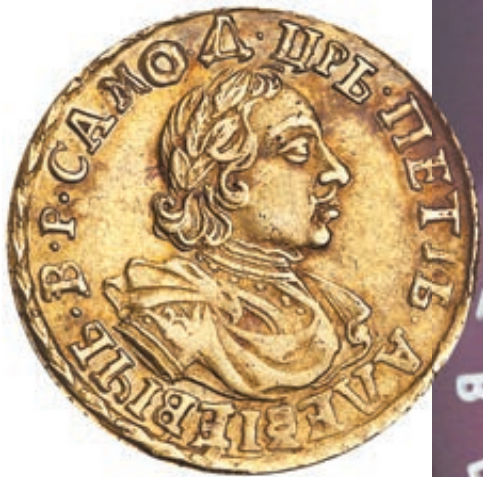
• ТРУДЫ •

В Международном нумизматическом клубе в Москве представлена коллекция старинных монет Вагита Алекперова