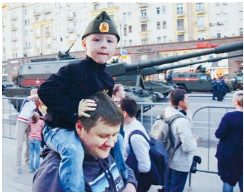
ФОТО: ИЗ ОПЫТА РАБОТЫ ИСТОЧНИКОВ

Как такое возможно? 31 декабря – это же сказка, обещание чуда. А за Днем Победы тянется шлейф из десятков миллионов погибших и пропавших без вести, загубленных судеб и страшных последствий во всех сферах жизни. А так и возможно, что го-