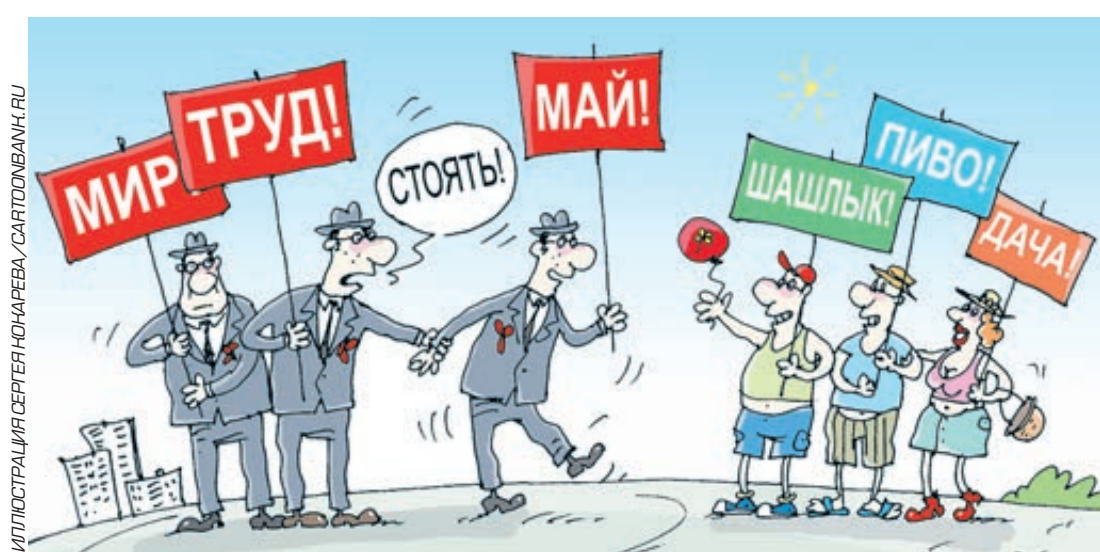
ИЛЛУСТРАЦИЯ СЕРГЕЯ ЮНАКОВА, CARTOONAVIA.RU

В разных уголках страны наблюдалось одно и то же: парки превратились в стихийные площадки нескончаемого шашлычного фестиваля. Редкий горожанин в эти дни заходил в лесопарковую зону без мешка с углем и призывно звякающих пакетов. Из-за дыма многочисленных костров и мангалов в вечернее время заметно снижалась видимость на ближайших к паркам дорогах. Судя по сообщениям и фотолентам в Сети, такие карти-