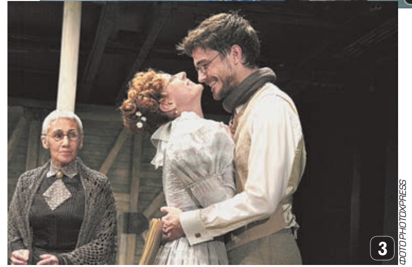
Кадры из фильмов: 1 «Стиляги», 2 «Анна Каренина». 3 Сцена из спектакля «Дьявол».