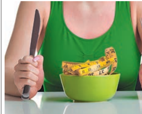
ФОТО: ИСТОРИИ ИСТОРИИ

Решив похудеть, нужно не полениться и первое время вместе с диетологом просчитать энергозатраты, чтобы питание было сбалансированным. Так, для мужчин и женщин после 40 лет энергетическая ценность дневного рациона не должна превышать 1500 и 1300 килокалорий соответственно. Разница в цифрах объясняется тем, что у мужчин обмен веществ активнее, чем у женщин, примерно на 7–10%. С каждым десятилетием активность обмена веществ снижается на 5–10%. Вот почему с возрастом, чтобы не набирать лишние килограммы, нужно вообще меньше есть.