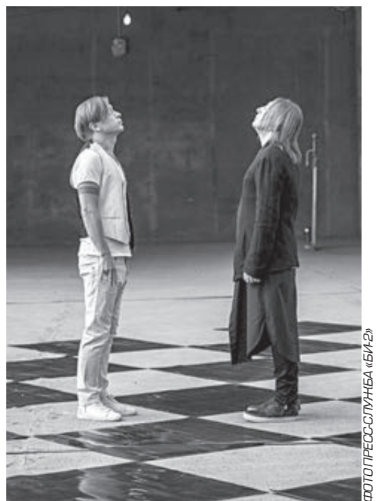
Надр из клипа «Компромисс».

Ш.: Это не обязательно только Белоруссия, Украина, Казахстан... Амери-