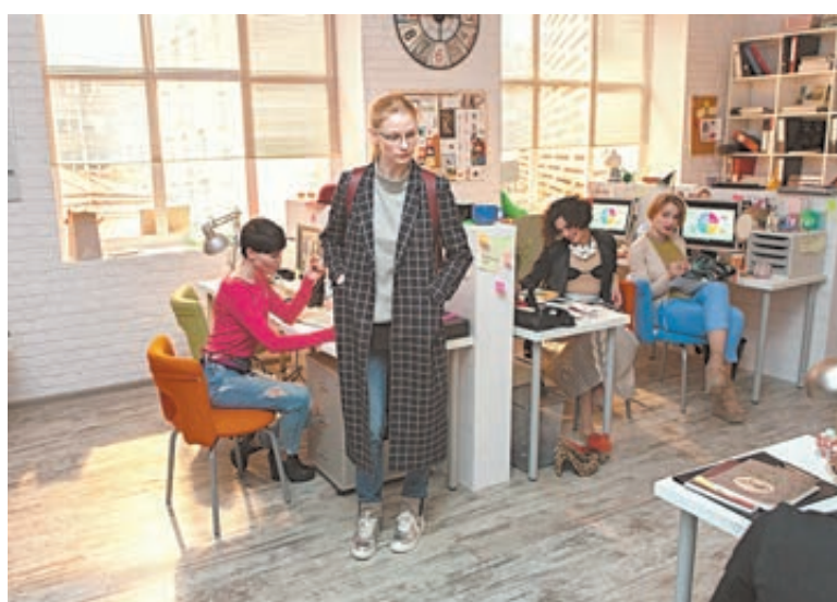
Кадр из сериала «Стерва».