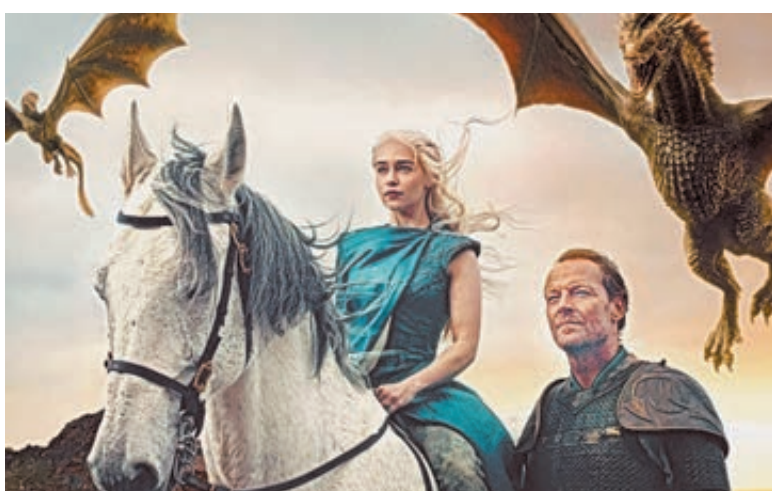
На отечественном ТВ «Игра престолов» в топ-100 не попала.

По порядку. Зарубежные сериалы крупные каналы, входящие в первый мультиплекс (то есть бесплатные и обязательные для распространения), все же ставят в эфир. Но действительно мало. В течение той же недели это были «Чисто английское убийство» и «Расследование Мердока» на ТВЦ, «Терминатор. Битва за будущее» и «Люди будущего» на ТНТ, «От заката до рассвета» на РЕН ТВ и «Революция» на СТС. Может, что-то я и пропустил, но все равно видно, что мало. В десятки раз меньше российской продукции.