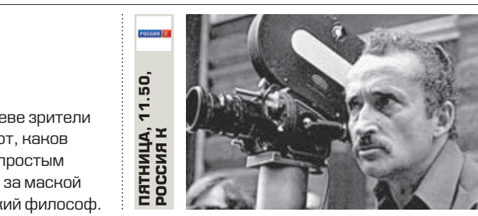
ПЯТНИЦА, 11.50, РОССИЯ К

Документальный фильм «Свой парень!» – так говорят о Леониде Куравлеве зрители и партнеры. И только самые близкие люди знают, каков актер на самом деле: ровненький, ранимый, с непростым характером. А еще мало кто догадывается, что за маской простакна, добряка и номина скрывается глубокий философ.