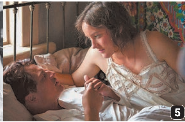
1 Надры из «Тихого Дона» Сергея Герасимова 2 и 3, Сергея Бондарчука 4 и Сергея Урсуляка 5 и 6.