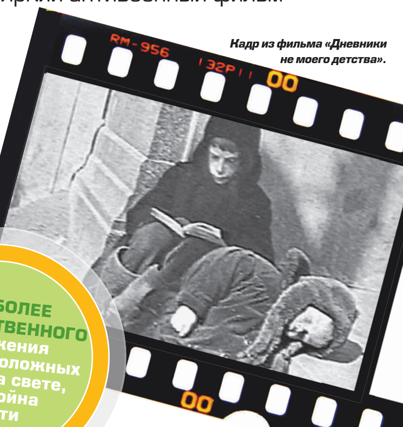
Кадр из фильма «Дневники не моего детства».

У 13-летней Хельги Геббельс — совсем иной жизненный антураж. Рано созревшая красавица окружена любо-