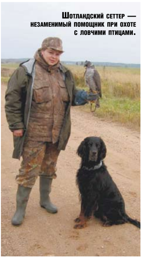
Шотландский сеттер — незаменимый помощник при охоте с ловчими птицами.