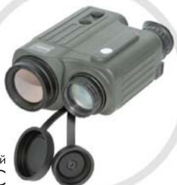
Тепловизионно-ночной КОМПЛЕКС ТНК-5М-01