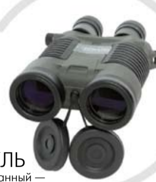
БИНОКЛЬ комбинированный — день/ночь БДН-9