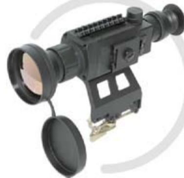
ПРИЦЕЛ тепловизионный ПТ-9-01