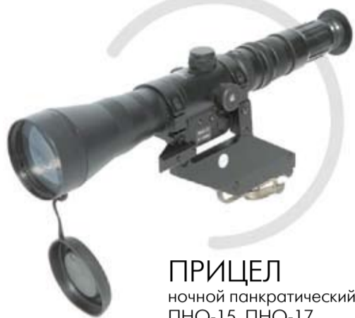
ПРИЦЕЛ ночной панорамический ПНО-15, ПНО-17