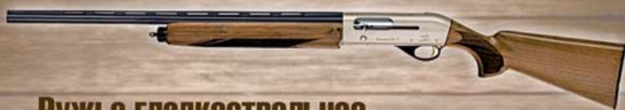
Ружье гладкоствольное Bernardelli mega 12/76 L 760

на оружие Hatsan/Bernardelli/Sabatti и на одежду Remington