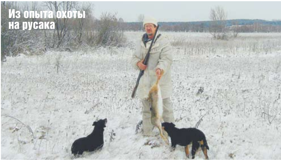
Из опыта охоты на русака