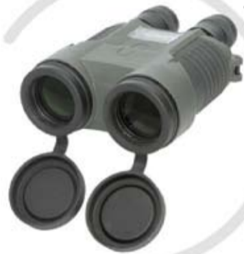
БИНОКЛЬ со стабилизацией изображения БКС 20x50M