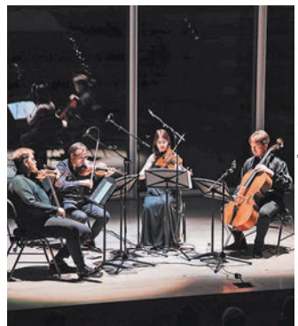
Музыканты Speech Quartet исполнили в «ГЭС-2» квартеты Бетховена и современных композиторов.