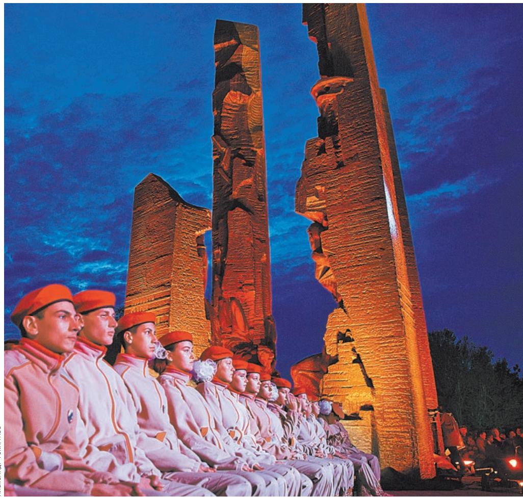
В канун 80-летия со дня создания «Молодой гвардии» осенью 2022 года в Краснодоне в ЛНР открыли восстановленный мемориал «Непокоренные».