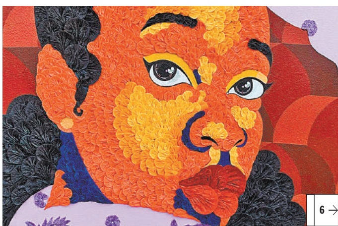
ЦЕНТРАЛЬНЫЙ ВЫСТАВочный зал манежа.

В петербургском «Манеже» открылась выставка африканских и российских художников «Перевернутое сафари. Современное искусство Африки»