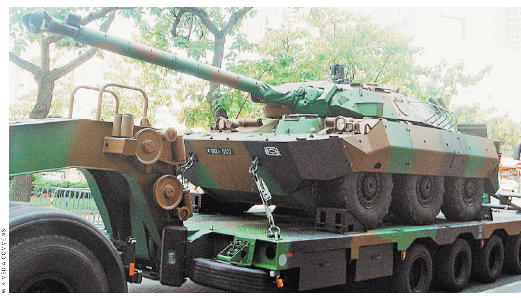
Российские военные через Мариуполь транспортируют очередной трофей — французский колесный танк AMX-10RC.

По словам экспертов, в CV-9040C используется много шведских технологий, включая сталь для литья орудий, тепловизионные матрицы, сервоприводы, механизмы зарядки орудия и поворота башни и многое другое. Наибольшую ценность для изучения представляют используемые в боекомплекте броневые оперенные подкалиберные снаряды APFSDS-T Mk1/2. Они снабжены вольфрамовыми сердечниками большого удлинения и способны пробивать бронелисты значительной толщины. Также будет интересно изучить комплекс маскировки Vagacuda, который снижает радиолокационную и тепловую заметность машины в различных спектрах инфракрасного диапазона волн.