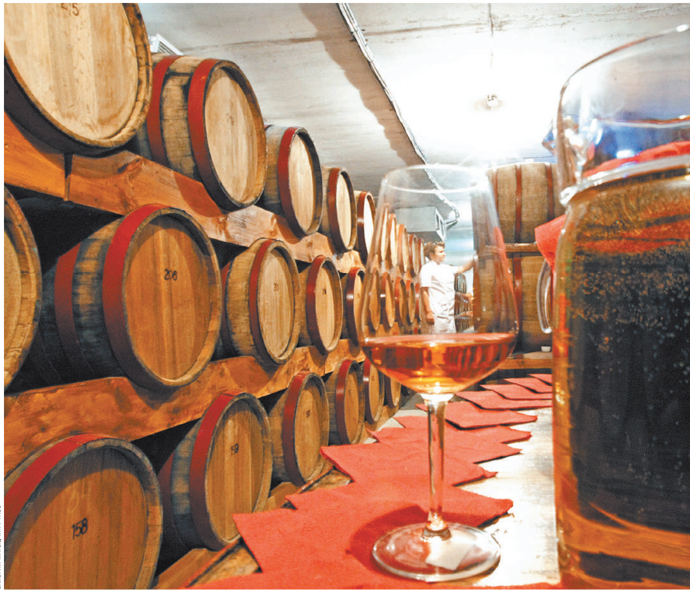
Вина в России сейчас избыток: импорта стало больше и отечественные виноделы увеличили производство.

У импортеров ожидается более жесткая позиция к увеличению пошлин. Эта мера при-