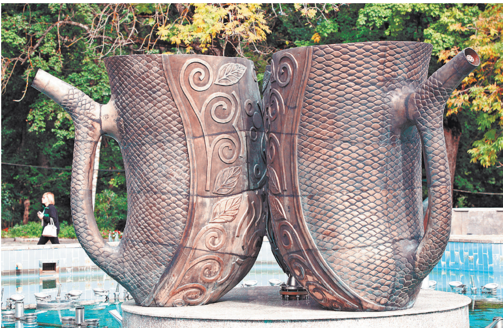
Курортный сбор теперь фактически распространяется на все ключевые российские города, которые славятся своими минеральными источниками. С 1 января курортный сбор в 100 руб. с одного гостя в сутки собирается в Железноводске в Ставропольском крае (а еще в Кисловодске, Пятигорске и Ессентуках). Собранные деньги идут на строительство, реконструкцию, благоустройство и ремонт объектов курортной инфраструктуры. С 1 августа курортный сбор будет взиматься и в Минеральных Водах.

Второе условие такого контроля Росфинмониторинга в отношении юридических лиц и ИП — если деньги в рамках операции переводятся в пользу получателя, который относится к группе высокой или средней степени риска совершения подозрительных операций, следует из приказа.