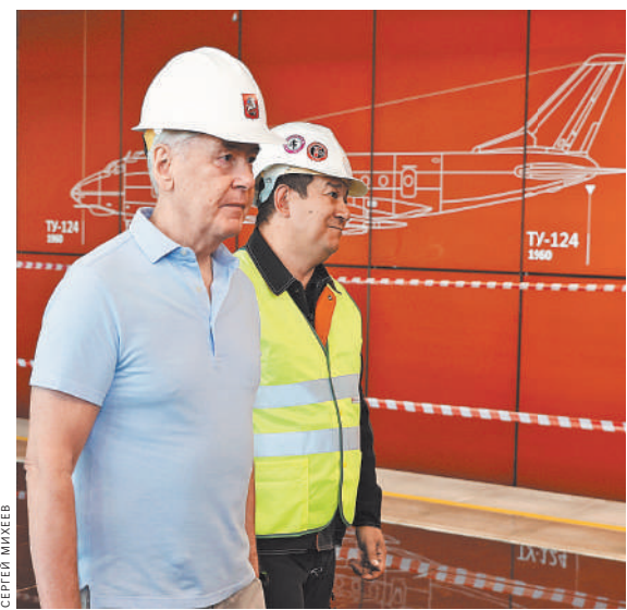
Пока по новой станции ходят мэры со строителями, но совсем скоро эту красоту увидят и остальные москвичи.