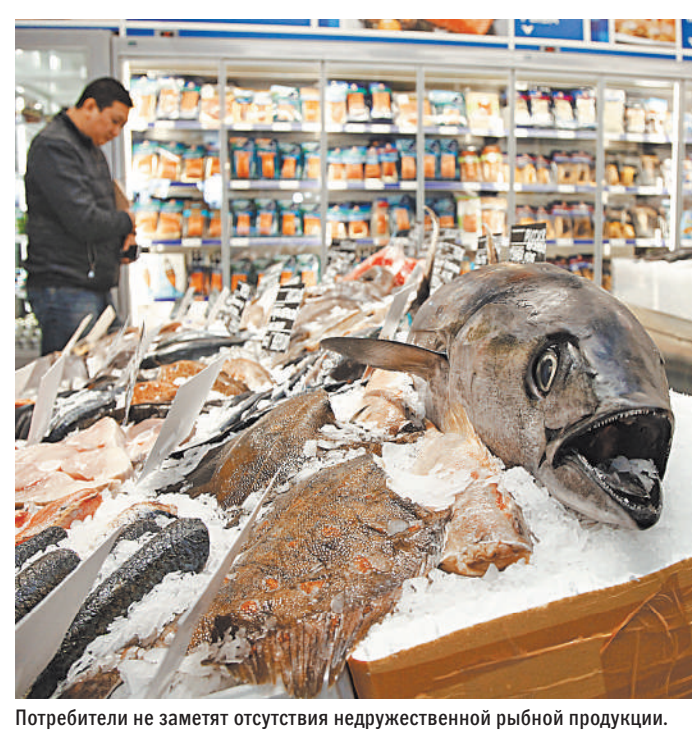
Потребители не заметят отсутствия недружественной рыбной продукции.

Зверев говорит, что основную долю импорта из недружественных стран составляли готовые продукты и консервы из сардинеллы, кильки и шпрот из Латвии. В 2021 году их поставки в Россию составили 1,127 тыс. тонн, или 91,4% от общего импорта такой продукции. «Российские предприятия способны полностью закрыть потребности рынка в этой продукции», — уверен эксперт.