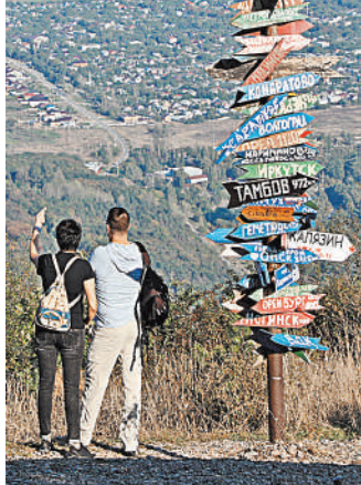
Курортный сбор действует сразу в ряде городов трех российских регионов.

Пилотный проект будет действовать до 31 декабря 2024 года.