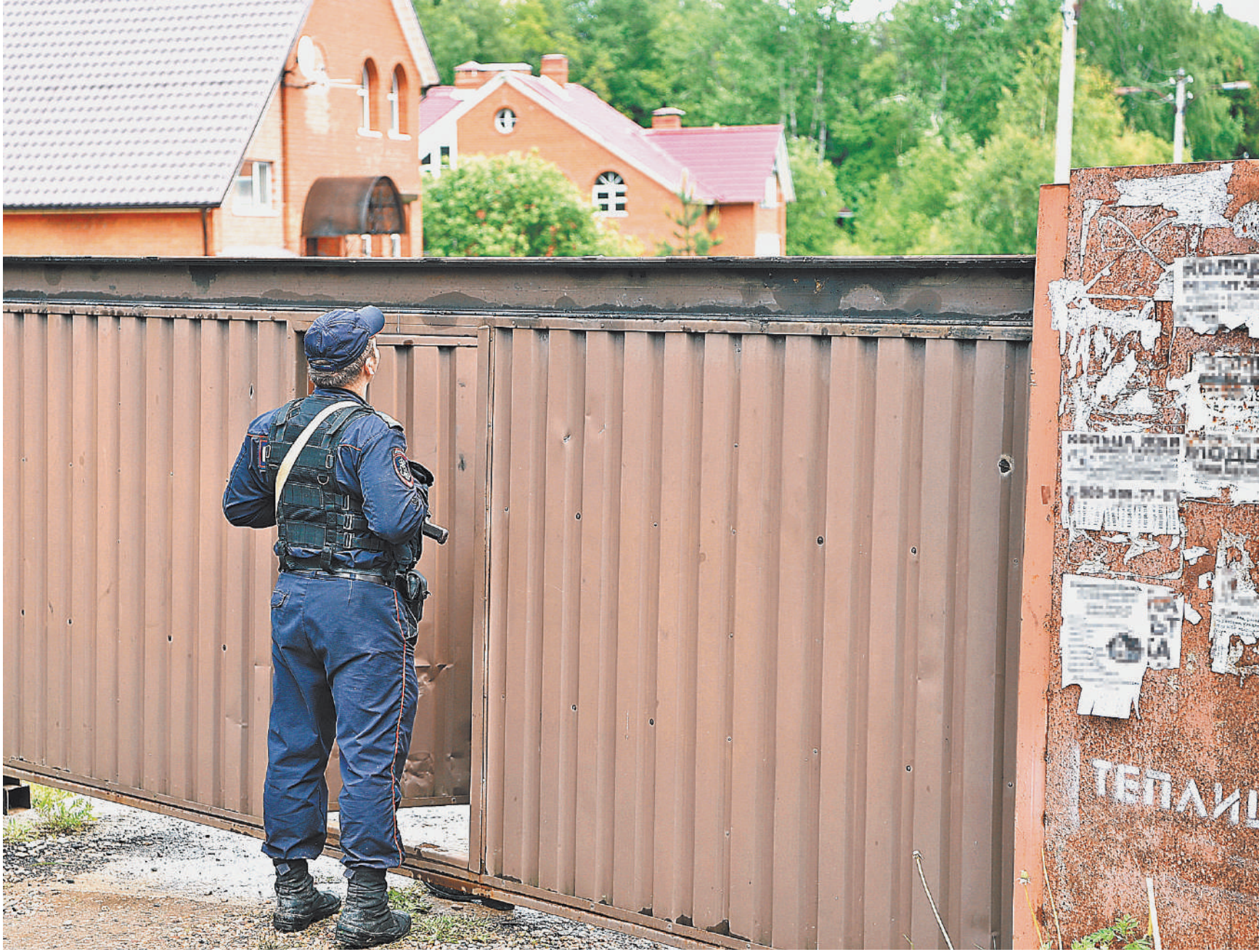
Жители коттеджного поселка вправе сами определять пропускной режим, однако делать это должны сообща. И в любом случае калитку перед хозяином дома никто не закроет.

Мечта многих — жить на своей земле. Однако нередко мечта оборачивается страшным злом. Нет такого прекрасного уголка на земле с домом и садом, который не могли бы испортить соседи. Допустим, кто-то выкупил частную дорогу и теперь к дому не подъедешь, не заплатив. Или кто-то стал владельцем ворот на въезде и открывает их далеко не всем. А иногда, по настроению, вообще никому не открывает. Увы, распространению страшных споров в наших дачных поселках способствовали пробелы в законодательстве. Хочется верить, что после вступления в силу новых норм сон дачников станет крепче.