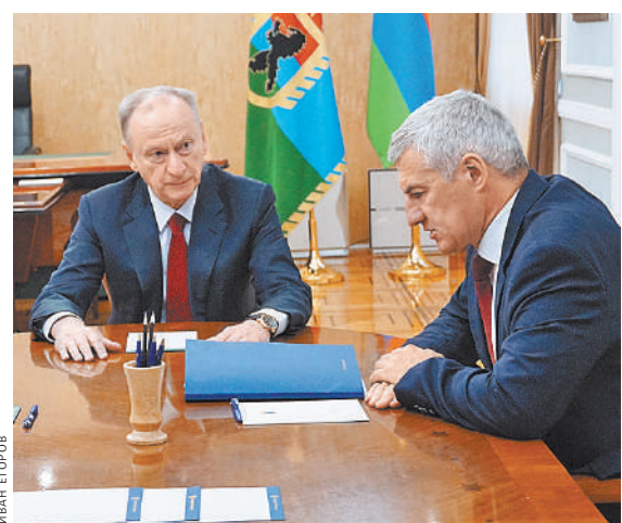
Николай Патрушев и глава Карелии Артур Парфенчиков обсудили вопросы безопасности и развития республики.

В целом, как заметил секретарь Совбеза, англосаксы, преследуя цель добиться стратегического поражения России, с началом СВО на Украине значительно увеличили военную помощь неонацистскому киевскому режиму. Благодаря такой поддержке Киев ощущает полную вседозволенность и безнаказанность. А население Украины, как еще раз отметил Патрушев, в борьбе с Россией используется в качестве расходного материала. ●