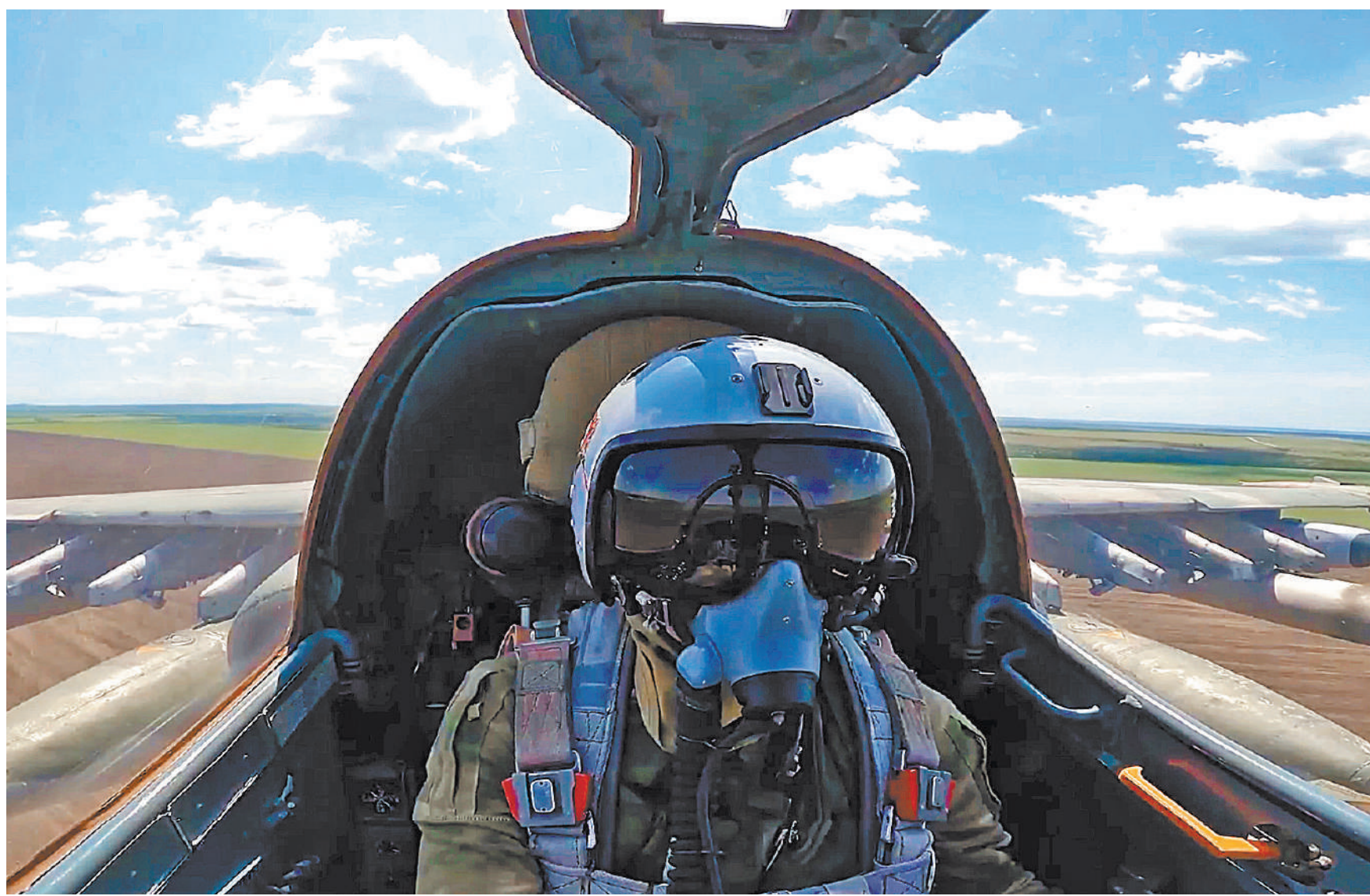
Наши штурмовики Су-25 с малых высот нанесли удар по замаскированным позициям противника.