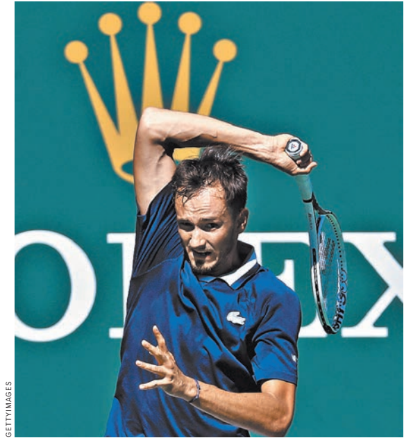
После операции по удалению грыжи Даниил Медведев пропускает грунтовый сезон. Теперь и травяной под вопросом.

Ассоциация теннисистов-профессионалов осудила дискриминационное решение Уимблдона