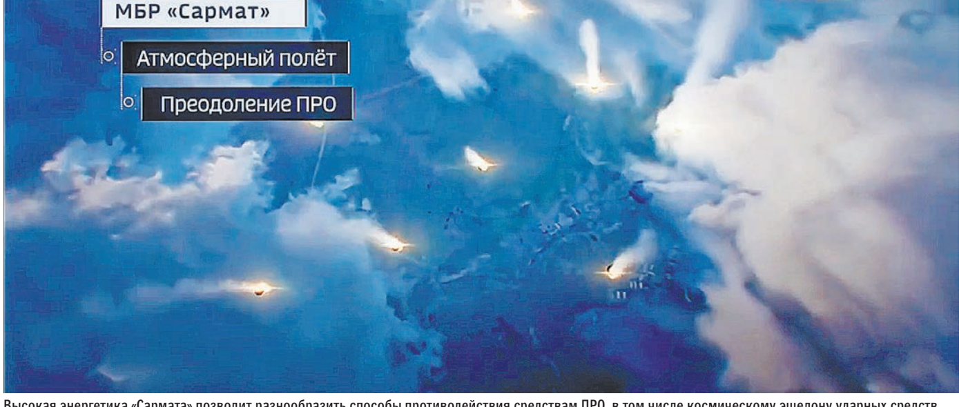
Высокая энергетика «Сармата» позволит разнообразить способы противодействия средствам ПРО, в том числе космическому эшелону ударных средств.

ПРЕЗИДЕНТ Владимир Путин поддержал идею создать детское движение, а также поднимать флаг и исполнять гимн в школах