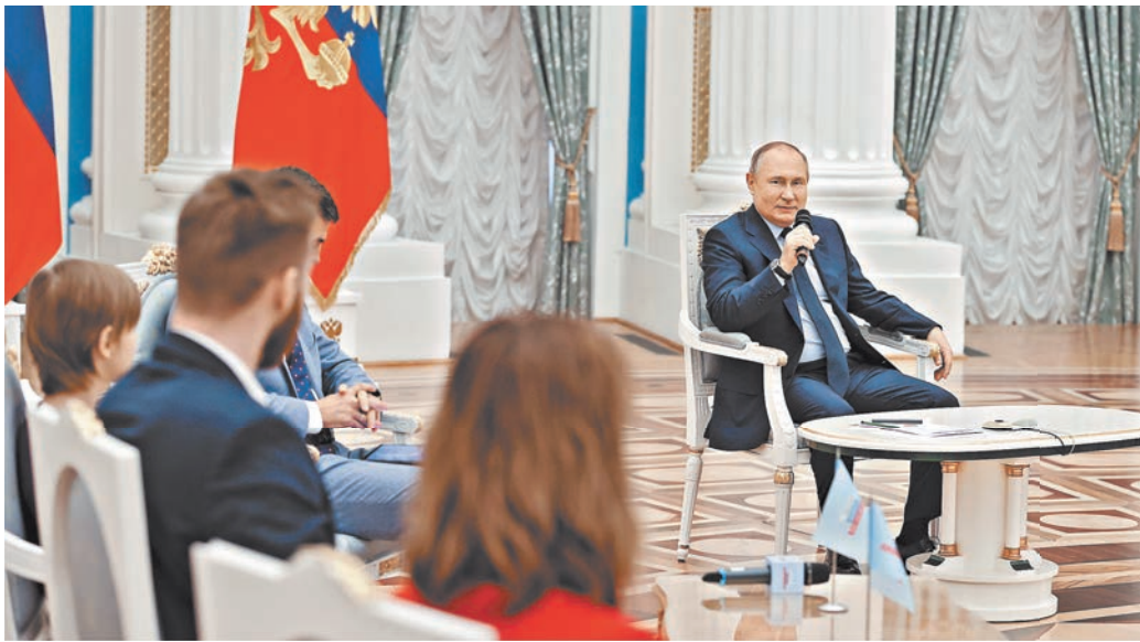
Владимир Путин поблагодарил участников платформы «Россия — страна возможностей» за их инициативы.

Новые идеи АНО оказались востребованными сотнями тысяч граждан, отметил президент. За год количество участников проектов удвоилось и превысило 10 млн человек. «Наши единомышленники из 150 стран так или иначе присоединились к этой работе. Это просто, честно говоря, для меня было абсолютным неожиданным. Это значит, что у нас много единомышленников, которые хотят идти вместе с нами, вместе развиваться, дружить, поддерживать друг друга. И это лишний раз подтверждает, что мы с вами на правильном пути», — заявил Путин.