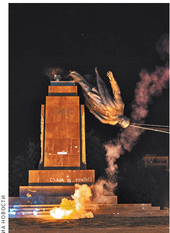
Ленин был автором и архитектором Украины. Сейчас там сносят его памятники, называя это декоммунизацией.