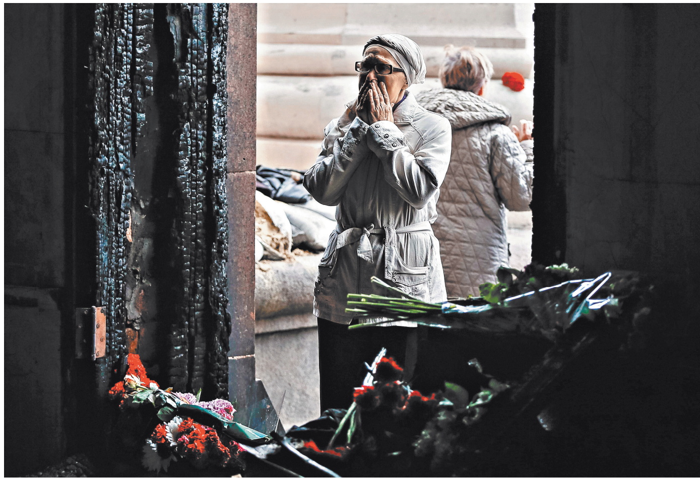
Имена виновных в трагедии 2 мая 2014 года в Доме профсоюзов в Одессе известны, и будет сделано все, чтобы их найти и предать суду.

На деле все свелось к тому, что развал украинской экономики сопровождается откровенным грабегством граждан страны, а саму Украину просто загнили под внешнее управление.