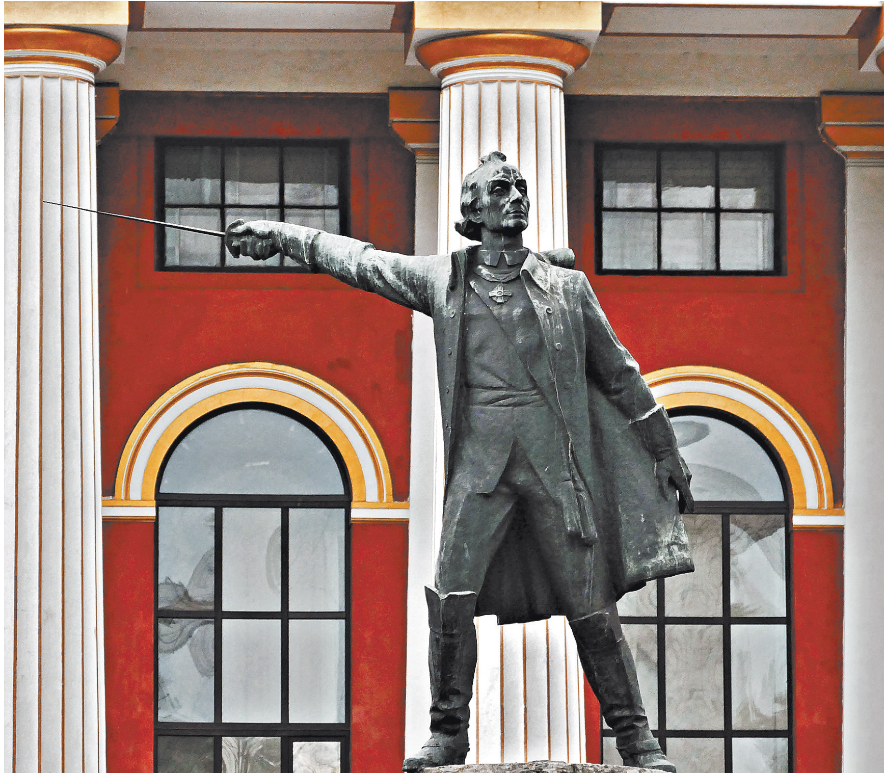
Памятник русскому полководцу Александру Суворову у Киевского военного лицея без конца перемещали, а потом и вовсе снесли, поместив в запасы.