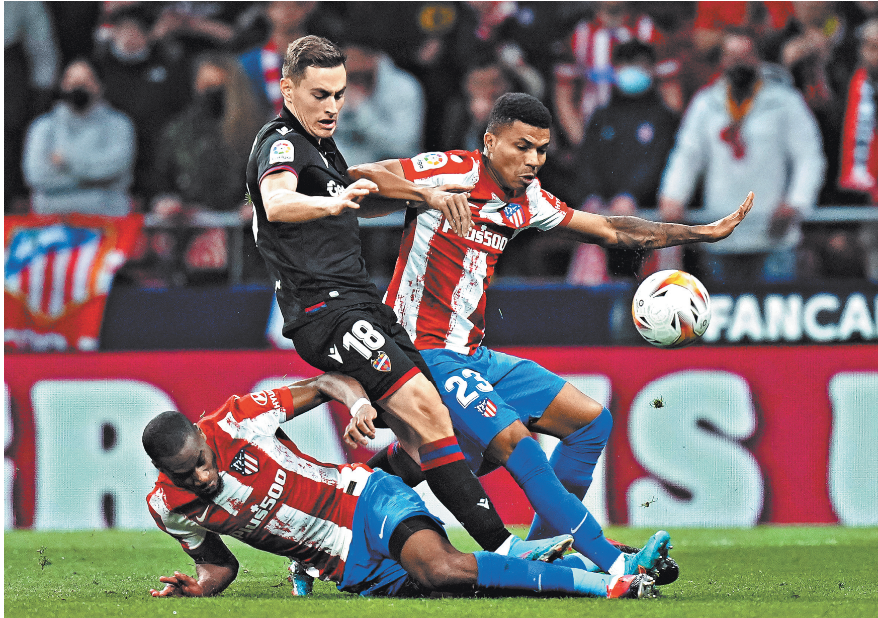
Футболисты «Атлетико» выжили в позпрошлом розыгрыше Лиги чемпионов «Ливерпуль». Теперь им будет противостоять еще один английский гранд — «Манчестер Юнайтед».

Впрочем, вряд ли прямо сейчас Симеоне думает о чем-то