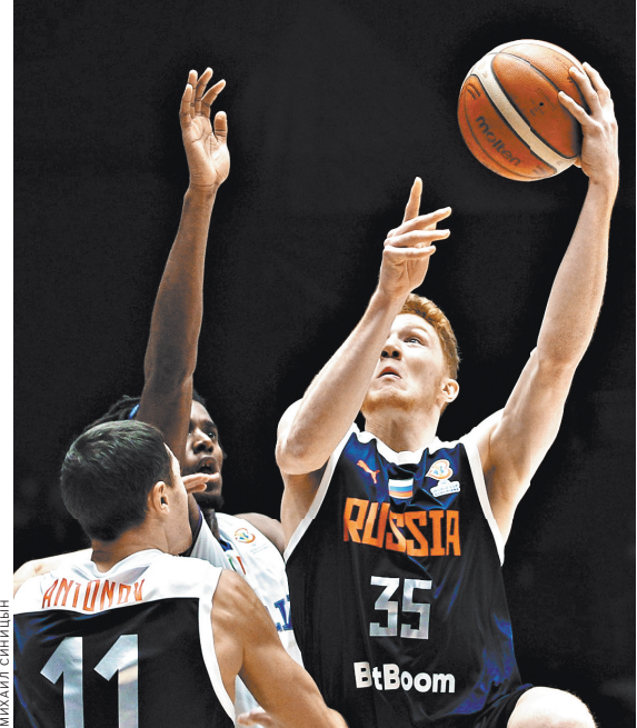
Нынешний отборочный цикл российская команда начала с уверенной победы над Италией в Санкт-Петербурге.

ТЕННИС Джокович выиграл в первом официальном поединке в этом году