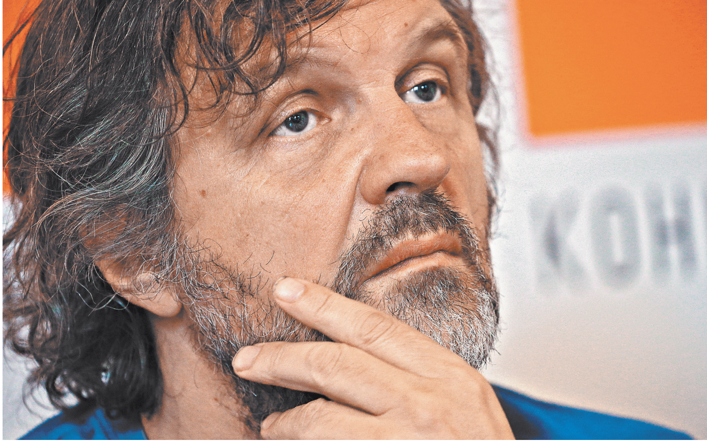
Эмир Кустурица — частый гость в России: на днях открыл кинофестиваль «Дух огня», а 23 февраля выступит на «Зимнем фестивале» в Сочи.

Кустурица и его фолк-рок-группа The No Smoking Orchestra — частые гости не только в столице, но и в регио-