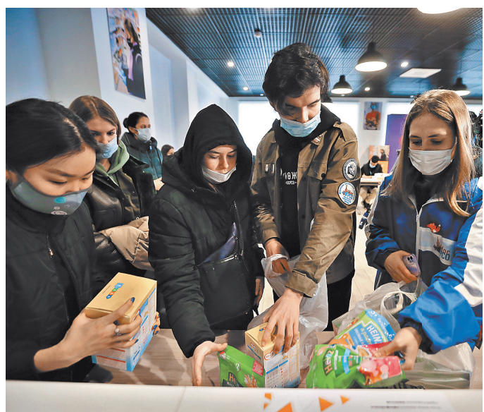
Чаще всего жители столицы несут в пункты сбора самое необходимое: чай, кофе, крупы, печенье, молочные смеси, соль...