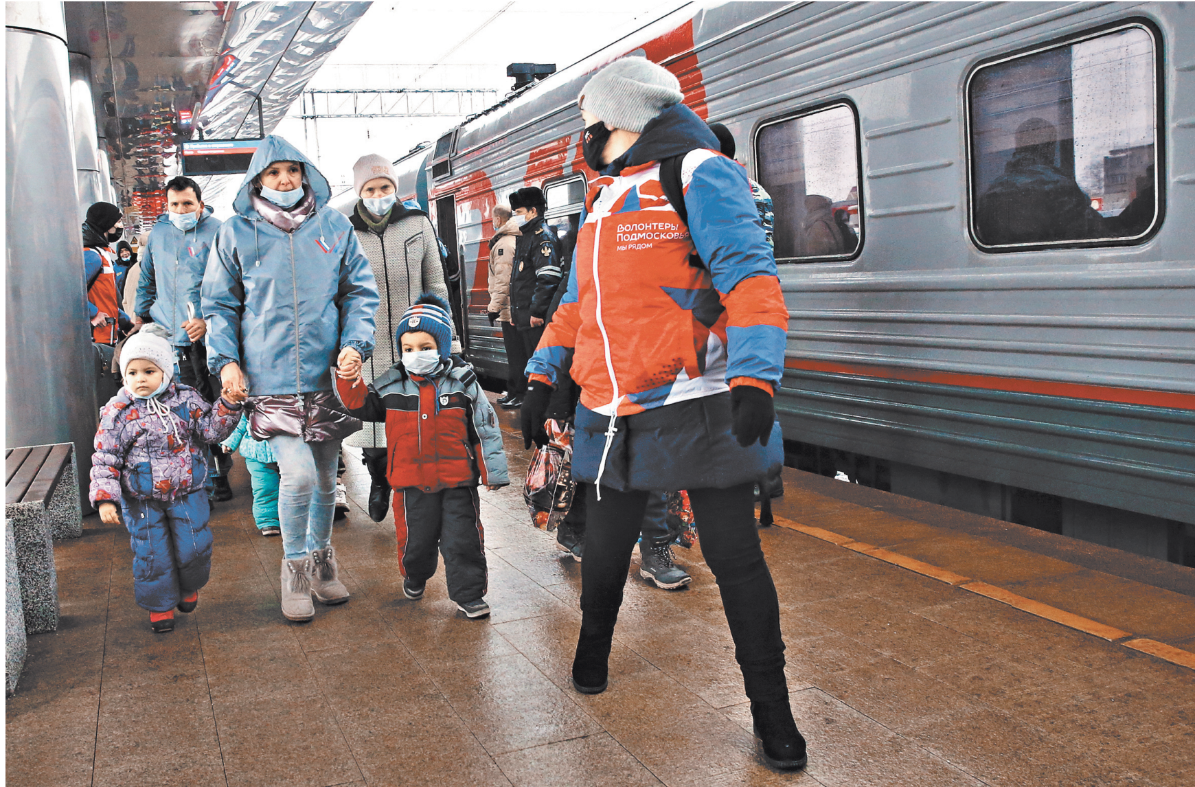
Первыми прибывших беженцев встречали волонтеры — узнавали, не нужна ли медицинская помощь, помогли связаться с оставшимися на Донбассе близкими, отвечали на вопросы.

Помимо Клина, жителей ДНР и ЛНР примут еще пять подмосковных муниципалитетов — Волоколамск, Коломна, Зарайск, Подольск и Пушкино. Подмосковье выразило