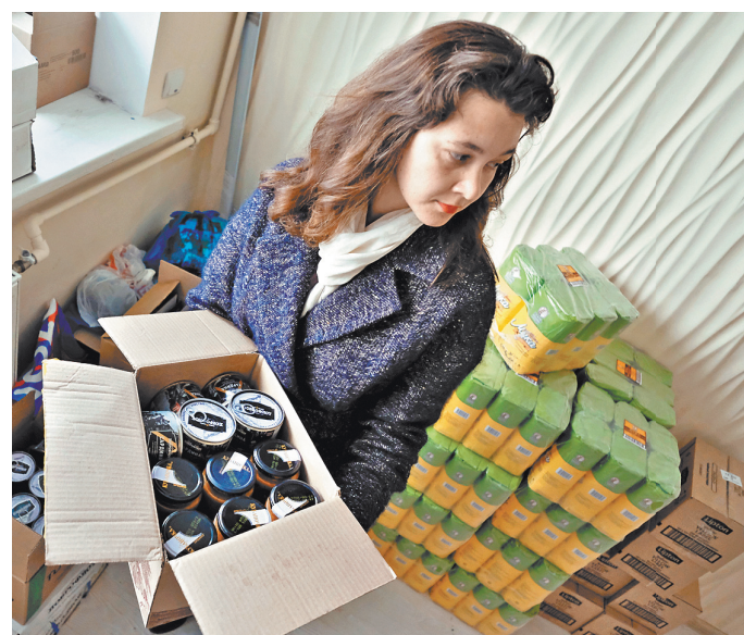
Собранные храмами Кубани продукты уже отправились в Ростовскую область, куда прибывают беженцы из Донбасса.

— Что нужно для ввода миротворцев в Донбасс rg.ru/art/2269449