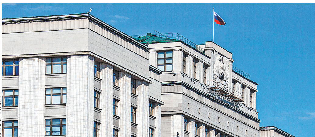
Обе палаты парламента в один день ратифицировали договоры о дружбе, сотрудничестве и взаимной помощи между Россией, ДНР и ЛНР.