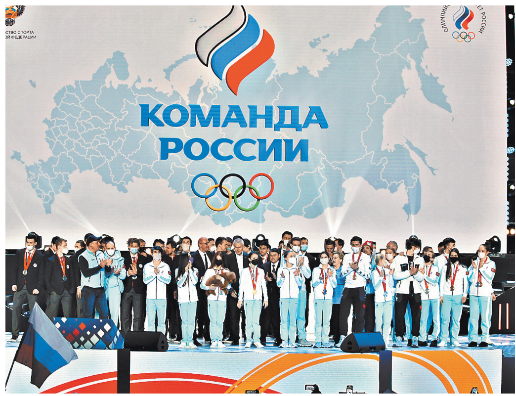
Российские олимпийцы вернулись домой, и их встретили, как героев.