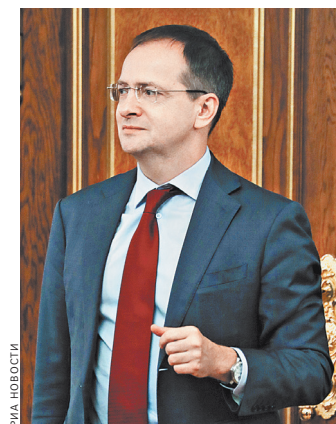
Владимир Мединский: Знать и уважать историю.

По словам Владимира Мединского, президент напомнил нам «хорошо известные историкам факты: современное государство, которое мы привыкли называть Украиной, есть исторический фантом, скроенный конкретными тактическими решениями конкретных политиков в конкретных обстоятельствах». Причем совсем недавно. «По историческим меркам — вчера». Владимир Мединский подчеркивает, что т.н. «история Украины» не просто неразрывно связана с тысячелетней историей Руси/России (СССР), но «это и есть сама русская история». «Малороссийские земли», присягнувшие государю Алексею Михайловичу в XVII веке — это лишь 15 процентов территории будущей Незалежной. Потом была «покупка» Киева у Речи Посполитой по Вечному миру 1686 года. Потом — войны Потемкина — Суворова с Османской империей — за Новороссию, Кубань и Крым... Мединский считает, что «экскурс в историю от нашего президента доказывает правоту его главной мысли: история нашей страны — преемственна и непрерывна». И она, как и вся историческая «цивилизация — Россия», не имеет ни конца ни края. ●