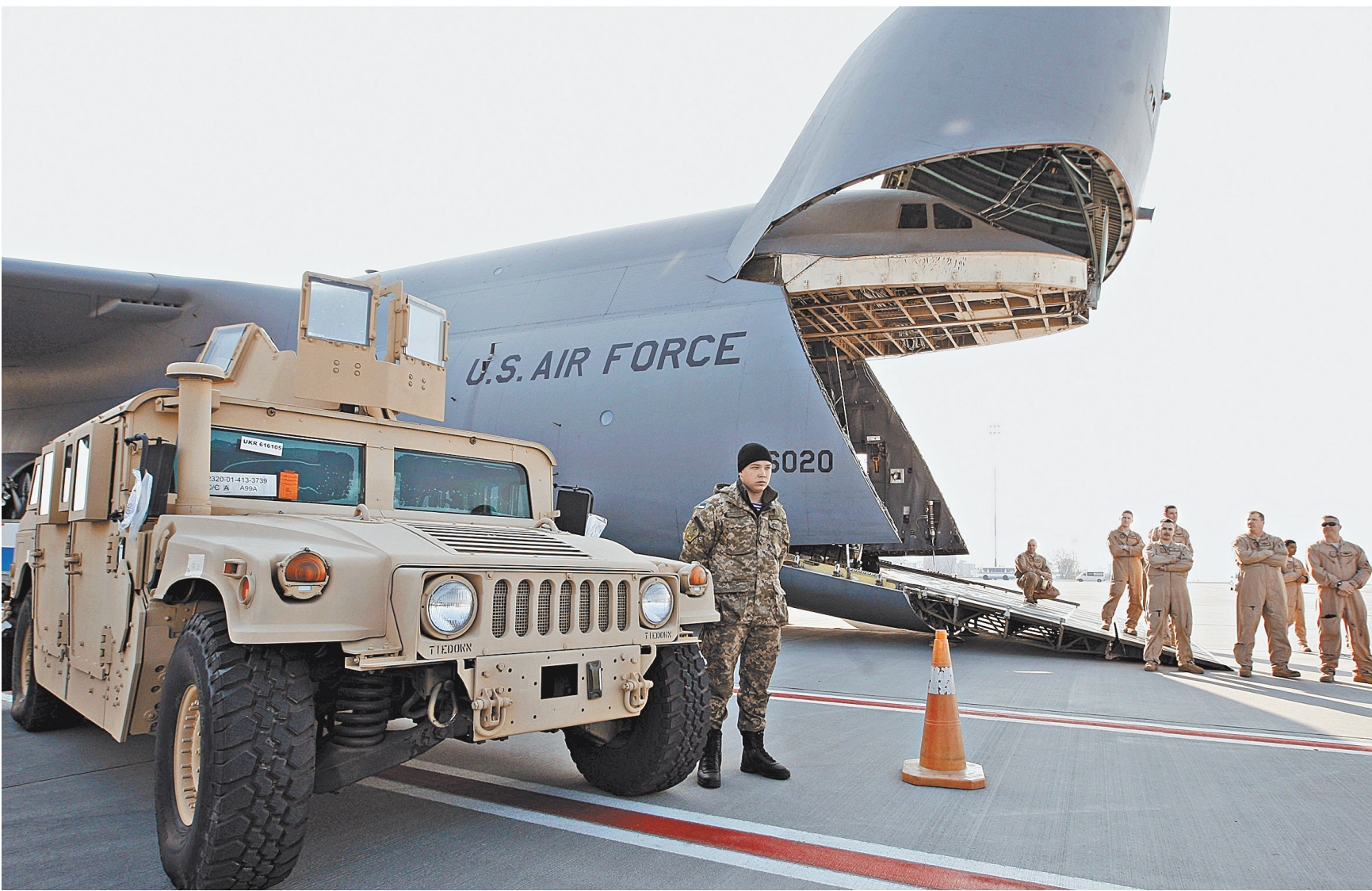
Украину сознательно накачивают современным западным вооружением.

Очевидно, что подобные мероприятия служат прикрытием для быстрого наращивания военной группировки НАТО на территории Украины. Тем более что модернизация с помощью американцев сеть аэродромов — Борисполь, Ива-