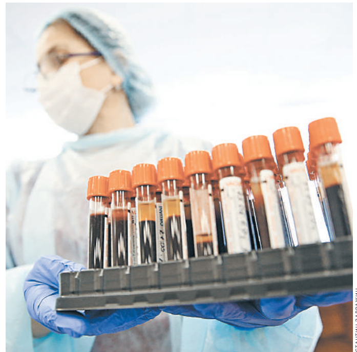
В появление новых препаратов есть вклад и патологов.