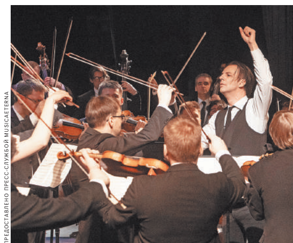
Теодор Курентзис и musicAeterna исполнили последние симфонии Моцарта в Москве, Петербурге и Нижнем Новгороде.

Сороковая соль минорная начиналась стремительным потоком легкой, воздушной оркестровой ткани со знаменитым мотивом, трепещущим словно живая душевная субстанция, которую подхватывал несущийся звуковой поток, наталкивая на рифы, обрывая, не давал вздохнуть, набегал сумрачными драматическими тупиками, пока окончательно не поглотил ее. В его интерпретации была заложена экзистенциальность, путь тревожного предчувствия того, что предчувствует каждая живая душа, — смерти. Andante второй части не внесло в эту картину никакого покоя, наоборот, звучание оркестра все больше наполнялось тяжелым и мрачным «порханием» струнных и напряжением той красоты, за границей которой, как в бетховенских симфониях, ощущалась пропасть. Она и развернулась в жестком, враждебном Менуэте с его наступательными артикулированными «фигурами» и императивным настроем, лишь на мгновение сменявшимся воздушным альпийской пасторали валторн. Краткий и быстрый финал прозвучал с отчаянным натиском и энергией рубленых тупти, избавлением от которых могла стать только фатальная развязка.