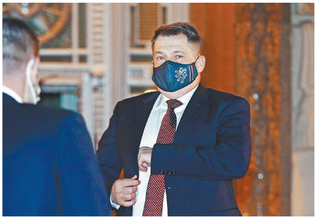
Посол Чехии в России Витезслав Пивонька у здания российского внешнеполитического ведомства.

Еще до объявления Кулганека Захарова обратила внимание на странные маневры чешского