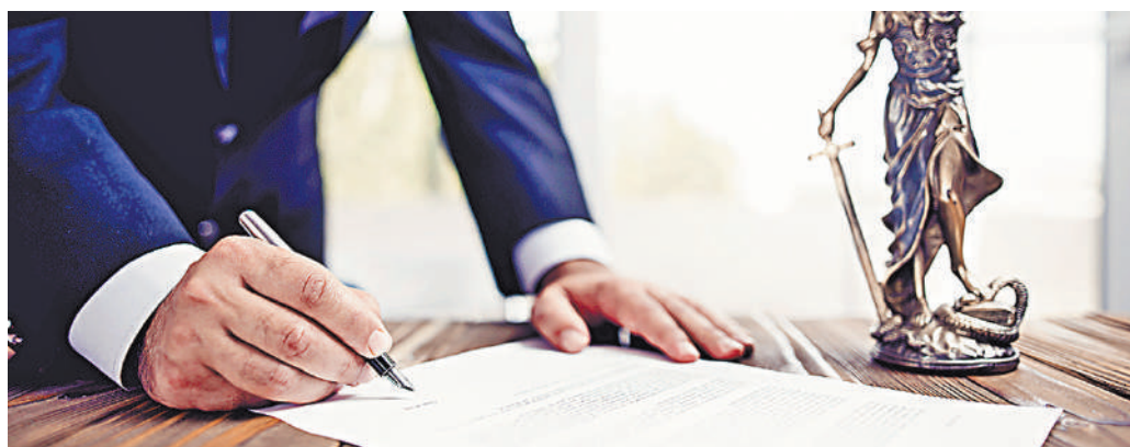
Участники выборов обязаны указывать свой статус в заявлении о согласии баллотироваться.