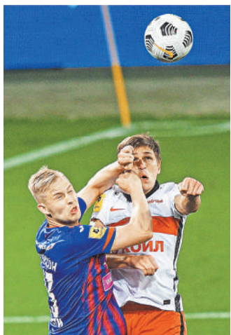
В матче первого круга ЦСКА добился волевой победы над «Спартаком», выиграв со счетом 3:1.

В свою очередь «Спартак» в матче прошлого тура в свой день рождения (99 лет) проиграл дома одному из аутсайдеров чемпионата «Уфе» (0:3). Пожалуй, этот поединок был одним из худших в исполнении «красно-белых» при Доменико Тедеско в конце сезона побороться за чемпионство — загадка. Для этого им обязательно нужно побеждать ЦСКА. В ином случае «красно-белые» фактически распрощаются с надеждами на «золото».