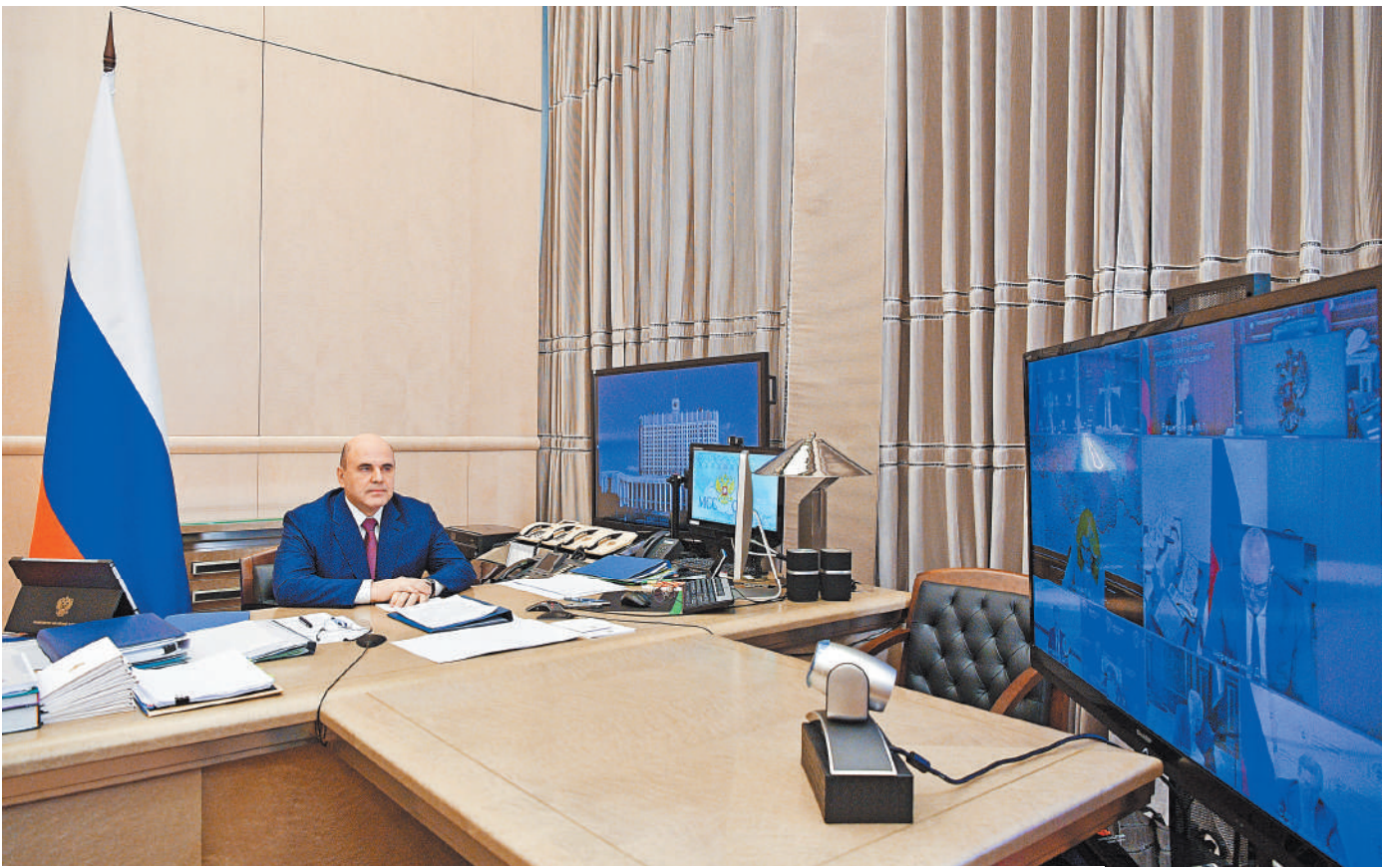
Михаил Мишустин поручил правительству подготовить меры поддержки семей с детьми.

Глава правительства также упомянул предложение президента возвращать родителям по-