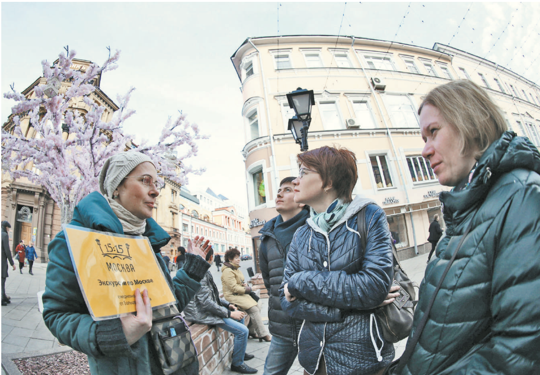
Согласаясь на экскурсию частного гида, туристы скоро смогут попросить его предъявить аттестат и наградную идентификационную карточку. Выдавать такие документы будут только тем гидам и экскурсоводам, которые в ходе аттестации подтвердят свои профессиональные знания и навыки общения с туристами.