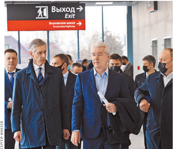
До открытия МЦД-4 еще два года, но качество строительства мэр проверять уже сейчас.

Напомним, МЦД-4 — самый протяженный из диаметров — 86 километров с 39 станциями. Сложность его состоит в том, что он соединяет два разрозненных направления Московской железной дороги — Киевское и Горьковское. Это потребовало от строителей сооружения дополнительных третьих и четвертых путей. Но в итоге диаметр не только соединит семь столичных вокзалов, но и создаст пассажирам 18 пересадок на метро и МЦК. Открыть его планируется в 2023 году. Благодаря МЦД-4 улучшится транспортное сообщение 23 районов столицы с населением 2,5 миллиона человек. Время в пути у них сократится на 38 процентов. ●