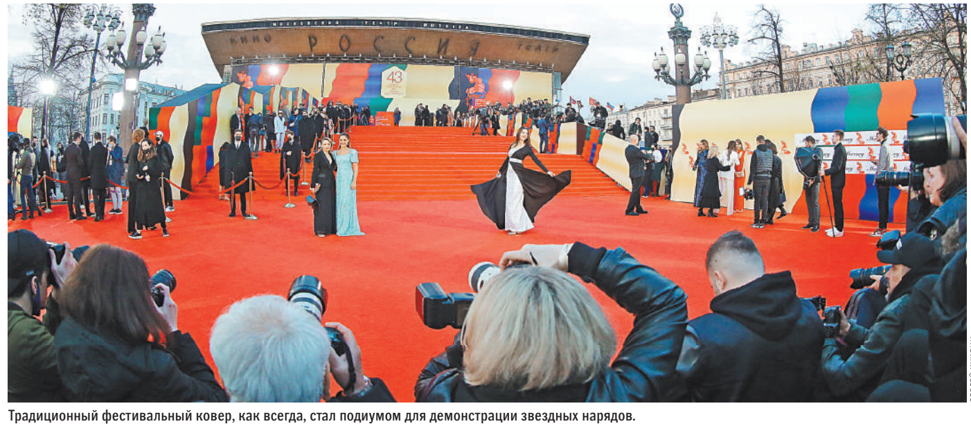
Традиционный фестивальный ковер, как всегда, стал подиумом для демонстрации звездных нарядов.

Из зала наблюдал за этим один из гостей фестиваля — солист группы Rammstein Тилль Линдеманн. Он исполнил для фильма «Девятая» песню «Любимый город может стать спокойным». Парад кинематографических бриллиантов стартовал. ●