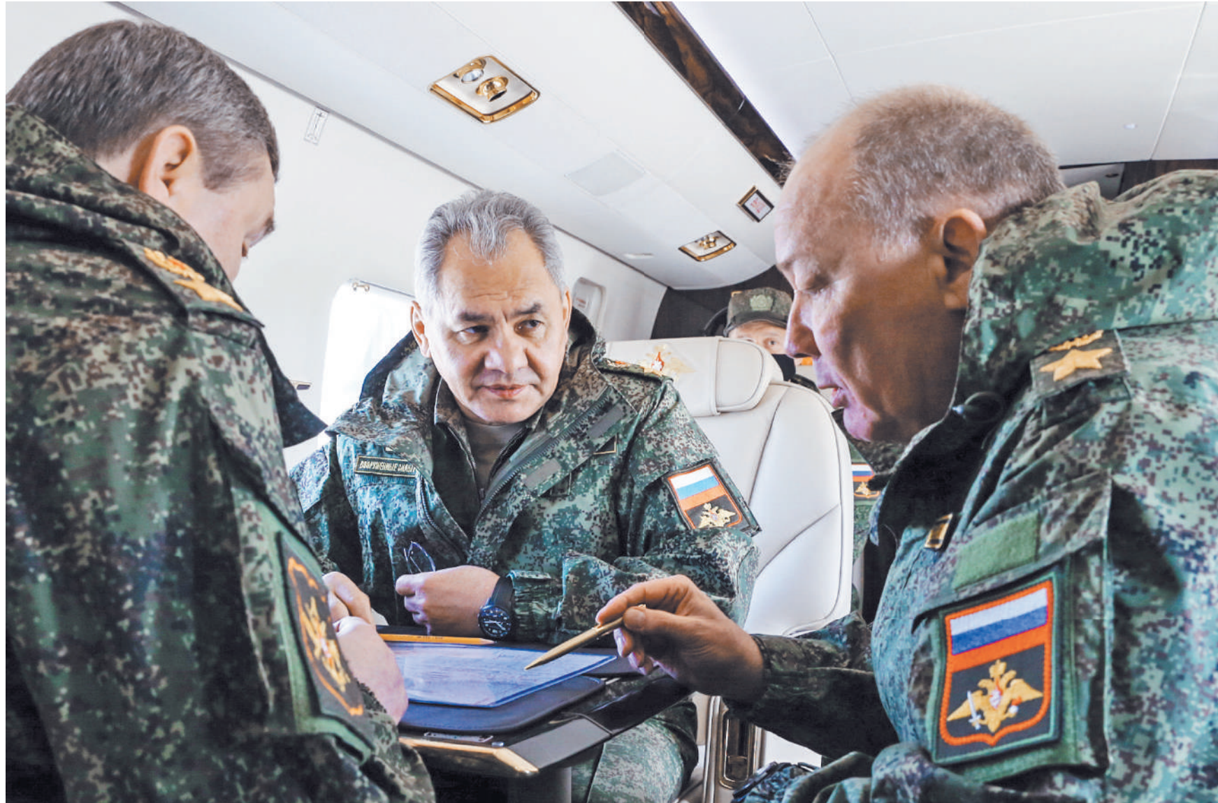
Министр обороны РФ Сергей Шойгу лично проинспектировал проходившие в Крыму военные учения.

Как сообщили в Минобороны России, в ходе тренировок отрабатывались ракетно-авиационные удары и их отражение. Кроме того, военные со-