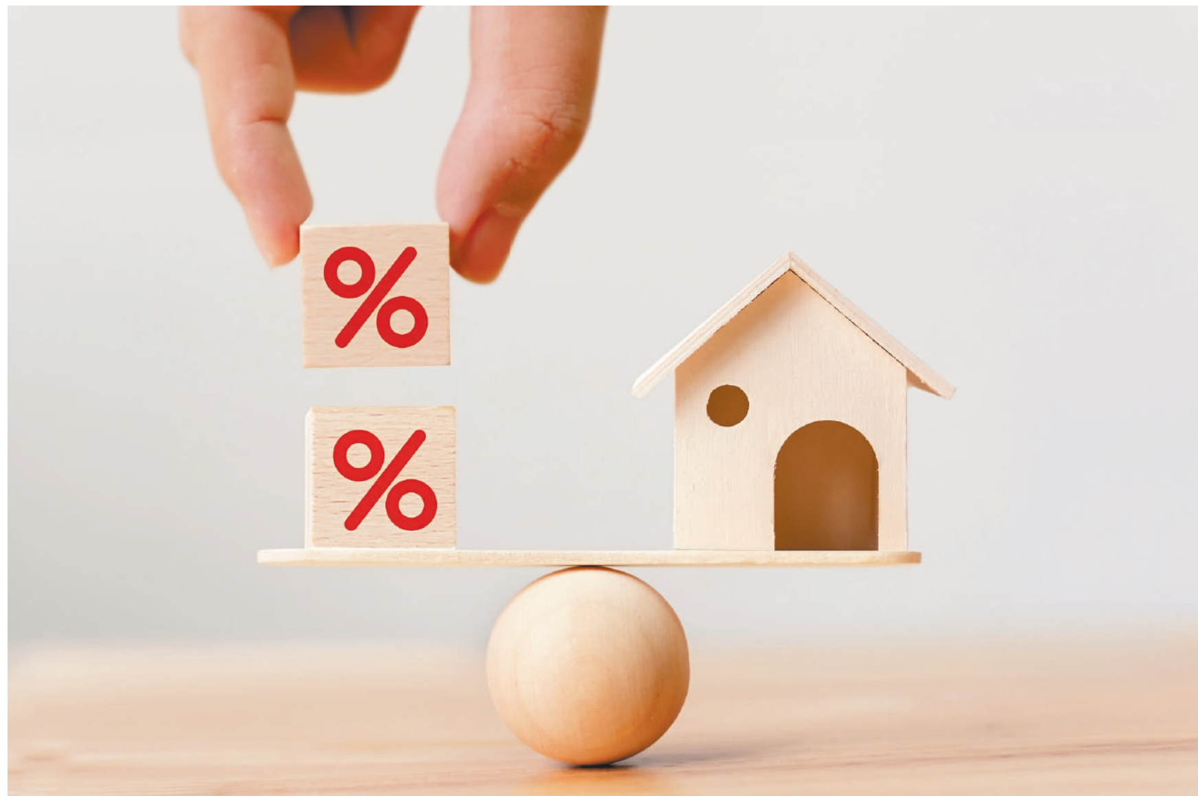
Получить налоговый вычет на ипотеку станет гораздо проще.