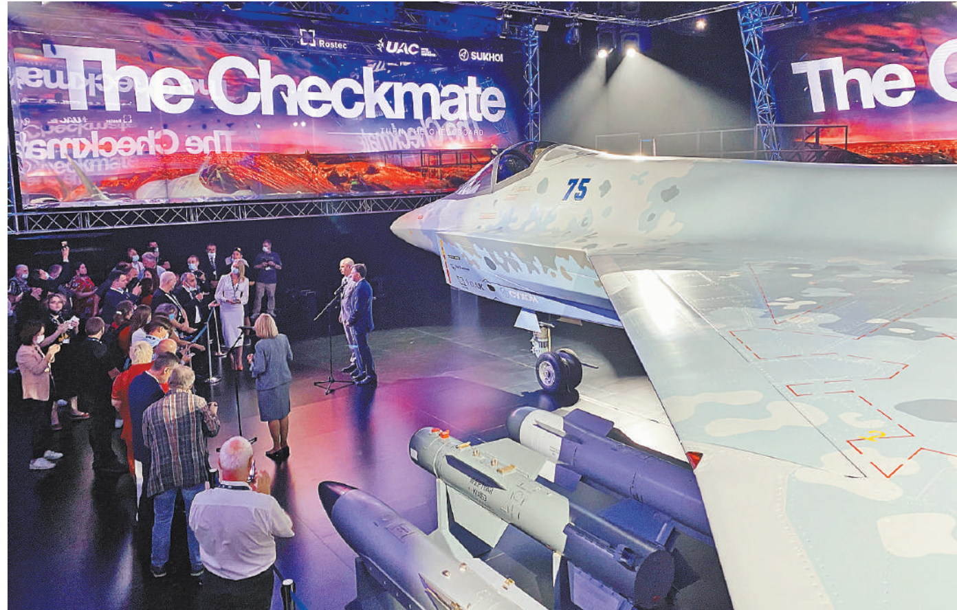
Главная сенсация авиасалона Dubai Airshow 2021 — презентация Россией легкого тактического истребителя пятого поколения Checkmate («Шах и мат»).

Густые осенние туманы, навкрывшие Центральную Европу, когда-то все равно рассеются. ■