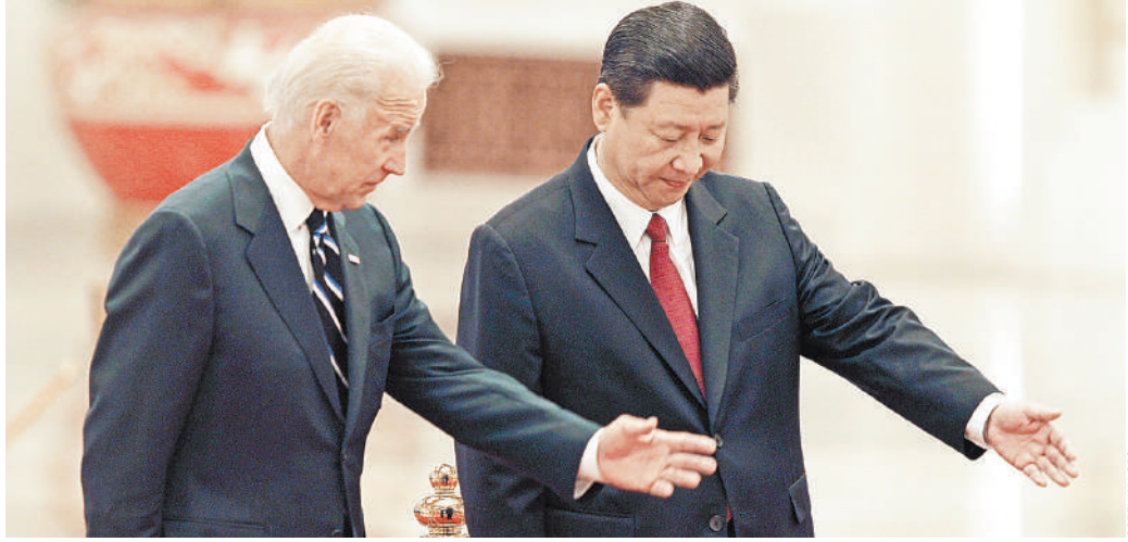
Хотя онлайн-саммит станет для Байдена первым прямым контактом с Си Цзиньпином в роли президента США, они хорошо знакомы и не раз встречались ранее (на фото — в 2011 году в Пекине).

В 2023 году появятся, например, виртуальный офис общей государственной службы, в нем граждане смогут встретиться с официальными лицами-аватарами для консультации и рассмотрения жалоб. Кроме того, основные туристические достопримечательности Сеула — площадь Кванхвамун, дворец Току и рынок Намдэму — будут представлены в обобщенных «зонах виртуального туризма», а утраченные исторические достопримечательности, такие как ворота Донгмун, окажутся воспроизведены в виртуальном пространстве. Также в виртуальном пространстве будут проходить (наряду с реальным пространством, разумеется) фестивали и праздники, например знаменитый Фестиваль фонарей, что позволит увидеть его во всем мире. «Метавселенная» разрабатывается в соответствии с программой Seoul Vision 2030, представленной мэром столицы О Се Хуном в сентябре. Программа базируется на четырех принципах: город, в котором проблемы жилья, занятости, образования и социального обеспечения решаются структурно; город — глобальный лидер; безопасный мегаполис и город, в котором сосуществуют традиции и современность. ●