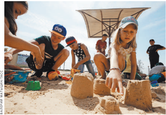
Когда дети занимаются с песком, они прислушиваются к себе, расслабляются.