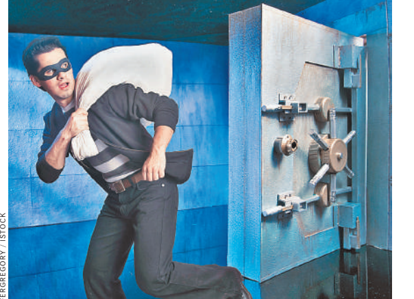
В Германии все реже грабят банки — наличности в них стало меньше, охрана надежнее.

Профессия «грабителя банков» в Германии вымирает. Как сообщает издание Die Welt, «количество нападений на банки, сберегательные кассы и почтовые отделения за последние три десятилетия упало на 95 процентов». В 1993 году правоохранители Висбадена насчитали 1623 нападения на «финансовые учреждения и почтовые отделения», а в прошлом году, по последним данным Федерального управления уголовной полиции, их было всего 80. Причины, по мнению полицейских, финансистов и страховщиков, несколько. Во-первых, у грабителей сильно уменьшился выбор. В середине 1990-х в Германии было почти 70 тысяч банковских отделений, а в конце прошлого года, по данным немецкого центрального Бундесбанка, их осталось около 24 тысячи. Кроме того, помехой для грабителей стал технический прогресс. И, наконец, уменьшилась ценность наличных денег. При этом риск быть пойманным только возрастает — полиция раскрывает три четверти всех нападений на финансовые организации. Die Welt цитирует представителя Федерального управления уголовной полиции: «Дополнительные меры безопасности, такие как уменьшение запасов наличности в банке, приводят к снижению нападений на большой кассе, и с точки зрения соотношения риска и выгоды грабеж обычно становится непривлекательным преступлением». ●