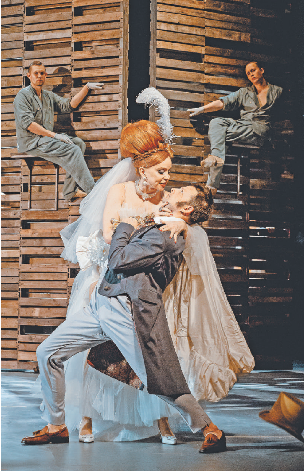
В спектакле Сергея Газарова разворачивается и драматическое действие, и мюзикл, и балет.

Сценография спектакля остроумна и проста (художник Владимир Арефьев). Вместо задника — стена, словно собранная из мелких деревянных плашек. Она в моменты распахивается наподобие ширмы, являя нам и вовсе уж inferнальный мир. Зеркальце? Подознание? Неведомое будущее? А собранные из таких же плашек гигантские колеса превращаются то в уютные диваны, то в основание пирами-