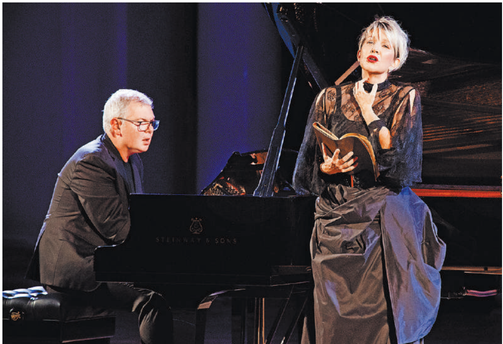
В марте 2022 года Джойс Дидonato выступит в Концертном зале «Зарядье» со своим новым проектом «Земь».

Джойс Дидonato (урожденная Флаэрти) родилась в Прери-Виллидж, штат Канзас. Многократный обладатель «Грамми», в том числе в 2012 году за лучший сольный альбом Diva Divo в номинации «Классический вокал». В том же году вошла в список выдающихся исполнительниц в Зале Славы компании «Граммофон». Непривычная исполнительница партий в операх Генделя. В репертуаре — Моцарт, Беллини, Россини, Доничетти, Берлиоз, Массне, Р. Штраус.