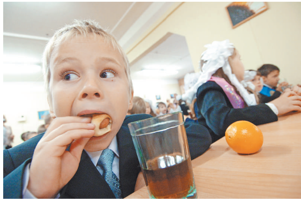
Для школьных обедов нужно больше времени. Перемены в 15 минут не хватает.

Проект РДШ «Шеф в школе» был запущен осенью 2020 года. У ребят появилась возможность влиять на меню в столовых, оценивать вкус блюд, ассортимент, состояние помещений, выявлять проблемы и рассказывать о лучших практиках, делиться своими идеями, а также получать знания от кулинаров страны. Он охватывает все 85 субъектов страны. На сайте зарегистрировано более 7500 участников.