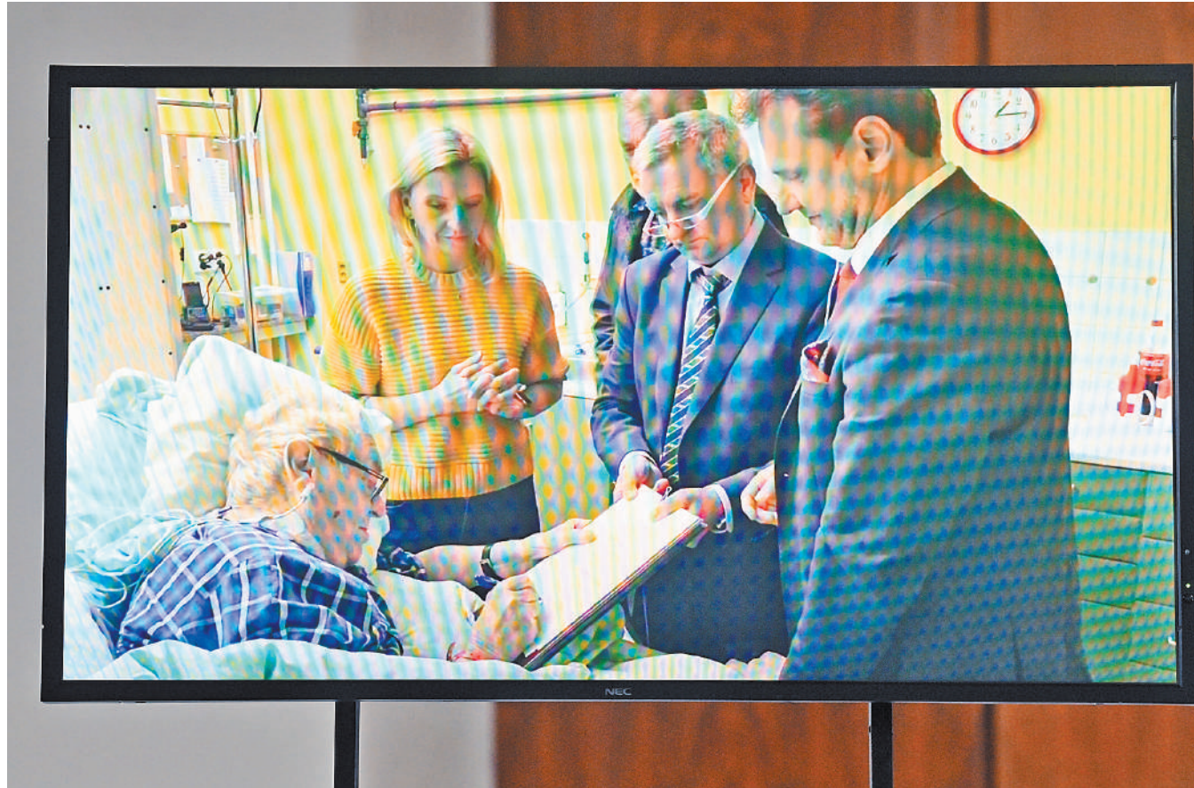
Покинув реанимационное отделение, Милош Земан прямо с больничной койки продолжил управлять государством.

При этом Бабиш, легко отказавшийся от премьерского кресла, конечно, лукавит, недоговаривает. Явно не хочет связывать свое имя с тяжелым периодом, в котором оказалась страна. Опытный управленец, он прекрасно понимает, какая неподъемная ноша перейдет в наследство новому кабинету и какие непопулярные решения придется принимать министрам уже в первые дни 2022 года. Пандемия и связанные с ней осложнения продолжают наносить удар за ударом едва ли не по всем отраслям чешской экономики. Если и есть рост, то это рост инфляции,