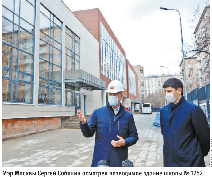
Мэр Москвы Сергей Собянин осмотрел возводимое здание школы № 1252.

робототехники, естественных наук — химии, физики, биологии с лабораторными практиками, а также универсальные классы, предназначенные для занятий по предметам школьной программы и организации кружков черчения, рисования, программирования, технического творчества и Lego-конструирования, музыки и пения, шахмат, домоводства и другие. Для проведения занятий в малых группах (например, при изучении иностранных языков) классные комнаты можно легко разделить с помощью трансформируемых перегородок. Для уроков физкультуры предусмотрены два хорошо оснащенных спортивных зала с раздевалками и душевыми. В распоряжении школьников и педагогов появятся так же активный зал на 240 зрителей, библиотека и медицентр с фотокиностудией, радиоузел, столовая на 200 мест. Переделут в новостройку и учащиеся 8–11 классов школы № 1252, которые сейчас учатся в корпусах на Дубосекской улице и Волоколамском шоссе. Это, в свою очередь, сделает более комфортными условия обучения для учащихся начальной школы. Собянин отметил, что в планах города на 2022–2024 годы построить 137 новых зданий школ и детсадов частично за счет городского бюджета, а так же на средства инвесторов. За период с 2011 года в Москве построено для образования 453 новостройки, из которых 324 детсада и 129 школ.