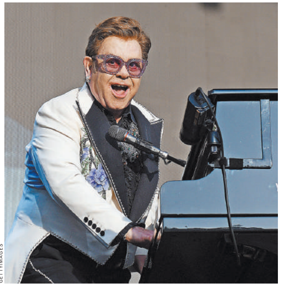
В новом диске Элтона Джона 16 композиций, созданных с коллегами из мира рока, рэпа, электроники за время локдауна.

Все изменил случившийся локдаун: из-за пандемии впервые за восемь лет мэтр надолго остался дома в студии. Там его и разыскали австралийский диджей из проекта Pnaa. Сделали ремикс хита середины 80-х Cold Heart, когда он мог никуда не спешить и спокойно послушать: и новые всплески электронных эмоций, и сбивки ритма, и горделивый, сочувствующий вокал Дуа Липы, и резкие отчаянные подпевки самых австралийских парней. В итоге довольно однообразная, мстами унылая песня стала яркой, динамичной и притягательной. А Элтон Джон благодаря этому ремиксу впервые за 16 лет возглавил рейтинг самых продаваемых синглов Великобритании, который впервые покорился ему ровно 50 лет назад. И хорошо, что после этого он сразу же не вернулся к сочинению своих традиционных баллад, а нашел в себе смелость дать погрузиться в него и другим артистам, диджеям. Может, благодаря «Холодному сердцу» ему и самому снова стало очень интересно экспериментировать впервые за долгие годы.