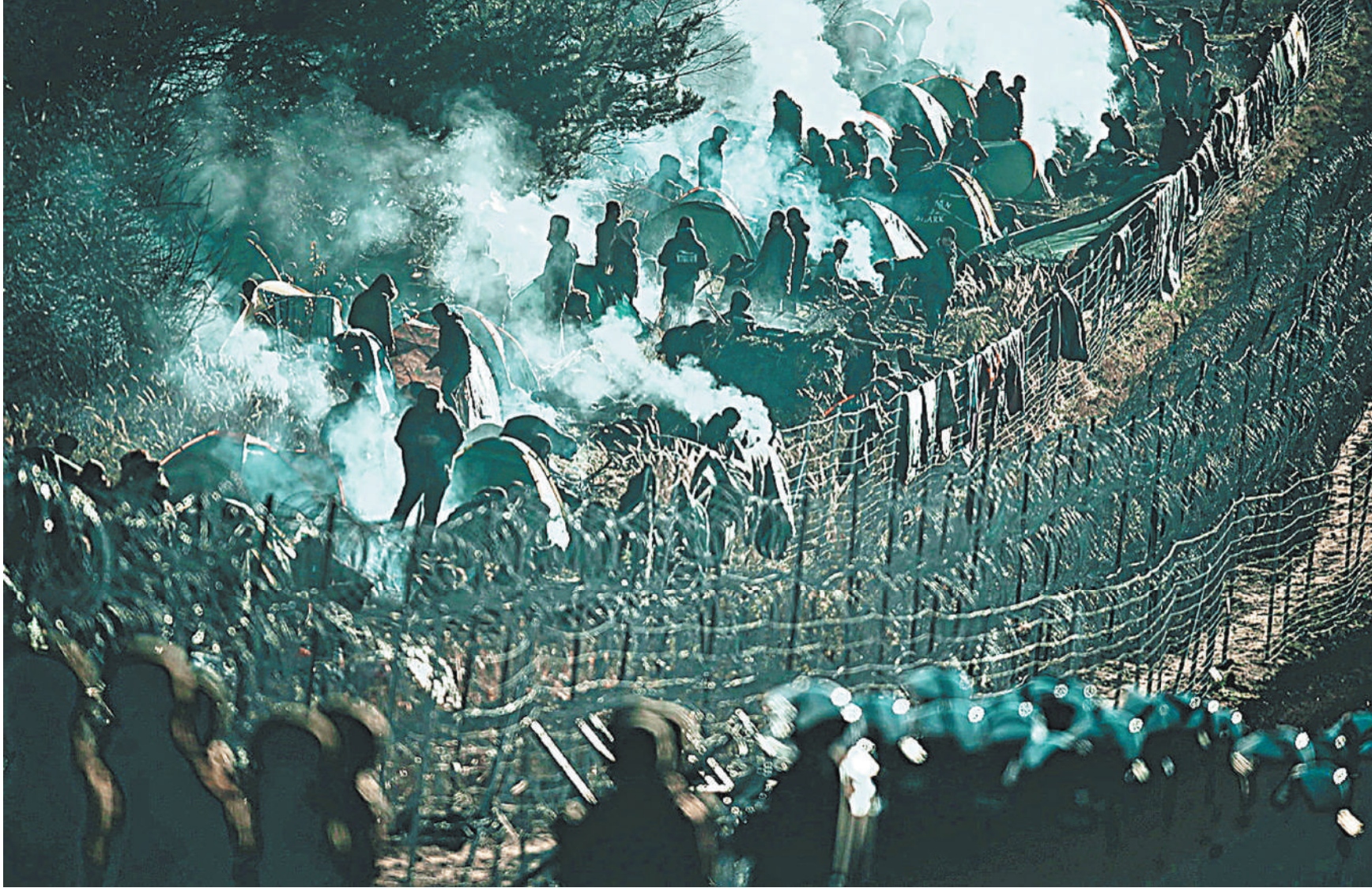
Польша использует армию, чтобы сдерживать мигрантов на границе с Беларусью. И теперь хочет привлечь к борьбе с беженцами силы НАТО.

«Думаю, это очень сложный и принципиально новый момент для НАТО и ЕС, которые Польша хочет задействовать как инструменты для «сдерживания врагов». Хотя очевидно, что механизм, созданный «холодной войной», не в состоянии разрешить подобный кризис. Поляки, Прибалтика и все страны Восточной Европы выступают в нем не на стороне «клуба» стран с либеральными ценностями, как те же Германия или Франция, но демонстрируют ментальность осажденной крепости, ощущая себя неким форпостом на внешних рубежах. Латвия и Литва опасаются, что если Польша полностью закроется, то поток беженцев хлынет через Прибалтику на север Европы, в Скандинавию. А Польша, которая и так переживает острый ценностный конфликт с Брюсселем, боится, что на нее