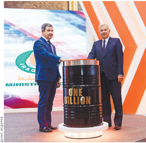
Министр нефти Ирака Ихсан Абдул Джабар Исмаил и президент ПАО «ЛУКОЙЛ» Вагит Алекперов.