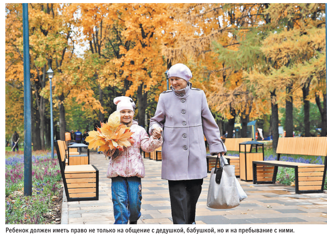
Ребенок должен иметь право не только на общение с дедушкой, бабушкой, но и на пребывание с ними.

Читайте также: Названы лучшие города для построения карьеры в России rg.ru/art/2177237