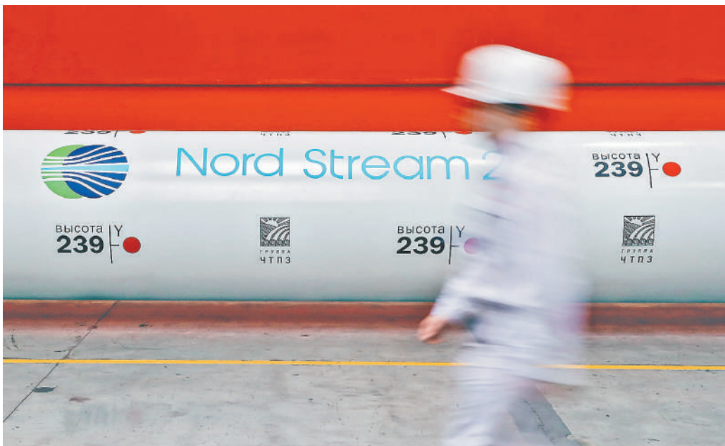
Первую нитку «Северного потока-2» наполняют газом, чтобы начать процедуру тестирования газопровода.

Тем временем в Европе биржевые цены на газ превысили 1200 долларов за тысячу кубометров. Газ используется здесь в первую очередь для генерации электричества, поэтому, соответственно, выросли тарифы на него. По мнению экспертов, даже запуск газопровода этой осенью не поможет Европе избежать мощнейшего энергетического кризиса. Его причины стали ускоренными темпами энергоперехода стран Старого Света, которые заменили генерацию на угле на возобновляемые источники энергии — ветер и солнце, а также рост потребле-