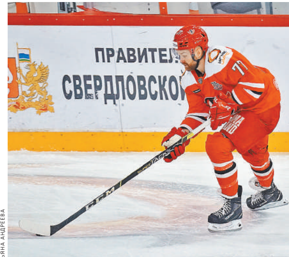
Хоккеисты «Автомобилиста» прервали серию неудач и порадовали своих болельщиков победой над «Авангардом».

— Приятно, что в четырех матчах КХЛ из десяти, выбранных ESPN для показа в октябре, играет «Ак Барс». Команда в каждой игре старается показывать яркий и атакующий хоккей, наш клуб — единственный в Лиге, кто трижды выигрывал Кубок Гагарина. Можно сказать, что это определенный знак качества, и сейчас мы не можем опустить планку ниже. У клуба большая армия болельщиков не только в России, но и за рубежом. Мы надеемся на их поддержку, в том числе и у экранов в Северной Америке. ●