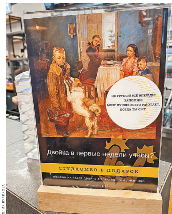
В одном из кафе Миасса решили оригинальным способом поддержать школьников в трудную минуту.

«Двойка в первые дни учебы? Студкомбо в подарок!». Такая акция местного общепита возмутила родителей