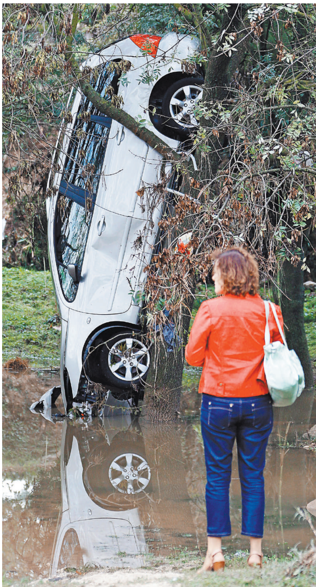
Мошенники отработали новый сценарий, в котором разбивали машины о деревья, а потом имитировали аварию на дороге.

Мошенники придумали новую схему кражи денег у пользователей онлайн-кинотеатров — подробности на сайте rg.ru/art/2181979