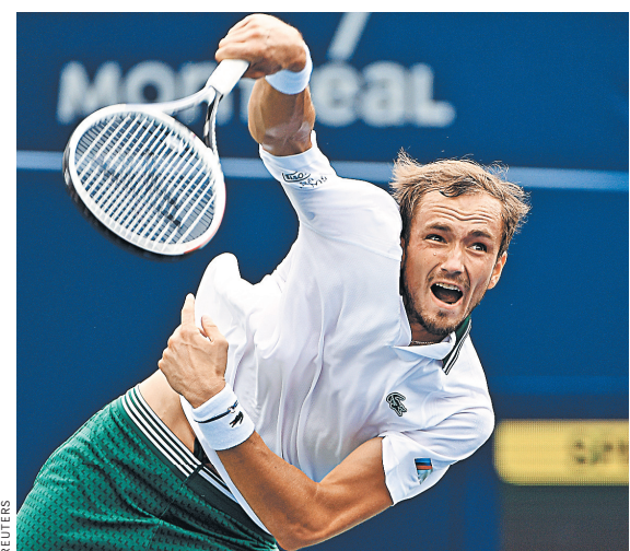
Даниил Медведев считает, что нельзя побеждать на каждом турнире, но выкладываться всегда нужно на сто процентов.

— Я был в топ-10 и хочу туда вернуться. Сейчас это моя главная задача, — подчеркнул Хачанов. — У меня большие цели, и я хочу их достичь. Поэтому очень сосредоточен на том, что мне необходимо сделать. ●