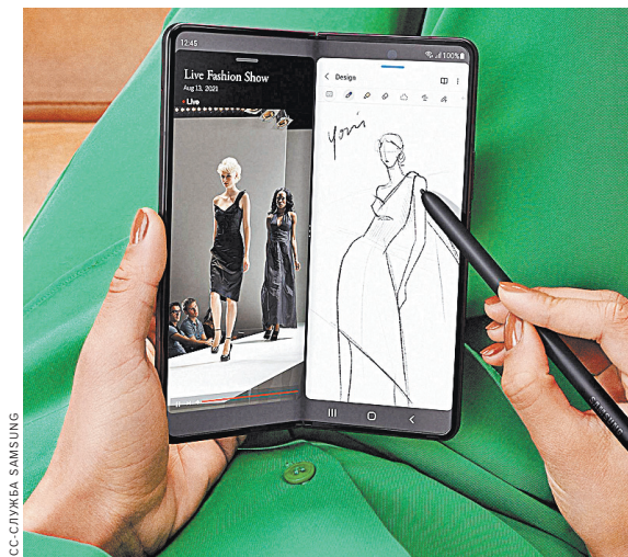
В сложенном виде — обычный смартфон. А в развернутом — почти что полноформатный планшет.