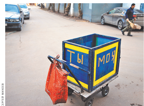
Общедоступные мусорные баки сами могут оказаться на скамье истории. А что делать — не зарастать же чужим хламом.