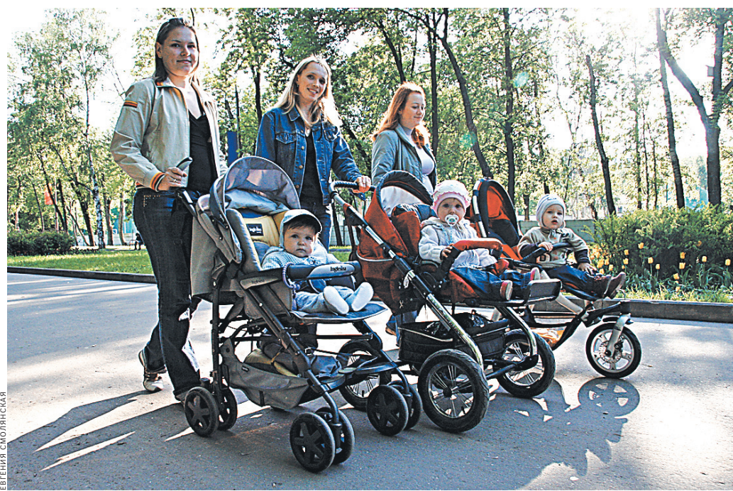
Господдержка молодых семей с детьми уже существенно омолодила не только столицу, но и ряд других регионов.