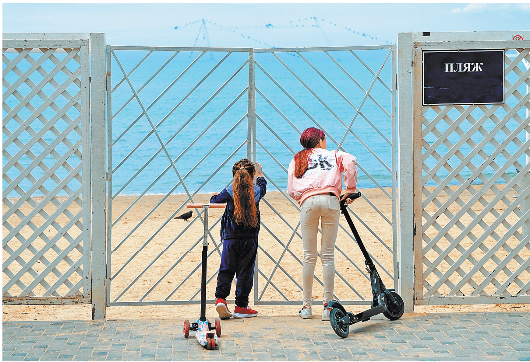
Частных пляжей по закону нет. Но на курортах они — реальность. И «чужим» вход туда закрыт.

1 На этом, как, впрочем, и других крымских оборудованных пляжах отдыхающим, как правило, предлагают и другие услуги: аренда шезлонга (около 200 рублей в день) и зонтика (около полтысячи рублей в день), а также парковка авто на прилегающей к пляжу территории (от 150 рублей в сутки, под навесом — от 300 рублей в сутки).