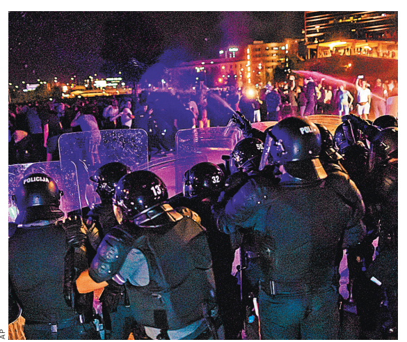
Полиция Литвы отступает перед протестующими, блокирующими здание сейма.

В соседней Латвии также начались акции протеста против ограничений на работу для противников вакцинации. Пока протесты носят мирный характер, но скоро все может измениться. С 1 сентября в Латвии условием для очного обучения во всех учебных заведениях станет наличие у учащихся сертификата COVID-19, подтверждающего факт вакцинации или же перенесенной болезни, или же отрицательный тест на COVID-19.