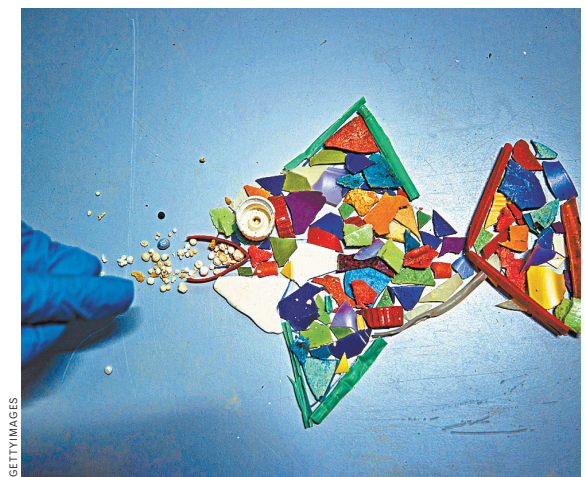
Упаковка станет мусором, как только из нее извлекут товар.

Еще 20 лет назад крупы продавались на развес, добавляет эксперт, затем их стали расфасовывать в стандартные килограммовые мешки. Теперь для каждой