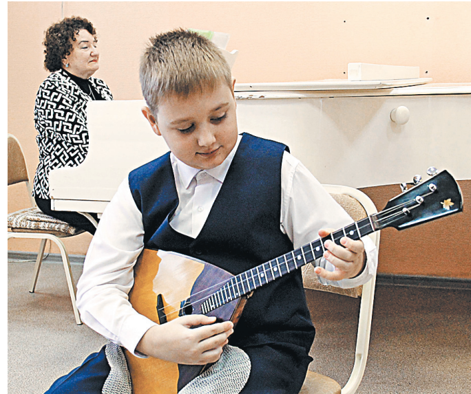
Во многих школах искусств инструменты не обновляли десятилетиями. А теперь есть новенькие балалайки, пианино, гитары, аккордеоны и домры.

Новый спортивный комплекс открыли и в селе Богословка. Доступ к занятиям на профессиональном уровне получают местные ребята. Как знать, может среди них уже подрастает будущий чемпион? ●