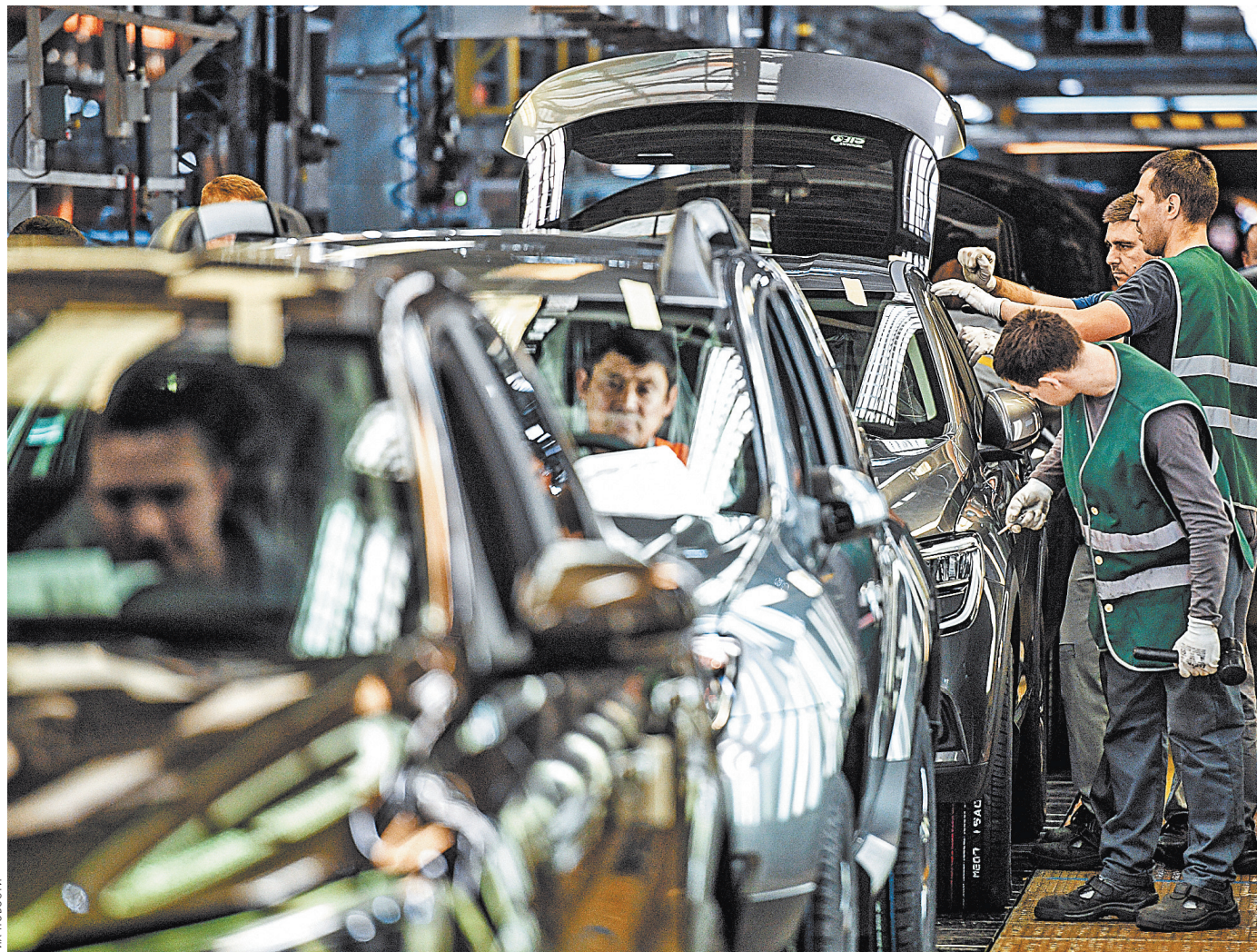
Шесть лет назад с конвейера московского завода «Рено» (на фото) сошел миллионный автомобиль. Сегодня российская «дочка» Renault экспортирует весь модельный ряд, производимый в Москве. Калужская область тоже — один из лидеров по экспорту продукции автопрома. Отсюда в другие страны идут двигатели и легковушки Volkswagen и грузовики Volvo. А из Ярославской, Воронежской и Кировской областей — автошины.