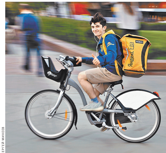
Курьеры студенты работают не только в каникулы: гибкий график позволяет совмещать учебу и разъезды по городу.

Но рекорды по спросу бьет все-таки работа курьером. Например, среди московских курьеров около трети — студенты, а в регионах эта цифра еще больше. Интересно, что курьеры студенты работают не только в каникулы: гибкий график позволяет совмещать учебу и разъезды по городу. Цена вопроса? Самую высокую зарплату предлагают водителям (56 040 рублей), менеджерам (46 980 рублей), курьерам (46 780 рублей), фасовщикам (46 170 рублей). И, кстати, совсем неплохо может получить залето грузчик — почти 41 тысячу рублей. ●