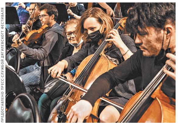
В Перми впервые в России оркестр musicAeterna сыграл тактильный концерт для слепых.

Принципиальное изменение в Гражданский кодекс коснется и статьи по авторскому праву: теперь в ней появится уточнение, разрешающее без согласия автора и без выплаты ему вознаграждения создавать экземпляры произведений в форматах, предназначенных для использования слепыми и слабовидящими лицами (рельефно-точечный шрифт и другие), изготовлять и распространять копии. Главное условие — никакого извращения прибыли и с обязательным указанием имени автора. Законопроект уже внесен в Госдуму. В апреле вопрос доступности большего количества художественных, научных и периодических изданий людям с ограничениями по зрению был поднят в докладе Уполномоченного по правам человека и гражданина Татьяной Москальковой. ●