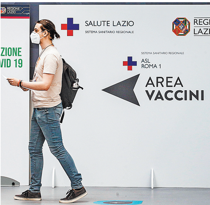
По мнению авторов принятой областной советом региона Марке резолюции, туристы из России имеют такой же иммунитет, что и граждане Евросоюза, привившиеся другими вакцинами.

Вакцину «Спутник V» на данный момент пока не одобрил не только европейский регулятор, но и итальянский (AIFA), хотя представители последнего не единожды публично называли российский препарат «ум-