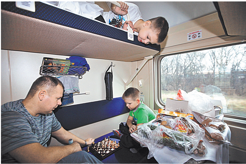
Купить билет со скидкой в купейные вагоны смогут семьи с детьми в возрасте до 18 лет.

Также компания «Российские железные дороги» за счет собственных ресурсов дает скидку в 50% на проезд детям от 10 до 17 лет в плацкартных вагонах в летний период. ●