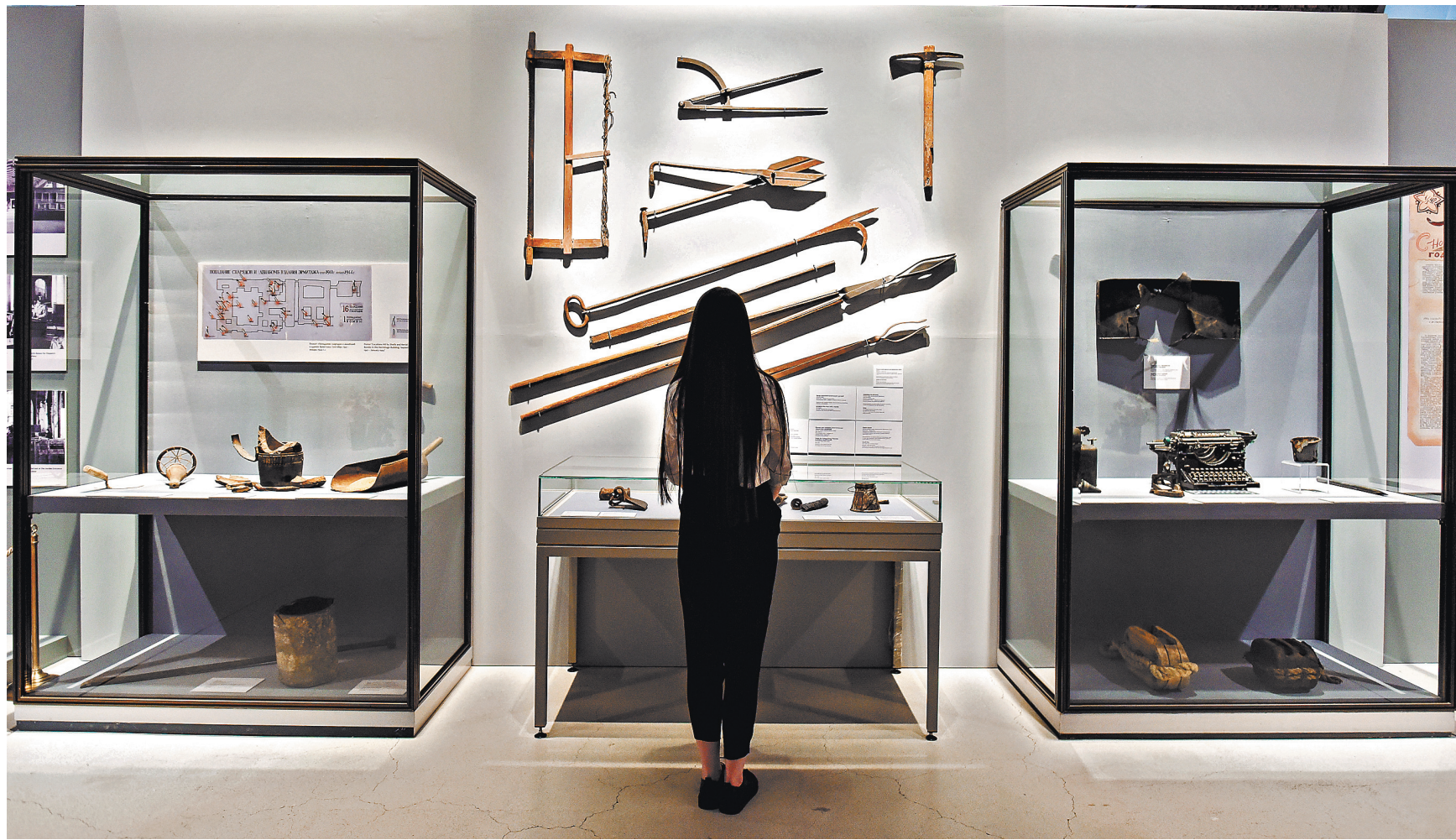
В экспозиции «Будни войны» представлены предметы, с помощью которых спасали Зимний дворец, Эрмитажный театр, все корпуса музея — этими щипцами хватили зажигательные бомбы.