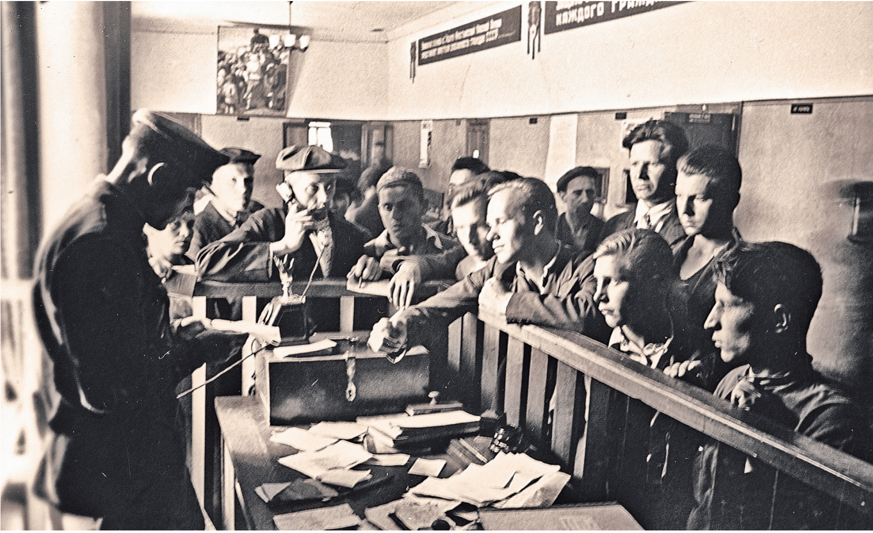
Запись добровольцев в Красную армию в Октябрьском райвоенкомате Москвы.

«мальчишки — хребет победы». Солдаты 1923–1926 годов рождения. «Сержант с Малой Бронной и Витка с Моховой»... Такого феномена не было в предыдущие войны?»