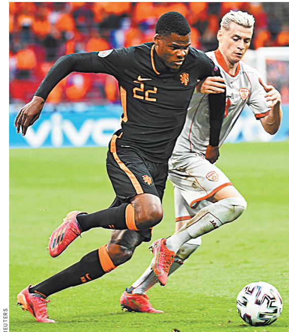
Нидерланды впервые с 2008 года примут участие в плей-офф чемпионата Европы.

Нельзя не отметить работу бывшего тренера «Зенита» Роберто Манчини, возглавляющего итальянскую сборную. После непопадания на чемпионат мира-2018 Манчини принял команду, которой предстояло пережить смену поколений. И пока, если судить по выступлениям Италии, специалист о т л ч н о справляется со своей работой.