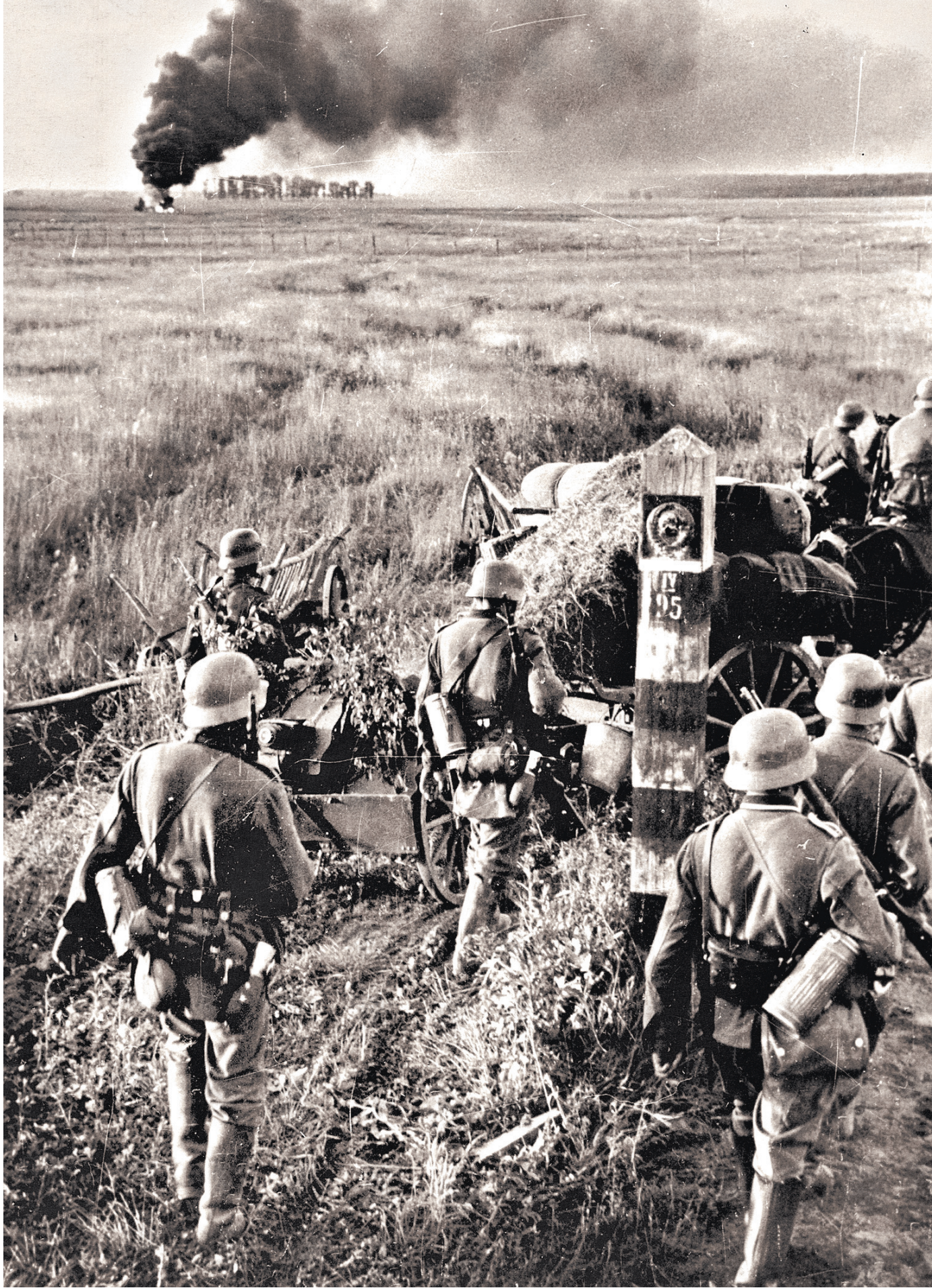
22 июня 1941 года. Немецкие войска переходят государственную границу СССР.

рочной капитуляции, положивший конец Второй мировой войне в Европе». На памятное мероприятие были приглашены послы всех 15 стран бывшего Советского Союза. Посол Украины, а также представители стран Прибалтики отклонили это приглашение. Штайнмайер выступил, на мой взгляд, с мужественной речью: «С первых же дней наступление германских войск было движимо ненавистью: антисемитизмом и антибольшевизмом, расовым безумием в отношении славянских и азиатских народов Советского Союза. Война немцев против Советского Союза была варварством убийц». И далее: «При всех политических разногласиях, при всей необходимости спорить о свободе, демократии и безопасности должно быть место для памяти!» — заявил Штайнмайер. — Я в скорби склоняюсь перед украинскими, белорусскими и русскими жертвами, перед жертвами, которые принесли все народы на территории бывшего Советского Союза».