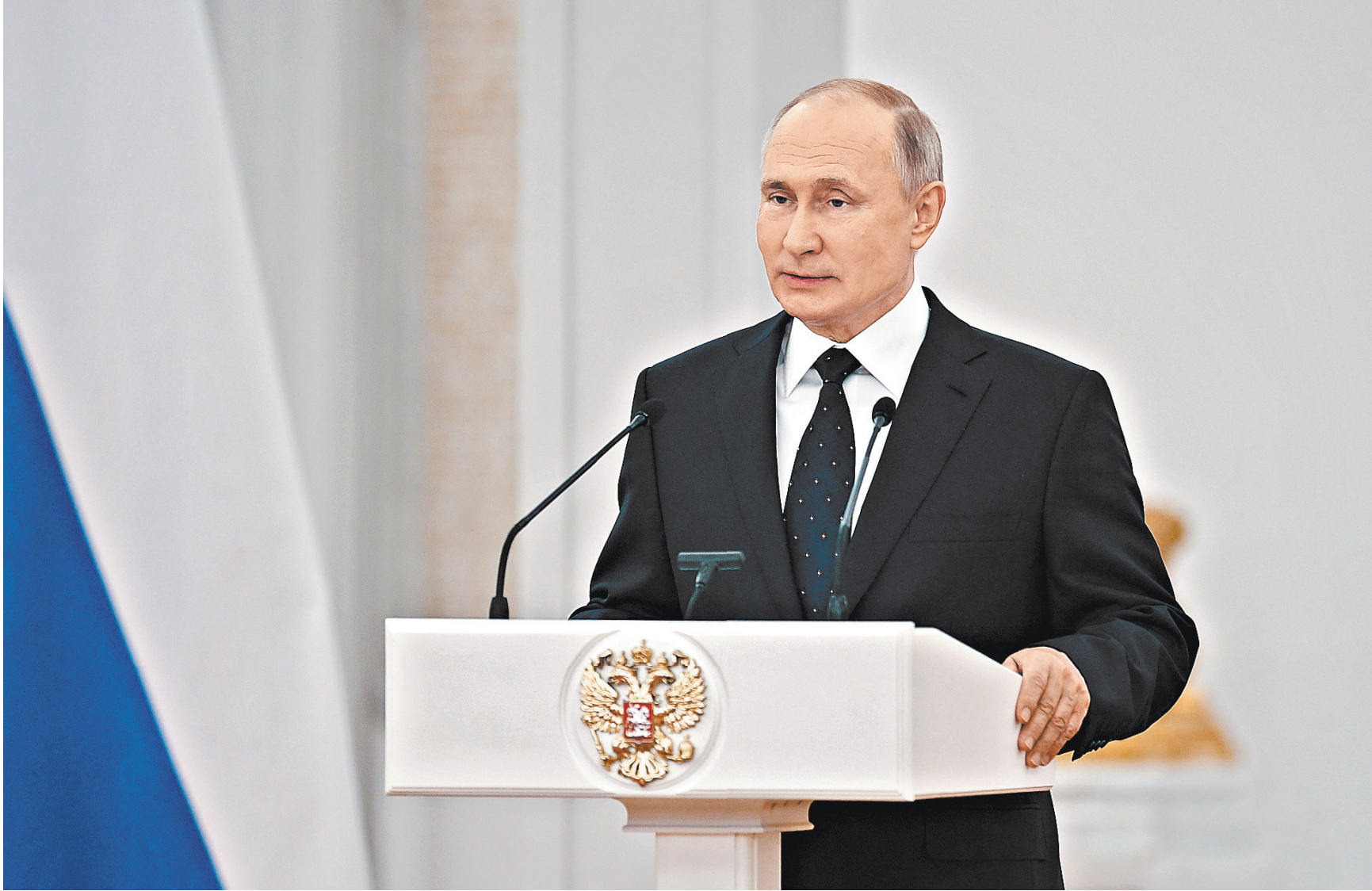
Владимир Путин отметил непрерывную работу парламента в пандемию.

Депутаты Госдумы седьмого созыва работали согласованно и эффективно, а в условиях пандемии народные избранники принимали законы «без пауз», в результате чего поддержка государства дошла до граждан и отраслей экономики. Об этом Владимир Путин говорил на встрече с депутатами Госдумы. Российский лидер встретился с народными избранниками в Георгиевском зале Большого Кремлевского дворца. На этот раз президент решил изменить формат подобных встреч в Кремле — раньше общение, как правило, проходило с участием только лидеров фракций. «Он посчитал целесообразным обратиться именно к полному составу Думы, учитывая активность Думы и просто расширяя общение», — объяснил журналистам пресс-секретарь главы государства Дмитрий Песков.