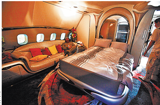
28 августа 2011 года. Ливийский повстанец позирует в интерьере спальни, находящейся в личном самолете Каддафи.

Личный самолет ливийского лидера Муаммара Каддафи, убитого в 2011 году, вернулся в Ливию. Долгое время лайнер Airbus A340, известный как «летающий дворец», находился во Франции. Изначально его туда направили для ремонта — во время боя за Триполи самолет получил повреждения. Ремонт осуществили довольно быстро, но вернуть сразу самолет в Ливию помешали судебные споры. Однако в 2015 году французский суд постановил, что данный лайнер принадлежит временному правительству Ливии, а потому на него распространяется дипломатическая неприкосновенность. В итоге Airbus A340 так и остался стоять в аэропорту французского Перпиньяна. Осенью 2020 года самолет прошел техобслуживание и несколько часов пролетел в воздухе. В Триполи бывший самолет Каддафи, на фюзеляж которого до сих пор нанесен номер 5A-ONE (борт номер один), встречал премьер Абдель Хамид Джебба. Изначально лайнер принадлежал Джеффри Болкиаху, брату султана Брунея, затем его приобрел саудовский принц Аль-Валид ибн Талал, и лишь потом он попал в руки Каддафи. На борту самолета есть джакузи, кинотеатр, огромная кровать. В самолете можно разместить до 50 гостей, именно столько кресел первого класса установлено в хвосте самолета, однако этой возможностью Каддафи, в отличие от предыдущих владельцев, не пользовался.