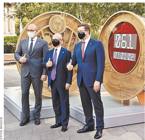
Часы, установленные неподалеку от памятника Минину и Пожарскому, придут к своей конечной «точке» 21 августа, дав старт началу празднования. «Для меня Нижний — любовь с первого взгляда и на всю жизнь. Завидую тем, кто впервые приедет туда на праздник», — отметил первый заместитель руководителя администрации президента РФ Сергей Кириенко. Кстати, часы выполнены по мотивам работ знаменитого изобретателя Ивана Кулибина, уроженца Нижнего Новгорода.