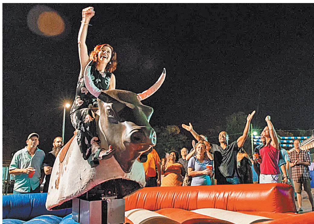
Азартный аттракцион для толпы или пытка для его участников?