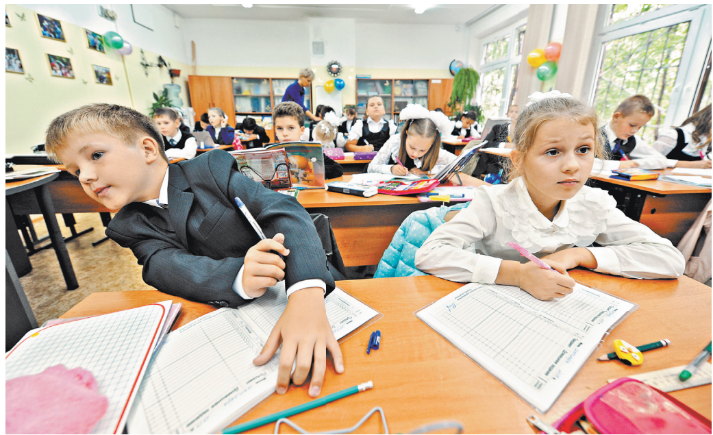
Без внимания и усидчивости первоклашке придется туго — всему остальному он легко научится в школе.