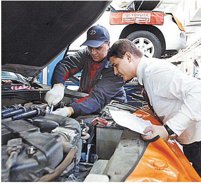
Если неисправность нельзя выявить на дороге без специального оборудования, то и наказывать за нее нельзя, считает минэкономразвития.

цепного устройства он может задержать транспортное средство до устранения неисправности. Однако и это не главная проблема данного документа. Он вносит изменения в постановление Правительства, утвердившего Правила дорожного движения. А в это постановление вносить правки, согласно другому постановлению правительства, нельзя. Требуется переиздать документ целиком. И в проекте это учтено. Там предлагается сделать исключение для Правил дорожного движения. Но именно это исключение не было пока еще никем поддержано. Напомним, что ранее этот документ должен был рассматриваться на рабочей группе Аналитического центра при правительстве РФ по регуляторной гильотине. Но до рассмотрения так и не дошел. МВД решило поправки доработать. Сейчас минэкономразвития дало отрицательный отзыв на него. Если это ведомство создаст совместно с МВД согласительную комиссию, решит все вопросы, то документ снова зайдет в рабочую группу по регуляторной гильотине. Но шансов, что он ее пройдет, в том числе и из-за попытки исключить Правила дорожного движения из перечня актов, которые нельзя изменять, пока представляются небольшими. ●