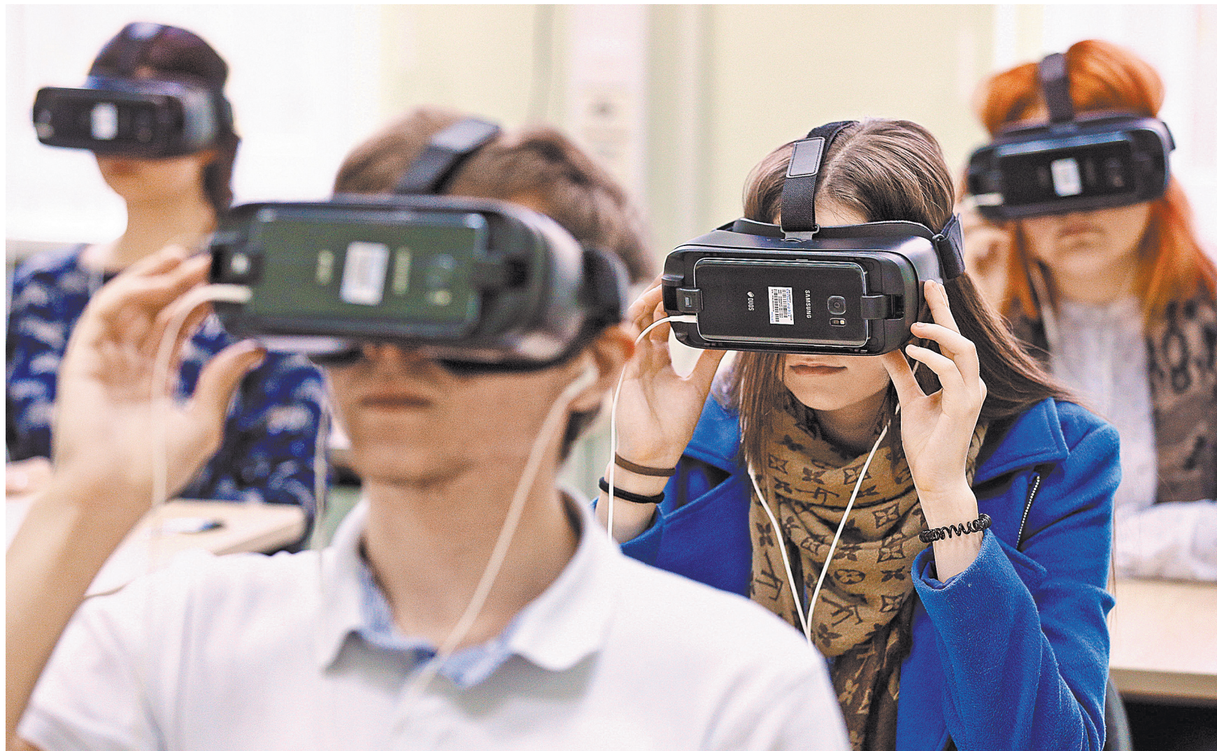
Виртуальные курсы не заменяют педагога. Это лишь инструмент, который помогает закрепить знания и навыки.