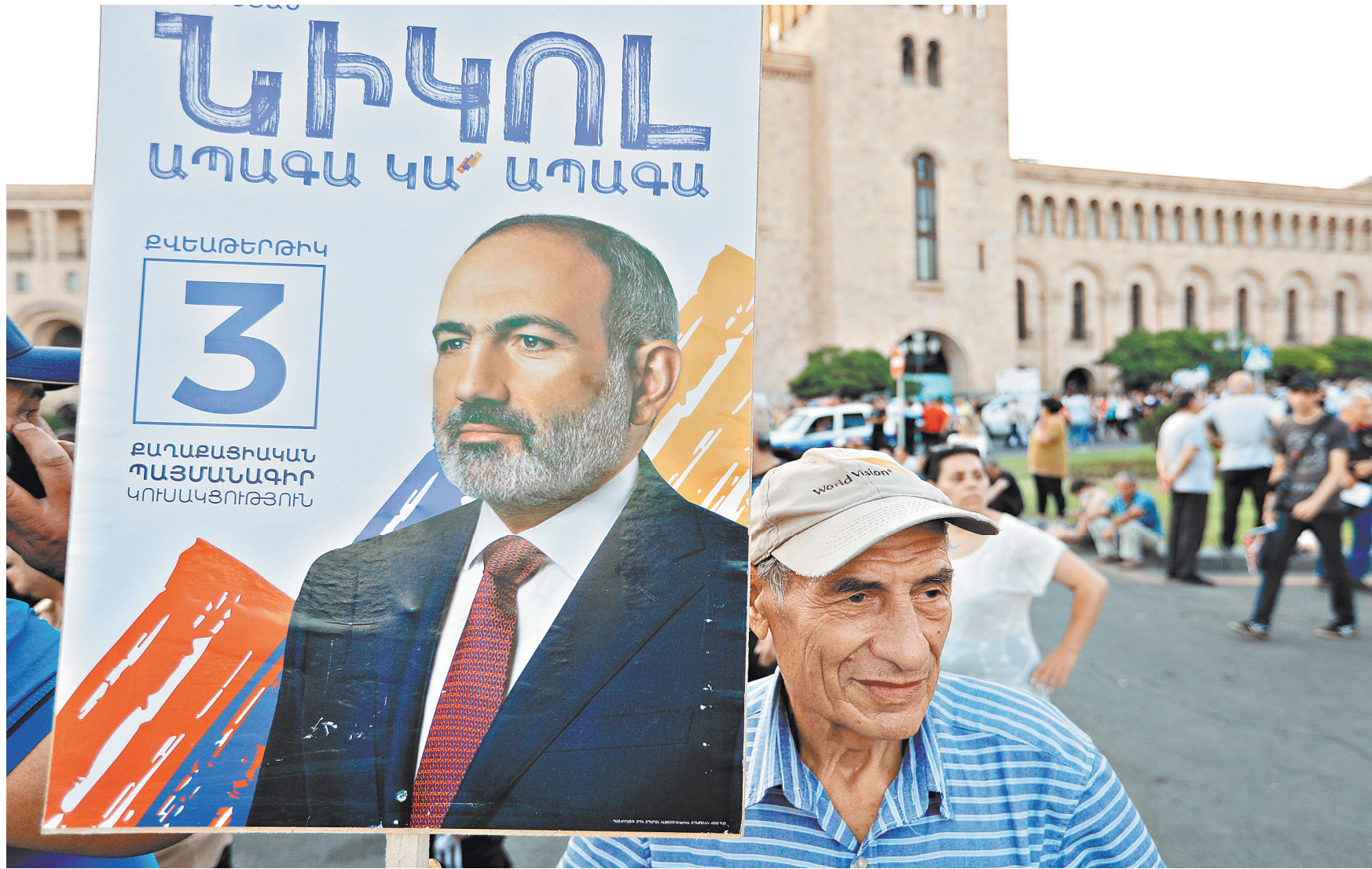
Хотя Пашинян и одержал победу, в парламенте порядка 30 процентов мандатов будут иметь его непримиримые противники.