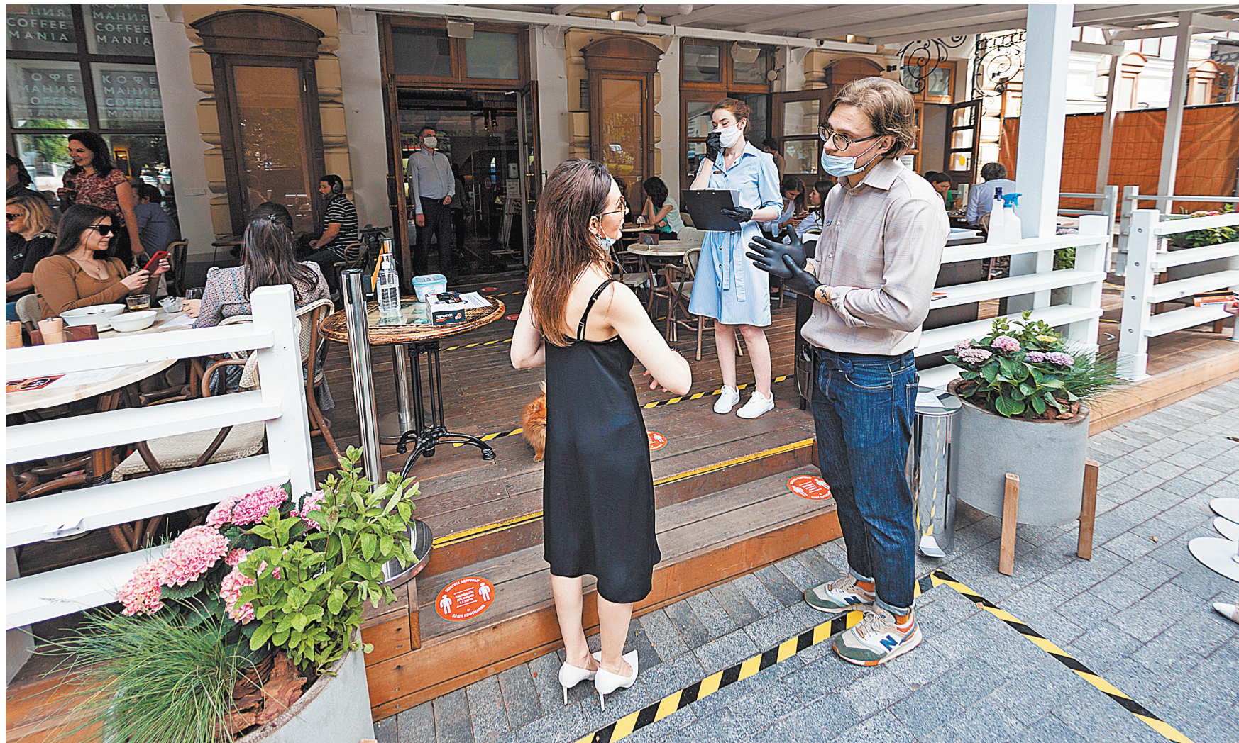
Нам всем пора привыкать к тому, что отдыхать спокойно можно будет только привившись.