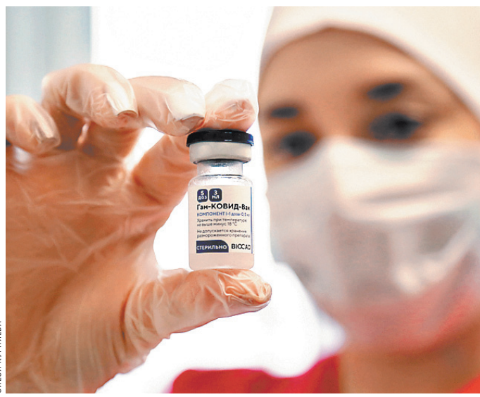
При подъеме заболеваемости ревакцинироваться нужно раз в полгода.