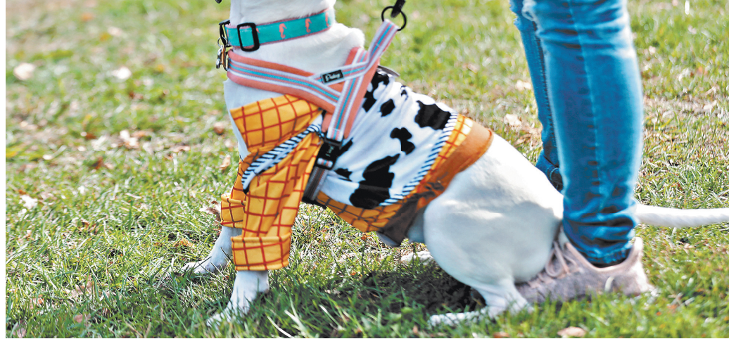
Этот пес еще не знает, что вскоре ему придется гулять по новым правилам.

Ни зверь, ни его хозяин не должны позволять себе на улице ничего лишнего. Это аксиома. Тем не менее практика показывает, что «лишнего» люди и звери нет-нет да и позволяют себе.