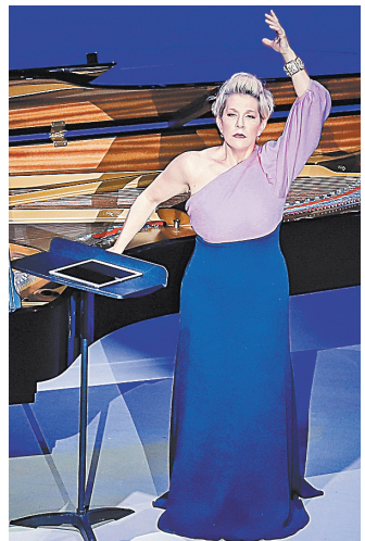
Джойс Дидonato привезла в Россию новую программу In My Solitude («В уединении»).

Со странички программы концерта Дидonato обращается к публике: «Дорогие друзья! Предлагаю сегодня вновь побывать в том месте, где находилось человечество последние 15 месяцев, — в месте уединения. Очень важно освоить опыт и трудности, которые мы пережили, — но, возможно, еще большее значение имеет возвращение к красоте и к жизни... Независимо от обстоятельств мы всегда можем выбрать любовь и свет. Дидonato в пространстве оперного театра прекрасно себя чувствует и выглядит в мейнстримном репертуаре. Но когда готовит свои концертные программы, то, как правило, поднимается на недостижимый уровень подлинной сакральности в искусстве. Новая, постапеллицианская программа певицы, на первый взгляд, кажется чистой эстетикой: кантата Гайдна «Ариадна на Наксосе», две арии Клеопатры из опер Хассе и Генделя, монол Дидо из «Троянцев» Берлиоза соседствуют с мажорескими песнями на стихи Рюккерт и кроссовыми номерами (In My Solitude Дюка Эллингтона и La Vie en Rose из репертуара Эллит Пинаф, что прозвучало в джазовой обработке Крейга Терри под грифом «Кабаретные песни».