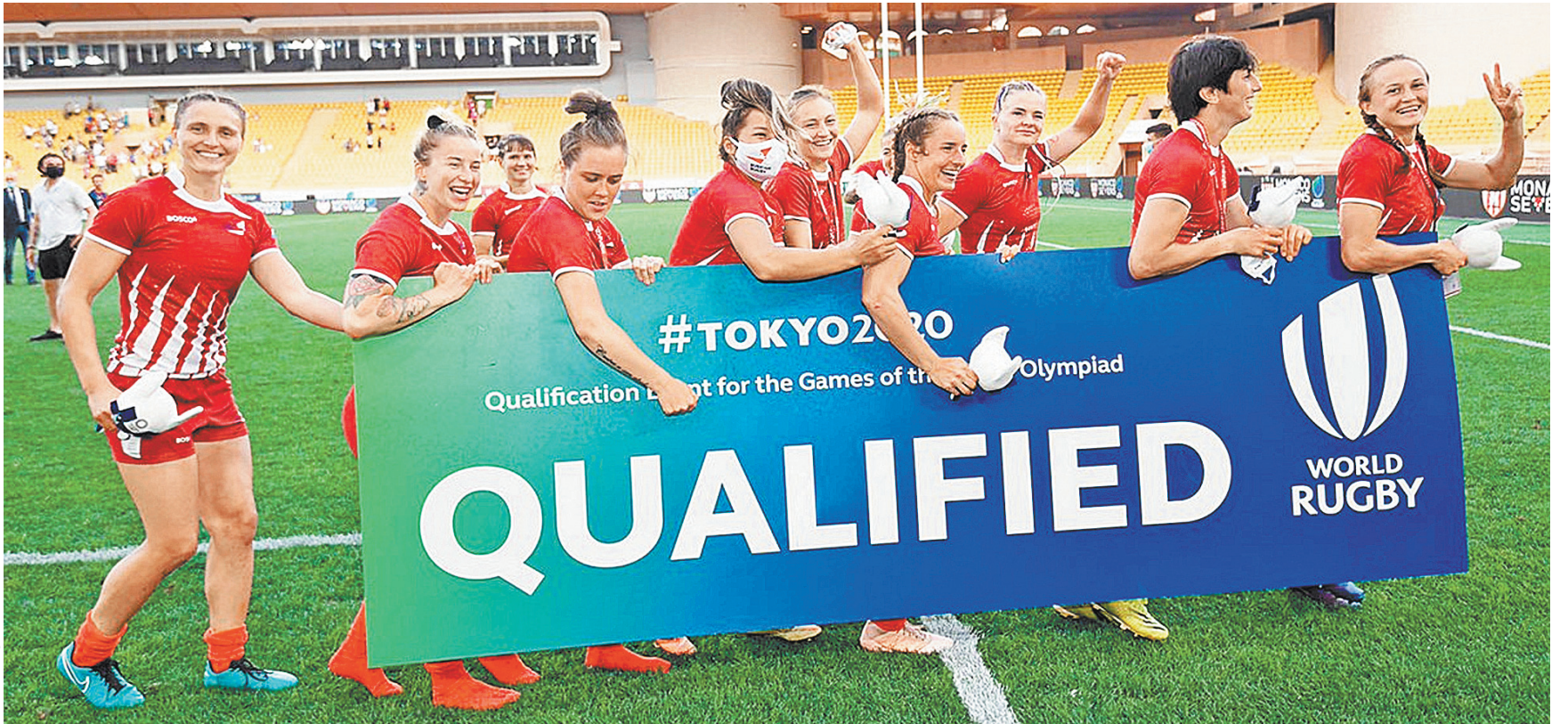
У наших регбисток эмоции были 5–10 минут. Потом все успокоились, потому что надо начинать настраиваться на Олимпийские игры.