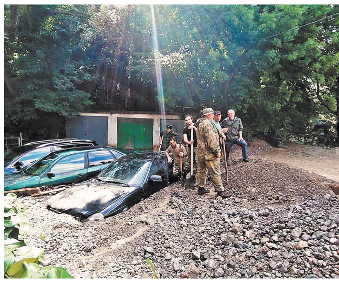
Волонтеры и казаки помогают пострадавшим справиться с последствиями стихии на улицах Ялты.