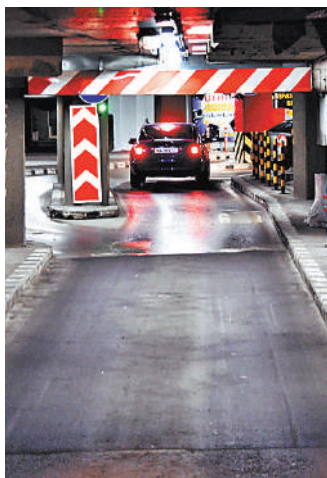
На одно парковочное место легко могут претендовать девять покупателей.

Власти Москвы сняли ограничения на покупку машино-мест, принадлежащих городу. Как сообщили в пресс-службе Центра управления городским имуществом, если раньше по преимущественному праву на семью можно было приобрести лишь два места, то теперь — сколько угодно. Как уже писала «РГ», с 1 января 2017 года машино-место считается равно такой же собственностью, как квартира или комната. Его можно подарить, продать, сдать, обменять и все это официально на основании документов. В Москве одна часть машино-мест в подземных парковках или в многоуровневых паркингах рядом с домами частная, а другая государственная. Периодически город как собственник эти места продает через электронные площадки. Что это дает? Во-первых, освобождает дворы от машин. Во-вторых, горожане получают шанс сэкономить на покупке сотни тысяч, а в отдельных районах — и миллионы рублей. И хотя сейчас мэрия взяла курс на приоритет общественного транспорта, каршеринга и такси, многие семьи по-прежнему нуждаются в машино-местах. Конкуренция на торгах по паркингам достигает девяти заявок на один лот.