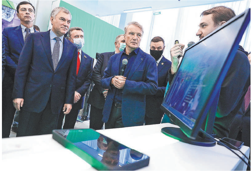
Вячеслав Володин и председатель правления ПАО «Сбербанк» Герман Греф познакомились с IT-новинками.

На площадке Корпоративного университета Сбербанка в Аносино депутаты не только обменялись мнениями с экспертами, но и смогли, как говорится, «пощупать» новые технологии на выставке. Среди прочего им показали передовые решения по распознаванию речи и лиц, интеллектуальную транспортную систему, а также программу, которая позволяет оценивать важность электронных писем. Многие на выставке касалось пандемии — среди экспонатов оказался робот-дезинфектор, система для диагностики коронавируса по звукам кашля/голоса/дыхания и многое другое. Например, Жириновский обратил внимание на робота, который сообщает температуру воздуха на улице. «А я спросил — какая она в помещении. Все, он в тупике!» — посетовал политик на «недоработки».