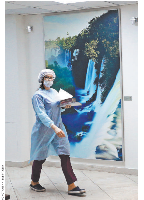
Красота лечит — зная это, уже многие клиники России проводят выставки фотографических и художественных работ.

Выставка открыта всю зиму. А потом снежную Камчатку сменяет ее летние виды.