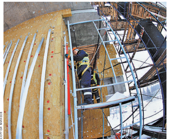
Общая площадь стадиона после реконструкции увеличится сразу в пять раз.

В подтрибунном пространстве разместятся помещения для спортсменов и судей, а также стрелковая галерея с возможностью стрельбы в трех направлениях. Модернизируют строители и легкоатлетическое ядро стадиона. В нем появятся беговые дорожки — круговая на восемь полос и прямая на десять полос, а также секторы для прыжков в длину, в высоту и с шестом, метания колья, диска, молота и толкания ядра. Все это позволит проводить здесь соревнования не только российского, но и международного уровня, подчеркнул Собянин. И напомнил: «В Москве проводится большое спортивное строительство. В части футбольных полей и футбольных стадионов в городе построено уже четыре стадиона международного уровня, семь полей круглогодичного использования с подогревом и соответствующей инфраструктурой». В частности, за эти годы завершена реконструкция и сооружение для большого футбола Большой спортивной арены «Лужники», «Динамо», «ВЭБ Арена» (ЦСКА), «Открытие Арена» (Спартак) и «Локомотив». Теперь же столица приводит к такому же высокому классу и стадионы, расположенные в спальных районах. ■