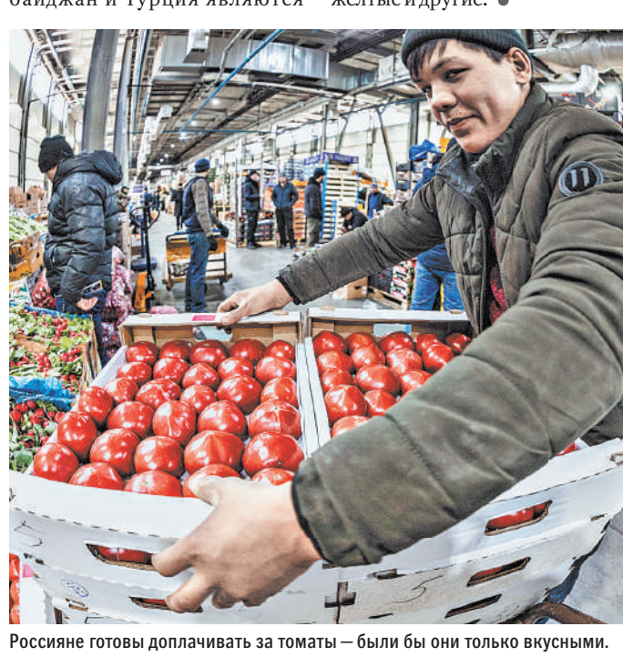
Россияне готовы доплачивать за томаты — были бы они только вкусными.

В конце прошлого года Россельхознадзор сначала ввел запрет, а потом частично его снял на поставки томатов из Азербайджана и Узбекистана из-за обнаруженных в них опасных вирусов. По той же причине были запрещены поставки томатов и перцев из двух провинций Турции. Между тем Азербайджан и Турция являются основными импортерами томатов в Россию. По данным Федеральной таможенной службы, доля Азербайджана в общем объеме поставок томатов составляла более 30%. Доля Турции оценивается в 17%.