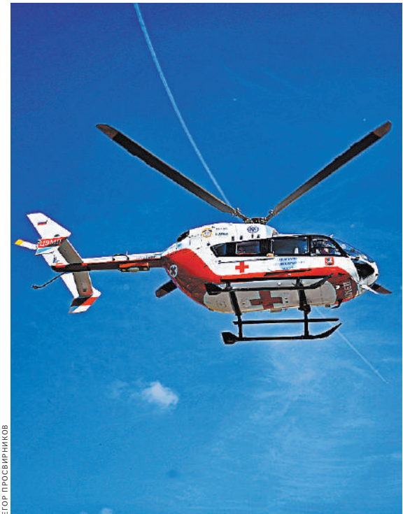
Помощь прилетела на вертолете.

В 2020 году на Чукотке вертолетами эвакуировали 700 пациентов. Большинство — из труднодоступных местностей, куда можно добраться только по воздуху.