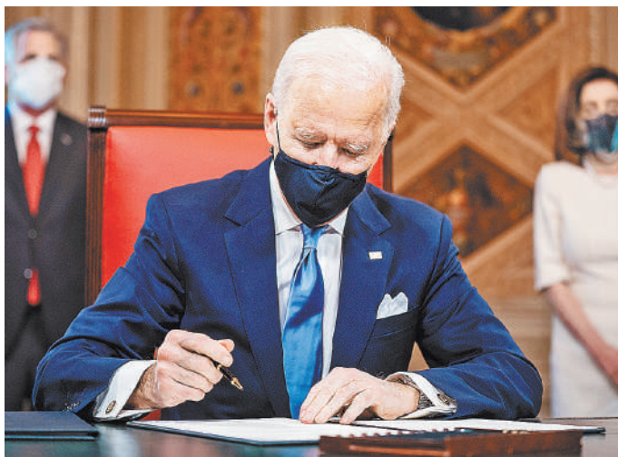
Сразу после присяги президент Байден подписал в Капитолии три указа: об инаугурации, о назначениях членов кабинета и их заместителей.

Всего в первый день президентства Байден подписал сразу 17 исполнительных указов. Не менее показательными стали и первые кадровые назначения. Выдвинувший 78-летнего Байдена на ключевые правительственные посты еще с начала недели буквально осаждающий конгресс США, в различных комитетах которого одновременно идет заслушивание кандидата на должность главы Пентагона (отставной генерал-аэрофранкаец Ллойд Остин), Госдепа (Энтони Блинкен) и министерства внутренней безопасности (Александр Майоркас).