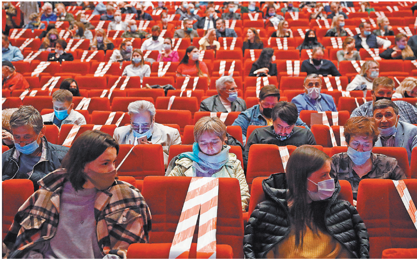
Театры, кинотеатры и концертные залы теперь могут заполняться наполовину, а не на четверть.