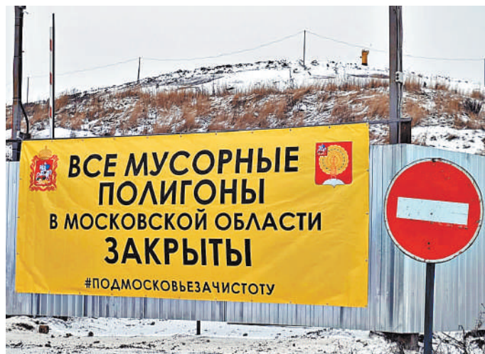
По большому счету, это фото в подписи не нуждается.