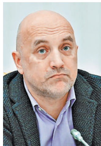
Лидер партии «За правду» Захар Прилепин.