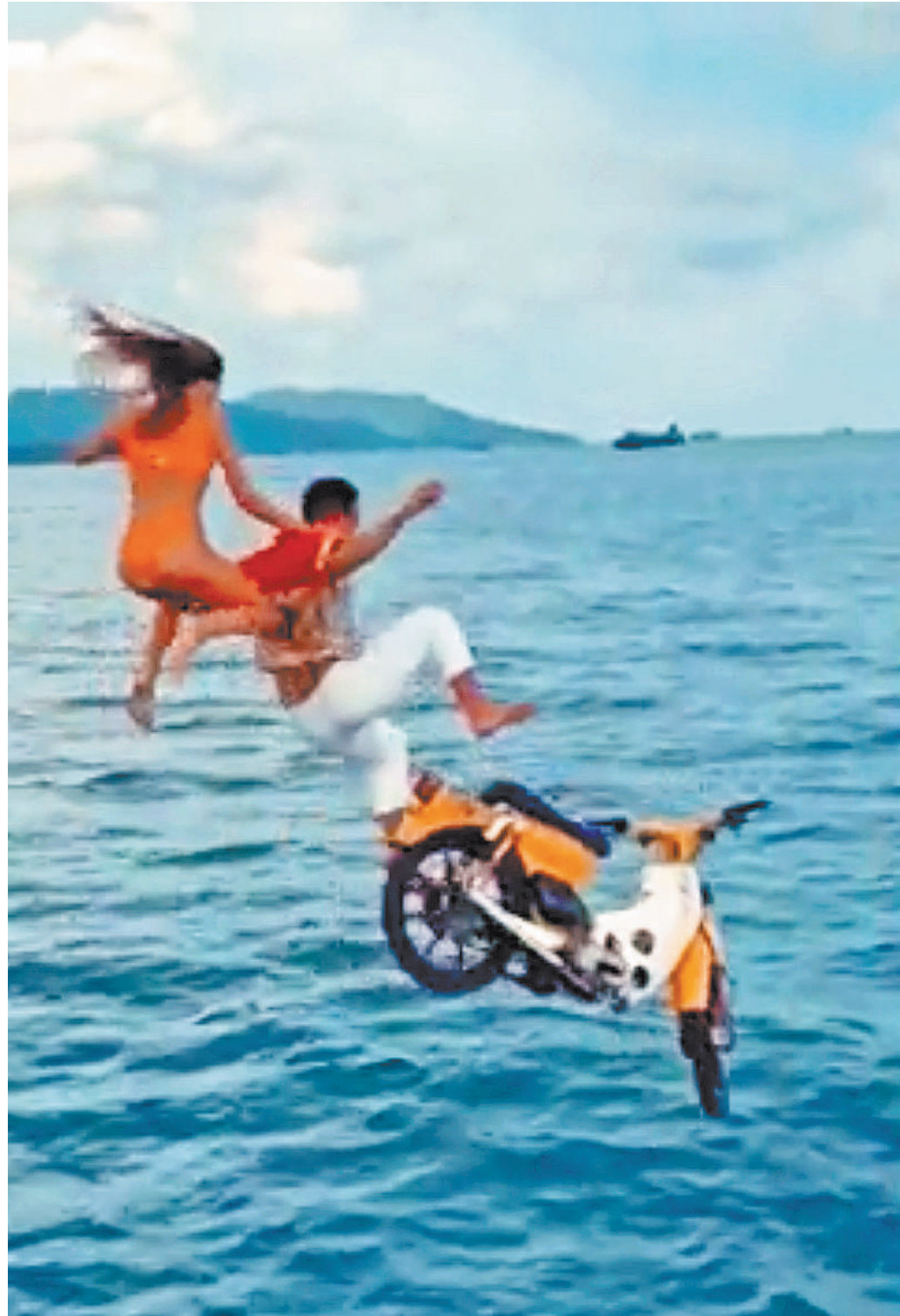
Необходимо снизить аудиторию такого рода контента и оперативно пресекать его распространение.