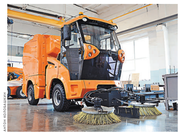
Спрос на отечественную коммунальную технику становится больше.

Заводчане нашли в организации труда много пробелов, которые в текущее не замечали