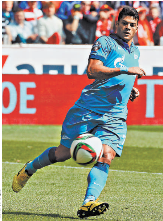
В составе «Зенита» Халк выиграл чемпионат, Кубок и Суперкубок России.

Однако существует несколько версий относительно количества голов бомбардиров прошлых лет. Рекорды Пеле и Бицана пали по подсчетам, в частности, ESPN и футбольного портала Squawka. По другим версиям, на счету Пеле, Бицана, а также экс-нападающего сборной Бразилии Ромарио больше голов, и Роналду до их рекорда пока не добрался.