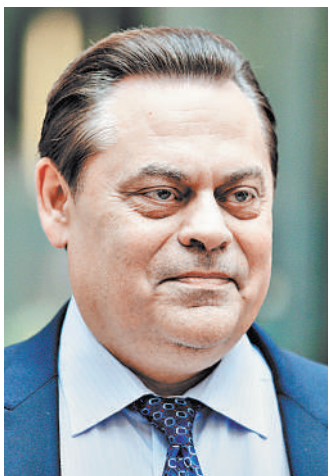
Глава «Патриотов России» Геннадий Семигин.