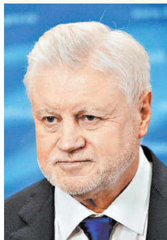
Председатель «Справедливой России» Сергей Миронов.

Коалиция создается на базе «Справедливой России». Как заявил Миронов, это принципиальное решение согласовано с лидером «За правду» Захаром Прилепиным и главой «Патриотов России» Геннадием Семигиным. «Это значит, что в момент проведения трех съездов две другие партии примут те или иные юридические решения, в результате которых они как политические партии в тот день прекратят свое существование», — уточнил Миронов. Он добавил, что, возможно, «Патриоты России» и «За правду» захотят оставить общественные движения с таким названием. Однако юридически они перестают существовать.