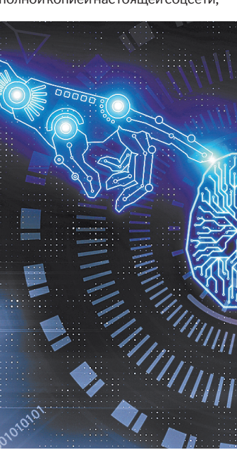
Искусственный интеллект присутствует во всех соцсетях.

«Это вмешательство дает людям возможность задуматься и отменить свой комментарий», — отмечает Адам Моссерри, руководитель Instagram. — Из ранних тестов этой функции мы обнаружили, что она побуждает некоторых людей отменить свой комментарий и поделиться чем-то менее вредным, как только у него появляется возможность подумать». Также есть вариант поставить настройки так, что посты обидчика будут видны только ему.