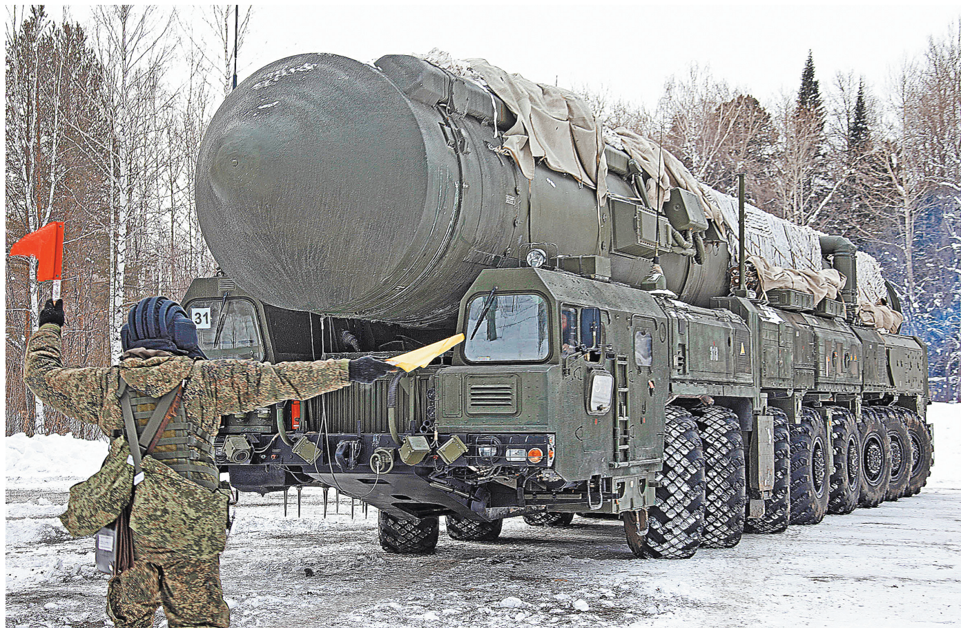
Создание и развитие мобильных ракетных комплексов стратегического назначения стало визитной карточкой Московского института теплотехники.