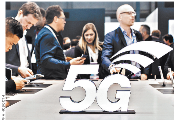
Сети 5G будут использовать в основном российское оборудование.

Выступая перед сенаторами, он коснулся еще одной злободневной темы, а именно — обеспечения школ интернетом. Действующая программа предусматривает доведение оптоволоконного кабеля до здания, а разводку по кабинетам — нет. «Со следующего года у нас начнется массовое строительство Wi-Fi-сетей в каждой школе», — проинформировал Максут Шадаев. Он уточнил, что это будут защищенные сети, пользоваться ими смогут только учителя. «Фактически мы говорим о том, что интернет должен прийти не в школу, а в каждый класс», — подчеркнул он.