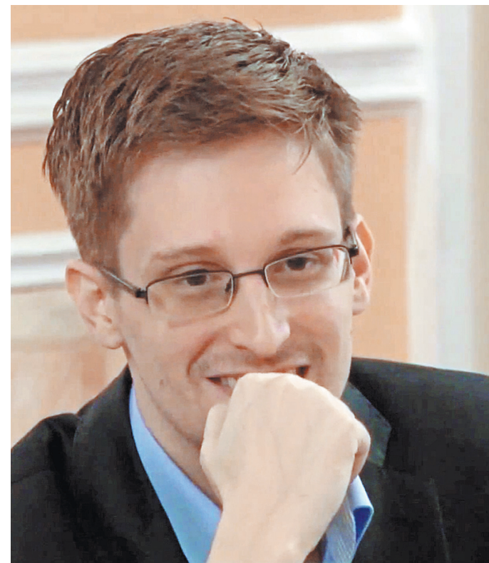
Все эти годы Эдвард Сноуден жил в России, продлевая регулярно вид на жительство.

ден направил запросы на получение убежища властям ряда стран, в том числе России. Сноуден сначала бежал из США в Гонконг, а затем — в Россию. 1 августа 2014 года он получил вид на жительство в РФ на три года, который позднее был продлен на такой же срок. В США Сноудену инкриминируется нарушение двух статей закона о шпионаже. По каждому из этих пунктов ему грозит до 10 лет заключения. В администрации США неоднократно заявляли, что считают Сноудена предателем и не собираются прощать его, поскольку он нанес серьезный ущерб интересам национальной безопасности.