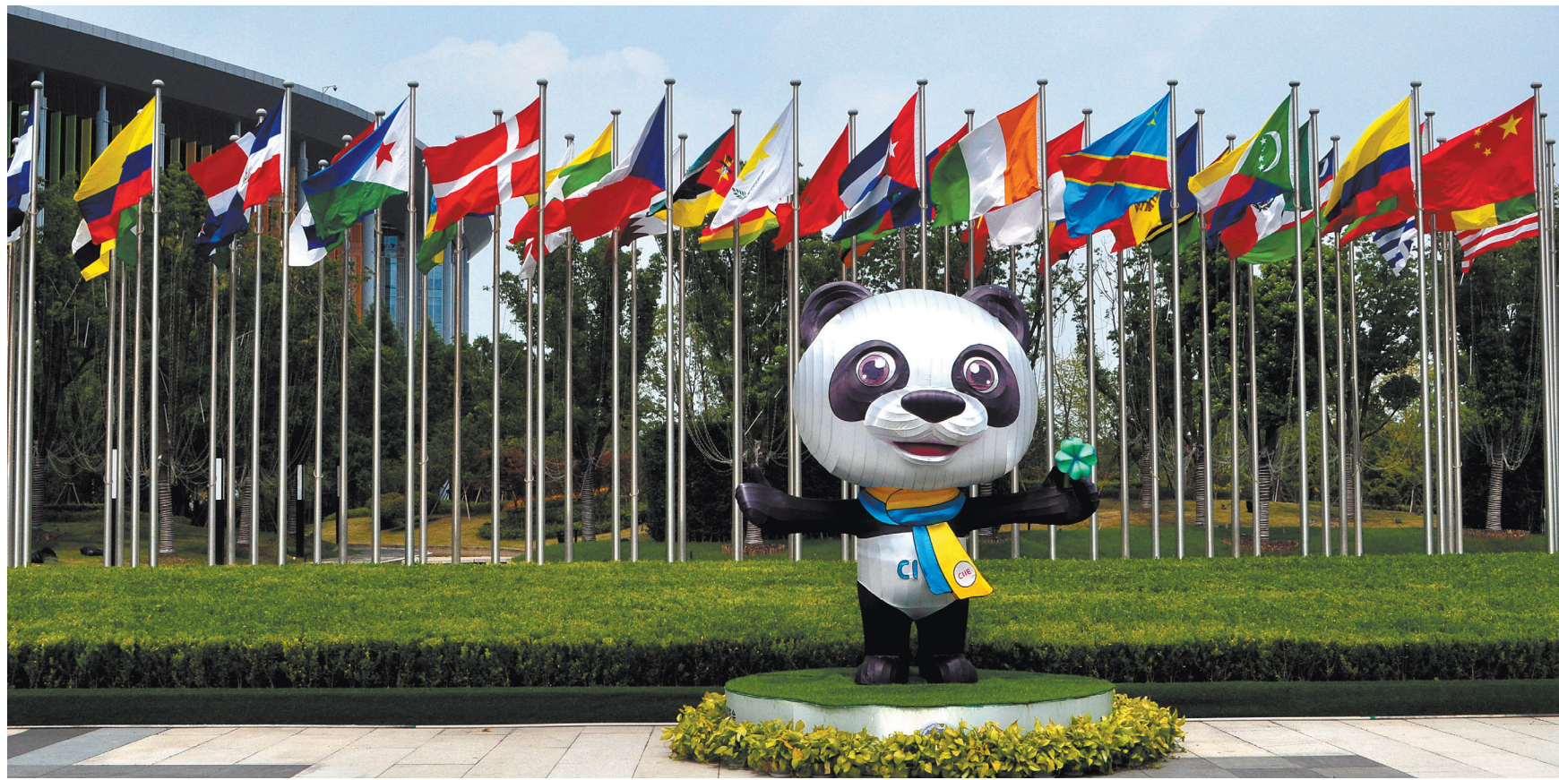
В Шанхайском национальном конгрессно-выставочном центре, где пройдет Третья Китайская международная импортная выставка, все готово к ее открытию.

По данным Управления Китайского международного импортного ЭКСПО, выставочная площадь, заброшенная участниками-предприятиями в