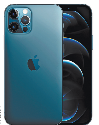
iPhone получил обновленный дизайн.

Для фанатов Apple осень — это почти как Новый год. «Яблочная» компания показывает множество устройств, и, безусловно, самые ожидаемые из них — это линейка новых iPhone. Цикл дизайна X, Xs и iPhone 11 подошел к концу, и в линейке iPhone 12 компания показала новый, но при этом так хорошо узнаваемый дизайн — в гаджетах угадывается отсылка к легендарному iPhone 4. На тест к «РГ» попала версия iPhone 12 Pro в исполнении «Тихоокеанский синий». Можно смело предположить, что этот цвет станет одним из хитов сезона, так как уже сейчас, спустя всего несколько дней после начала продаж, достать его невероятно трудно. Модель получила множество улучшений и нововведений.