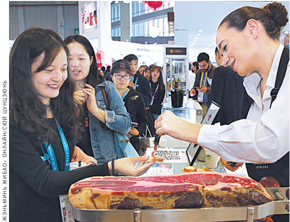
Посетители второй Китайской международной импортной выставки с большим интересом дегустировали ветчину из Испании.

На первой Китайской международной импортной выставке сладкий золотой панамский ананас завоевал расположение многих потребителей и импортеров. Вскоре после проведения Первого ЭКСПО правительства Китая и Панамы официально подписали протоколы о фитоса-