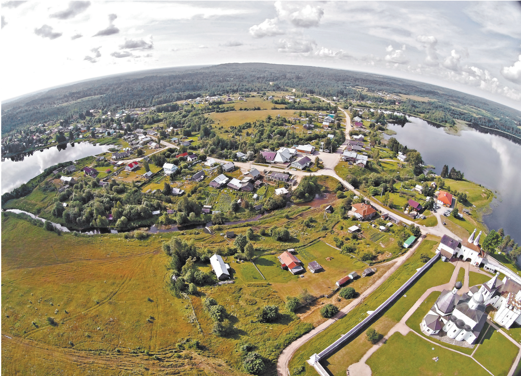
Знаменитый Ферантонов Богородице-Рождественский монастырь основали еще в 1398 году. Его расписал известный иконописец Дионисий с сыновьями. Он создал их за 34 дня в виде иконостаса и стенописа собора. Кстати, фрески — это единственная стенопис Дионисия, дошедшая до нашего времени. И они включены в перечень объектов Всемирного наследия ЮНЕСКО.

Сразу несколько деревень Русского Севера, и в том числе Вологодчины, получили в 2020 году статус самых красивых. Его присуждает Ассоциация самых красивых деревень России. Одна из них — Ферантово (на фото справа). Улочки выются вдоль берегов сразу двух озер, а на возвышенности — знаменитый Ферантонов Богородице-Рождественский монастырь. В трех километрах от села расположена Цыпина гора. Ее высота — 204 метра над уровнем моря. С нее как раз и открывается вид на Ферантово с высоты птичьего полета. И это самая высокая точка не только в ближайшей округе, но и во всем национальном природном парке «Русский Север». Кстати, некоторые жители утверждают, что в ясную погоду с Цыпиной горы можно заметить блеск золотых куполов Софийского собора в Вологде. А до него чуть больше ста километров. Без прошлого нет будущего, решили в Ассоциации самых красивых деревень и запустили этот проект, чтобы привлечь внимание государства и общества к тому, что в России есть уникальные места, которые могут исчезнуть. Нужно сохранить их для того, чтобы помнить свои корни, не разрывать связь поколений. Для этого деревням в российской глубинке присваивается статус самых красивых, который при умном подходе помогает зарабатывать на туризме и реализации местной продукции. Корреспонденты «РГ» выяснили, чем эти территории привлекательны для туристов и потенциальных переселенцев.