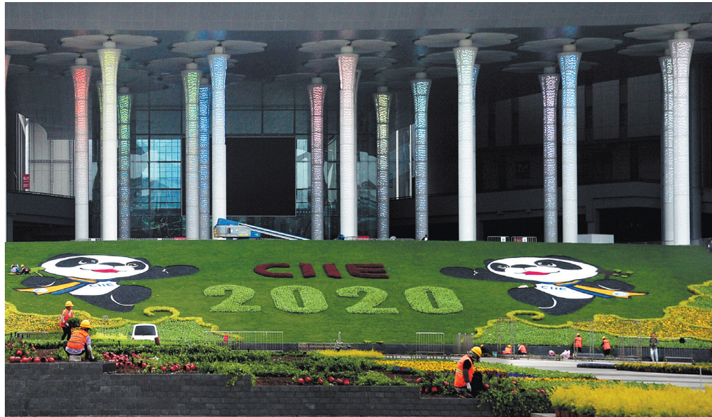
Садовники украшают картинами из живых цветов площадь у Шанхайского национального конгрессно-выставочного центра, где пройдет международная импортная выставка.

«Организация ЭКСПО в установленные сроки является ярким доказательством того, что Китай первым в мире подавил эпидемию COVID-19 и его экономика имеет тенденцию к долгосрочному развитию. Мы с оптимизмом смотрим на перспективы развития КНР», — сказала Фань Цзяюй. Estee Lauder усиливает подготовительные работы к Третьему ЭКСПО. Компания расширяет площадь выставочного стенда примерно на 100 квадратных метров, 14 брендов Estee Lauder будут коллективно представлены на стенде. Кроме того, компания впервые в глобальном масштабе презентует ряд новых, созданных с помо-