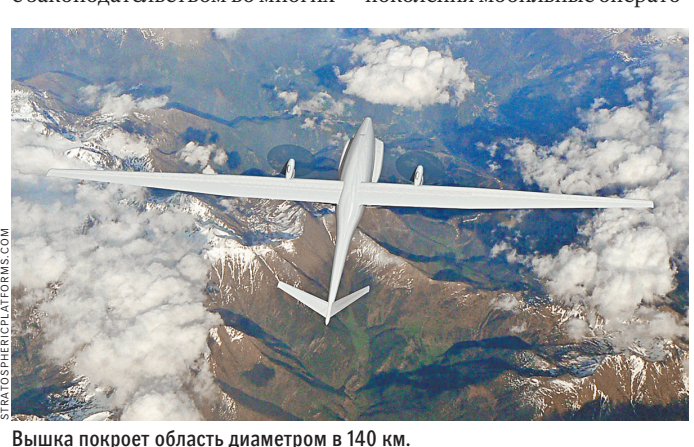
Вышка покрывает область диаметром в 140 км.