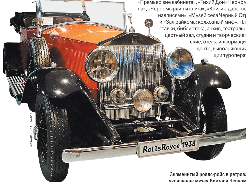
Знаменитый роллс-ройс в ретро-варианте: украшение музея Виктора Черномырдина.

мырдина», «Земля Черномырдина». Шесть экспозиций — предметы, собранные самим Виктором Степановичем и переданные его семьей: коллекция автомобилей, оружие, ордена, живопись, экспозиция «Премьер вне кабинета», «Тихий Дон» Черномырдина», «Черномырдин и книга», «Книги с дарственными надписями», «Музей села Черный Отрог» и «Зал райкома: колхозный миф». Плюс выставки, библиотека, архив, театрально-концертный зал, студии и творческие мастерские, отель, информационный центр, выполняющий функции туроператора.