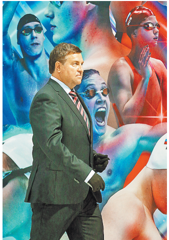
Владимир Сальников уверен, что наша сборная сможет выйти на пик формы к Олимпиаде в Токио.

ВЛАДИМИР САЛЬНИКОВ: К организации — никаких претензий. Чемпионат России удалось провести с соблюдением всех мер безопасности и на должном уровне. На трибунах присутствовали зрители, но их было немного из-за ограничений. Хочу отметить, что Дворец водных видов спорта в Казани удобно сконструирован: есть возможность разделить потоки. Зрители не пересекались со спортсменами, располагались на дальних трибунах. А места ближе к чае бассейна занимали сами пловцы и тренеры. Что касается результатов, то я остался доволен. Было установлено много рекордов страны и юношеских мировых рекордов.