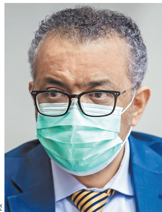
Тедрос Адханом Гебрейесус в соответствии с протоколами ВОЗ теперь будет работать из дома.

Генеральный директор Всемирной организации здравоохранения Тедрос Адханом Гебрейесус перешел на удаленную работу после контакта с заразившимся коронавирусом. Как написал глава ВОЗ на своей странице в Twitter, «было установлено, что он контактировал с кем-то, чей тест на COVID-19 показал положительный результат». «Чувствую себя хорошо, симптомов нет, но в ближайшие дни я буду на карантине в соответствии с протоколами ВОЗ и буду работать из дома», — отметил Гебрейесус. Он отдельно подчеркнул, что «чрезвычайно важно, чтобы все соблюдали рекомендации по охране здоровья». «Таким образом мы разорвем цепочки передачи COVID-19, подавим вирус и защитим системы здравоохранения», — добавил глава ВОЗ. Гебрейесус стал одним из многих мировых политиков и высокопоставленных чиновников, которые были вынуждены прервать обычный образ жизни из-за угрозы заражения коронавирусом. Ранее после контакта с инфицированным на карантин ушла канцлер ФРГ Ангела Меркель, отменил личные встречи глава правительства Австрии Себастьян Курц. Аналогичные распоряжения поступали министрам многих стран, в том числе глава МИД России Сергей Лавров.