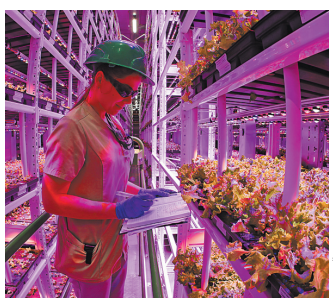
В топ-50 попали агроном, оператор беспилотников, сварщик, программист и другие профессии.

Минтруд подготовил обновленный список топ-50 востребованных профессий для специалистов среднего профобразования. Над документом работали эксперты Университета Национальной технической инициативы 20.35, WorldSkills Russia и ВНИИ труда.