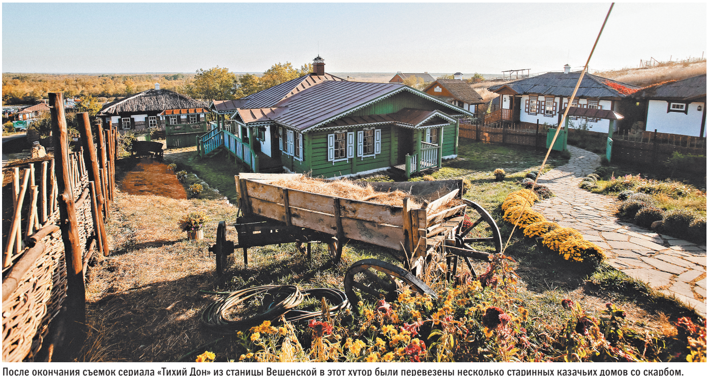
После окончания съемок сериала «Тихий Дон» из станицы Вешенской в этот хутор были перевезены несколько старинных казачьих домов со скarbом.

вого. Но в 1980-х виноградники вырубали. Молодежь стала уезжать в поисках работы, школы закрыли. И хутор стал постепенно умирать. Но теперь тут закипела жизнь, и работы хватает. Самому красивому хутору сейчас нужны строители, плотники и другие специалисты. Ведь планов много — построить казачьи гостиницы, устраивать гастрономические туры, фольклорные фестивали. А самое главное — снова разбить виноградники с уникальными сортами золотовского винограда. ●