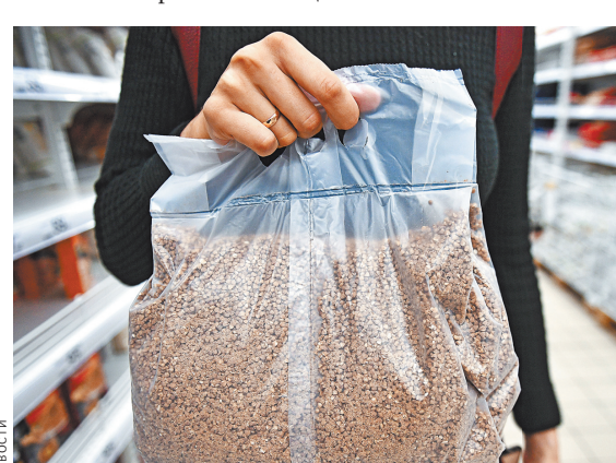
Никакого дефицита гречки в этом сезоне быть не может: урожай гречки будет выше прошлогоднего, да и переходящие запасы крупы имеются.