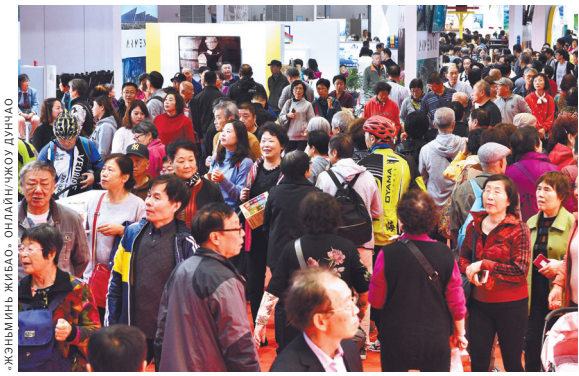
Вторая Китайская международная импортная выставка привлекает большое количество посетителей.

Скорость импорта свежего молока в рамках ЭКСПО позволила высокосортным зарубежным продуктам в