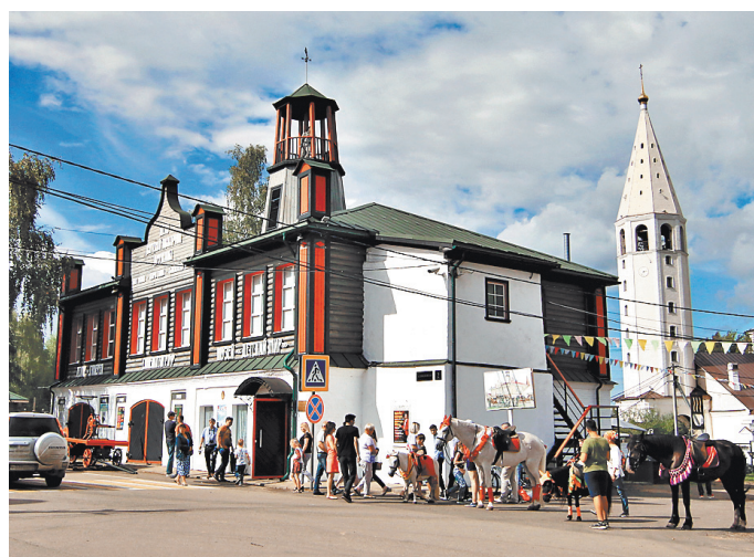
Благодаря притоку туристов на улицах Вятского всегда многолюдно.

Такая чистота на улицах, что никто даже бумажку мимо урны бросить не решается