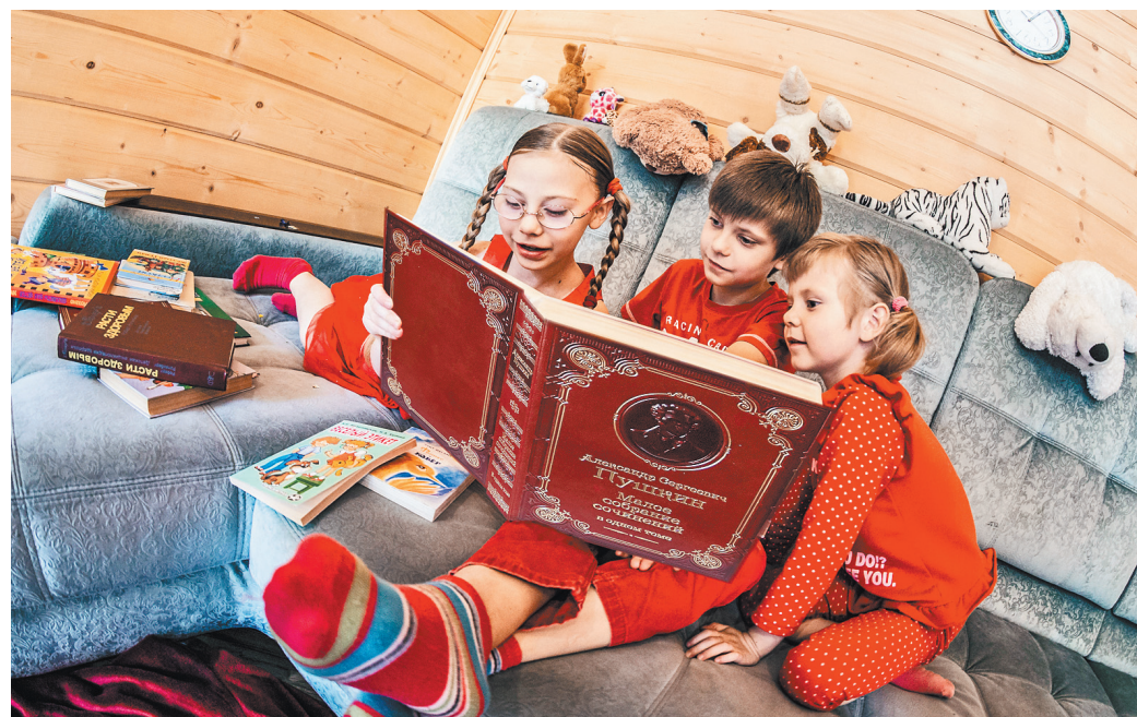
Опрос школьных библиотекарей показал: «самый читающий возраст» — период 9–10 лет. Особенно младшеклассники любят сказки Пушкина.

Работу нужно писать самому, без плагиата, шаргалок, заученных текстов и схем. — Если вам нравится какая-то чужая мысль, можно спокойно