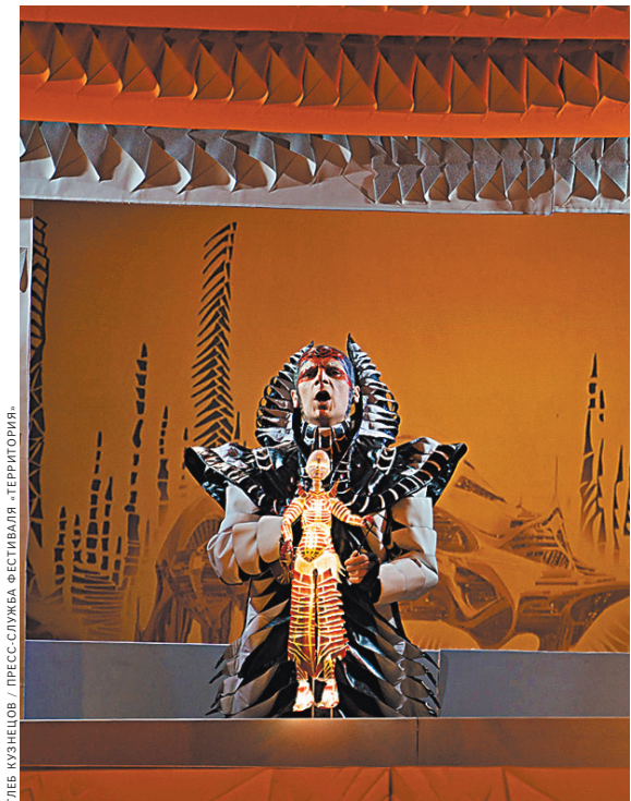
На «Территории» показали кукольную космооперу «Дидона и Эней» театра «Тригистер» (Москва).

В планы режиссера сверка зрителями увиденного и услышанного не входила