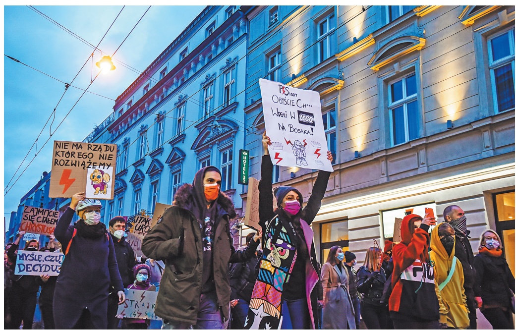
Протесты в Кракове: поляки возмущены решением Конституционного суда в отношении абортов.

Швеция намерена пригласить польских женщин при желании и необходимости на бесплатные аборты на территории королевства. Операции будут осуществляться за счет шведских налогоплательщиков. «Нам надо разрешить полячкам приезжать в Швецию с целью сделать аборт», — заявила министр Швеции по вопросам гендерного равенства Оса Линдхаген, намекая на развитие «абортного туризма» в королевстве. При этом чиновница привела интересное объяснение того, почему именно Швеция намерена помочь польским женщинам. «Польша когда-то заступилась за нас! В 1960-х годах, когда аборты были запрещены в Швеции, тысячи шведских женщин ездили в Польшу, где аборты были разрешены», — написала Линдхаген в одной из социальных сетей.