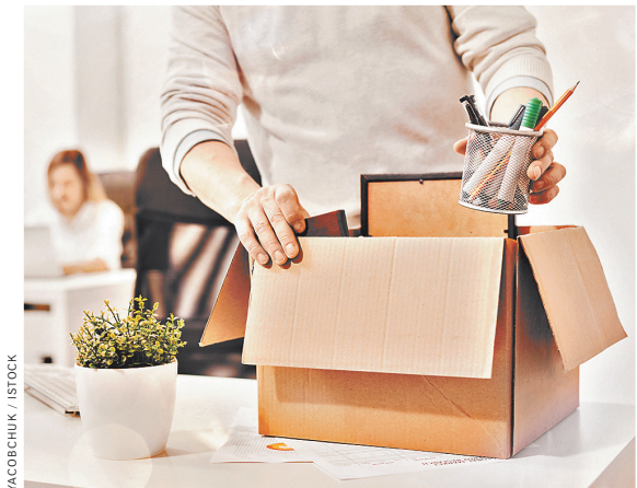
Верховный суд: В законе нет специального перечня, какие причины увольнения считаются уважительными, а какие — нет.

«Я подобные инициативы поддерживаю, — сказал он. — Надо понимать, что речь идет не о предприятиях общепита, а о розничной торговле, что несколько меняет дело в контексте вопроса ущемления интересов бизнеса. Также важно помнить, что, как правило, подобные решения, связанные с полным запретом на продажу, затрагивают небольшие населенные пункты. То есть на сходах граждане самостоятельно принимают соответствующее решение. Все это было актуально и до пандемии коронавируса. Сейчас же эта мера особенно органично вписывается в политику борьбы с распространением инфекции и вполне может точно применяться. Хотя, конечно, ко всему надо подходить с умом и находить баланс между интересами экономики и здоровьем людей».