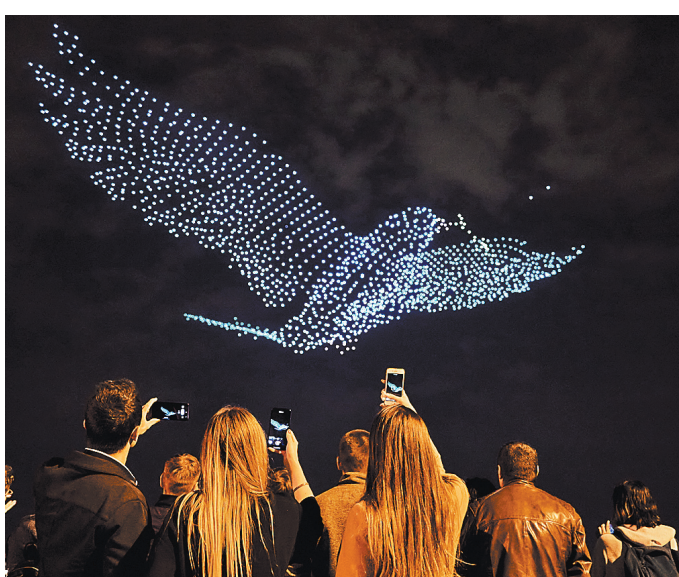
Голубь из 2200 дронов пролетел над Северной столицей.

Россияне планируют установить новый мировой рекорд по количеству синхронно парящих в воздухе квадрокоптеров. Если все сложится, то масштабное шоу дронов состоится уже до конца этого года. В последнее время шоу дронов набирают популярность, вытесняя привычные фейерверки. Сотни беспилотников взлетают в ночное небо и образуют трехмерные движущиеся фигуры разных цветов и размеров.