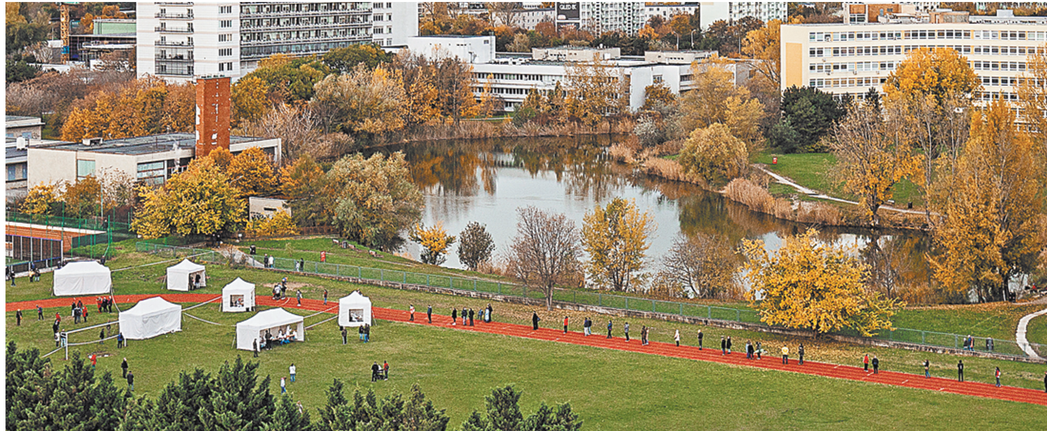
Мобильная лаборатория, развернутая на одном из братиславских стадионов. В очереди все соблюдают правило «двух метров».

НЕДВИЖИМОСТЬ Интерес россиян к аренде жилья в других регионах вырос вдвое Сменить домашнюю обстановку