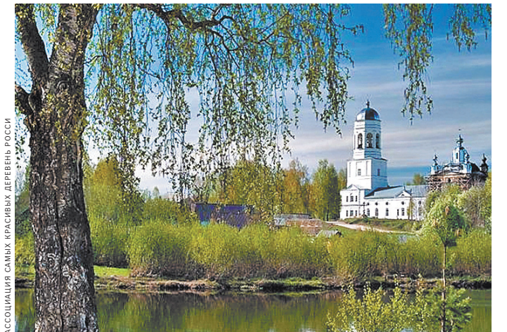
Не стоит село без церкви — эту истину знают в поморской Кимже и других деревнях Русского Севера.