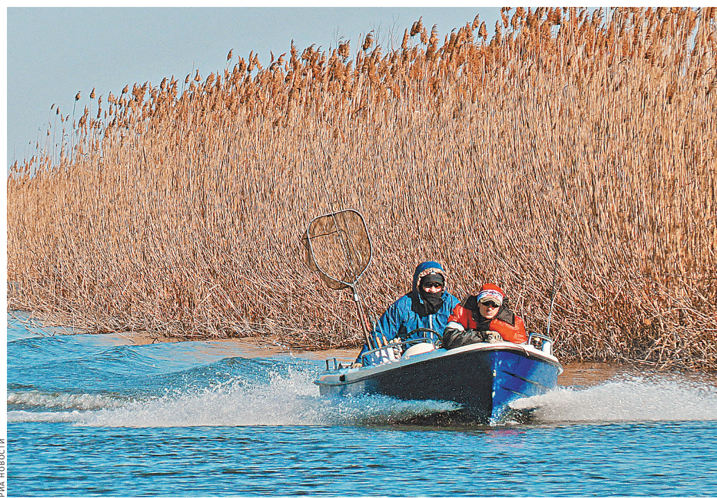
Владельцам маломерных судов запретят останавливаться под мостами, рядом с фарватером и буями.