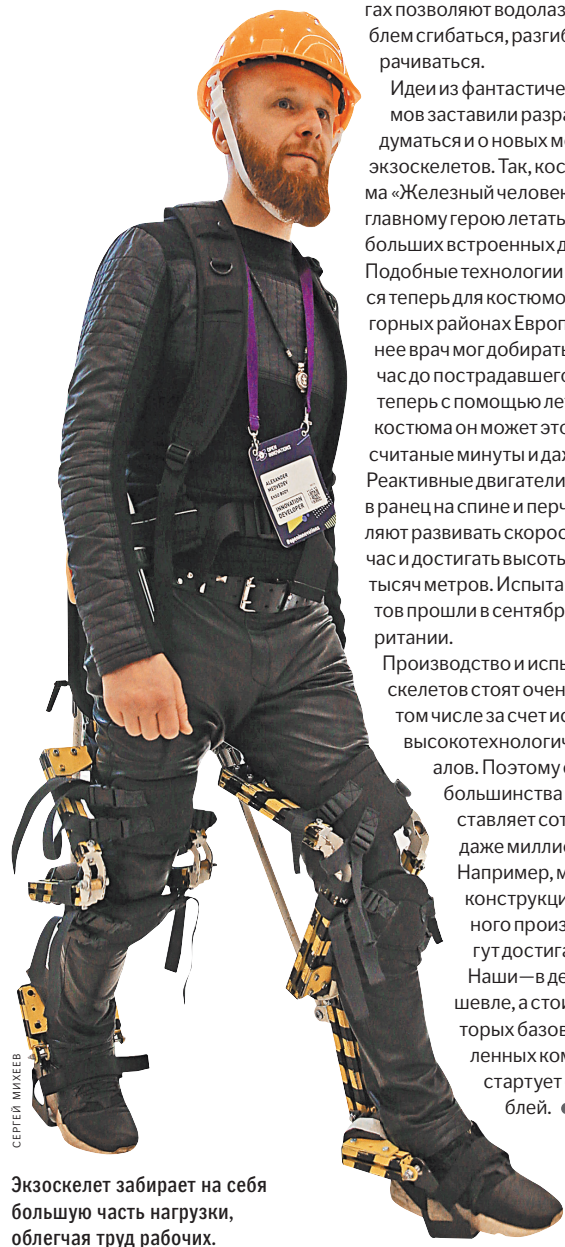
Экзоскелет забирает на себя большую часть нагрузки, облегчая труд рабочих.

Производство и испытания экзоскелетов стоят очень дорого, в том числе за счет использования высокотехнологичных материалов. Поэтому стоимость большинства из них составляет сотни тысяч и даже миллионы рублей. Например, медицинские конструкции иностранного производства могут достигать и 10 млн. Наши — в десять раз дешевле, а стоимость некоторых базовых промышленных комплектов стартует от 30 тыс. рублей.