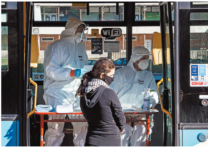
Жительница города Кошице на одном из постов для сдачи тестов.