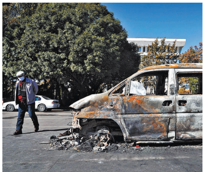
В ночь на среду в Бишкеке хозяевами чали «революционеры» самозахватчики.

Спустя сутки после начала волнений в Киргизии все еще отчаянно пытаются заполнить вакуум исполнительной власти. Ни у кого из игроков местной политики это пока не получается.