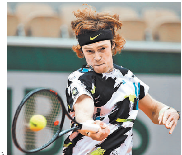
Андрей Рублев очень близко подобрался к топ-10 рейтинга, но ему еще предстоит как следует поработать над собой.