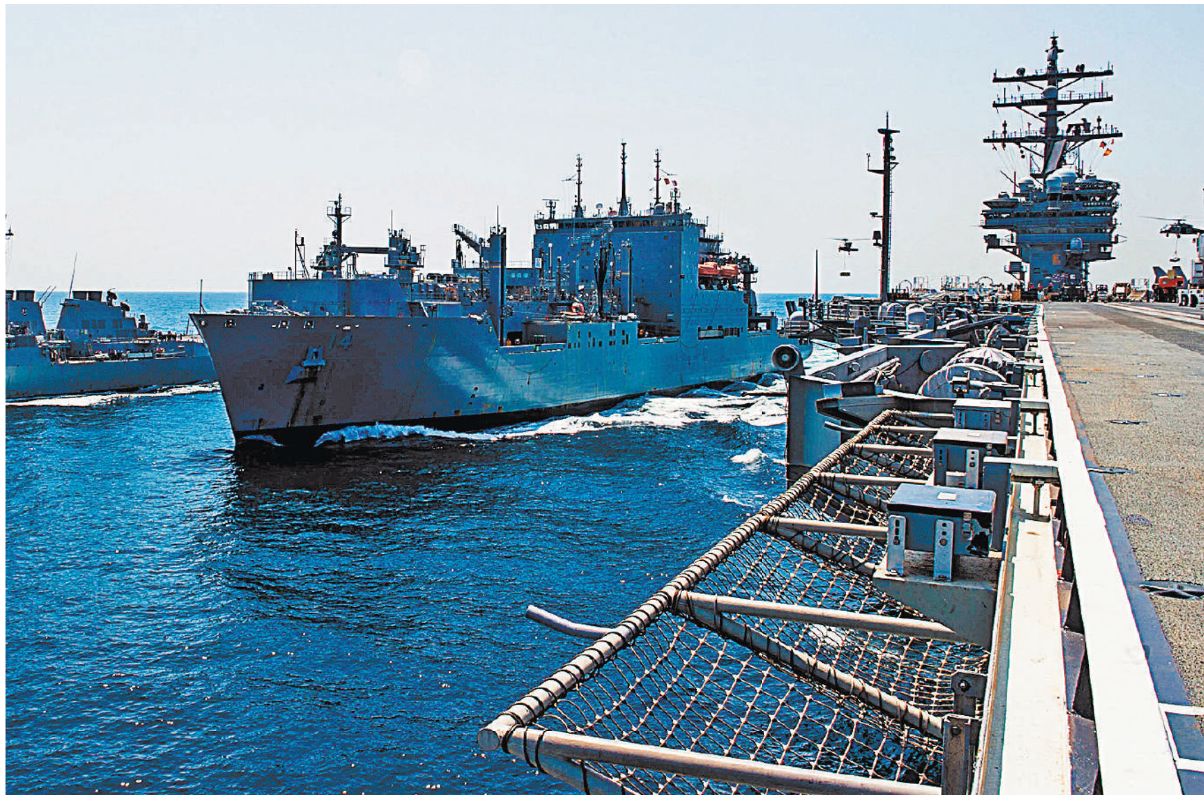
Корабли американских ВМС – частые гости в японских портах.

Александр Ленин, «Российская газета», Токио