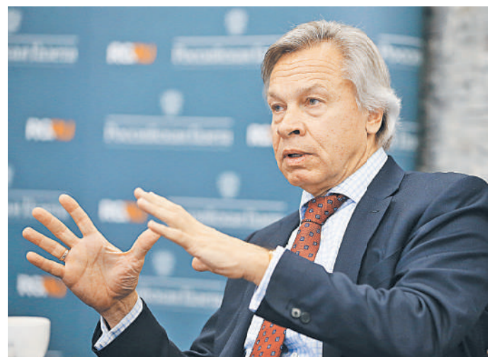
Алексей Пушков рассказал о том, как пандемия повлияет на мир сегодняшний и мир завтрашний.

Итак, растерявшие свою способность к единоличному мировому лидерству Соединенные Штаты, фрагментированная Европа, усилившийся Китай, закрепившаяся в «большом треугольнике» Россия — такими будут главные черты посткоронавирусного мира, в котором национальные государства заметно увеличат свою роль и общественный вес. Глобальный мир не исчезнет, но станет во многом другим. Глобализм как всякая чрезмерная тенденция будет ограничена объективными потребностями обществ, лучше осознавших как позитивные, так и опасные стороны этой доктрины. Мы не протестим с глобальным миром, но он будет другим. И жить мы будем в нем иначе. ●