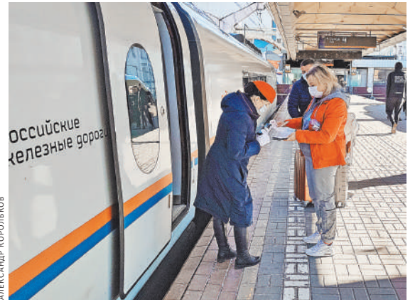
Почти до конца мая билеты на «Сапсан» можно будет купить только с размещением у окна.