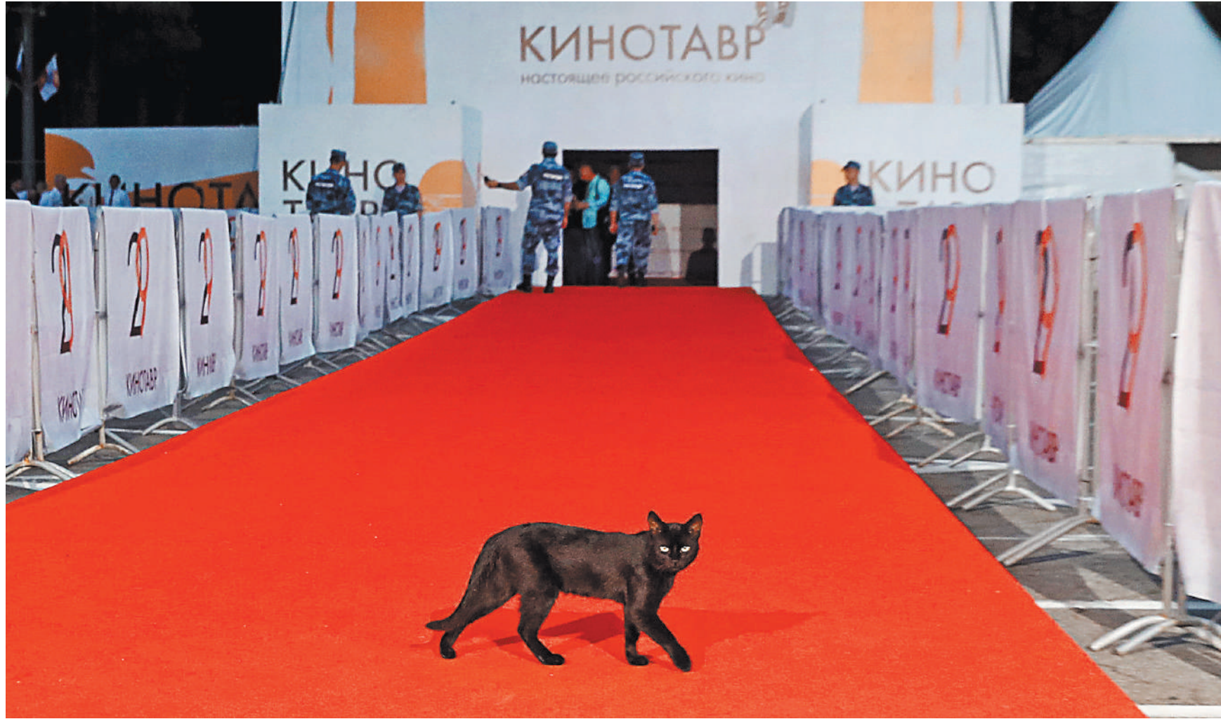
ВНЕСЛАВ ПРОКОВИЧ / ГАС