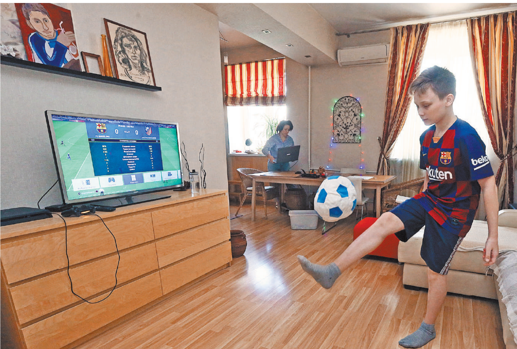
Разовая выплата в 10 тысяч рублей положена на каждого ребенка в возрасте от 3 до 15 лет включительно уже с 1 июня.

Предусмотрен и нецифровой способ подачи заявления — лично в территориальном органе Пенсионного фонда по месту жительства, пребывания или фактического проживания или через многофункциональные центры.