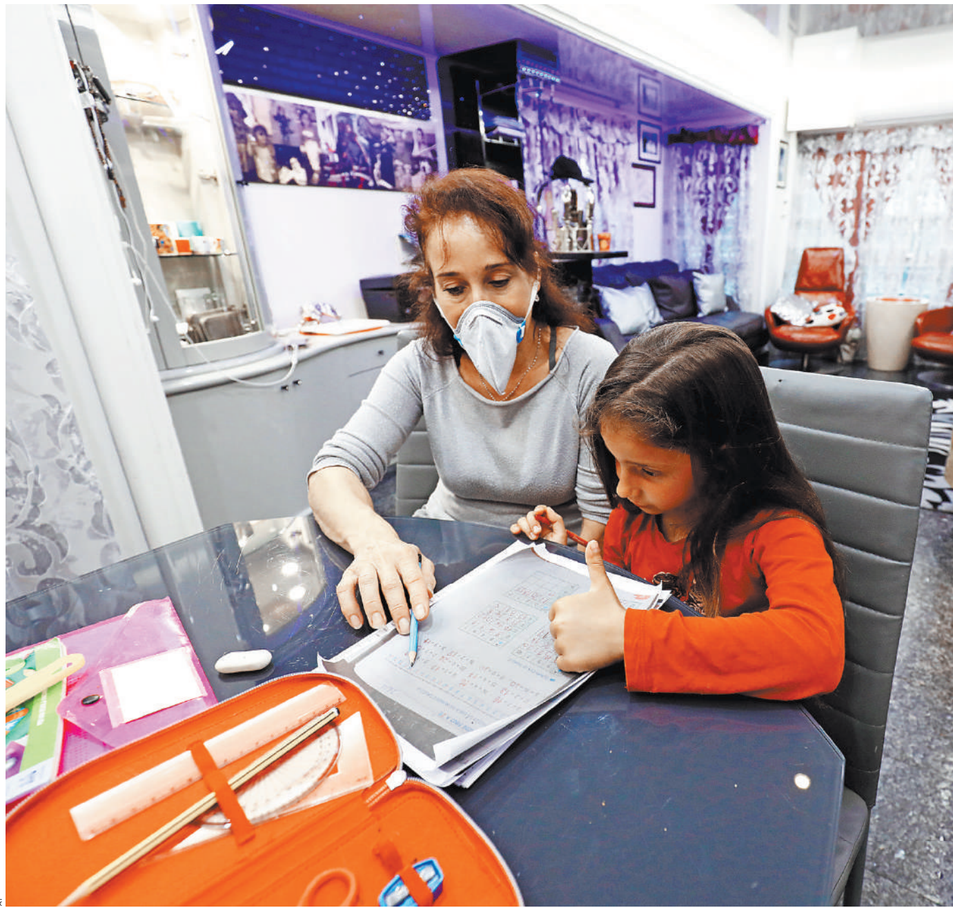
Карантин и обучение на дому стали стрессом для свободолюбивых итальянцев. Объяснение новых тем и контроль за домашними заданиями возложили на родителей, которым одновременно приходится работать на удаленке. А едва ли не половина запертых дома учащихся средних классов, как выяснили социологи, испытывают глубокую депрессию из-за невозможности общаться со сверстниками.