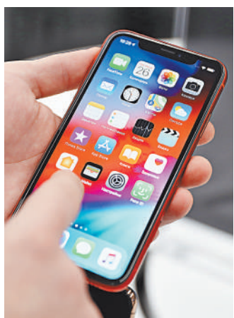
Современные смартфоны стремятся к «естественной» картинке на экране.