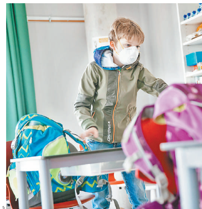
В Германии карантин смягчают: этот четвероклассник из Гамбурга, как и многие его сверстники, уже вернулся в школу за парту, хотя пока в маске.

ной школе Гамбурга. Она не только два раза в неделю общается с ребятами в скайпе, но и заботится о тех, у кого дома нет компьютера или ограничен доступ к интернету. Например, у детей беженцев, живущих в общежитиях. Ради них преподаватель приходит на работу, распечатывает там стопку листов с упражнениями и отправляет с курьером по адресам. В ответ школьники присылают ей скриншоты ответов на смартфон. Ее коллега из Мюнстерланда перед уходом на карантин провела беседу с учениками и составила для каждого индивидуального плана занятий. А еще она устраивает детям настоящие, хоть и виртуальные перемены, на которых можно обменяться письмами, селфи и рецептами пирога. ●