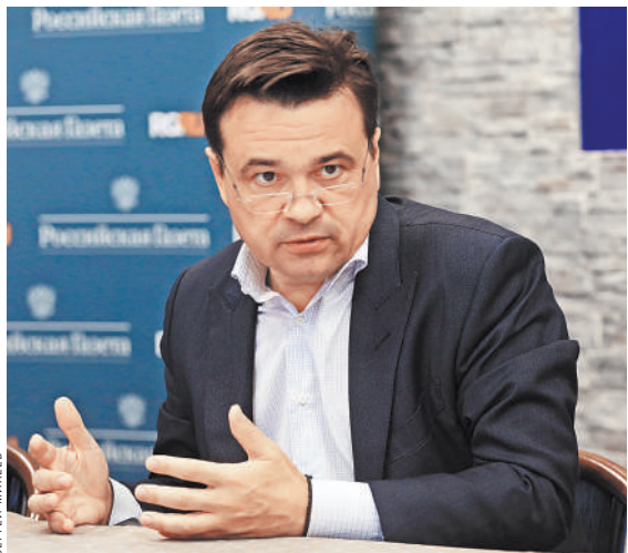
Губернатор Подмосковья считает, что в условиях пандемии никакой риск не оправдан.

Это правило будет действовать в течение мая и июня, а затем его либо продлят, либо отменят, если ситуация с заболеваемостью в регионе пойдет на спад. ●