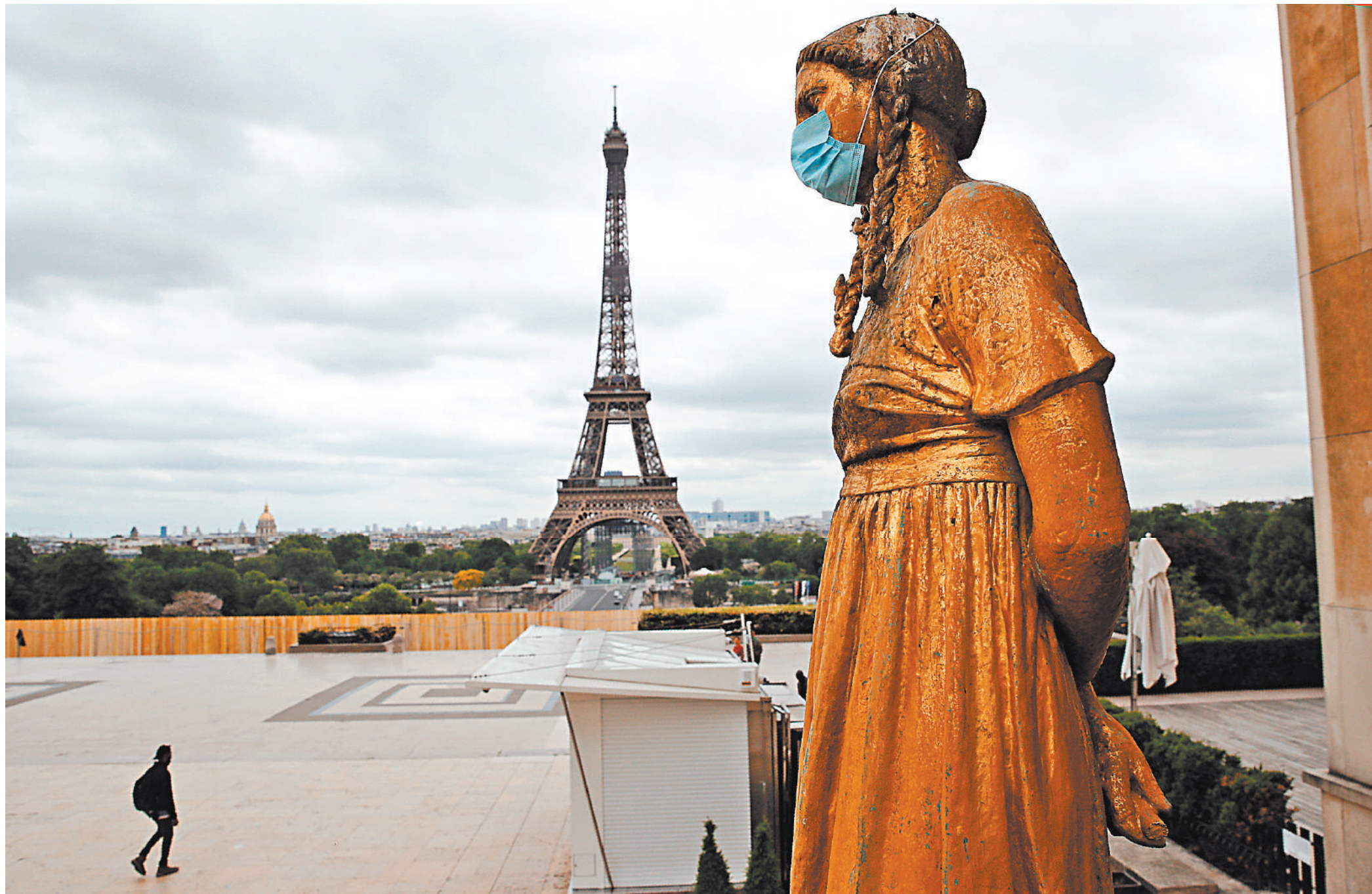
Пандемия доказала необходимость сильной руки государства даже в неолиберальной Европе.

Краткий период «однополярного мира» действительно наступил. В 1990-е годы Россия оказалась в состоянии национальной катастрофы и магистрального геополитического отступления, а Китай еще только собирал силы и был слишком слаб, чтобы иметь возможность бросить вызов Соединенным Штатам. Но и Краутхаммер, и другой идеолог американской глобальной гегемонии — Збигнев Бжезинский, и многие другие в США серьезно ошиблись в