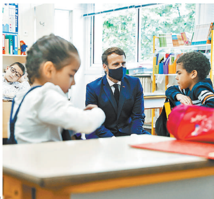
Президент Эммануэль Макрон проинспектировал, каково учащимся школы в пригороде Парижа возвращаться в классы после паузы.