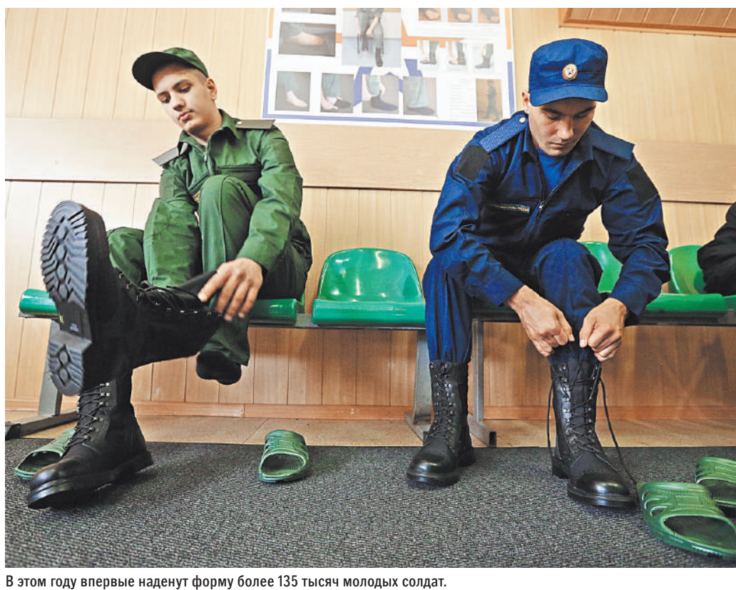
В этом году впервые наденут форму более 135 тысяч молодых солдат.

— Все о призыве в армию rg.ru/sujet/2636