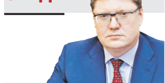
Андрей Исаев, первый заместитель руководителя фракции «Единая Россия» в Государственной Думе