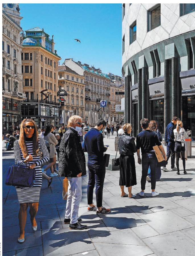
Утомленные карантинном и изголодавшиеся по шопингу жители Вены выстроились в очереди перед наконец-то открывающимися магазинами.