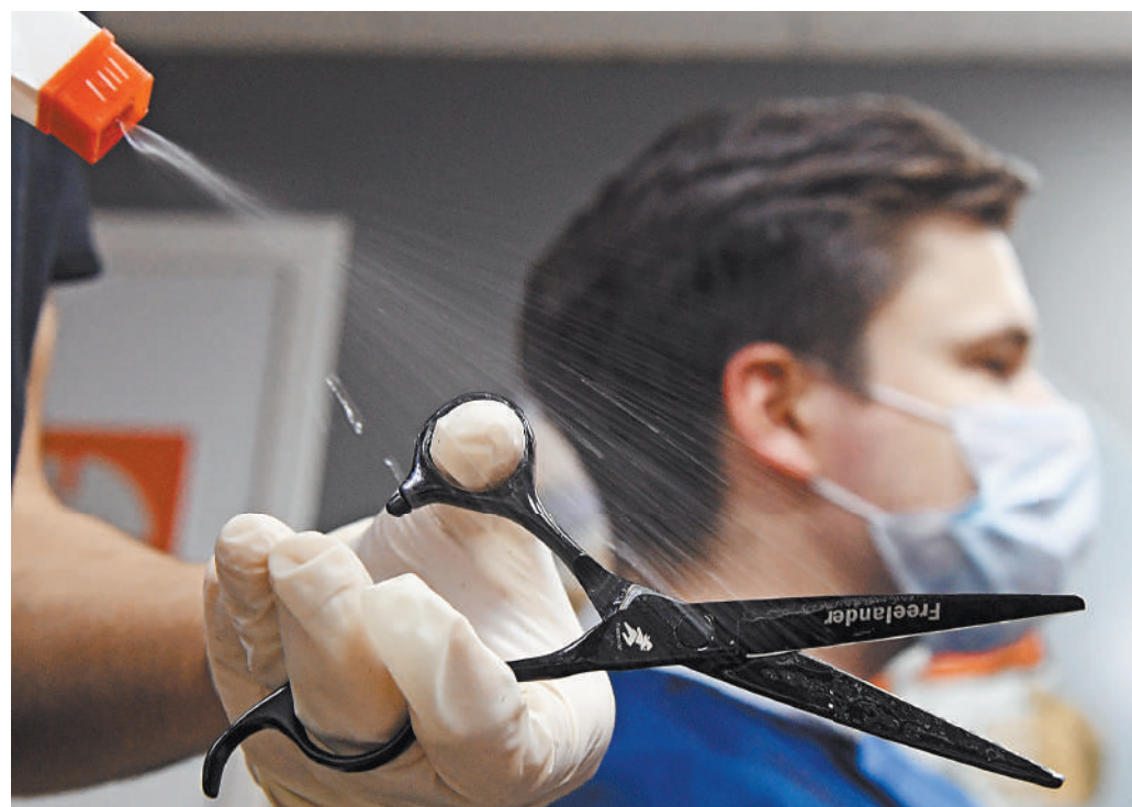
Парикмахерские инструменты откроются только в том случае, если они готовы соблюдать строжайшие меры безопасности.

— Кто обладает самым сильным иммунитетом к COVID-19 rg.ru/art/1881137