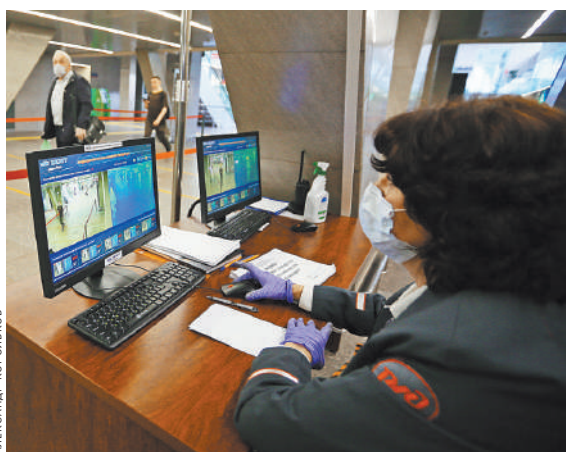
Система сканирует всех проходящих пассажиров и выделяет цветом тех, у кого повышенная температура.

Пассажирам с повышенной температурой предлагается пройти в медпункт для проведения контрольного замера обычным термометром. Если человек действительно нездоров, то ему вызывают «скорую», которая принимает решение о его дальнейшей судьбе. ●