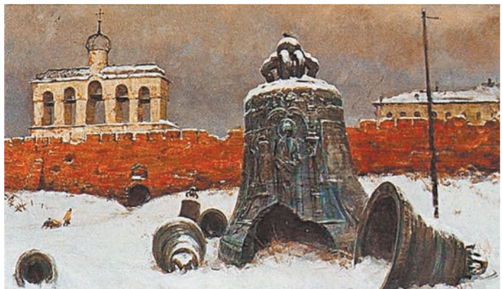
Январь, 1944 год. Так выглядел Новгородский кремль после освобождения и 883 дней фашистской оккупации.

руины были превращены памятники, теперь объявленные Всемирным наследием ЮНЕСКО, — новгородский Кремль и околопустоты храмов. Исчезли десятки уникальных икон, рукописей и предметов декоративно-прикладного искусства. С куполов Софийского собора (1045—1050 годы) оккупанты сорвали позолоту и кресты, а памятники «Тысячелетие России» демонтировали. Поскольку у стен Новгорода Александр Невский произнес легендарные слова: «Кто с мечом к нам придет, тот от меча и погибнет», вызволение из плен города и страны стали делом чести. О том, как город восстанавливал исторический облик и возвращал вывезенные фашистами ценности, рассказывает выставка. ●