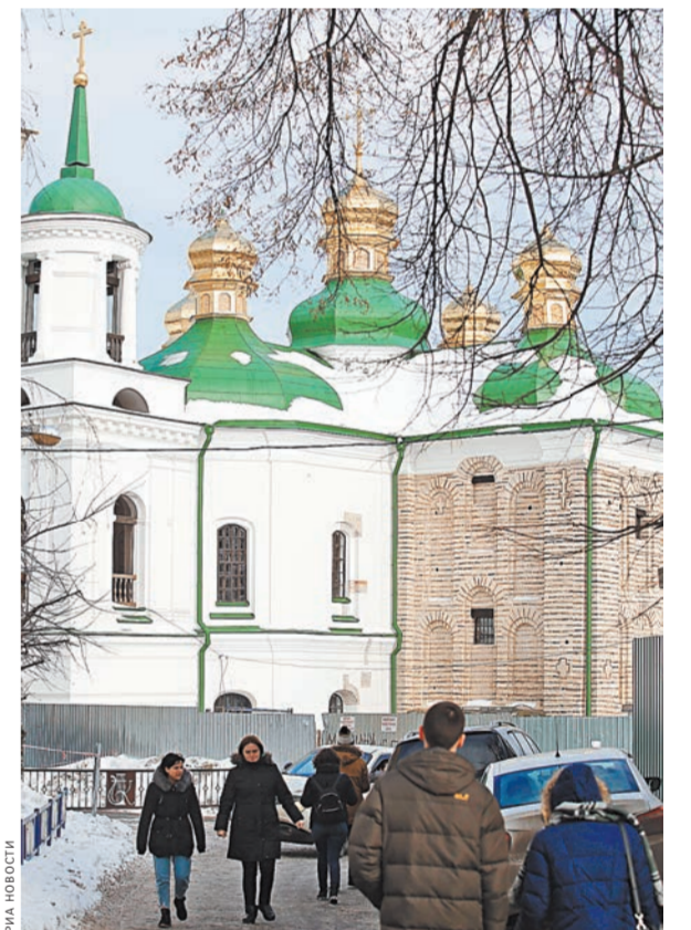
Церковь Спаса на Берестове в Киеве, которую должны передать Варфоломею в обмен на предоставление автокефалии.

Законом вводится процедура смены «подчиненности» религиозных общин. Так, теперь приход вместе с храмом может поменять «юрисдикцию», если на общем собрании общины двумя третями голосов будет принято такое решение. Причем участники собрания обязуют подписываться под протоколом общего собрания общины. Авторы закона изначально не скрывали, что единственное назначение закона — рейдерский захват храмов канонической УПЦ в пользу раскольничьей и национальной исторической ПЦУ — так называемой «православной церкви Украины», созданной на пах президентом Порошенко и «фанарским папой» Варфоломеем. К слову, у этой псевдоцеркви, есть и вторая аббревиатура, еще более красноречивая — СЦУ, на ней настаивают истинные хозяева из Стамбула.