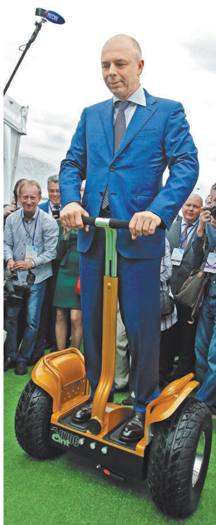
Малым электротранспортом пользуются многие. Даже министр финансов РФ Антон Силуанов относится к ним с интересом. Но чаще всего его используют дети и подростки, которые не знают даже элементарных правил движения.

За прошлый год в России было продано 32 тысячи электросамокатов и 10 тысяч моноколес. Причем десятая часть реализованных товаров по своей мощности превышает 4 кВт. Российский опыт насчитывает уже четыре случая с летальным исходом по вине владельца двухколесного злодея. ●