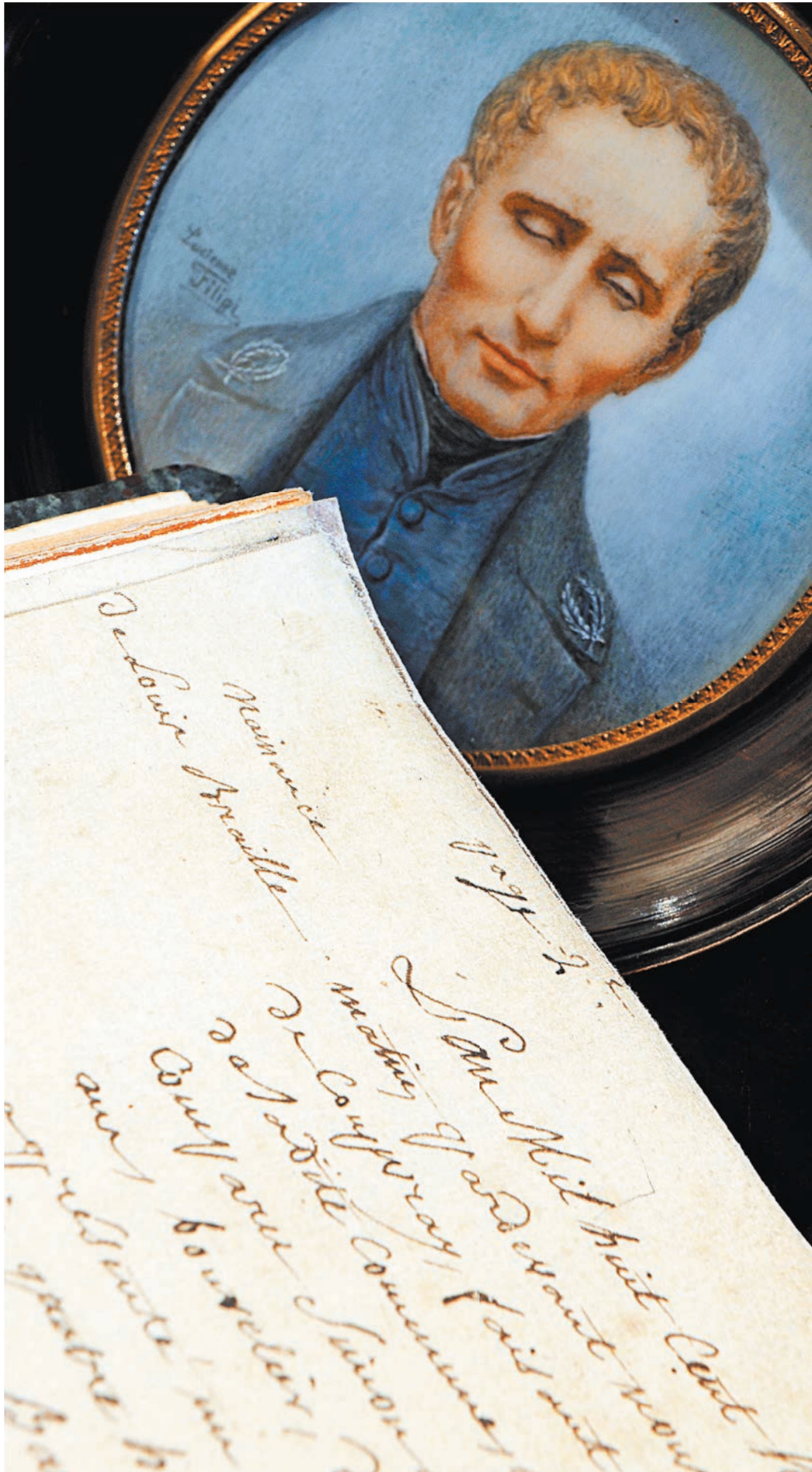
Азбука, придуманная французским мальчиком Луи Брайлем, ослепшим в пять лет, уже два века считается универсальным средством общения незрячих.

На создание учебника по математике уходит от шести месяцев до года. Очень много сил отнимает перевод математических формул в понятный для незрячих вид