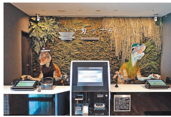
На распеве гостиницы «Хэнна» в японском городе Сасебо гостей встречают роботы-велосипараторы.

Особое недоверие у путешественников возникло, когда голосовые помощники в номерах стали воспринимать их хрип за команды. «Чем я могу помочь?» — твердили незадачливые девайсы всю ночь напролет, так и не