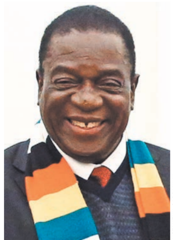
Эммерсон Мнангагва: Россия никогда не была колониальной державой.

Какой вы видите роль России на африканском континенте? Эммерсон Мнангагва: Россия никогда не была колониальной державой.