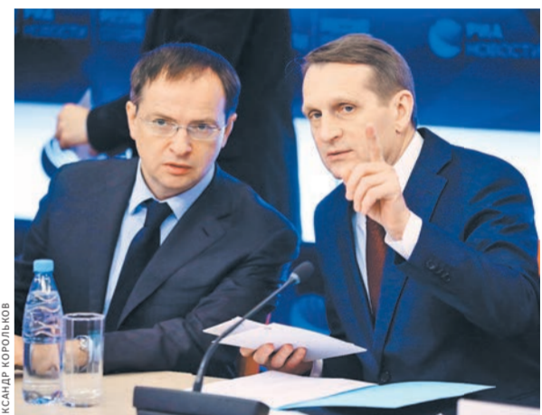
Владимир Мединский и Сергей Нарышкин уверены: надо напомнить Европе, благодаря кому она так благополучна.