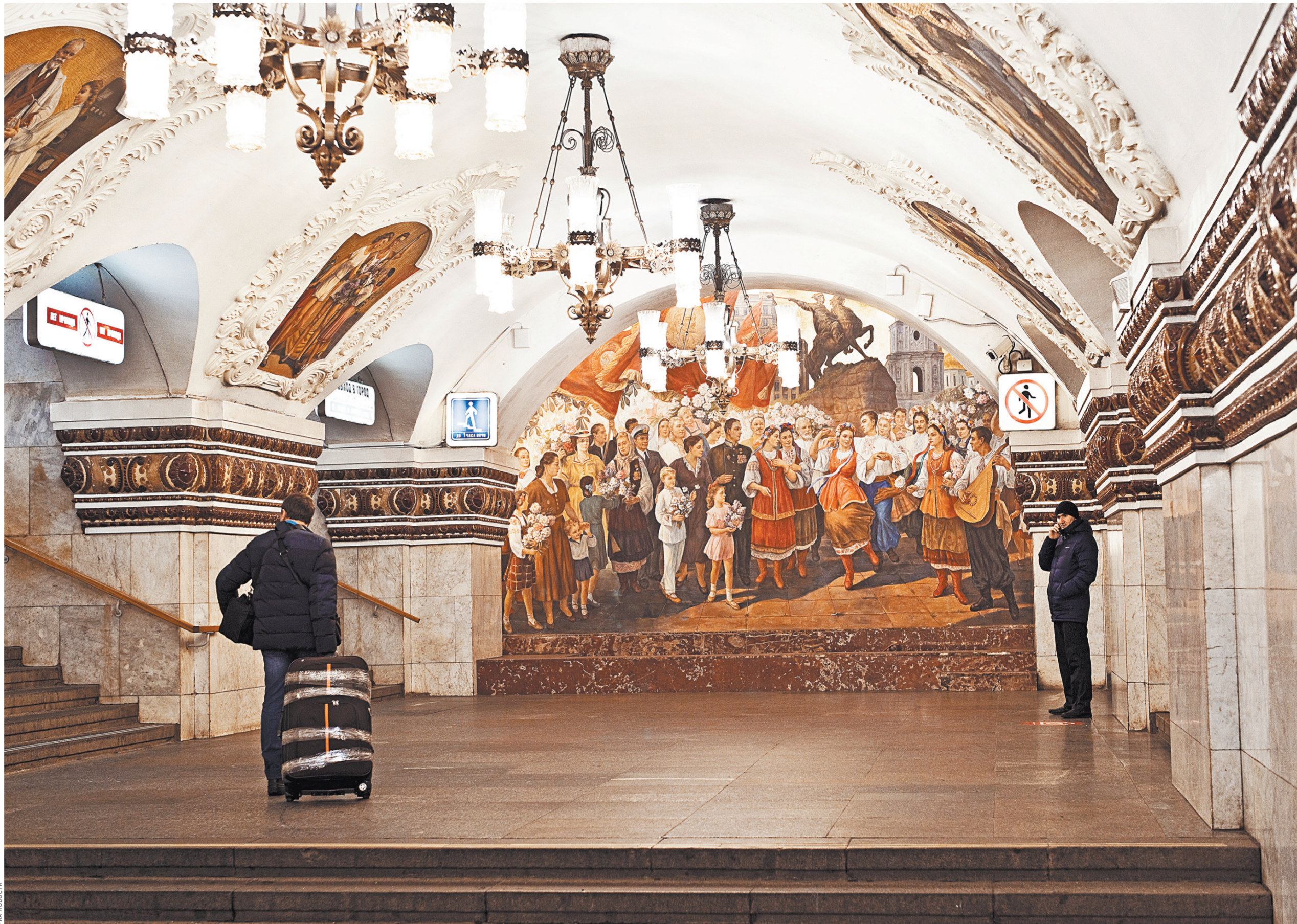
Станция «Киевская» московского метрополитена — одна из самых красивых.

Из той же таблицы очевидно: коллективная модель поведения (Россия, Украина) вкратно большей степени полагается на опеку государства, на меньшую автономность и независимость индивида, на вертикали («подслуша-