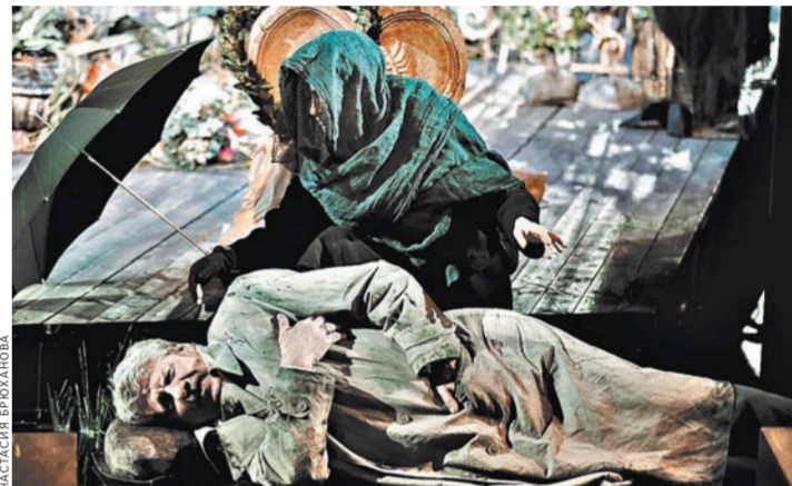
«Мы все становимся лучше, соприкасаясь с творчеством Резо Габриадзе», — говорят актеры, занятые в спектакле «Какая грусть, конец аллеи...»