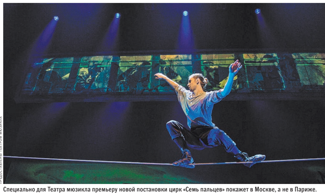
Специально для Театра мюзикла премьеру новой постановки цирк «Семь пальцев» покажет в Москве, а не в Париже.

Спектакли канадского цирка «7 пальцев» в Театре мюзикла будут идти три недели — с 18 января по 9 февраля.