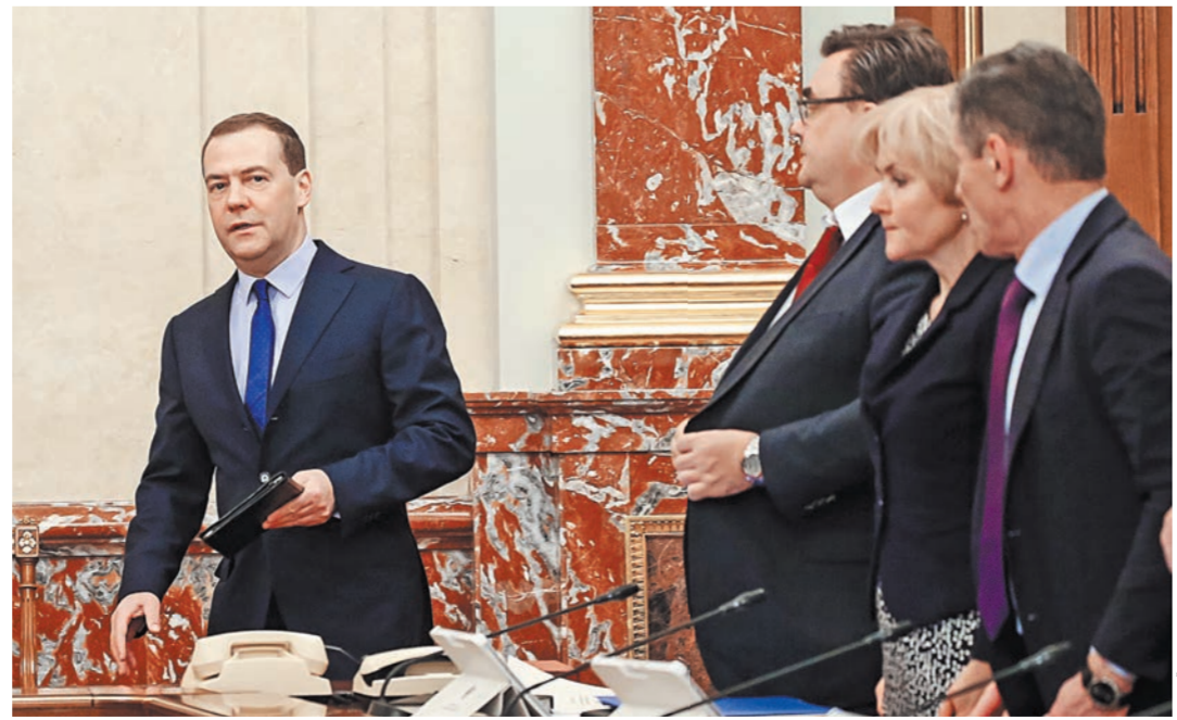
Эффективность исполнения каждого пункта утвержденного плана будут подтверждать не чиновники, а представители бизнеса, заявил премьер.

Дох пор эта работа велась в рамках так называемых дорожных карт национальной предпринимательской инициативы (НПИ). За последние годы двенадцать таких инициатив были