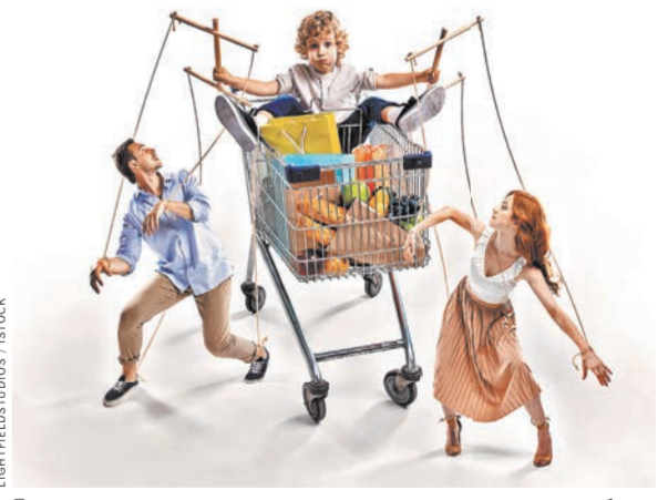
Появилась жизненная концепция — «я же мать» и «он же ребенок», которым все должны.

ВЕРА АБРАМЕНКОВА: У Макаренко есть рассказ, о том, как в голодные годы жил бедный человек с 13 детьми. Когда ему предложили подработку — он отказался, сказав, что ему нужно быть с детьми. У него были лишь ведра картошки и селедка. Сейчас вряд ли кто откажется от лишних денег — потребление стоит на первом месте, а воспитание на последнем. Размывается разница между уровнем жизни и его качеством. Уровень жизни — это услуги, комфорт, а качество, особенно для ребенка, это чувство защищенности. Если ребенок чувствует себя защищенным, у него нет страха, он свободен. А сейчас редкий ребенок не имеет страха. Особенно в городах. Я как-то была в Америке, для исследования мы попросили детей что-то нарисовать на свободную тему, и дети рисовали какой-то апокалипсис. Американские коллеги при этом говорили, что у этих детей есть все.