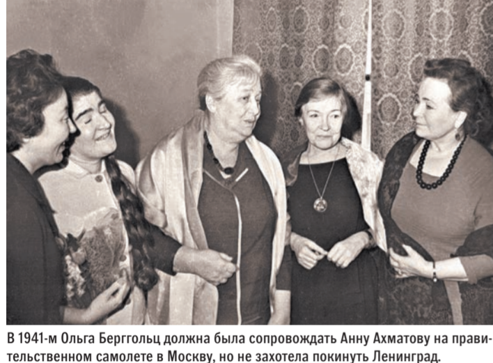
В 1941-м Ольга Берггольц должна была сопровождать Анну Ахматову на правительственном самолете в Москву, но не захотела покинуть Ленинград.