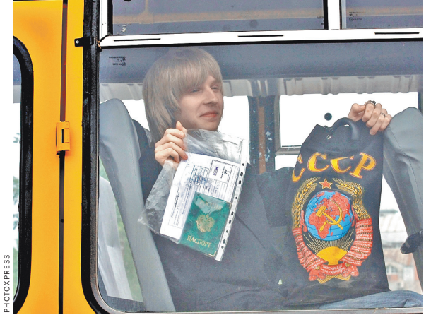
Большинство сожалеющих о распаде СССР — люди старше 55 лет, но рост числа ностальгирующих зафиксирован во всех возрастных группах.

Иерархия причин, которыми респонденты характеризуют свои сожаления о распаде, в целом осталась без изменений. Каждый второй (52 процента) считает, что была «разрушена единая экономическая система». Каждый третий (36 процентов) объясняет свою ностальгию потерей «чувства принадлежности к великой державе», еще 31 процент — возросшим недоверием и ожесточенностью в обществе. Также среди причин сожаления о советских временах: разрушение связи с родственниками и друзьями (24 процента), утраченное чувство, что ты повсюду дома (24 процента), а также сложности в организации путешествий (13 процентов). За прошедший год с 52 до 60 процентов выросло число тех, кто считает, что Советский Союз «можно было сохранить». ●