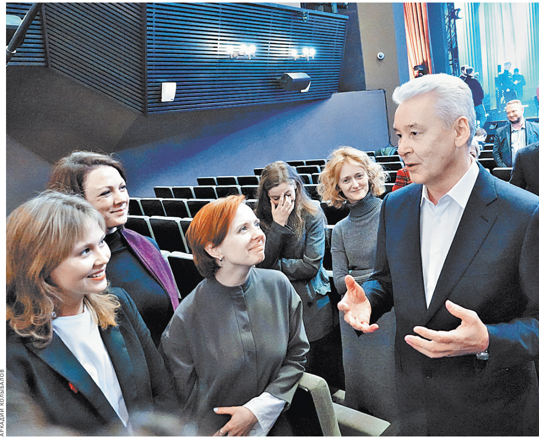
Два года, пока шла реставрация, актеры скитались по чужим углам. Вчера мэр поздравил их с возвращением домой.

— Смотрите фоторепортаж на сайте rg.ru/sujet/1560