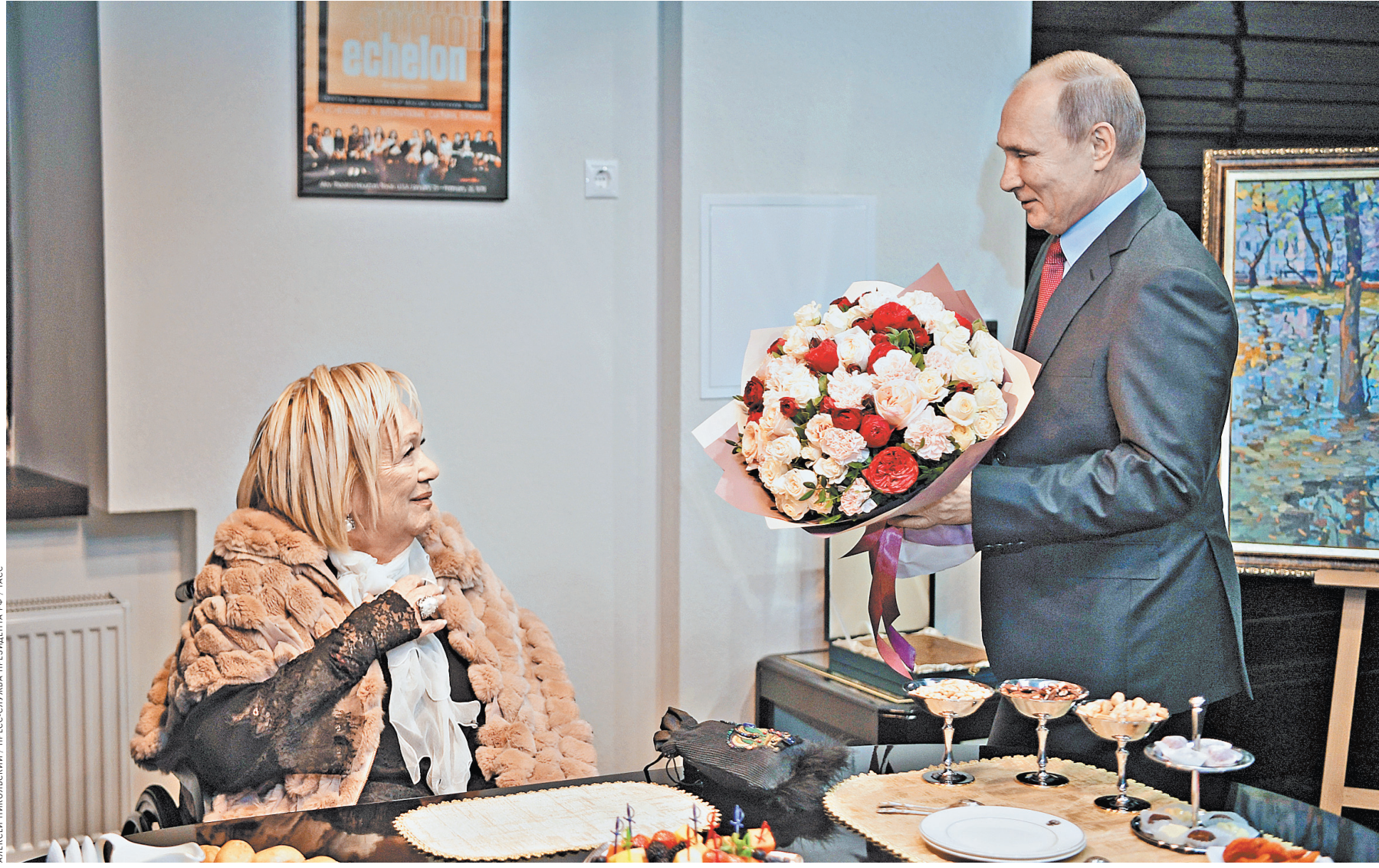
Глава государства поблагодарил худрука «Современника» за вклад в национальную культуру и мировой театр.

А на замечание президента о том, что выданы сегодня насыщенный день, худрук «Современника» сказала, что у нее такой каждый день. «Слава Богу, я очень радуюсь тому, что я сумела победить эту историю (речь идет о болезни. — Прим. РГ). Честно вам скажу, что мой график находится в противоречии с этим делом», — заключила Волчек.