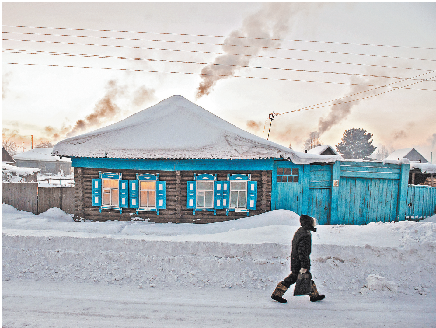
В 2018 году 12,8 миллиона граждан — пенсионеры, инвалиды и некоторые другие — впервые получили вычет по земельному налогу на 6 соток.

Сейчас в России в основном сельхозпродукцию продают на свободном рынке. На вырученные деньги скупают другую сельхозпродукцию для перепродажи на пике роста цен. «Это происходит на примере гречихи, подсолнечника на ряде других высокомаржинальных культур. Страда-