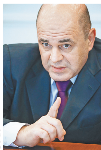
Михаил Мишустин: Тем, кто применял агрессивные методы ухода от налогов, придется перестраиваться или уходить с рынка.

С 1 января отменяется налог на любое движимое имущество (кроме транспортных средств) для налогоплательщиков-организаций. Для этой же категории отменяется обязанность представления налоговых деклараций по транспортному и земельному налогам с одновременным введением в Налоговый кодекс упрощенных процедур камерального контроля по этим нало-