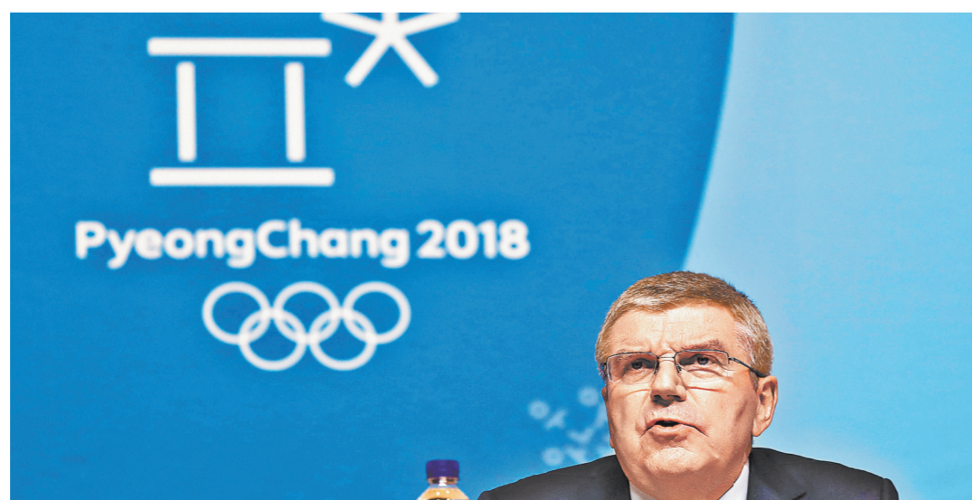
В ответ на рассуждения Томаса Баха о необходимости реформирования CAS в России отвечают: надо подумать о реформировании WADA и самого МОК.

Но этот орган — высшая судебная спортивная инстанция, как раз и созданная по инициа-