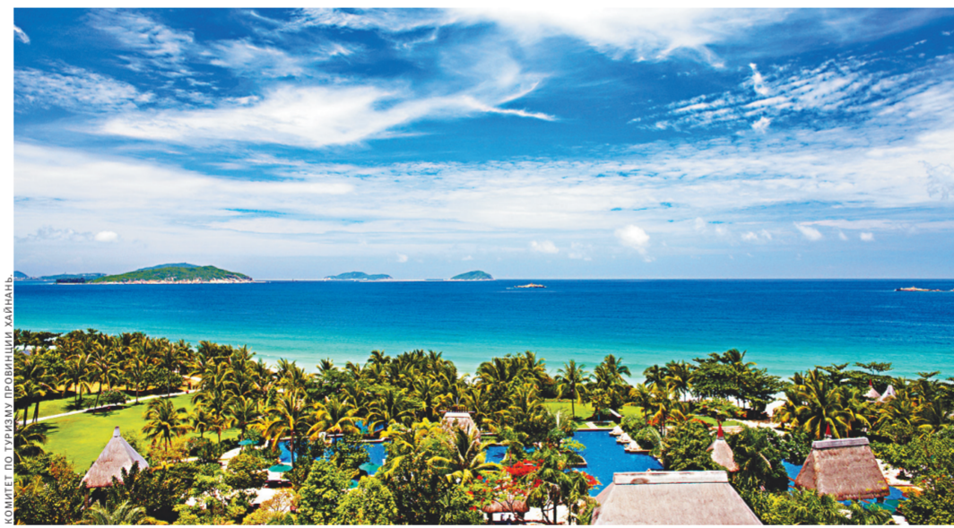
Завораживающий морской пейзаж.