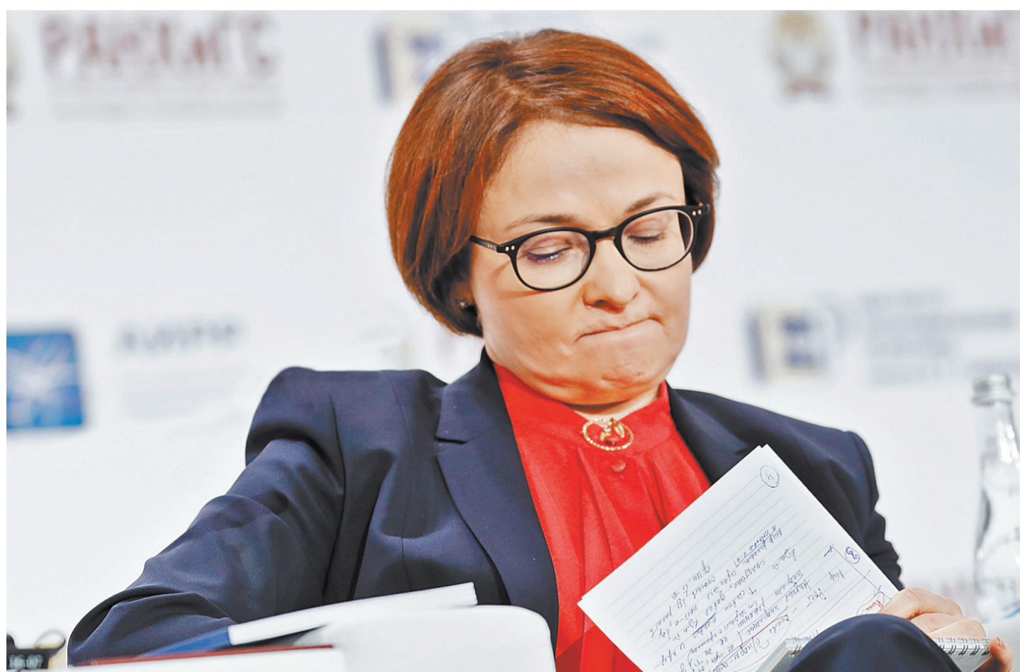
Глава ЦБ Эльвира Набиуллина хочет добиться неотвратимости наказания для мошенников.