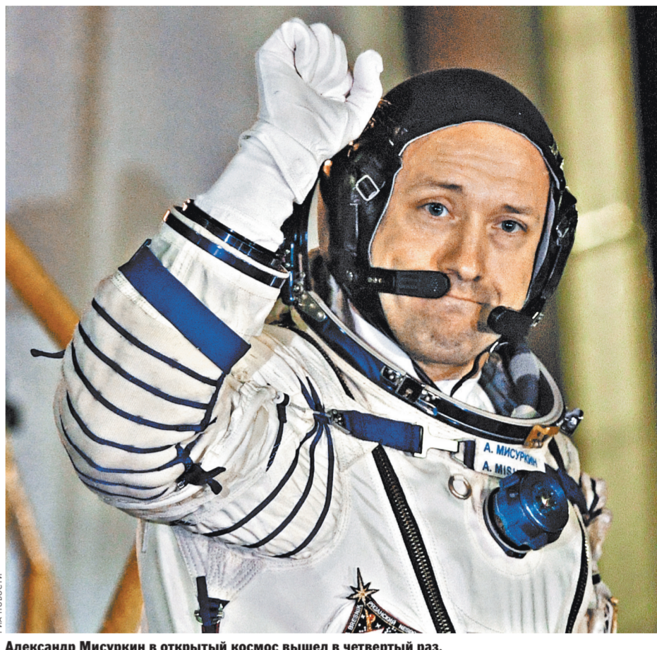
Александр Мисуркин в открытом космосе вышел в четвертый раз.