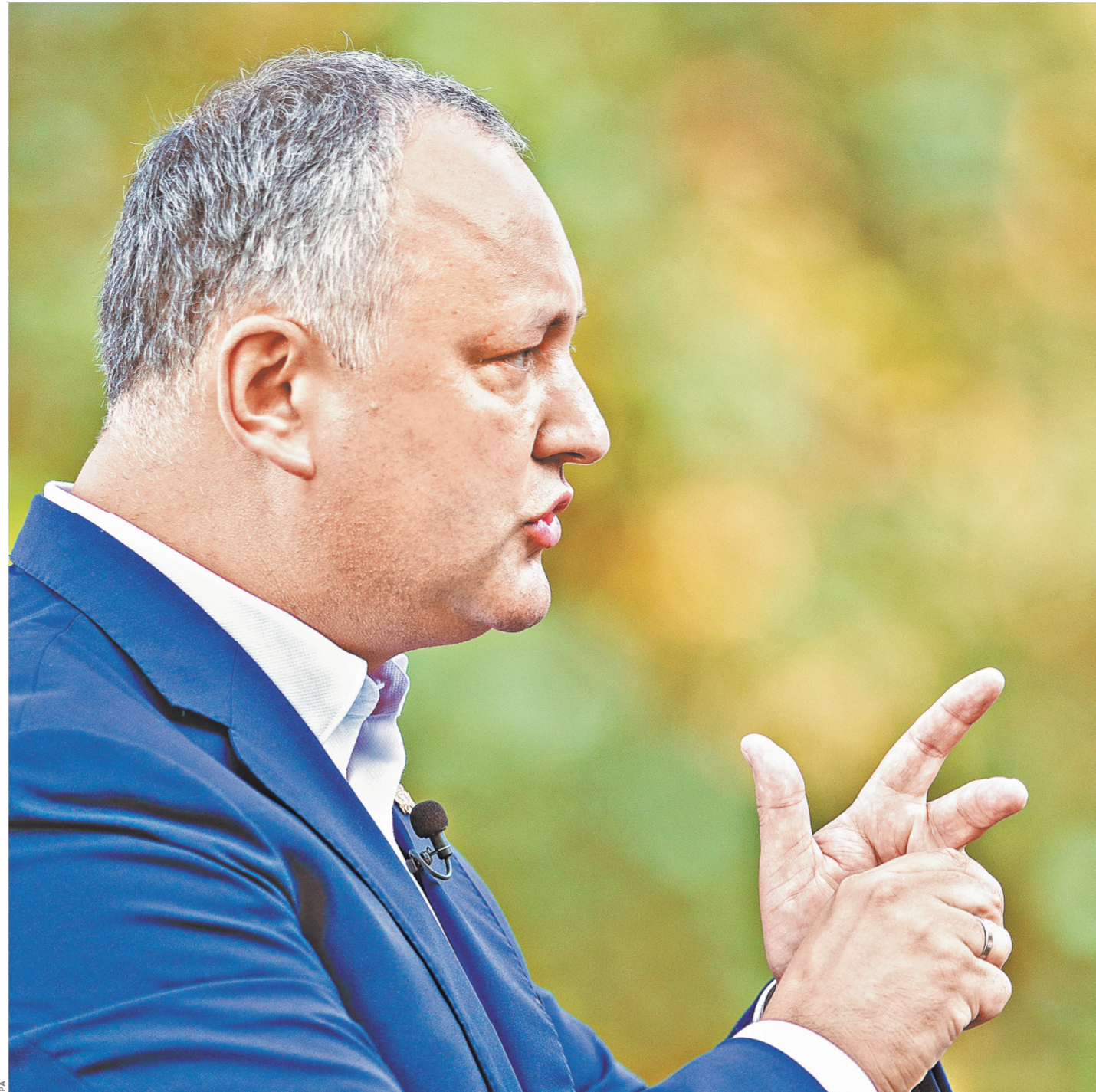
Президент Молдавии Игорь Додон (на фото) распорядился создать Высший совет безопасности, на котором планируется обсудить ситуацию в стране.

При этом Додон предположил, что некоторые политические силы, которые понимают, что проигрывают предстоящие парламентские выборы, преднамеренно разрабатывают этот сценарий и хотят дестабилизировать ситуацию. «Но у них ничего не выйдет», — подытожил президент Молдавии.