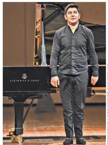
После победы на Международном конкурсе пианистов в Лондоне об игре Бехзода Абдураимова писали как об абсолютной сенсации.

ЕГО имя уже хорошо известно в музыкальном мире. Каждый год 27-летний узбекский пианист играет до ста концертов, выступая с ведущими оркестрами, — Лондонским, Мюнхенским, Консерттебау, TNK, Бостонским, Мариинским и другими. В Концертном зале Чайковского пианист выступил в абонементе Московской филармонии, исполнив сольную программу из сочинений Рихарда Вагнера, Ференца Листа и Сергея Прокофьева. Еще несколько лет назад о дебютах Бехзода Абдураимова в крупнейших концертных залах мира, открывшихся ему после победы на Международном конкурсе пианистов в Лондоне, писали как об абсолютной сенсации, сравнивая его с Владимиром Горовицем и советую «не терять из виду». Не заметить этого узбекского пианиста было невозможно: его уникальная исполнительская харизма сформировалась как будто вопреки всему, что приносит сегодня успех. На фоне востребованного на концертном рынке исполнительского тренда с его доминирующей виртуозностью Абдураимов пораил своей сосредоточенностью совершенно на другом — на погружении в смысл музыки. И хотя техника его настолько феноменальна, что даже листовские «трансцендентности», аккордовые каскады, неистовые пассажи он легко превращает в стройную, ясную ткань, красота его трактовки заключается не в этом, а в самом фортепьянном звуке — поразительно по своей объемности и глубине. На форте или пиано, в головокружительных пассажах или кантлене — звук у Абдураимова поет, развивается, живет внутри детали виртуозной музыкальной ткани.