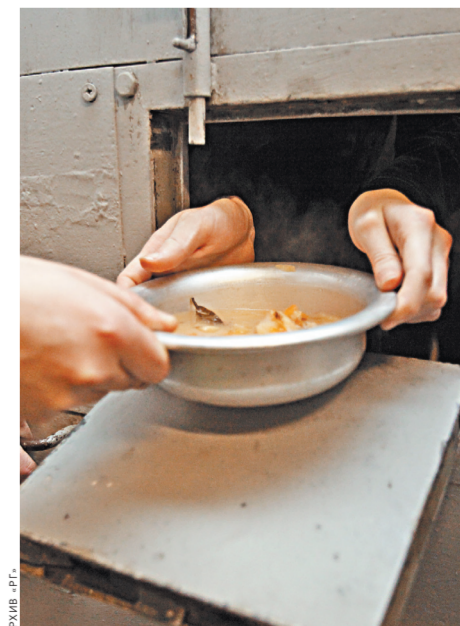
Тюремная пайка рассчитана не формально, а с учетом калорийности каждого продукта.

ПЯТЬ КОЛЕЦ За всю историю олимпийского движения ни одна страна мира не испытывала такого давления, как наша