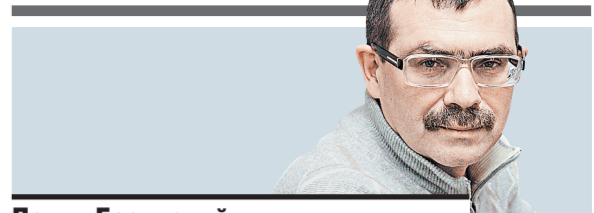
Павел Басинский писатель