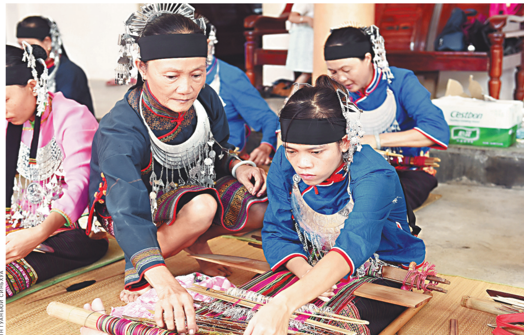
Представители народности ли о. Хайнань.