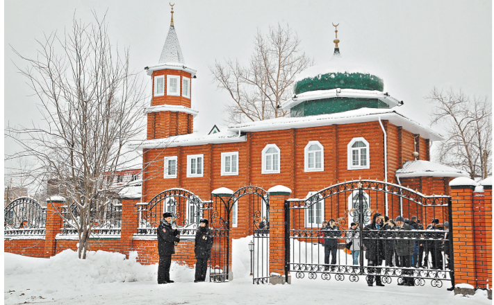
Деревянное здание возведено на том же месте, где находилась прежняя мечеть начала XX века.