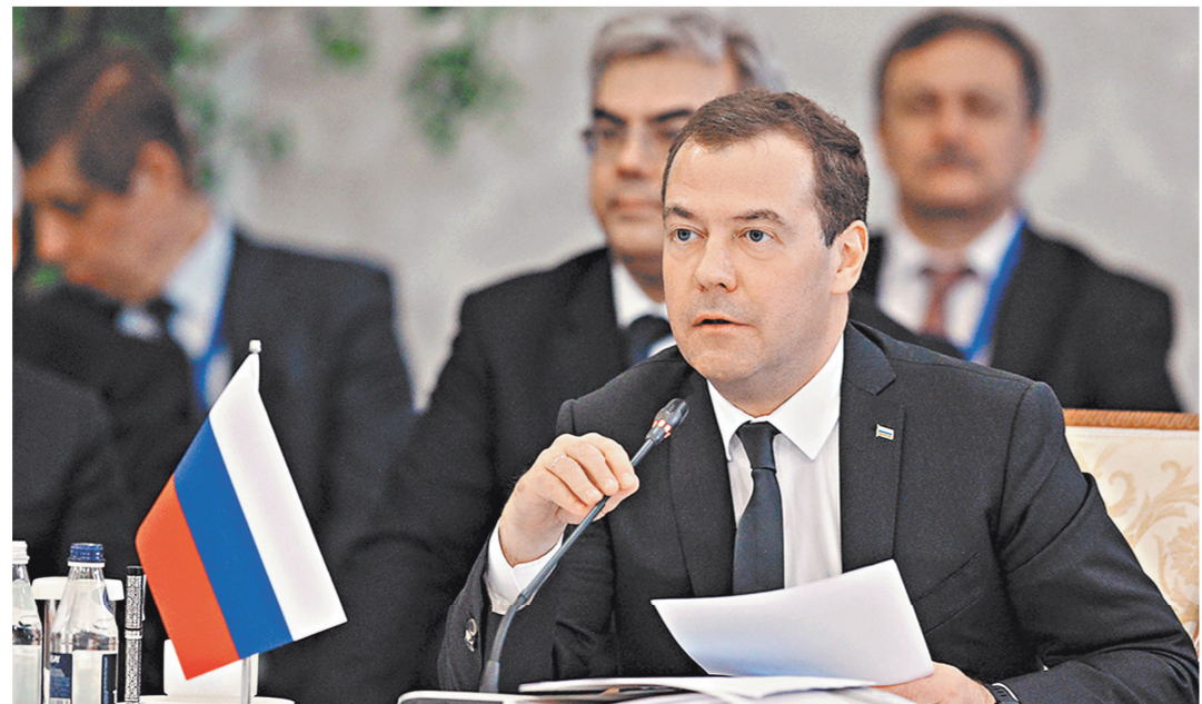
Дмитрий Медведев: Объем взаимной торговли между странами ЕАЭС увеличился почти на 27 процентов.

Новые возможности для свободной торговли внутри союза будут появляться по мере расширения списка товаров, проходящих специальную маркировку. Соответствующее соглашение подписано по итогам встречи межправсовета. Эксперимент с меховыми изделиями дал впечатляющий рост показателей. «Общее количество товаров такого рода, которое мы увидели, увеличилось в 13 раз!» — рассказал Дмитрий Медведев. — А реализация в розницу этих изделий увеличилась в 7 раз. Вот что это зна-