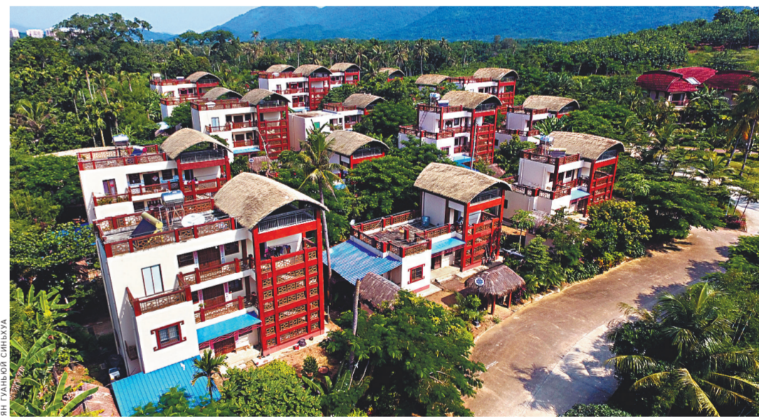
Дома в форме лодки — традиционное жилище народности ли.