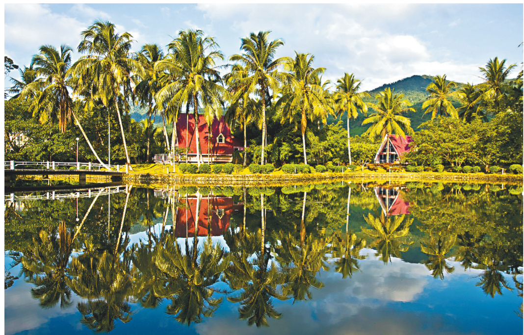
Деревня народности ли на о. Хайнань.

В 2017 году путешественники совершили более 9,51 млн поездок в провинцию Хайнань в рамках программ сельского туризма. Реальные доходы от сельского туризма составили 2,857 млрд юаней.