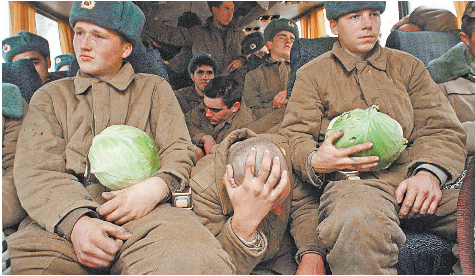
Когда-то военнослужащих каждую осень отправляли на поля собирать капусту. Теперь она, как и другие полезные овощи, практически не исчезает из ежедневного солдатского меню.

Но нельзя исключать, что доля мясных продуктов в человеческом рационе действительно будет сокращаться. Так, известный американский предприниматель Ричард Бронсон считает, что в недалеком будущем мясо станут производить из растений. Поэтому он инвестировал средства в компанию, обещавшую уже к 2021 году выпустить мясо, созданное без участия животных.