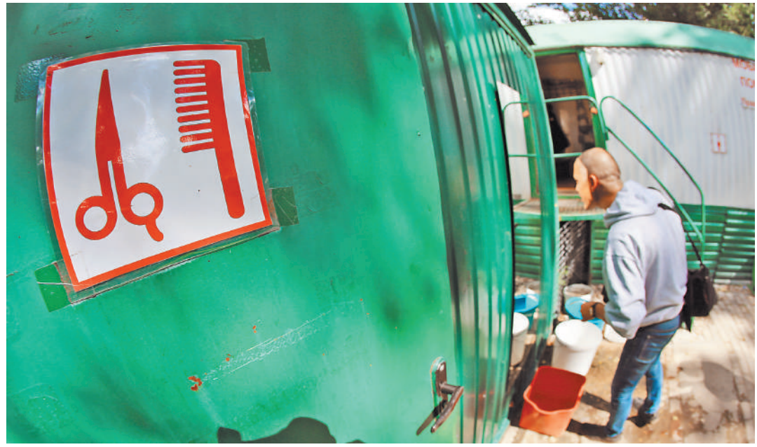
«Ангара спасения». Парикмахерская. Здесь можно постричься как самому, так и у парикмахера.

Каждый месяц сотрудники службы помощи бездомным трудоустривают до 135 человек в службе «Милосердия» и до 120 человек в ЦСА имени Глинки.