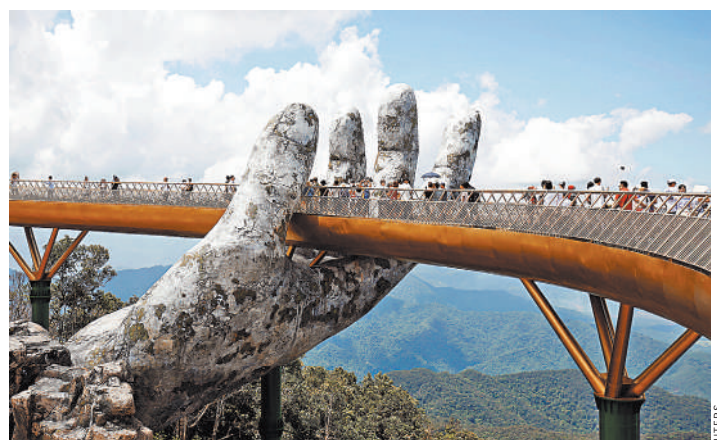
Курортная жизнь может быть комфортной, роскошной, экзотической или даже экстремальной. Но все равно за нее надо платить.

Читайте также: Как изменился общественный транспорт Москвы за последнее время rg.ru/art/1519432