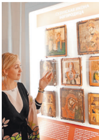
В новом музее представлено более пятисот уникальных экспонатов, собранных со всей Сибири.