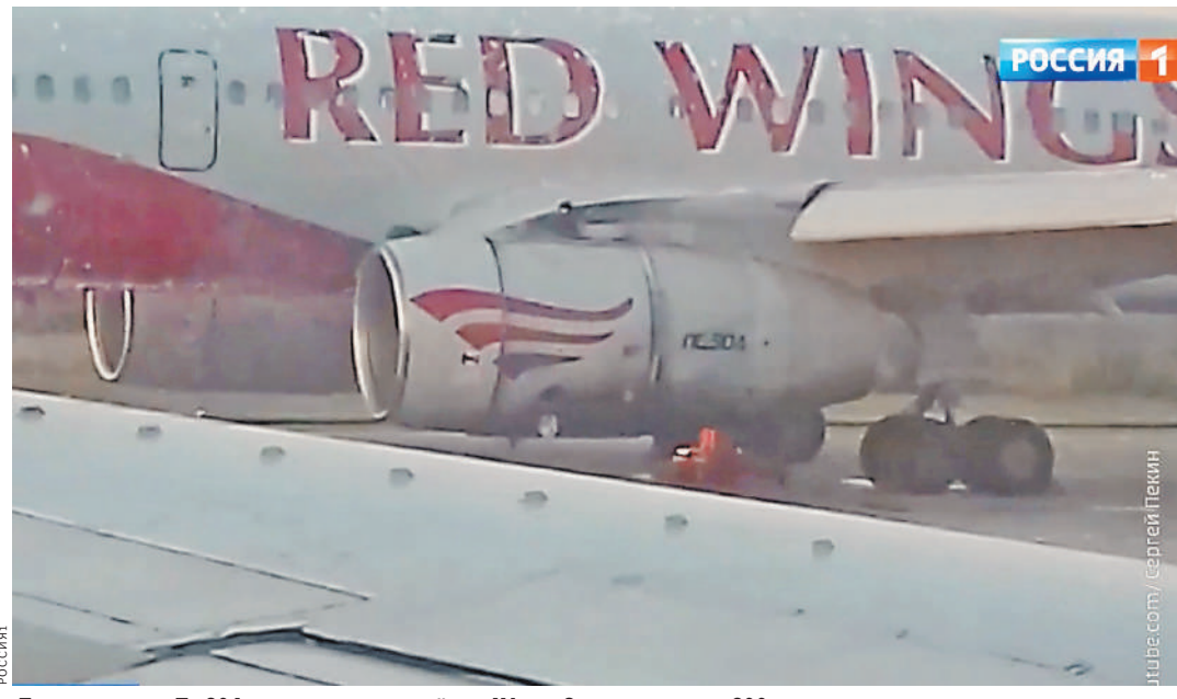
После взлета у Ту-204, выполнявшего рейс из Уфы в Сочи, на высоте 200 метров загорелся двигатель.

— Все пожарные и аварийно-спасательные расчеты аэропорта отработали четко, пассажиров эвакуировали с помощью наддувных трапов спустя семь минут после приземления. Пострадавших нет. С пассажирами сразу же начали работать представители авиакомпании и психологи, — прокомментировала руководитель пресс-службы уфимского аэропорта Татьяна Ризван.