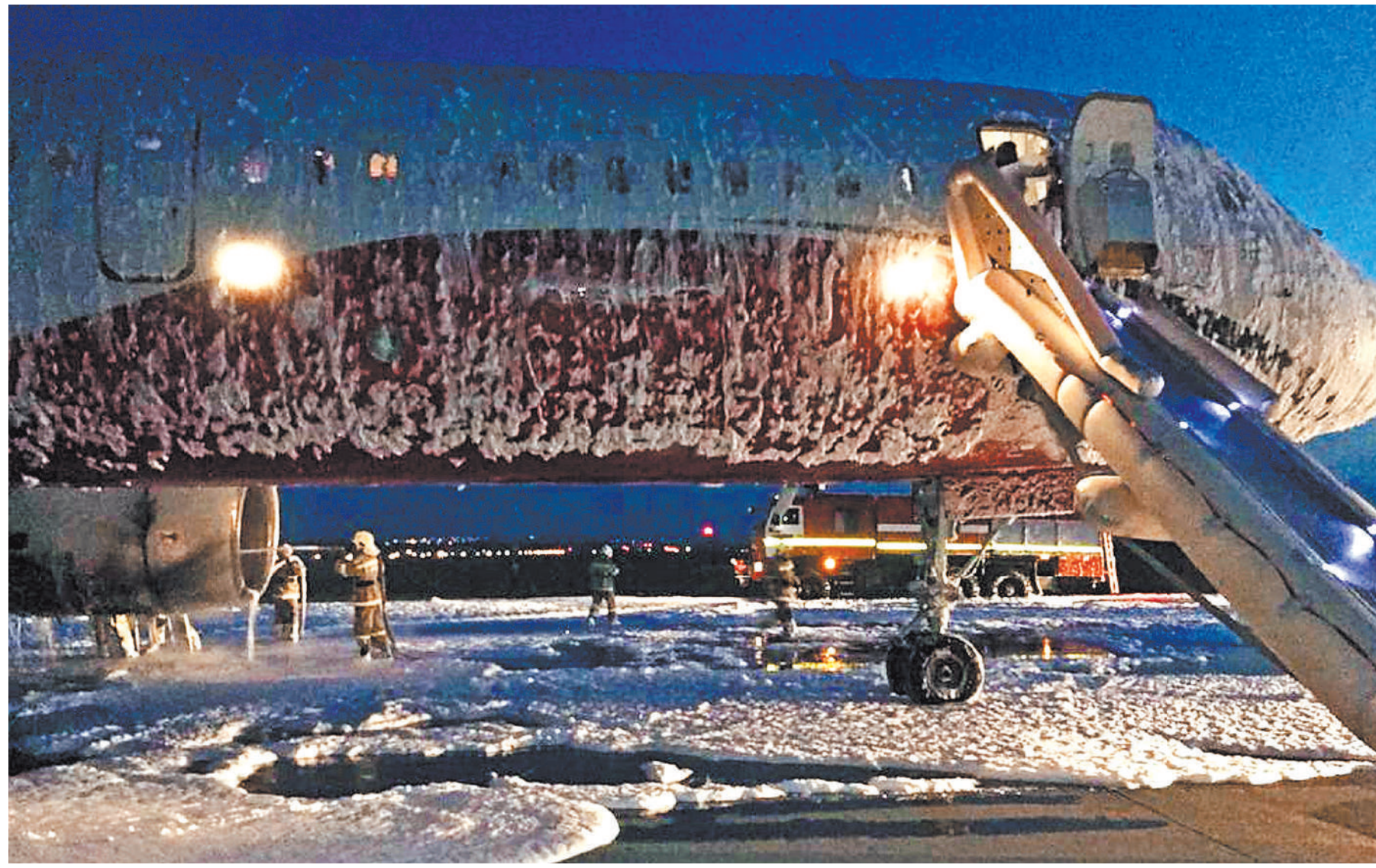
Пожарные и аварийно-спасательные службы сработали четко, пассажиры эвакуировали с помощью надувных трапов.

1 → Результаты расследования ЧП будут позже. При этом в Росавиации уже заявили о том, что летный экипаж самолета Ту-204, а также наземные службы уфимского аэропорта действовали грамотно, слаженно и профессионально.