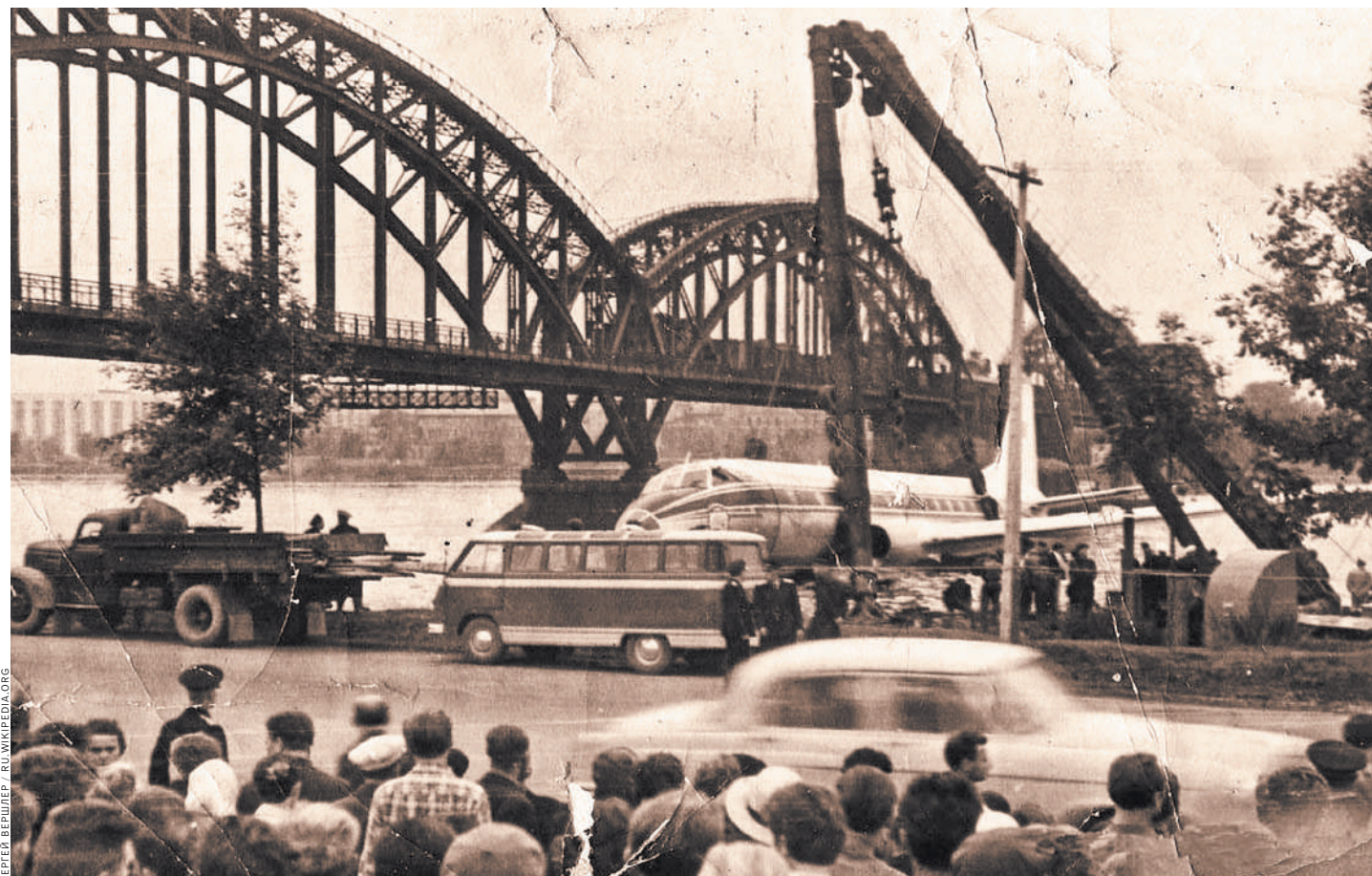
Ту-124 пронесся в четырех метрах над строящимся мостом Александра Невского и мягко сел на воду. Утверждают, что уцелела даже стеклотара для напитков.