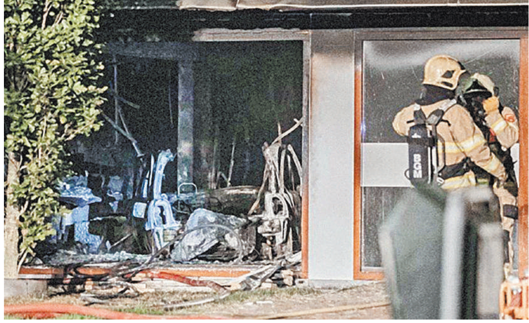
Здание ратуши серьезно пострадало в результате взрыва и последовавшего за ним пожара.