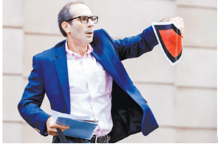
С помощью таких сигналов репортеры сообщали коллегам о приговоре.

молчание. Речь идет о порноактрисе Сторми Дэнзал и бывшей модели Раубуо Карен Макдугал, которые заявили, что в середине 2000-х годов имели интимные отношения с Дональдом Трампом. «Это (выплата денег) было сделано по просьбе кандидата», — пояснил Коэн суду. Цель: избежать «информационной огласки, которая нанесла бы вред кандидату». Заявление было сделано в рамках подписанного Коэном так называемого соглашения о признании вины. «Это очень серьезные обвинения, которые раскрывают и показывают работу на основе лжи и нечестности в течение длительного периода времени», — ска-