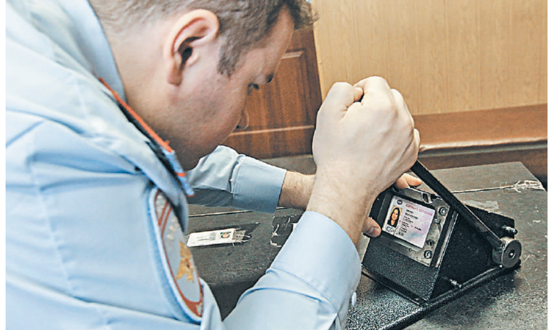
Фраза «водительские права» в документе будет дополнительно переведена на английский и французский языки.

Сроки более 100 тысяч заключенных будут сокращены — узнайте подробности на сайте rg.ru/art/1581164