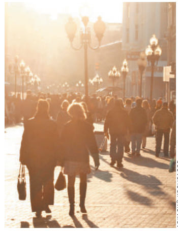
Сложно представить, как по этой улице, любимой многими поколениями москвичей, будут ездить машины.