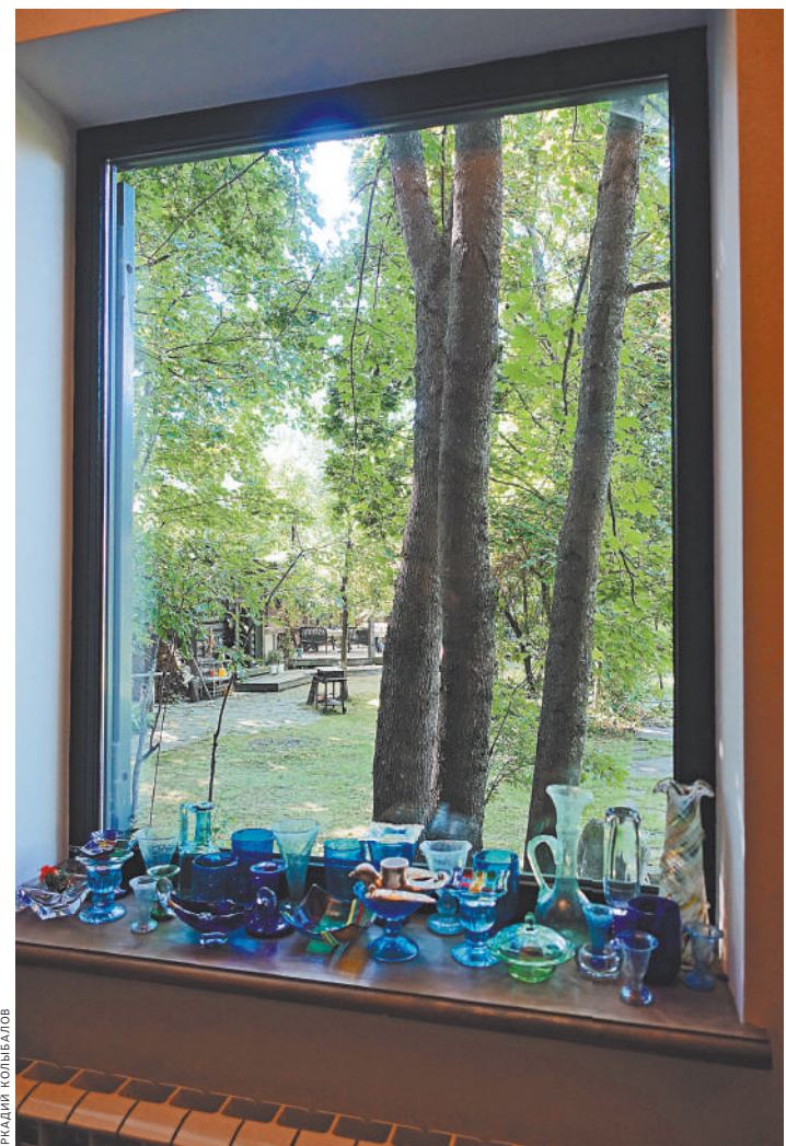
Окна без переплетов, чтобы старые деревья через них смотрелись как картины в рамках.

Фоторепортаж смотрите на сайте rg.ru/sujet/1560