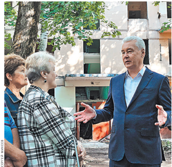
Сергей Собянин: Пятиэтажку на улице Константина Федина не крушат, а разбирают по технологии умного сноса.

Напомним, что программу реновации в столице официально утвердили 1 августа 2017 года. В общей сложности в нее включили 5171 дом. Ожидается, что в современные квартиры переедут более миллиона москвичей.