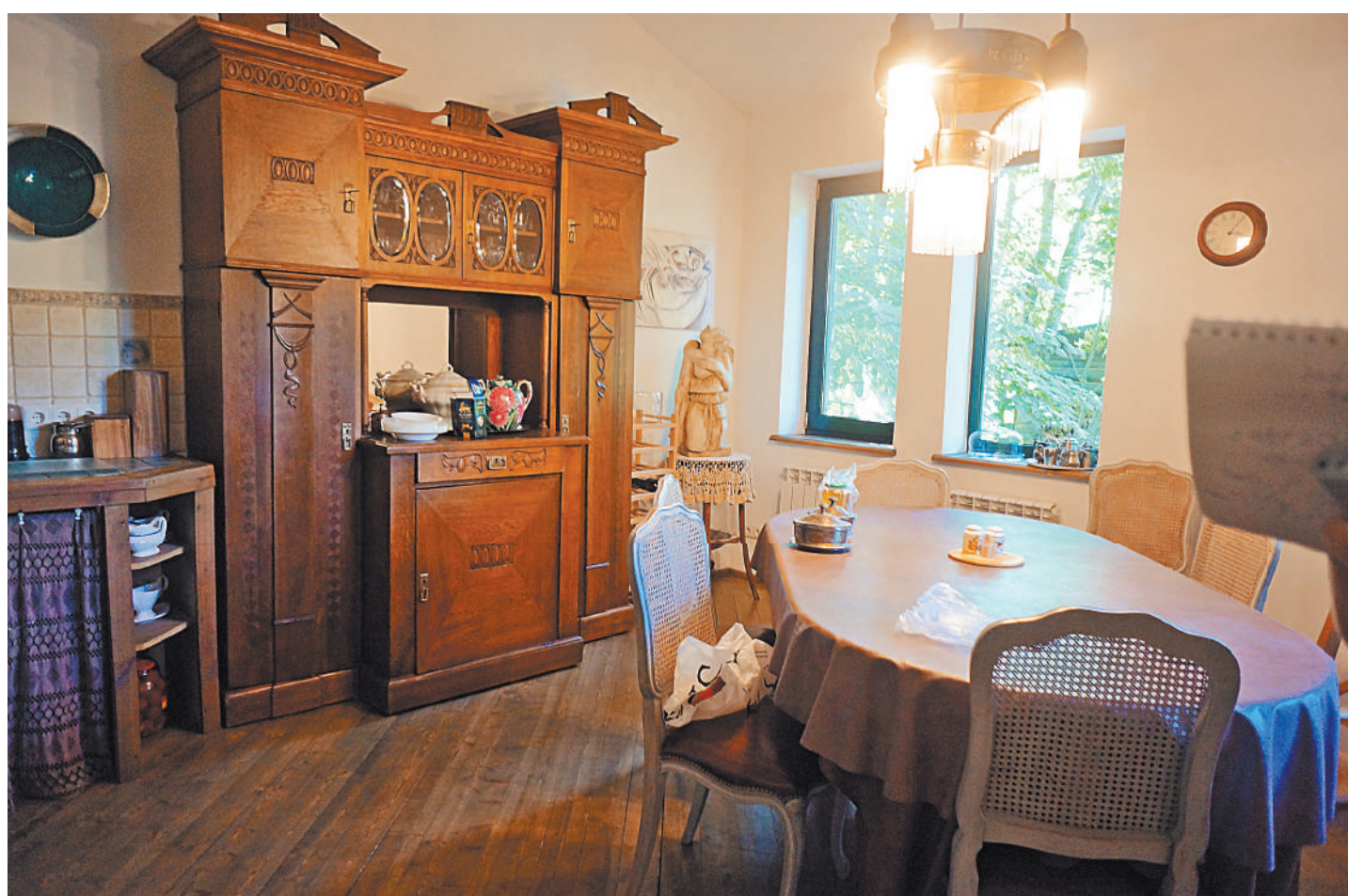
Там же буфет стоял на тбилисской кухне: по скрипу двери в ночи домочадцы понимали, что кто-то налил себе лафитник водки.

сделал свой знаменитый и щемящий своей символикой портрет отца скульптора: очень старый человек в кресле под почти уже упавшим разломленным деревом. Это последнее фото старшего Франгуляна согревает дом.