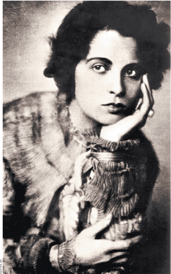
Карола Неер в роли Полли в экранизации «Трехгрошовой оперы» Георга Вильгельма Пабста.

Выставка «Театр жизни Каролы Неер», которая открылась в выставочном зале «Мемориала» на Каретном Ряду, читается как основа пьесы Театра. Дос. Перипетии этой драмы, написанной самой жизнью, документированы очень полно и представлены бережно и точно. Тут есть отчаянные письма Бертольта Брехта Лию Фейхтвангеру с просьбой узнать что-то о судьбе лучшей актрисы его эпического театра. В 1937 году Фейхтвангер тоже в Москве, но в отличие от Каролы Неер в другом статусе — в поисках