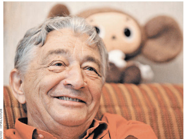
Создателем Чебурашки и Крокодила Гены, почтальона Печкина и Дяди Фёдора, писателем Эдуарду Успенскому — 80.