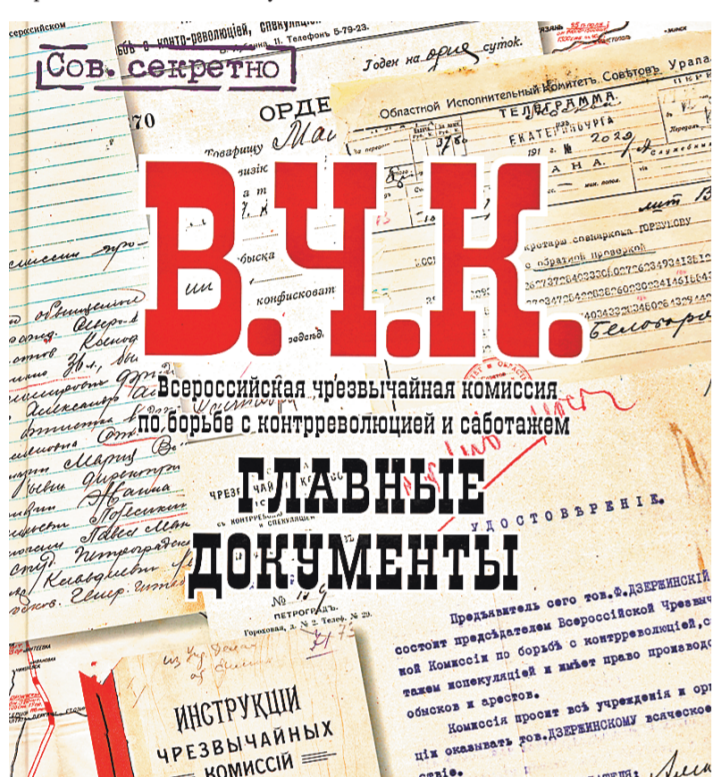
В этом альбоме нет субъективных оценок. Только факты. Только документы.

Представленные материалы позволяют сделать вывод о том, что создание подобного органа, как Всероссийская чрезвычайная комиссия, было крайне необходимым шагом в условиях выживания молодой и неокрепшей Советской Республики.