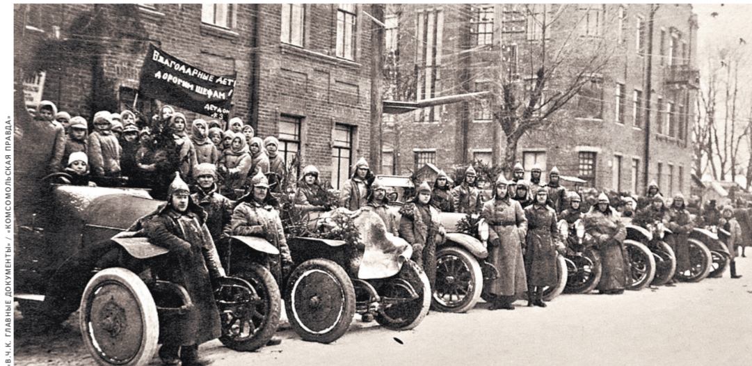
ВЧК имела территориальные подразделения для борьбы с контрреволюцией и саботажем на местах. Самой технически оснащенной была Петроградская ЧК (Петрочека).