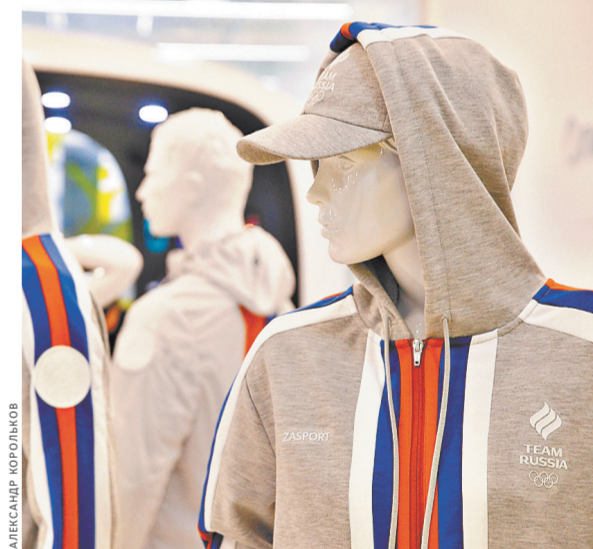
Производителям формы для наших олимпийцев придется избавиться от российского триколора.

Кроме того, для униформы допустимы только один или два цвета. Важная деталь — расцветка формы в принципе не может повторять национальные цвета России. «Предполагается, что оттенки будут более темными», — говорится в документе. Все элементы дизайна, свидетельствующие о национальной принадлежности — гербы, эмблемы федераций или Олимпийского комитета России, — также под запретом. Ну а окончательное добро на форму должен дать МОК.