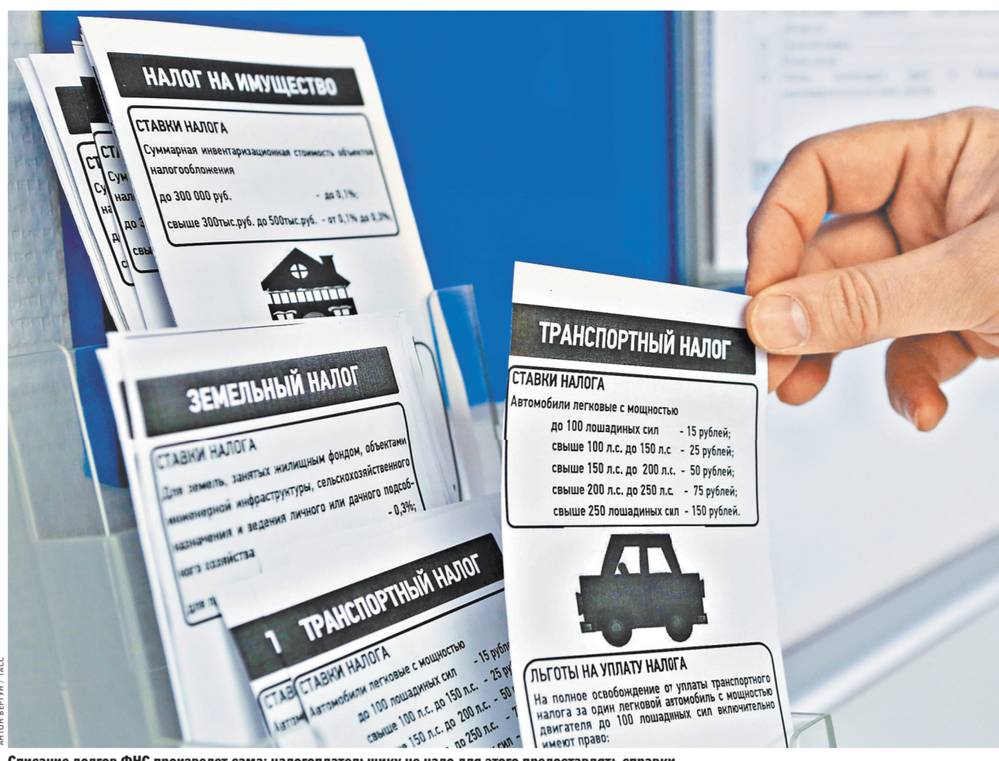
Списание долгов ФНС произведет сама: налогоплательщику не надо для этого предоставлять справки.

Орловский отмечает, что было бы справедливо, если бы так называемые вмененные налоги и взносы (ЕНВД, патентная система, фиксированная часть взносов индивидуальных предпринимателей) ставились в зависимость от того, получен ли доход от предпринимательской деятельности — хотя бы по налоговым или расчетным периодам (квартал, год). «С ЕНВД еще куда ни шло: можно списать с учета и встать на учет снова. На патентной системе можно покупать патенты на месяц. Это неудобно, но тоже выход. Но со взносами все гораздо сложнее, — говорит собеседник «РГ». — Не платить взносы в фиксированном размере можно лишь по весьма ограниченному количеству оснований (уход за пожилым членом се-