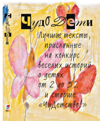
Книгу оформила шестилетняя художница.

Наступающий 2018 год не станет исключением. Редакция сайта совместно с отделом культуры «Российской газеты» решила объявить конкурс «До первой звезды». Чтобы напомнить читателям: Новый год и Рождество — это не просто время застолий и путешествий, но и время чудес. Мы предлагаем читателям написать настоящий святочный рассказ. Только, разумеется, не XIX, а XXI века.