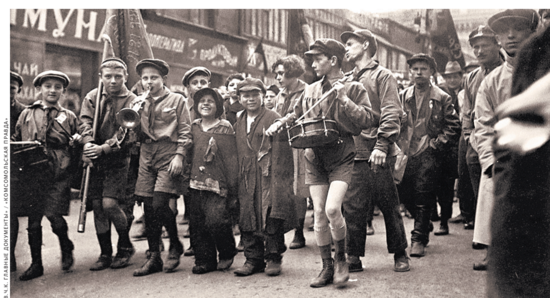
1920-е годы. В результате сотни тысяч детей-сирот, оставшихся на улице, получили кров и возможность учиться.