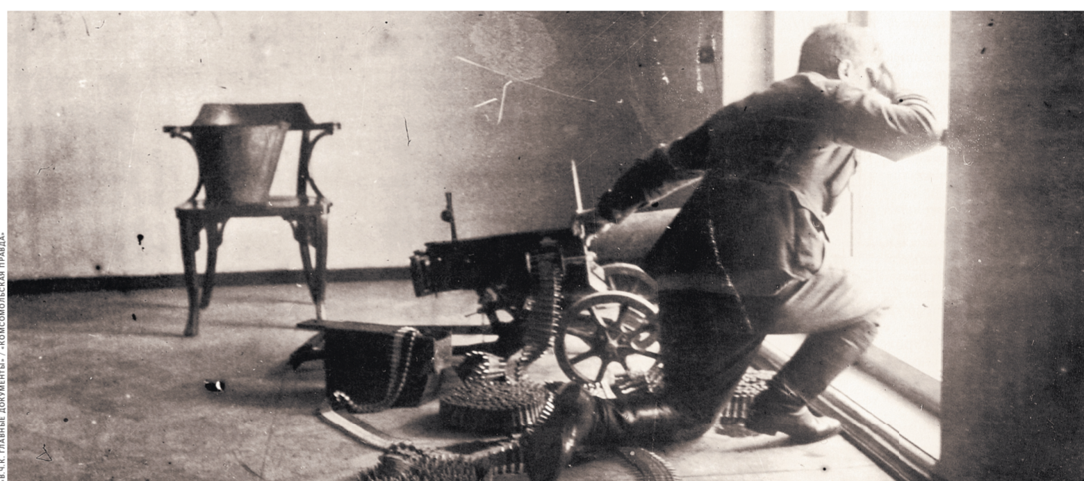
1917г. Сотрудникам ВЧК в буквальном смысле часто приходилось защищаться с оружием в руках.