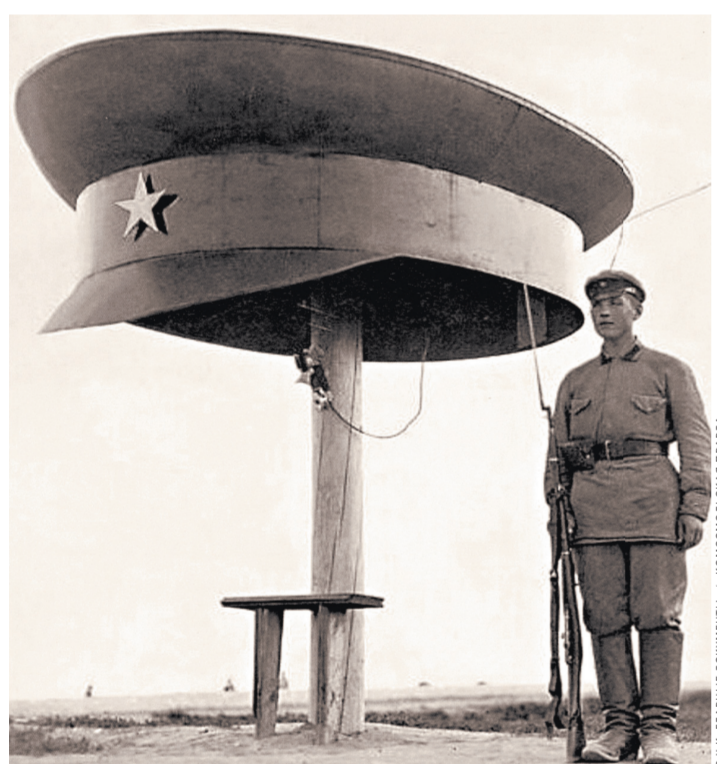
В обязанности ВЧК с августа 1918 года входило и обеспечение пограничного контроля на границах страны.