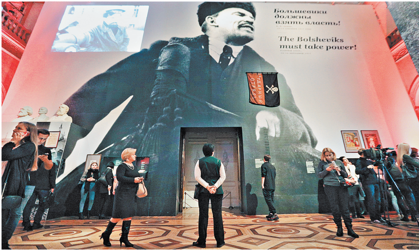
Сергей Комаров / ТАСС