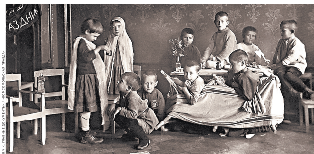
1920-е годы. По личному распоряжению Дзержинского чекисты уделяли первостепенное значение не только борьбе с саботажем, но и искоренению беспризорности.