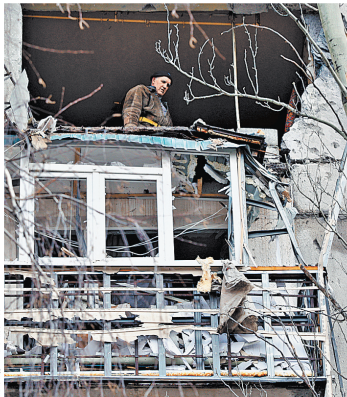
В Горлово очередной жилой дом был разрушен после обстрела вооруженными силами Украины.

Это заявление, по данным ТАСС, сделал депутат Верховной рады Украины от «Блока Петра Порошенко» Рефат Чубуров. И добавил: «Я абсолютно уверен, что надо предлагать другую страну для переговоров по обеспечению территориальной целостности Украины».