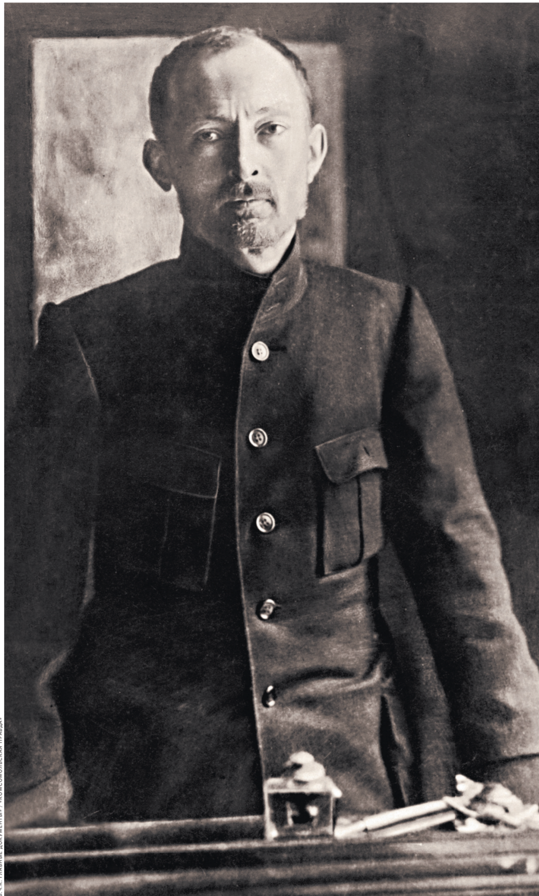
1918 год. Председатель ВЧК Феликс Эдмундович Дзержинский стоял у истоков создания отечественных спецслужб.