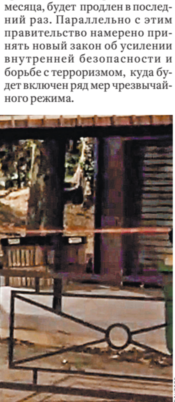
Следствие еще не решило, что случилось в Авиньоне — теракт или криминальная разборка.

В этих условиях перед французским правительством встает вопрос о необходимости продления чрезвычайного положения, которое, напомним, было введено около двух лет назад. Ясно, что так не может продолжаться вечно, о чем регулярно напоминают местные правозащитники. Судя по всему, власти нашли выход из создавшейся пиковой ситуации. Скорее всего, чрезвычайный режим, а его срок истекает в середине этого месяца, будет продлен в последний раз. Параллельно с этим правительство намерено принять новый закон об усилении внутренней безопасности и борьбе с терроризмом, куда будет включен ряд мер чрезвычайного режима.