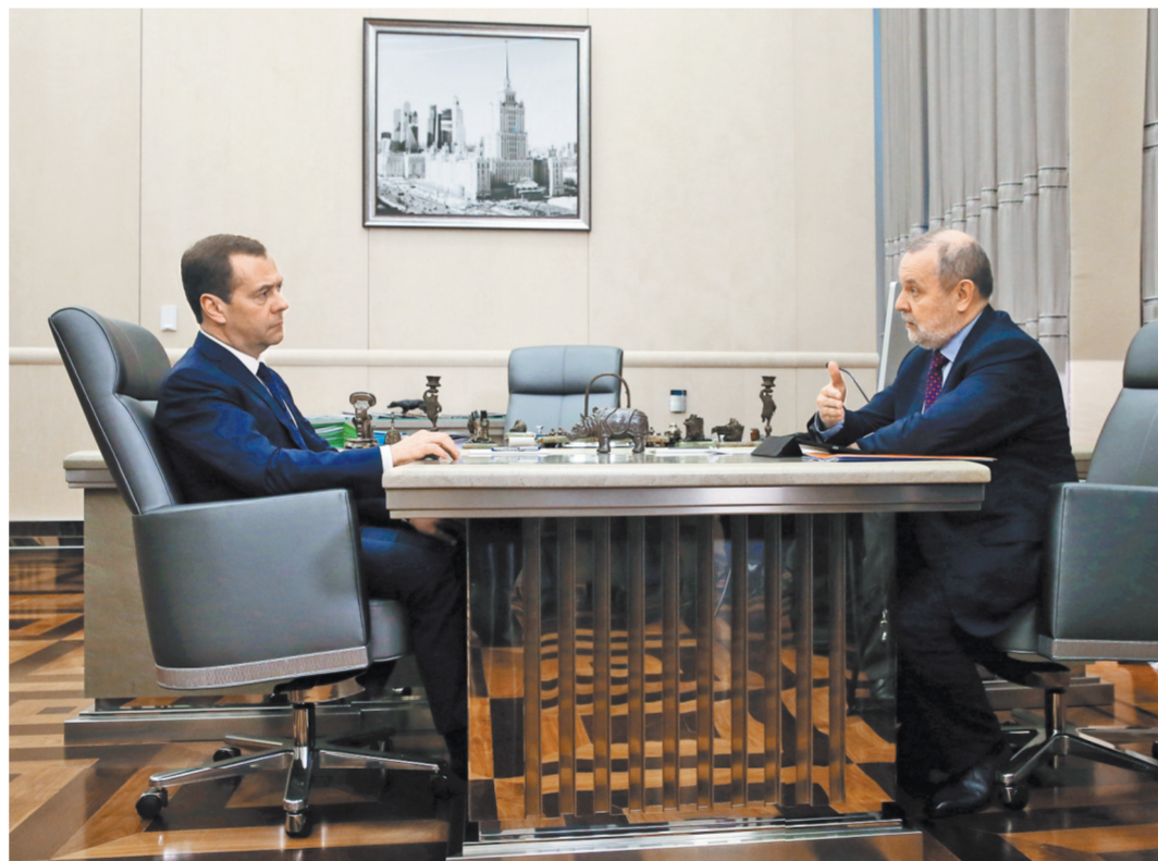
Глава ФСС Андрей Кигим рассказал премьер-министру, как будет осуществлен переход на электронные больничные.

Дмитрий Медведев призвал ФСС внимательно следить за размещением заказов на средства реабилитации. Финансирование этих целей увеличилось, напомнил премьер. «Но надо и здесь наводить порядок, заказы правильно размещать», — поставил задачу он. Его собеседник в ответ рассказал, что в фонде «рассматривают вопрос, что выгоднее — централизованные торги или нет». «Но то, что необходимо добиться снижения неэффективных затрат — это очевидно», — согласился Кигим.