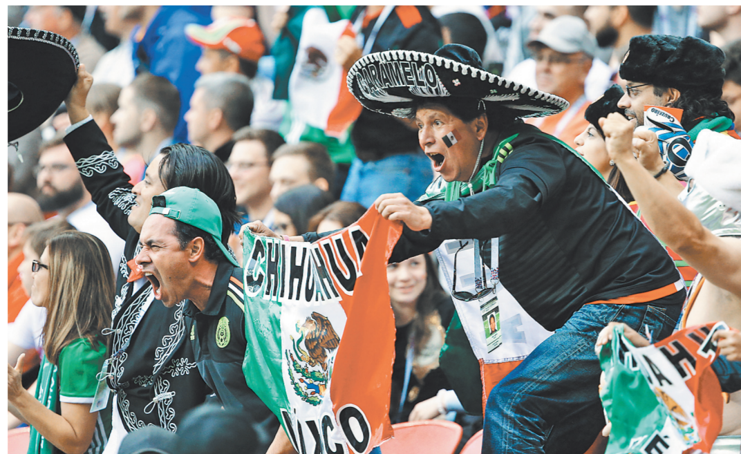
На трибунах российских стадионов самыми заметными были болельщики из стран Латинской Америки.

Кубок конфедераций, который еще называют «Турнир чемпионов», принято считать генеральной репетицией главного турнира четырехлетия. Не столько в футбольном плане, хотя и чисто спортивные моменты играют тут не последнюю роль, сколько именно в организационном. И перед Россией стоял здесь особенный вызов. Скептиков, которым вообще не нравилась идея проводить столь масштабные турниры в нашей стране, хватало. Тем приятнее было наблюдать, как менялись за эти 16 дней впечатления тех, кто приехал в Петербург, Москву, Казань и Сочи в поисках проблем с безопасностью, хулиганов, расистов и прочих безобразий. Вместо этого они увидели практически образцовую организацию, радуших людей на улицах и прекрасные стадионы.