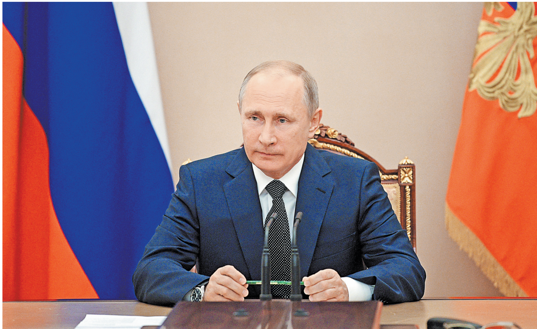
Вчера Владимир Путин провел оперативное совещание с постоянными членами Совета безопасности. Обсуждались актуальные вопросы социально-экономического развития страны. Кроме того, затрагивались международные темы, в частности сирийская проблематика в контексте подготовки к намеченной на начало июля в Астане (Казахстан) очередной встрече по сирийскому урегулированию.

Вячеслав Володин также сообщил о том, что в Госдуме будет создана постоянная рабочая группа по решению проблем уже обманутых дольщиков.