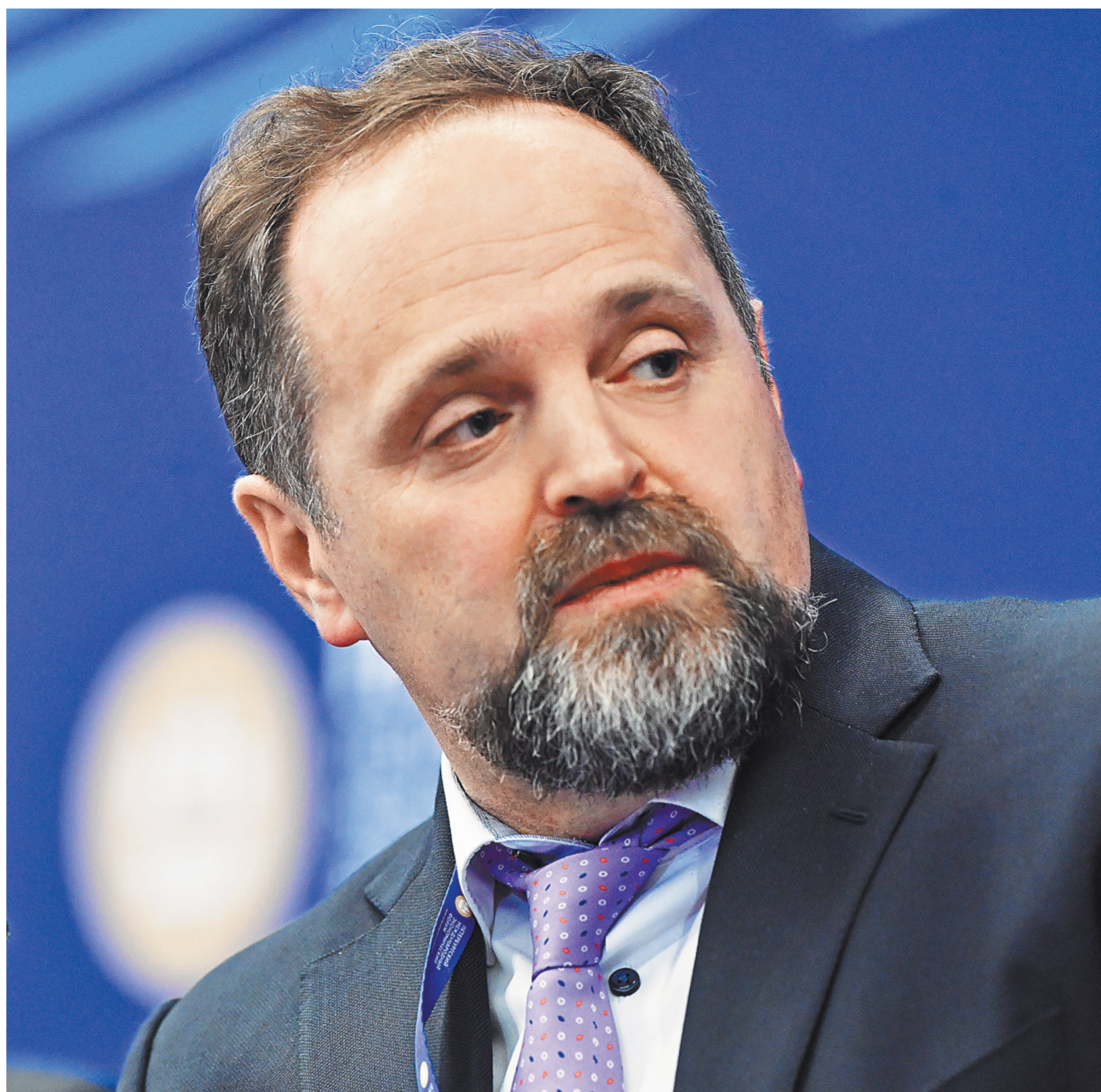
Сергей Донской: Россия видит в отходах источник дополнительного сырья.

1 Уже подготовлено соответствующее постановление правительства. Мы считаем, что запрет на захоронение — это стимул для переработки. Лом цветных и черных металлов, он перерабатывается. Есть большой спрос на полученную продукцию, и отправляют ее на полигоны — преступление.