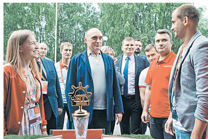
Губернатор Челябинской области Борис Дубровский на форуме «УТРО» не оставил ни одного вопроса без ответа.