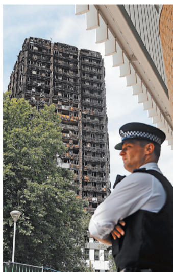
Экономия на отделочных материалах привела к гибели 80 человек.

Как выяснилось недавно, алюминиевые панели не проходили проверку на возгораемость. Плюс к этому высотка изначально имела конструктивную особенность, которая должна была привести к трагедии в случае пожара — в ней жили более 600 человек, и на всех была лишь одна лестница, хотя обычно в постройках такого типа лестниц минимум две.