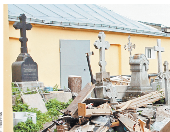
Нарушение порядка на кладбище наказывается по Закону «О защите прав потребителей».

Суд первой инстанции точно установил: когда работники кладбища копали новую могилу, она на соседней уничтожили «цветник, выполненный ручным способом из специально привезенного речной гальки, а