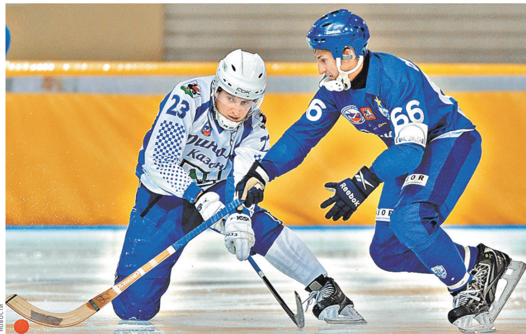
Ведущие игроки казанского «Динамо» в один миг оказались безработными.