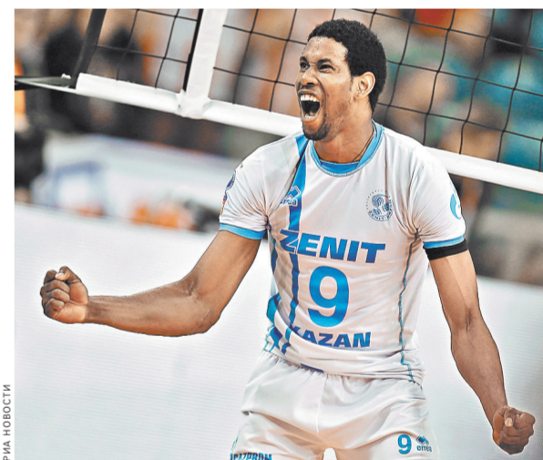
Зенитовец Вильфредо Леон сразу ошеломил динамовских принимающих своими неберущими подачами.

Вчера же параллельно стартовал и чемпионат мужской Молодежной лиги. Здесь выступают 14 резервных команд всех клубов Суперлиги. Участники до первой декады февраля включительно проведут двухкруговые соревнования по туровой системе, после чего состоятся финальные этапы за 1-6-е, 7-10-е и 11-14-е места.