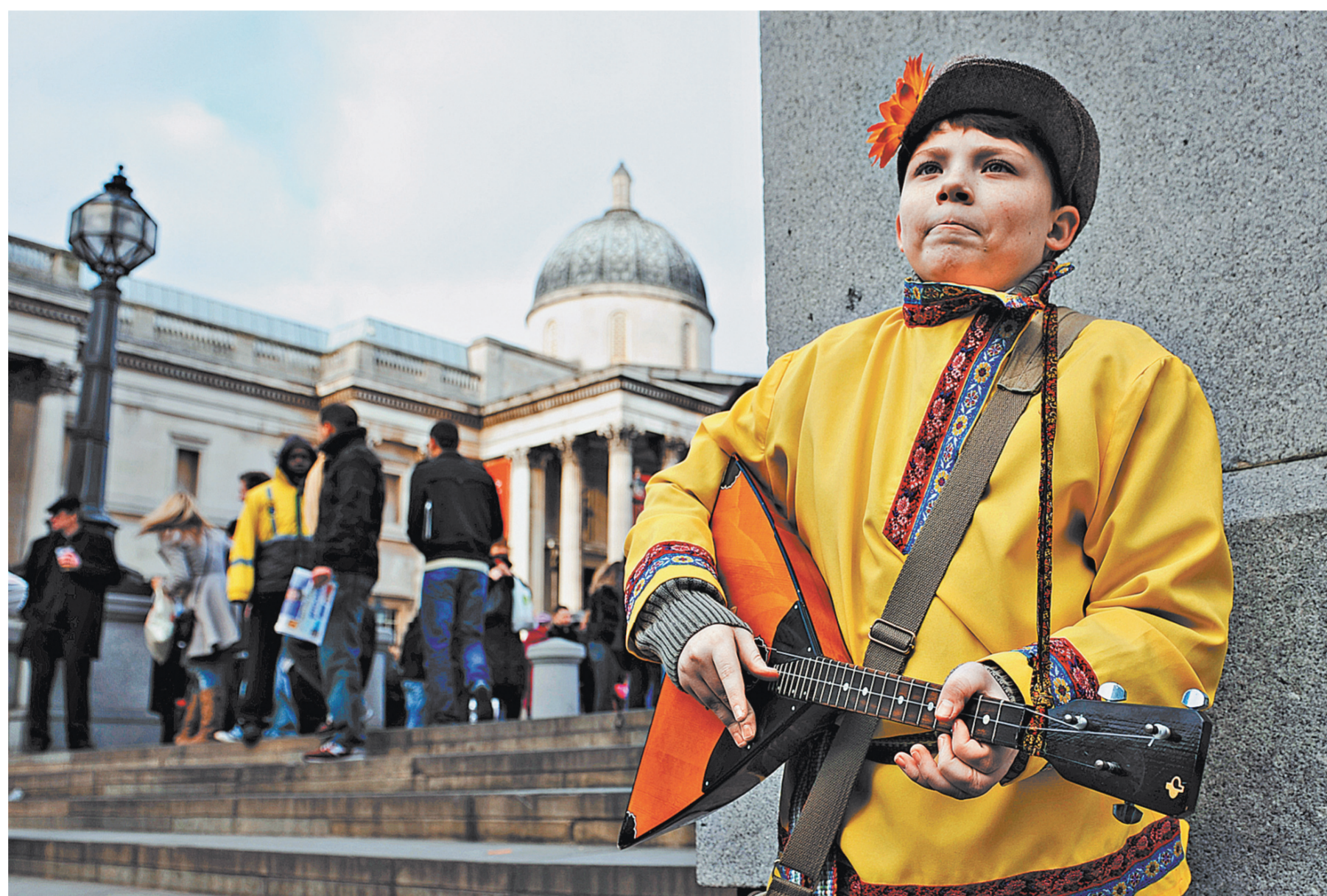
Честно заработанные за границей деньги россияне смогут спокойно положить в иностранный банк.

Игорь Зубков Для российских граждан, подолгу живущих за границей и не порывающих связь с Родиной, хотя сняты ограничения на пользование счетами в иностранных банках. Но при этом от тех, кто прожил на чужбине десятки лет, после возвращения в Россию могут потребовать отчитаться о деньгах, проведенных за это время по счетам иностранных банков.