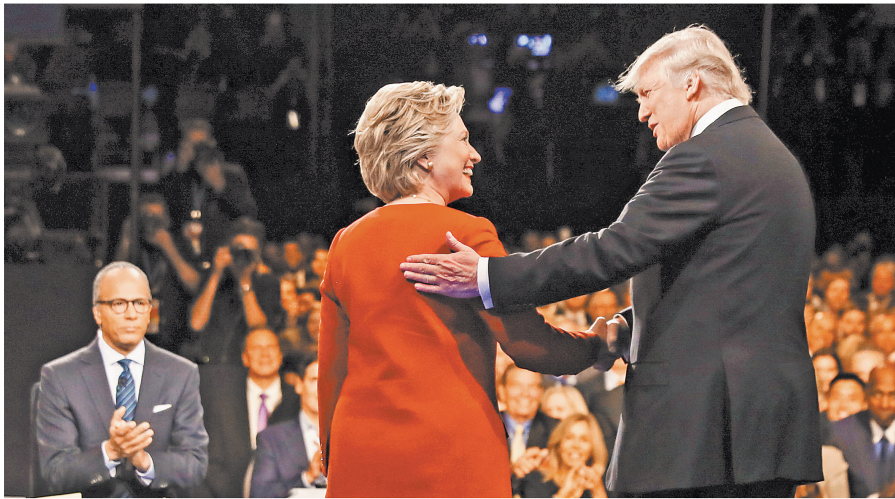
Встреча Клинтон и Трампа началась с обмена любезностями, но скоро от улыбок не осталось следа.

Игорь Дунаевский «Российская газета», Вашингтон