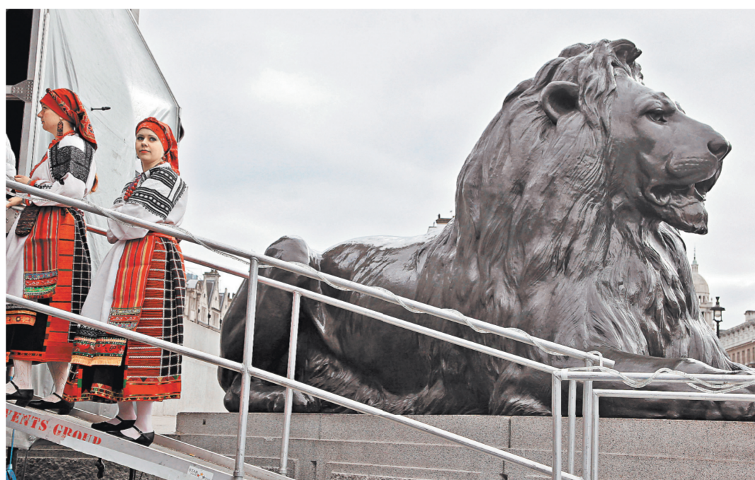
Эти участники русской Масленицы на Трафальгарской площади в центре Лондона, возможно, и не подозревают, что за получение гонорара через зарубежный банк они могут слопотать крупный штраф.

Законопроект читайте на сайте rg.ru/art/1312395