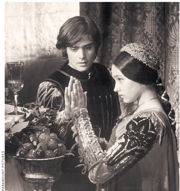
Современным Ромео и Джульеттам для регистрации брака в Европе нужны разрешения и от родителей, и от властей.