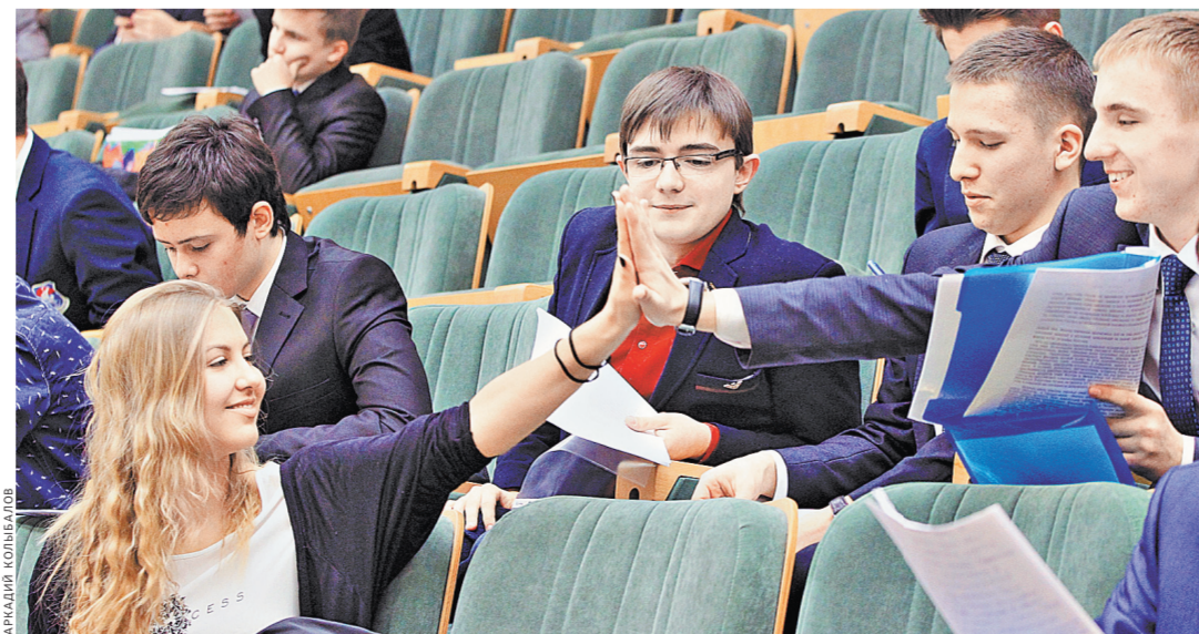
Самые большие льготы дают олимпиады первого уровня.

Все олимпиады разделены на три уровня. Самую большую