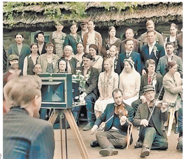
Фильм «Волынь» повествует о любви в бесчеловечную эпоху.

Трагедия на Волыни коснулась лично и создателей фильма. Так, у известного польского композитора Кшесмира Дембского, написавшего музыку к картине, на Волыни от рук бандеров-