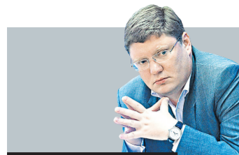
Андрей Исаев Заместитель председателя Государственной Думы