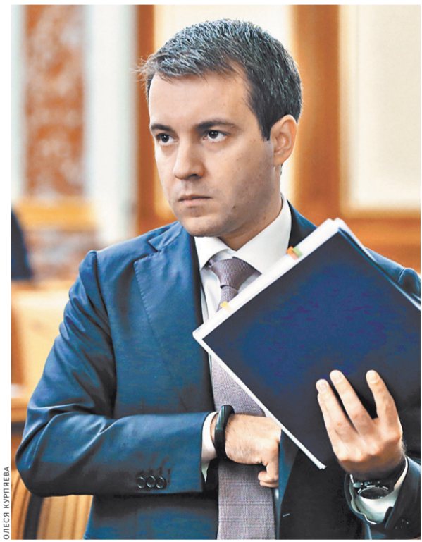
Николай Никифоров: Необоснованные тендеры на закупку иностранного ПО будут приостанавливаться молниеносно.

Сначала к этой системе будет подключено 6 тысяч пользователей, а после «обкатки» — уже 600 тысяч всех работников, пообещал министр правительства Москвы Артем Ермолаев. Можно сказать, что в столице будет создана своя корпоративная почта — такого масштаба еще не было. Если проект будет удачным, то его планируется предлагать не только другим регионам, но и на экспорт. «Это вопрос информационной безопасности и нашего стратегического лидерства в сфере информационных технологий», — отметил Николай Никифоров. Россия сейчас продвигает наши компании на внешние рынки, в том числе и в Иран. Переговоры об этом готовы вести и в Японии. В октябре прошлого года в Москве прошла первая встреча министров ИТ-отрасли стран БРИКС (Бразилия, Россия, Индия, Китай, ЮАР), где Россия впервые предложила свои продукты на экспорт. Пока в нашей стране и странах БРИКС доля продуктов, которые нуждаются в импортозамещении, превышает 90 процентов. И изменить ситуацию можно только сообща. Разработать план действий эксперты смогут 10–11 ноября в Индии, где пройдет вторая встреча министров стран БРИКС, напомнил министр связи.