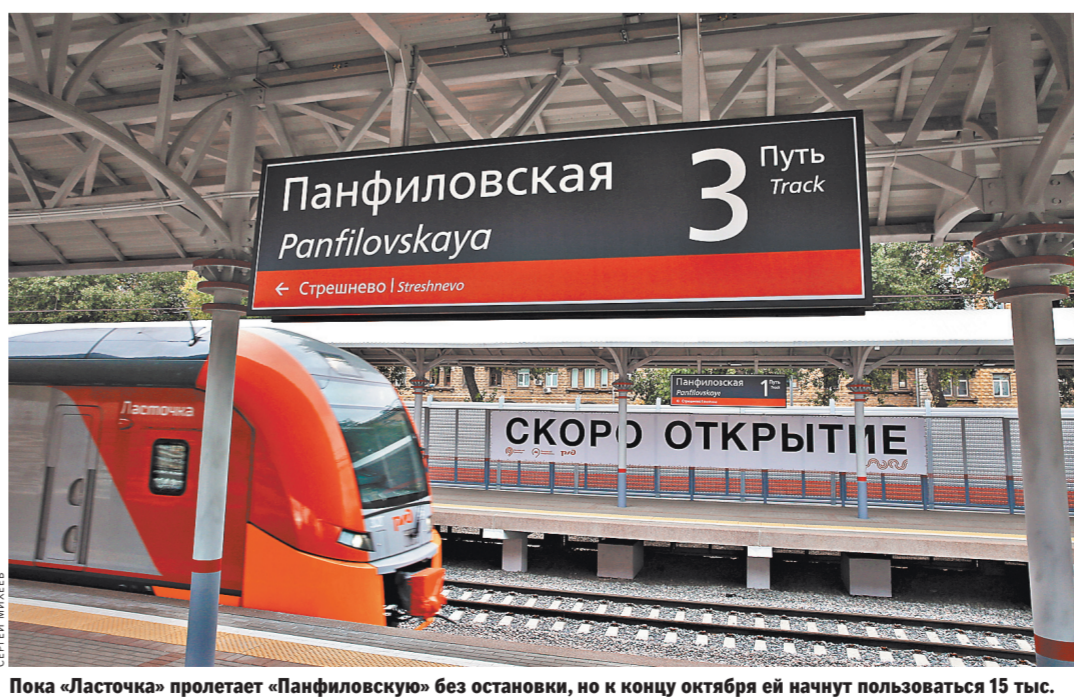
Пока «Ласточка» пролетает «Панфиловскую» без остановок, но к концу октября ей начнут пользоваться 15 тысяч человек.

Напомним, МЦК, ставшее вторым, наземным кольцом метро, открылось 10 сентября. В этот день пассажиры приняли 26 станций, большинство из которых обеспечивают пересадку на метро, наземный транспорт или электричку. В ряде случаев проезд на фирменном поезде «Ласточка» экономит уйму времени. Например, до его запуска от «Бульвара Рокоссовского» до «Владыкино» приходилось ехать не меньше 40 минут. С учетом пересадки — это 16 станций на метро. А на МЦК на тот же маршрут достаточно 12 минут.