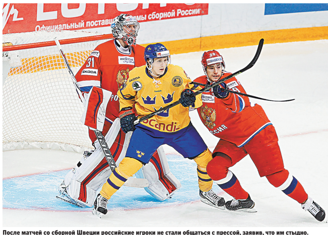
После матчей со сборной Швеции российские игроки не стали общаться с прессой, заявив, что им стыдно.

езд Малкина может серьезно усилить сборную. И тут может быть только один камень преткновения — состояние его здоровья. Поговаривают, что Евгений мог играть в плей-офф с травмой, и если эта информация подтвердится, в Чехию звездного форварда мы можем и не увидеть.