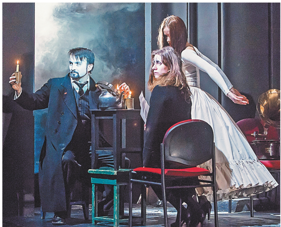
Бутусов открывает булгаковскую пьесу через поэтику сюрреалистического, горячечного сна.

Впрочем, все это могло только показаться. Спектакль только начинается жизнь на огромной сцене Театра им. Вахтангова.