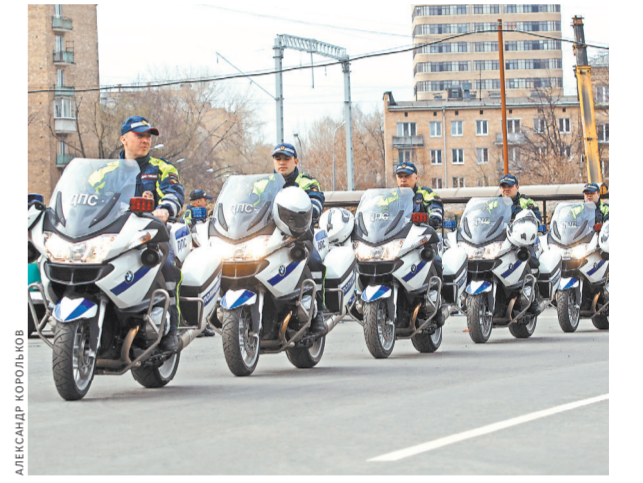
Ганшиники на мотоциклах устроили не просто парад, но показали такие трюки, что ахнули бывалые «байкеры».

Задача у них с виду простая: на время проехать трассу, которая состоит из экзаменационных элементов — «змейка», разворот в ограниченном пространстве, заезд в бокс, парковка задним ходом, движение в габаритном коридоре. В качестве дополнительного элемента —