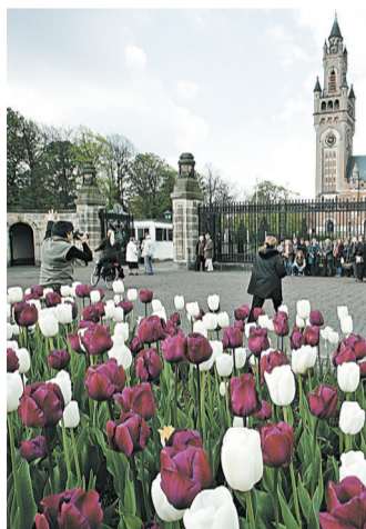
Голландские тюльпаны могут исчезнуть из России, если будет введен реэкспорт из стран ЕС.