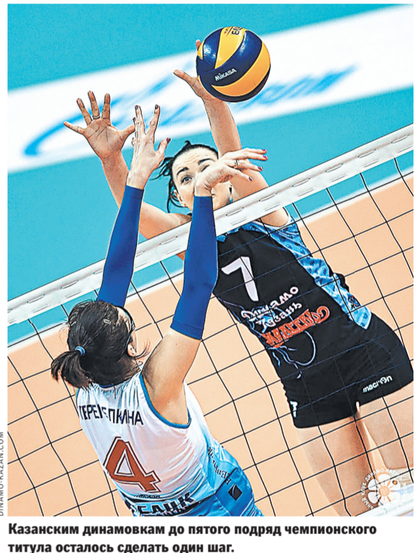
Казанским динамовцам до пятого подряд чемпионского титула осталось сделать один шаг.