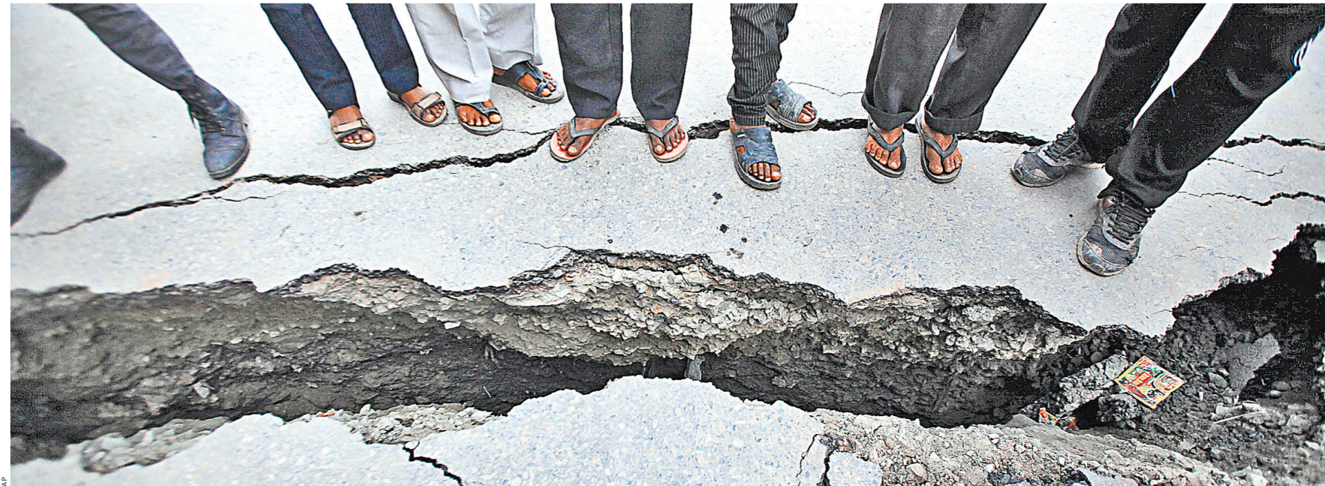
Землетрясение чревато обострением политических разногласий в Непале и ростом социальной напряженности.