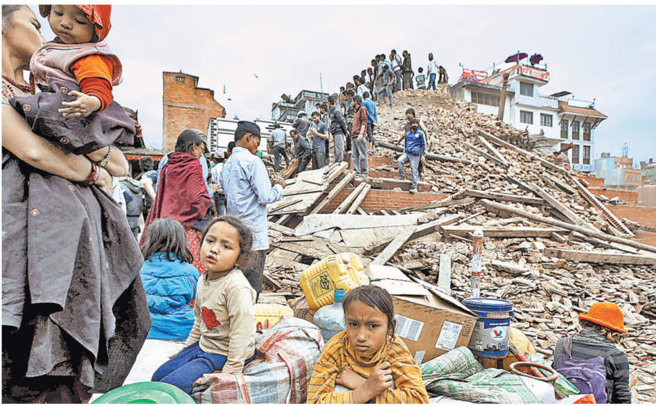
Огромное количество непальцев остались без крова перед приближающимся сезоном дождей.