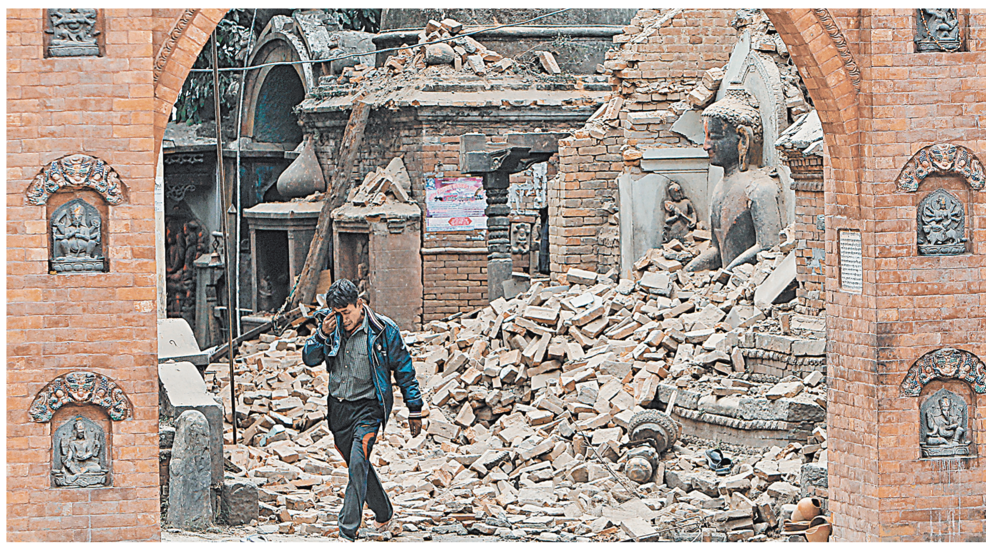
Стихия не только убила людей, но и разрушила памятники ЮНЕСКО, а сошедшая лавина накрыла лагерь на Эвересте.