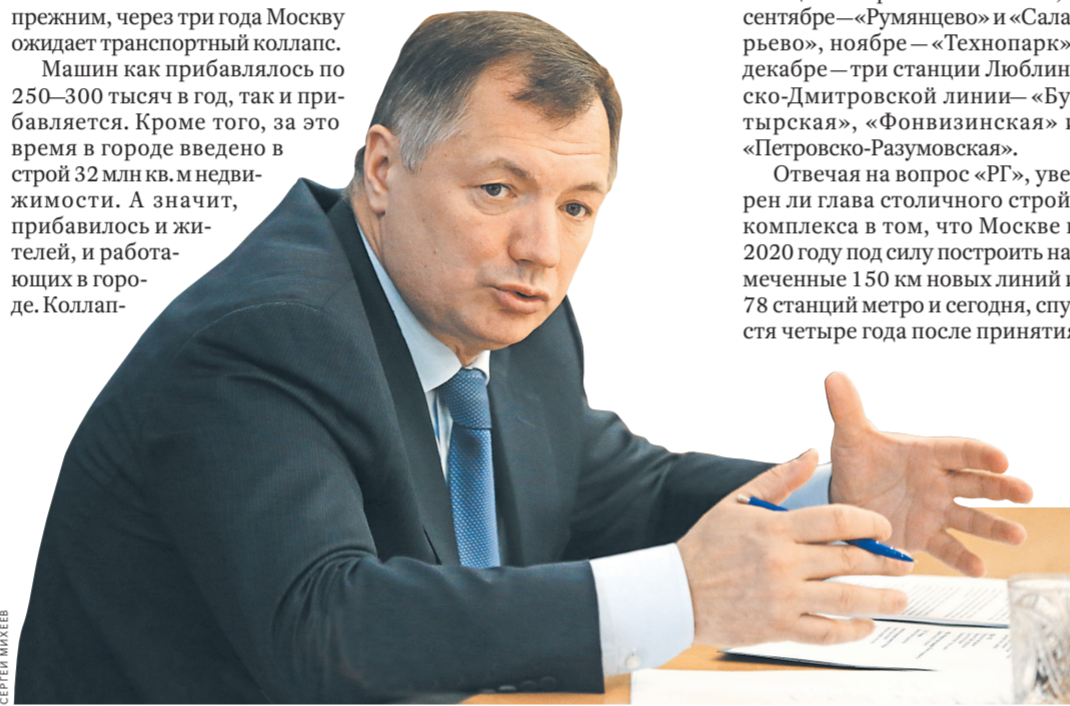
Марат Хуснуллин: Несмотря на сложную экономическую ситуацию, дорожное строительство не сокращается.

Реальное улучшение на московских дорогах не заметить невозможно