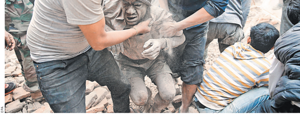
Жители Непала достают раненых из-под многочисленных завалов.

На узких улицах старого города в Катманду техника пройти не может, и спасателям приходится топорами и бензопилами расчищать путь среди завалов.