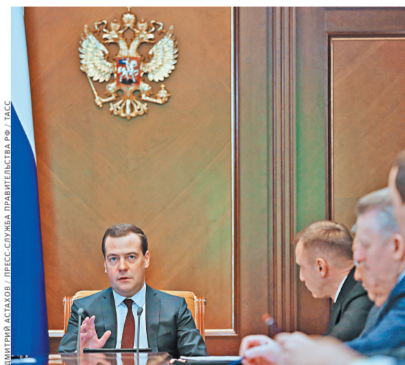
Дмитрий Медведев уверен: ЕГЭ сделал систему поступления в вузы более открытой.

Есть нововведения и по иностранным языкам. «На таких экзаменах будут проверяться не только навыки письма, но и умение излагать мысли на иностранном языке в разговорной форме», — заявил Медведев. — И, наверное, это правильно, потому что человек должен не только читать и писать на иностранном языке, но и говорить. То есть будет возвращена устная часть этого экзамена».