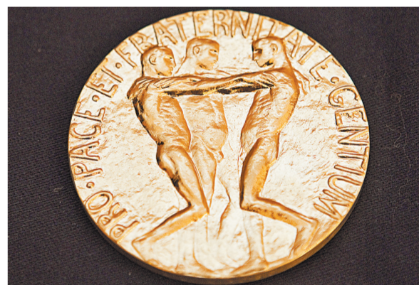
Нобелевскую медаль мира дают «за мир и братство». Некоторые депутаты бундестага поспешили заявить, что Ангела Меркель может претендовать на эту награду.