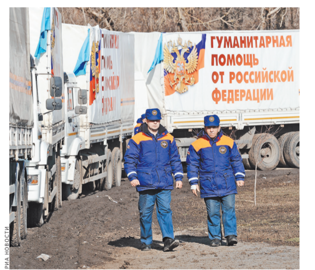
В Ростовской области гуманитарный конвой досмотрели российские и украинские таможенники и пограничники.