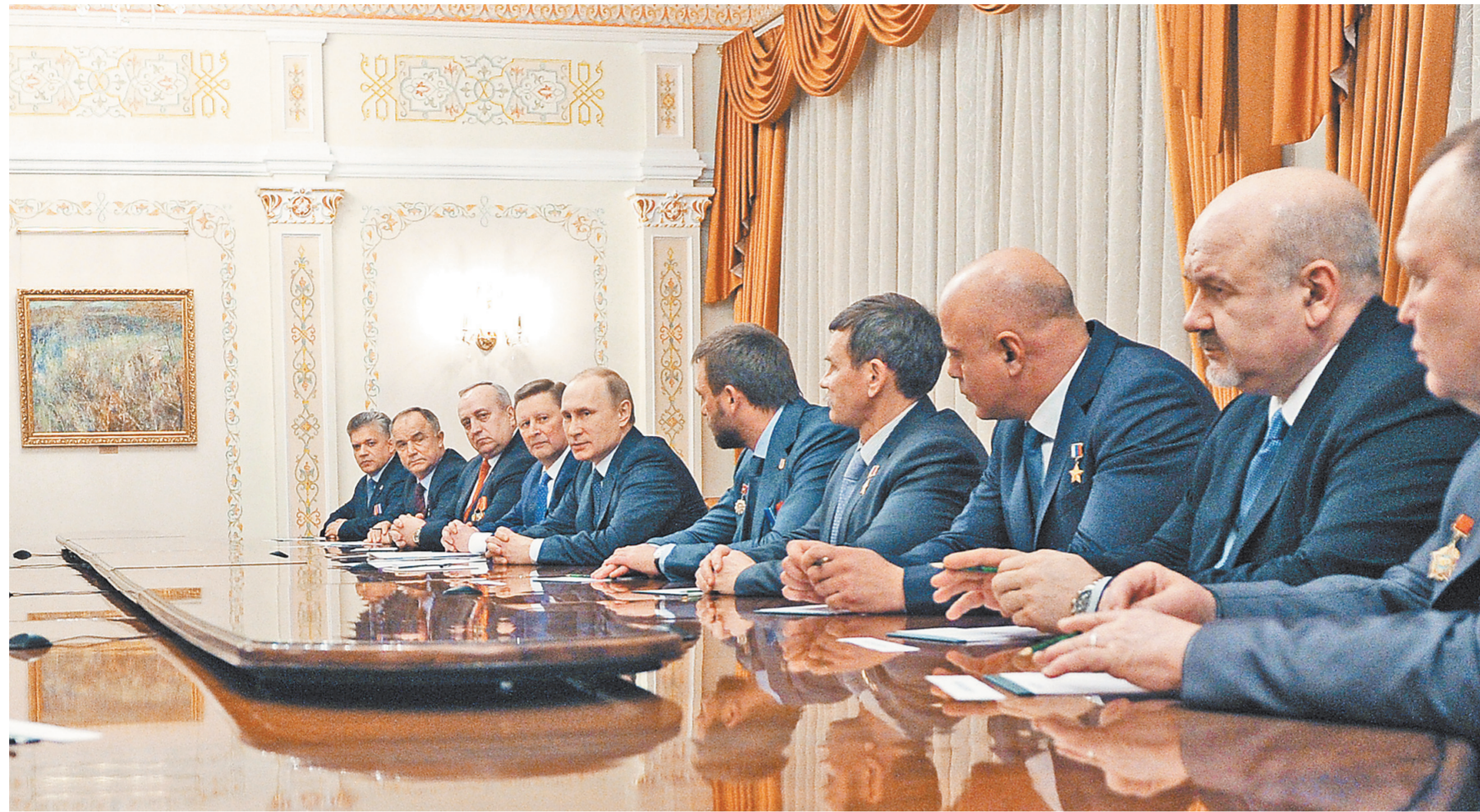
Глава государства призвал помнить о людях, которые защищали интересы Родины в новейшей истории.

Видео смотрите на сайте www.rg.ru/art/1084081