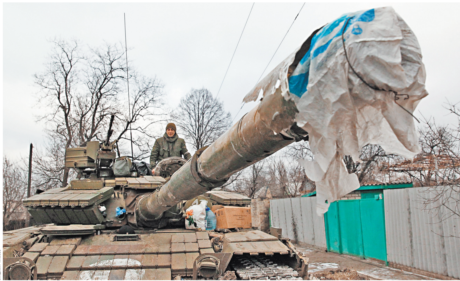
Минское соглашение предусматривает отвод от линии фронта тяжелой техники. Но пока стороны только готовятся к этому шагу.

А где еще он мог быть в эту воскресную ночь, если не возле огнища дебаляевского котла? Оттуда его репортаж для «Российской газеты».