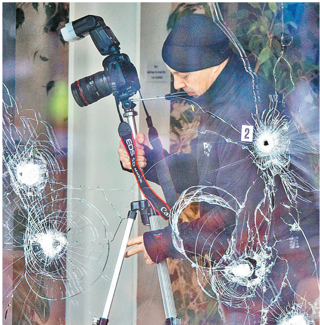
Выстрелы, раздавшиеся в кафе и у синагоги в столице Дании, эхом отозвались в Израэле.