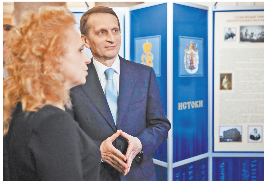
Сергей Нарышкин считает важной роль меценатов в деле возвращения культурных ценностей.

В течение полутора месяцев коллекция Юсуповых будет открыта для публики в музее Фаберже в Петербурге. Потом она пополнит фонды Госархива. Все выкупленные предметы были привезены в страну без всяких пошлин и бюрократических препон, возвращение экспонатов встретило поддержку как среди научной общественности, так и государственной структуры.