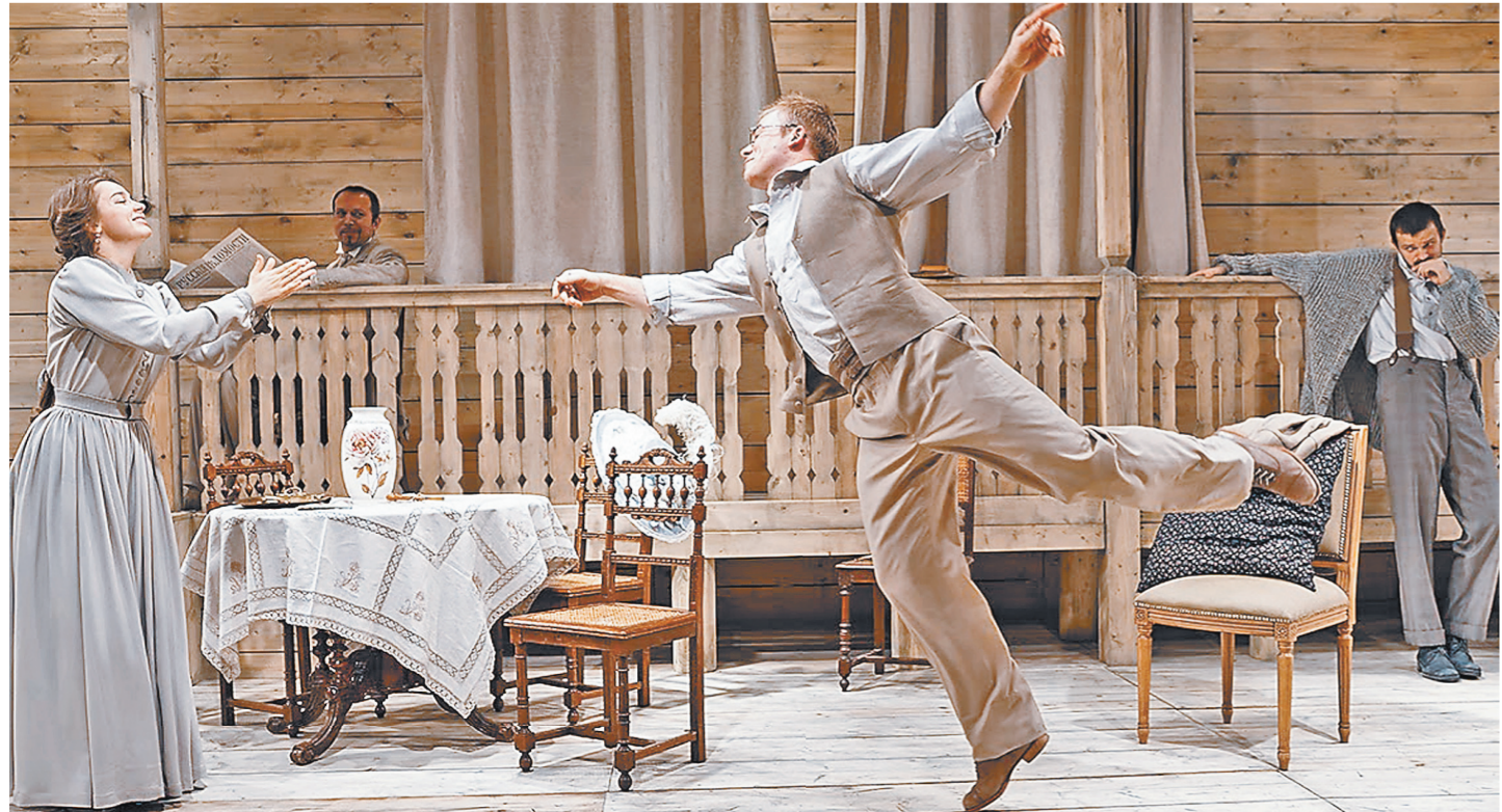
Актеры хотят показать усадебный русский рай, но автор пьесы имеет о нем отдаленное представление.

ТИМУР КИБИРОВ: Идеально вел себя мой папа. У него, как у всех хороших деревенских людей того поколения, было безусловное почтение к культуре. Читать мне разрешил все, что угодно. И вообще чем раньше дети начнут читать, тем лучше. Тогда книги смогут оставаться в их памяти как наслаждение. Иногда даже, может быть, чуть запретное.