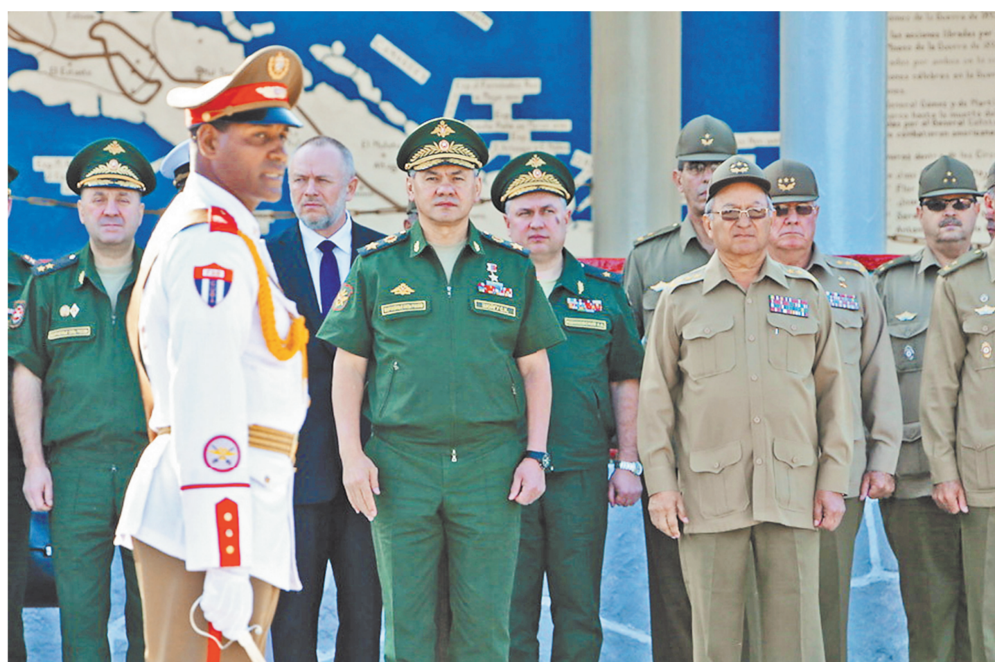
Сергей Шойгу (на фото — в центре) провел важные переговоры в странах Латинской Америки.