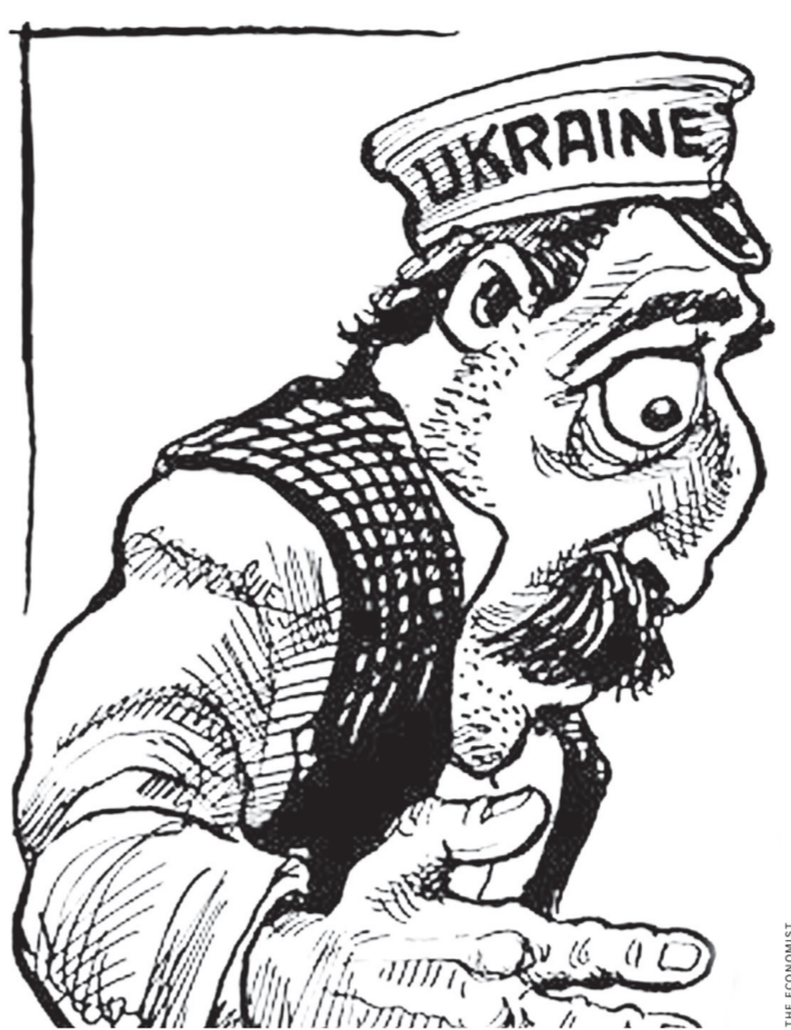
Где Украина и где Грузия? Какое это имеет значение для сенаторов и президента Обамы! Как и для журналистов The Economist не имеет значения, кто президент Украины — Порошенко или Лукашенко. Главное — насолить России.