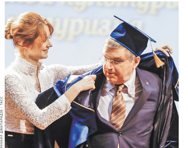
Томас Бах стал почетным профессором Российского государственного университета физической культуры и спорта.