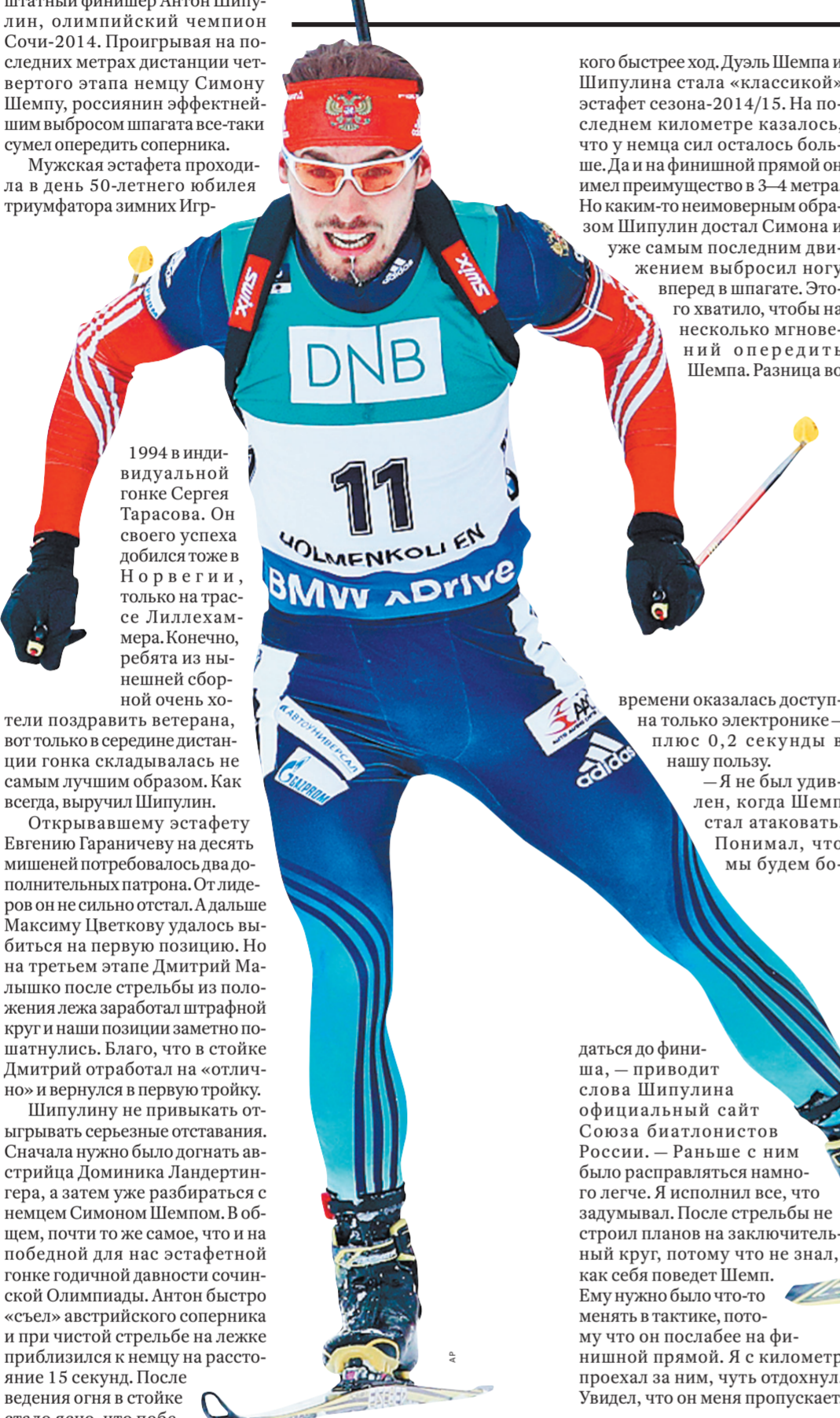
Антон Шипулин снова показал свои уникальные способности безудержного финишера.

На последнем этапе эстафеты в Холменколлене Антон Шипулин сумел отыграть 38 секунд отставания от лидера