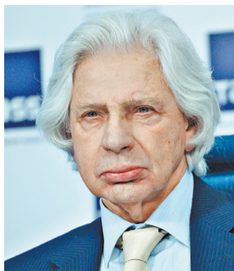
Генри Резник пользуется большим авторитетом не только у адвокатов.

ИЗВЕСТНЫЙ адвокат Генри Резник покинул пост президента Адвокатской палаты Москвы, который он занимал более десяти лет.