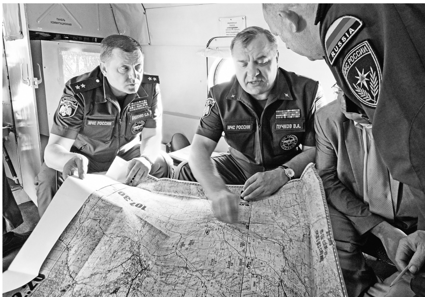
Глава МЧС Владимир Пучков за двое суток на вертолете облетел все пожары по обе стороны Байкала.