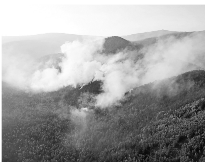
Эту картину некоторые местные чиновники увидели только по телевизору. Они были на отдыхе.

Фоторепортаж смотрите на сайте www.rg.ru/art/1153253