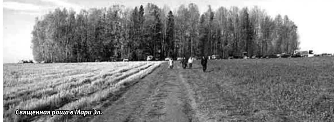
Священная роща в Мари Эл.

ещё как-то? Или это деление чисто условное, не строительное?