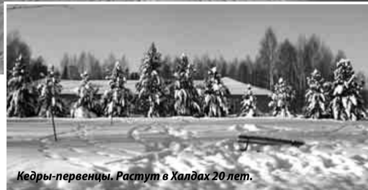
Кедры-первенцы. Растут в Халдах 20 лет.

Каждый день жители наших Халдов ходят к ней на экскурсии. Мужики «репу» чешут, а женщины охают да ахают и выспрашивают обо всём. Вот оно свершилось, думаю, — скоро, очень скоро, наши