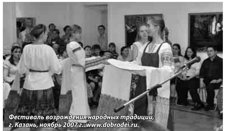
Фестиваль возрождения народных традиций, г. Казань, ноябрь 2007 г. www.dobrodei.ru