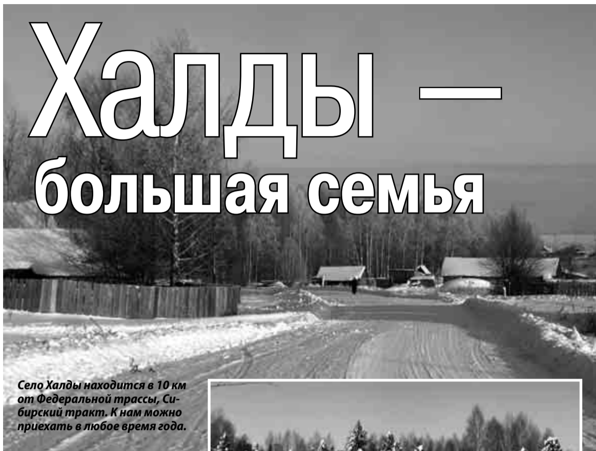
Село Халды находится в 10 км от Федеральной трассы, Сибирский тракт. К нам можно приехать в любое время года.

Какую радость испытываем мы в походах в заброшенные деревни! И как радуется живое нам, людям, — деревья и кусты, родники, камни. Конечно, есть и Боль в таких