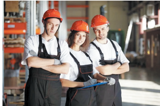
График работы 5/2, 9.00-18.00 Оформление по ТК РФ, своевременная выплата зарплаты.