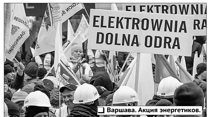
Варшава. Акция энергетиков.

жалуются на проблемы в социальной сфере. Например, 57% сообщили, что не посещают мероприятия по билетам, а 33% могут позволить себе подобную «роскошь» лишь раз в несколько месяцев. Кроме того, 40% опрошенных не ездят отдыхать в течение последних трёх лет, а 70% делают это куда реже, чем раньше. По словам пенсионеров, виной всему финансовые сложности, вследствие которых приходится ограничивать себя во всём, в том числе в возможности путешествовать. Несмотря на то, что 2025-му не исполнилось ещё и трёх недель, некоторые значимые протесты уже празднуют выдающиеся достижения. В их числе одержавшие заслуженную победу лыжные патрульные Парк-Сити — крупнейшего горного курорта США в штате Юта, бастовавшие с 27 декабря. Добившись удовлетворения своих претензий, в середине января участники беспрецедентной стачки вернулись к исполнению обязанностей на просявленных заснеженных склонах так называемой Горы сокровищ, в 2002-м принимавших соревнования по сноубордингу и слалому в ходе XIX зимней Олимпиады в Солт-Лейк-Сити. Согласно заявлению Ассоциации профессионального лыжного патруля Парк-Сити