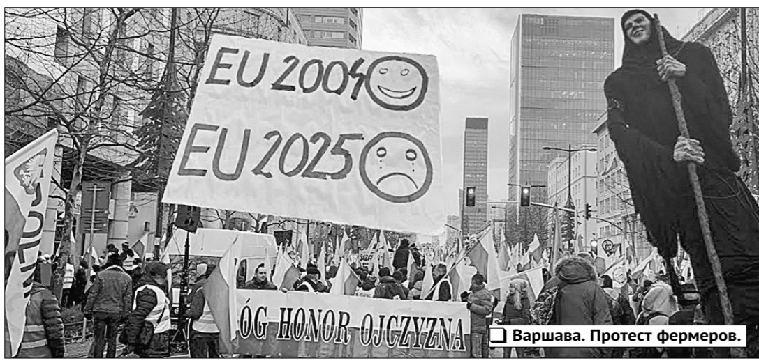
Варшава. Протест фермеров.

Обострение противоречий между ведущими мировыми державами, экономическая война, объявленная Западом России и Китаю, резко активизировали мировое протестное движение: по всей планете постоянно проходят демонстрации, спровоцированные антисоциальной политикой правительств, ущемлением прав и свобод граждан, коррупцией в высших эшелонах власти и нежеланием руководства стран радевать о благе своего населения.