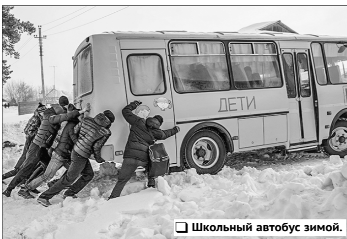
Школьный автобус зимой.

Пресловутая варварская оптимизация системы сельского образования, которая была проведена во всех регионах страны, не только нанесла серьёзный ущерб, но и породила множество проблем для деревенских жителей.