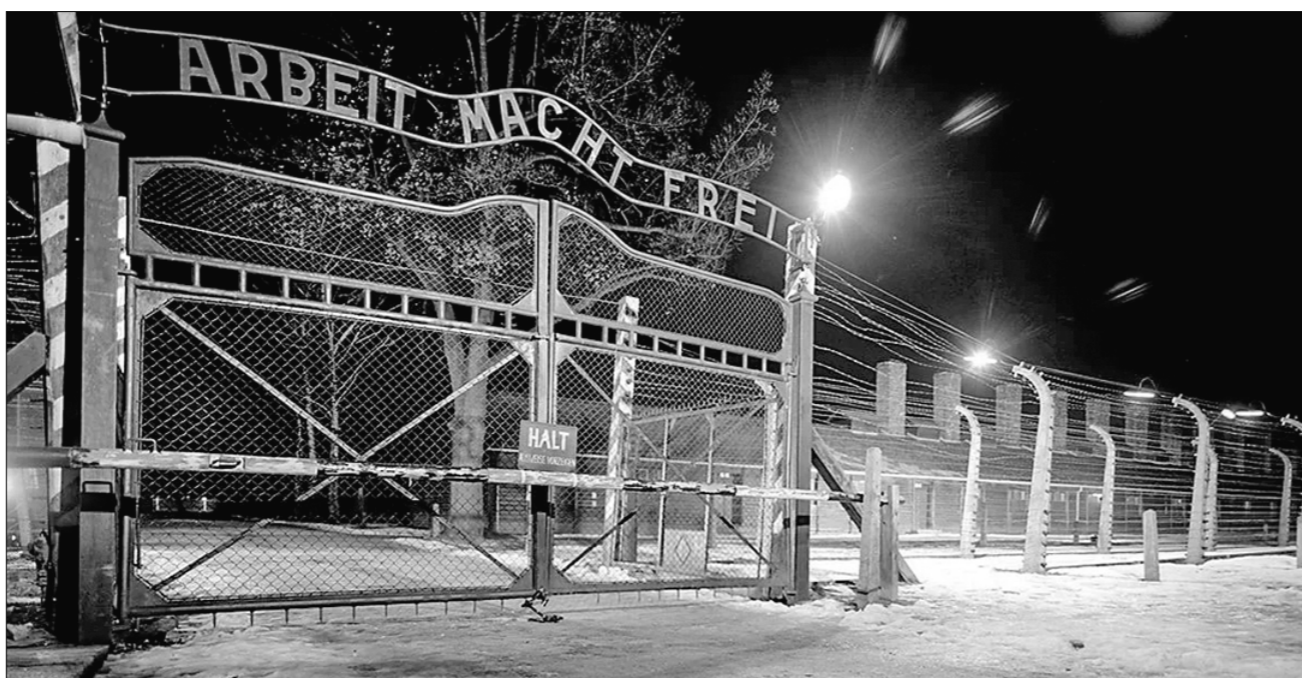
Концлагерь в Дахау. Издательская надпись на воротах: «Труд делает свободным».

По горизонтали: 1. Рубильник. 3. Ворс. 4. «Медве» 6. Холл. 8. Спартак. 12. Веретено. 14. Синотип. 16. Бот. 18. Мериме. 19. Фураж. 20. Цензура. 21. Мир. 22. Канистра. 25. Петрушка. 27. Иллюстрация. 28. Граб. 30. Акула. 31. Коза. 32. Бадминтон. По вертикали: 1. Рис. 2. Кох. 3. Вебер. 4. Марго. 5. Оникс. 7. Лимит. 9. Пьедестал. 10. Авторитет. 11. Донцистка. 13. Елена. 15. «Игрок». 16. Бум. 17. Тар. 23. Налог. 24. Анюта. 25. «Прага». 26. Рында. 29. Боб. 31. Кан.