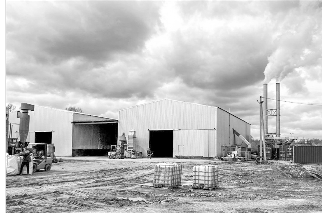
«Собранные в результате осмотра данные сотрудники СК России передадут экспертам для проведения экологической экспертизы. По уголовному делу продолжаются следственные действия, направленные на сбор доказательств», — говорится в со-

И в этом случае глава Следственного комитета РФ Александр Бастрыкин обратил внимание на жалобы граждан и взял дело под свой контроль. Он поручил провести проверку по факту нарушения природоохранного за-