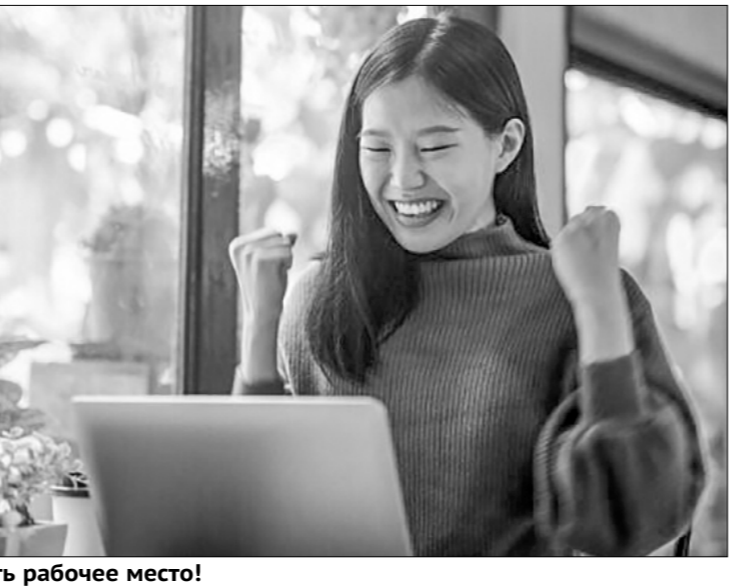
Есть рабочее место!

отношении рабочих мест. Кроме того, министерство призвало активизировать усилия по оказанию помощи в поиске работы студентам с ограниченными возможностями и из семей, испытывающих финансовые трудности, отметив, что необходимо отслеживать каждого такого студента, а планы предоставляемой помощи должны соответствовать конкретным обстоятельствам. По данным китайских властей, число выпускников вузов в стране в этом году достигнет 11,79 миллиона.