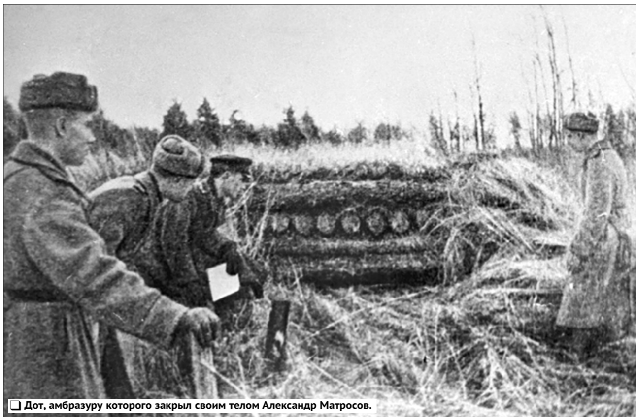
Дот, амбразуру которого закрыл своим телом Александр Матросов.

Александр Матросов и его боевые друзья проходили по местам недавно отгремевших боёв. Страшная картина откры-