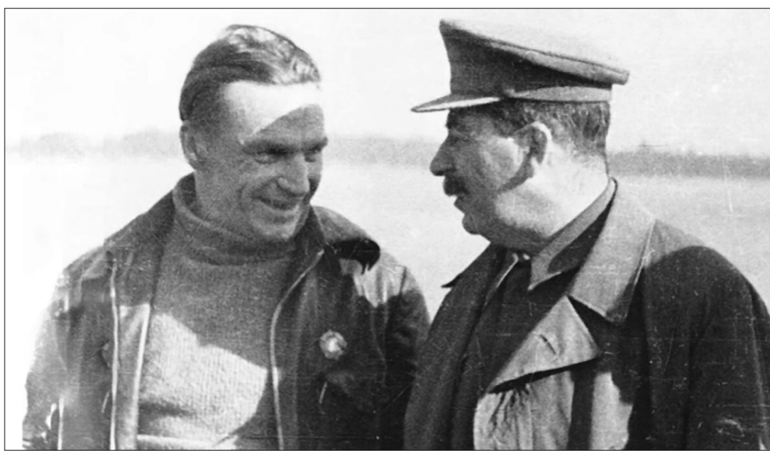
В. Чкалов и И.В. Сталин на аэродроме.