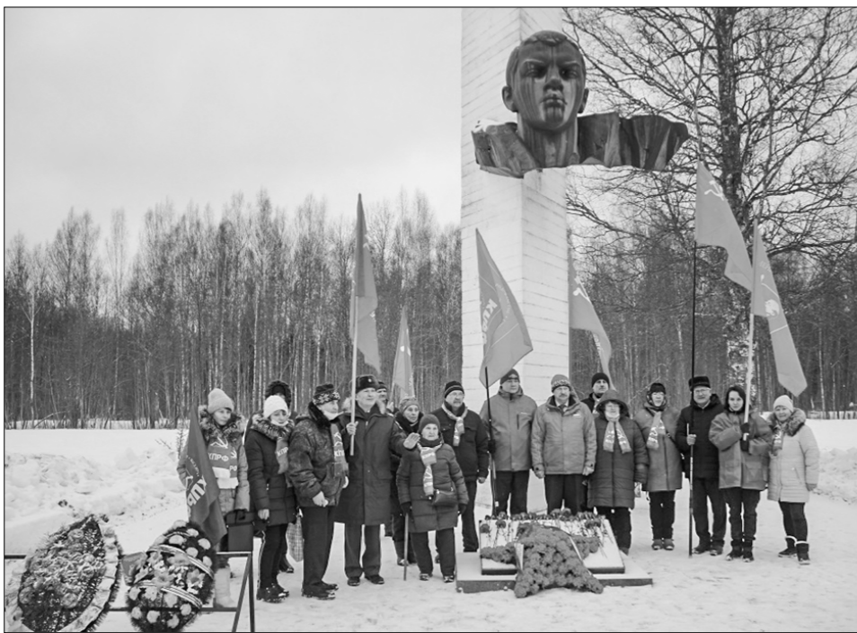
Делегация Псковского обкома КПРФ у мемориала Герою Советского Союза гвардии рядовому Александру Матросову в деревне Чернушка Локнянского округа Псковской области.

— Местные жители помнят о подвиге юного Героя. Локнянское отделение КПРФ принимает участие в торжественных мероприятиях в честь Александра Матросова.