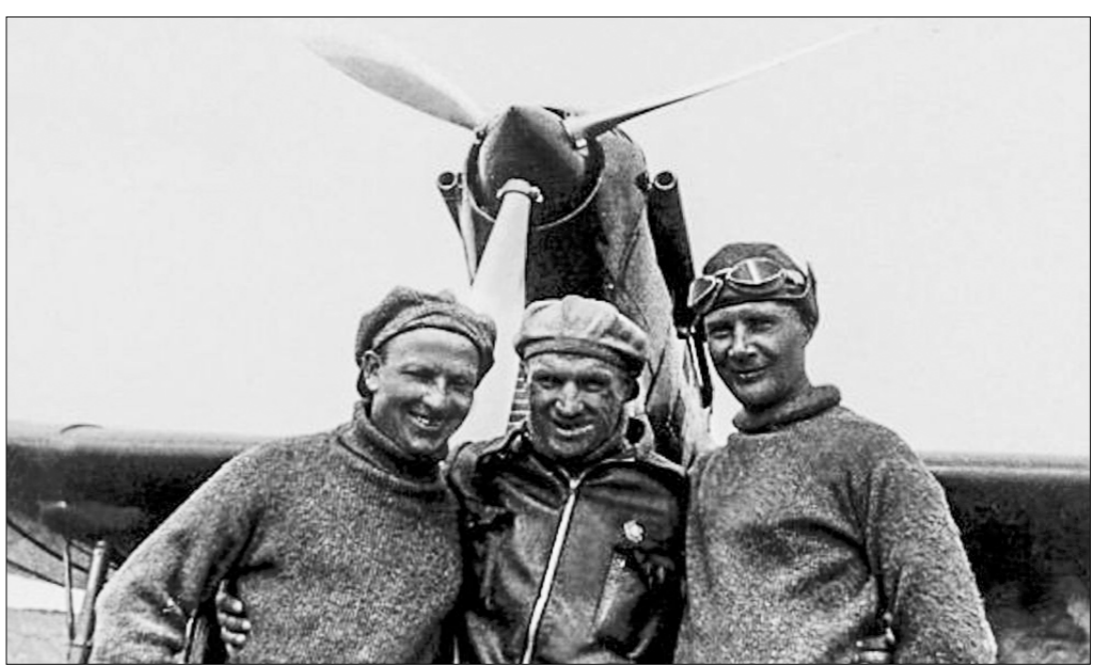
В. Чкалов с членами своего экипажа по перелёту Москва—Северный полюс—Ванкувер Г. Байдуковым и А. Беляковым.

Протяжённость маршрута составила 8504 километра. Все члены экипажа стали знаменитостями в Америке, советским лётчикам были посвящены все первые полосы газет. Среди приветствующих экипаж на американской земле были послы СССР в США А.А. Трояновский и Дж. К. Маршалл, будущий генерал и государственный секретарь США, позднее принявший членов экипажа у себя дома. Приветственную телеграмму советскому экипа-