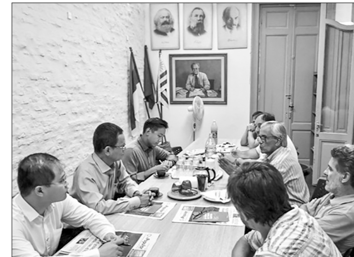
На рабочем совещании Хуана Кастильо и посла CPB в Уругвае Зыонг Куок Тхана.

Тенсек ЦК рассказал и о том, что Компартия Уругвая входит в Широкий фронт, работает с другими партиями Широкого фронта над проведением многих экономических, политических и социальных реформ, направленных на улучшение жизни большинства трудящихся, особенно бедного населения страны.