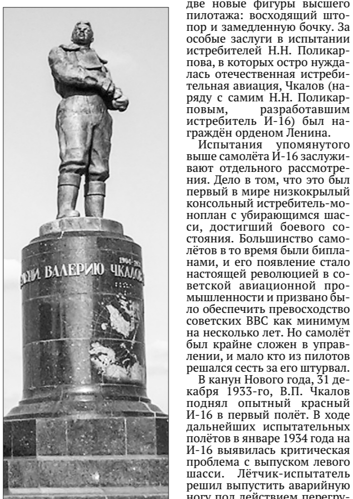
Памятник В. Чкалову в Нижнем Новгороде.

Впрочем, Чкалову удаётся в довольно короткие сроки ре-