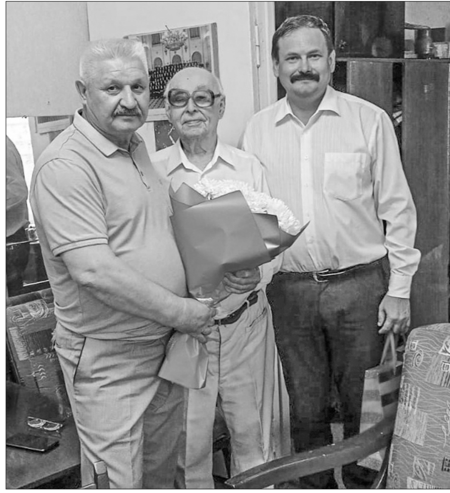
ветераном. Он автор статей в книгах «Судьбы, опалённые войной», «Фронт проходим через тьму», «Поклонимся великим тем годам». Им изданы книги: «Имена героев на карте Кировской области»; «В далёком северном краю...»; «По волнам житейского моря»; «И дым Отечества нам сладок и приятен»; «Русский характер»; «Человечество: этапы развития». Серьёзным вкладом в патриотическое воспитание и увековечение па-