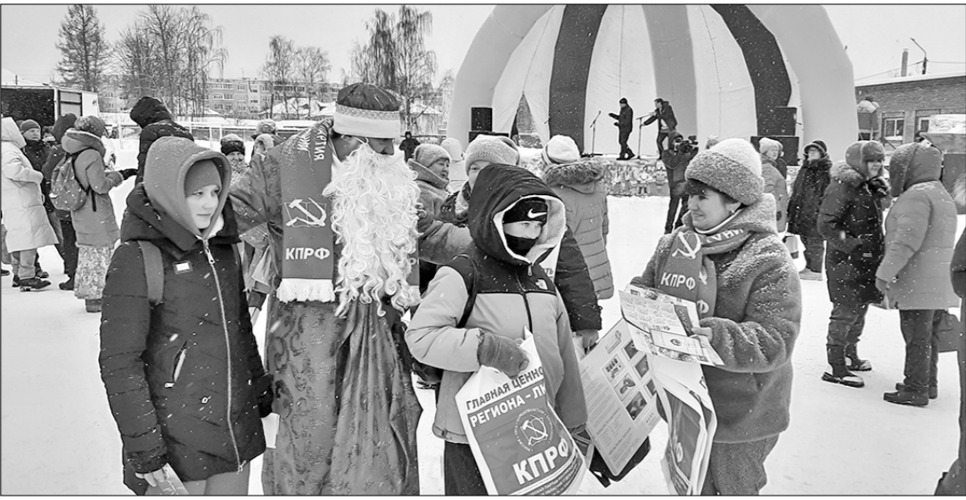
Кинешемский райком КПРОФ.

Кинешемский район славился своим валяльным промыслом, и до сих пор производство сохраняется, хотя и не в прежних масштабах.