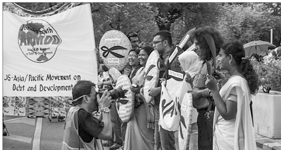
Протесты у штаб-квартиры ЭСКАТО ООН с требованием сокращения выброса парниковых газов Бангкок (Таиланд).

Налоги на богатство должны включать резко прогрессивные налоги на наследство самых крупных состояний, чтобы сдерживать появление новой аристократии, а также прогрессивные налоги на собственное, включая землю. Oxfam считает, что в качестве отправной точки мир должен