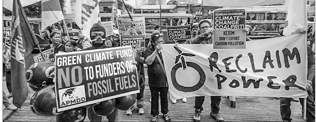
Экспортно-импортный банк Кореи больше не поддерживает климатическую повестку.

гов на богатство для пополнения бюджета. Подобные же меры обсуждаются в Канаде, Китае, Нидерландах и Малайзии.