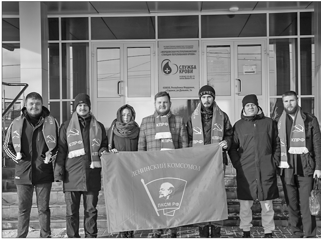
Пресс-служба Мордовского республиканского отделения ЛКСМ РФ.

Комсомольцы Мордовии участвуют не только в политических акциях, но и занимаются другой общественно-полезной работой. В рамках проекта «День донора», приехав из разных уголков Саранска, комсомольцы и коммунисты отправились в республиканскую службу переливания крови.