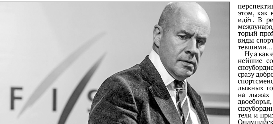
□ Занятость главы FIS легко понять.