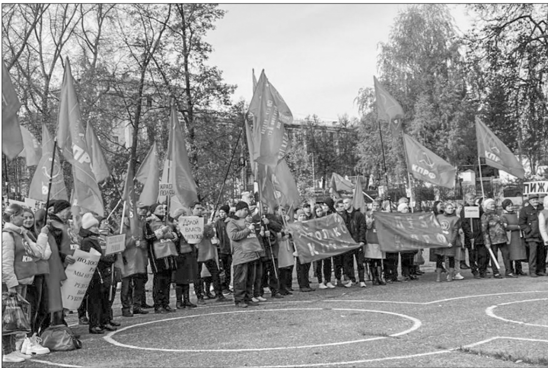
В городе Кирове сотни его жителей и представителей районов области вышли на митинг в рамках Всероссийской акции протеста «За власть народа и политику национальных интересов!».