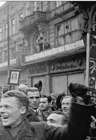
Жители г. Львова на демонстрации в день празднования 22-й годовщины Октябрьской революции 7 ноября 1939 г. Арх. №0-296636.

Деятельным средством полонизации Западной Украины и Западной Белоруссии стала ликвидация образования на родном языке. Если в 1924/25 учебном году по всей Польше было 2558 украинских начальных школ, то в 1937/38 году их осталось 461. Положение с образованием украинского населения Восточной Галиции было удручающим. «Только за первые годы её нахождения в составе Вто-