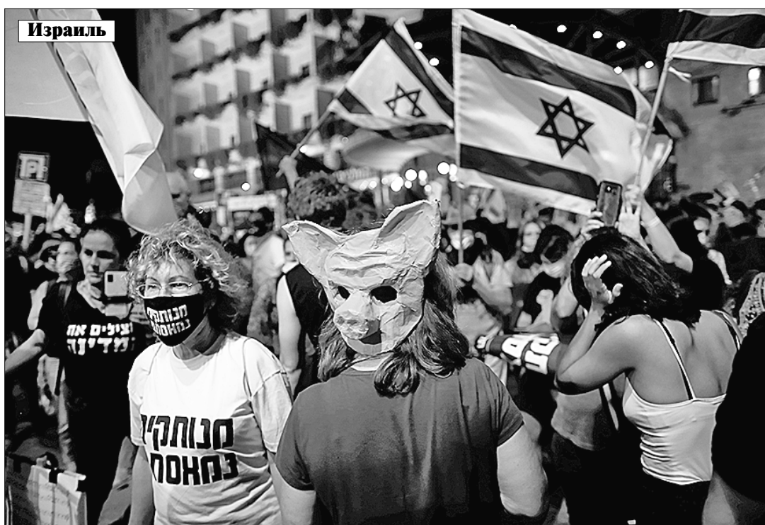
продолжаются масштабные антиправительственные выступления с требованием отставки премьер-министра Биньямина Нетаньяху, обвиняемого в пошлости, коррупции и получении взяток. Очередным поводом для массового возмущения израильтян послужило повторное введение общенационального карантина в связи с увеличением числа заболевших COVID-19.

Объявленный с 18 сентября ограничительный режим продлится три недели, причём с предыдущего прошло всего четыре месяца. Однако, несмотря на жёсткий карантин, запрещающий жителям удаляться от дома на расстояние более километра, тысячи людей собрались в центре Иерусалима возле официальной резиденции главы кабинета, являющегося фигурантом нескольких судебных процессов, и обвинили его в бездействию в борьбе с коронавирусом. Согласно статистике, в еврейском государстве зафиксировано почти 200 тысяч случаев заражения COVID-19 и около 1300 летальных исходов. В стране остановилось автобусное и железнодорожное сообщение, закрыты школы.