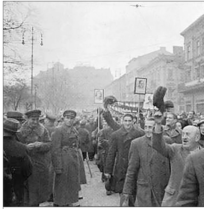
Жители г. Львова на демонстрации в день празднования 22-й годовщины Октябрьской революции 7 ноября 1939 г.

Удивительно, но факт: хотя польские политики изначально рассматривали Белоруссию как свою колонию, чего особо и не