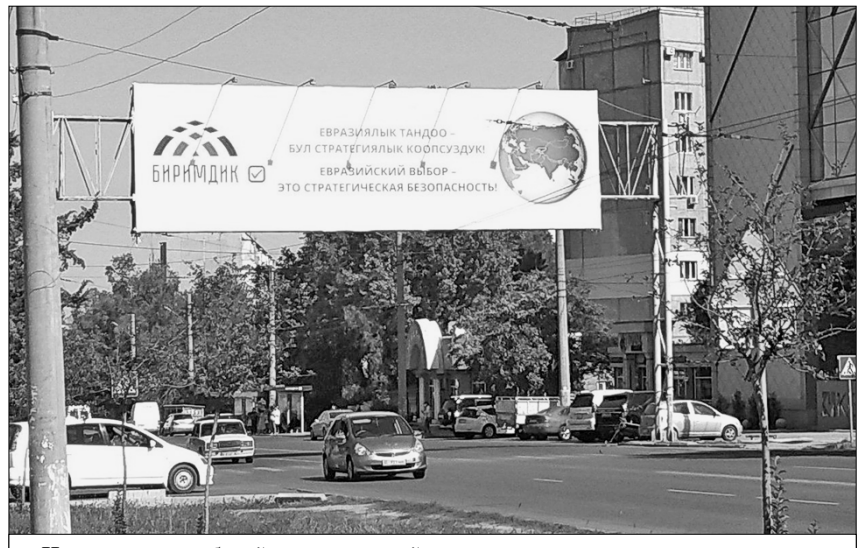
Несмотря на глубокий экономический кризис, партии не скупятся на агитацию.