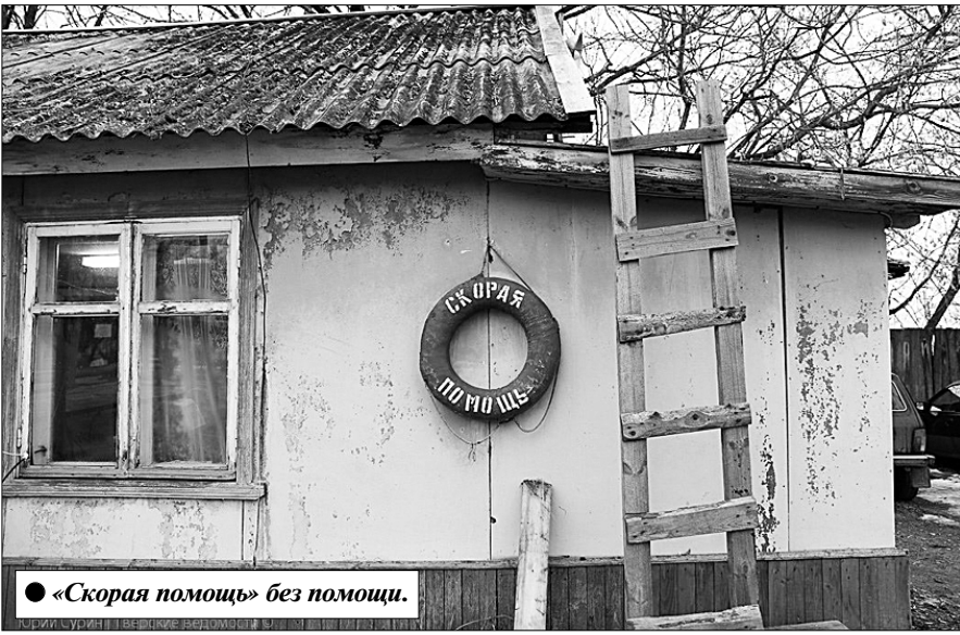
«Скорая помощь» без помощи.

Сергей РЯБОВ, соб. корр. «Правды», Свердловская область.