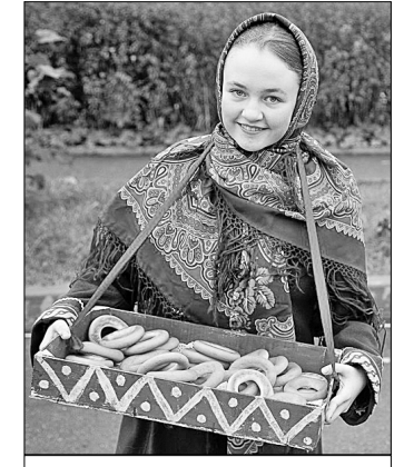
Знаменитые валдайские баранки.

Стоимость бараночных изделий (включая сушки и хлебные палочки) выросла в нашей стране за период с 2014 по 2019 год примерно на 40%: со 104 рублей за килограмм в ноябре 2014 года до 145 рублей в прошлом году.