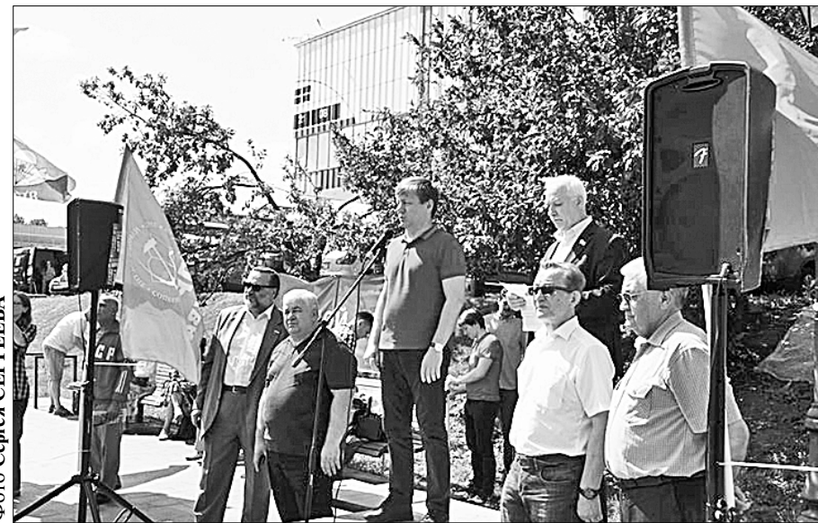
В субботу, 27 июля, в Москве возле телецентра «Останкино» прошла встреча депутатов-коммунистов с избирателями, которым народные избранники рассказали о нарушениях прав граждан на получение объективной информации.