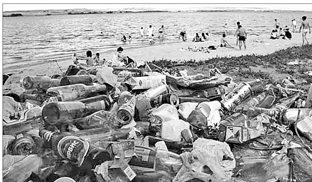
Крупнейший водоём Европы — площадь Волжского бассейна составляет 8% территории России (1 миллион 360 тысяч квадратных километров) — один из самых грязных в стране.

Пожалуй, самое востребованное ведомство в современной России — это МЧС. Не проходит года, месяца, чтобы у нас не случались взрывы газа, порывы теплотрасс, большие и малые коммунальные аварии, вывод из строя изношенных котельных. Все эти ЧП зачастую сопровождаются человеческими жертвами. Нужны срочные меры для наведения порядка в сфере безопасности ЖКХ, и без вмешательства государства регионам не справиться. Детальный разговор о проблеме проходил в встрече в Госдуме РФ в Москве, где побывал и представитель Хакасии.