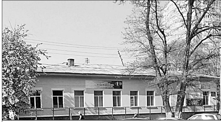
● Днепропетровский Дом учителя — пока ещё существующий...

На Украине днепропетровские педагоги, родители их учеников и общественные активисты борются с городскими властями за сохранение местного Дома учителя. Зная, что вопрос о его закрытии будет рассматриваться на июньской сессии горсовета, они собрали 150 подписей в защиту этого культурно-образовательного центра. Но депутаты горсовета их проигнорировали и большинством голосов приняли решение: детские кружки расформировать, Дом учителя — закрыть!