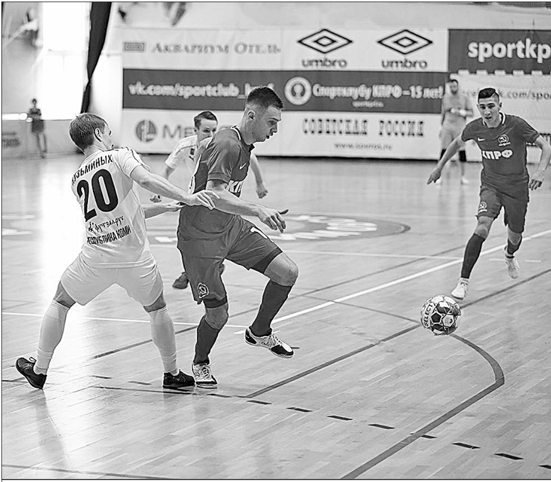
● Фрагмент матча МФК КИРФ — «Ухта».

Ещё две недели назад ситуация в лидирующей группе российской мини-футбольной Суперлиги, которую возглавляла наша команда — МФК КИРФ, была чрезвычайно напряжённой. Сразу три команды «висели на хвосте» у нашего клуба, отставая практически на дистанцию всего одного выигранного преследователя или проигранного нашими ребятами матча. Однако за прошедшие два спаренных тура (четыре матча) ситуация изменилась, и что особенно отрадно — в пользу лидера турнира МФК КИРФ.