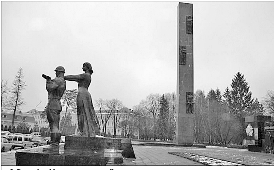
● Таким был Монумент славы во Львове.

В НОЧЬ на воскресенье, 3 марта, во Львове с третьей попытки снесли 30-метровую стелу Монуента славы. Две предыдущие попытки развалить монумент, посвященный победе в Великой Отечественной войне, в том числе и украинского народа, закончились неудачей. Мемориал «Монумент боевой славы Советских Вооружённых Сил» во Львове был открыт в мае 1970 года и состоял из трёх элементов: тридцатиметровой гранитной стелы, бетонной композиции с фигурами воинов и аллегорическими скульптурами советского воина и Родины-матери.