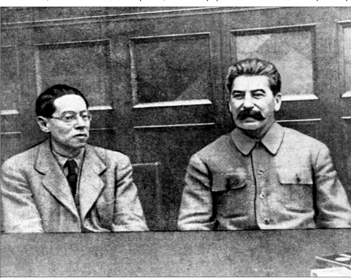
● Сталин и Лион Фейхтвангер.

Нет, не врут, доказывает Фейхтвангер. Их, как и Троцкого, небольшие, склонность к левац-